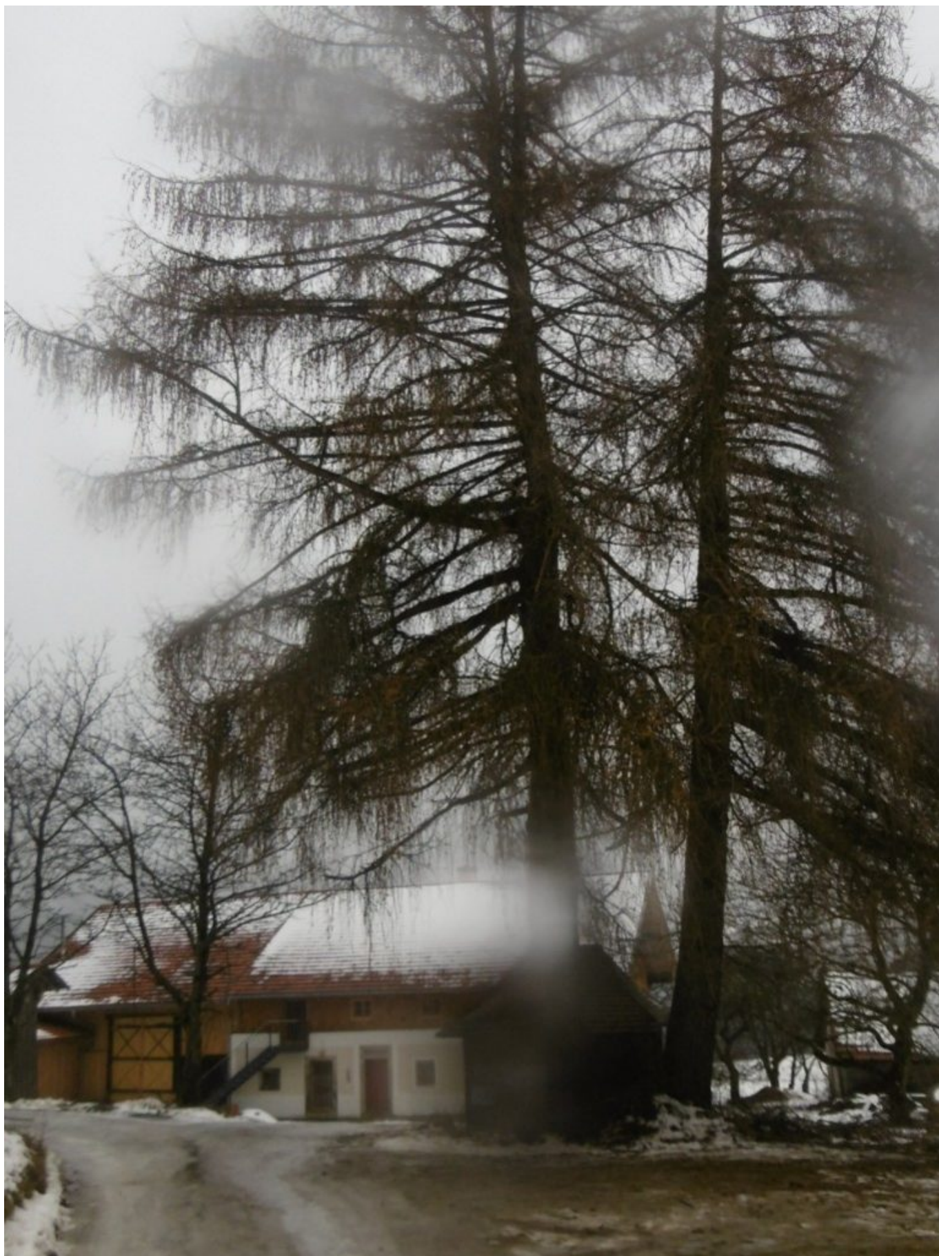
Bernhard-Anwesen und Holzkapelle