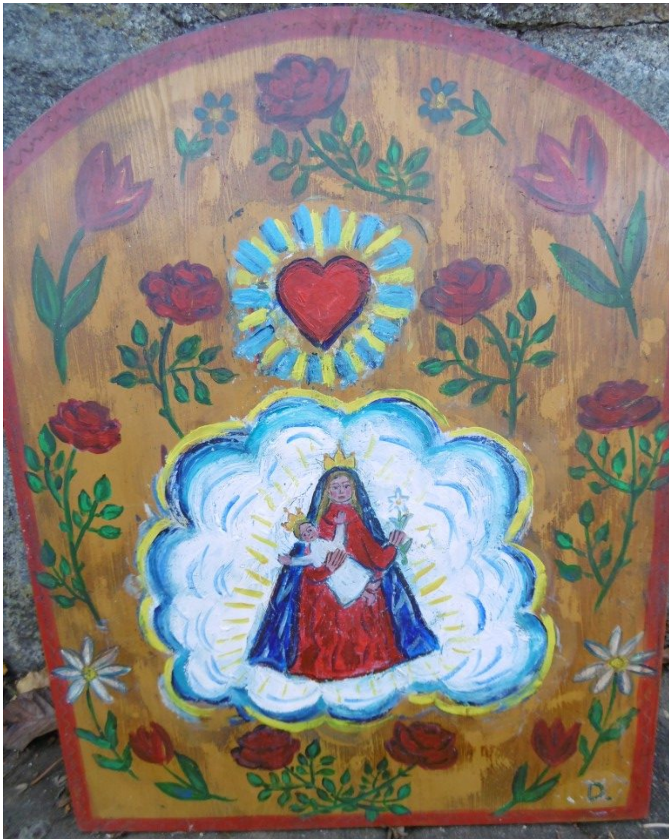
Diese Votivtafel „Die Frömmigkeit der Maria“ hängt derzeit außen an der Kapelle.