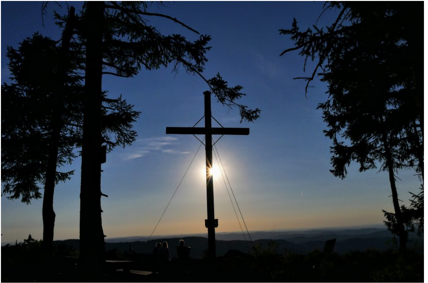
Gipfelkreuz und Licht