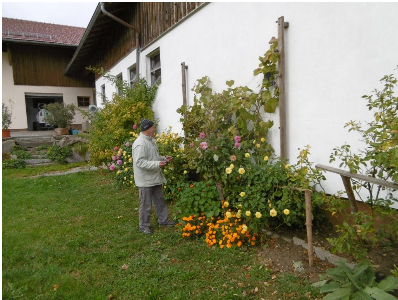
In Stein am Wolfgangsweg stärkt sich Friedel Dreischmeier im Pilgerstil mit Trauben am Weg.