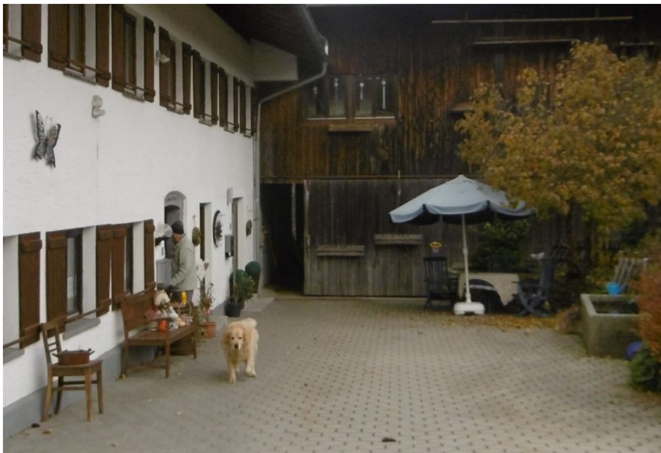
Die Hofhunde waren alle sehr lieb!