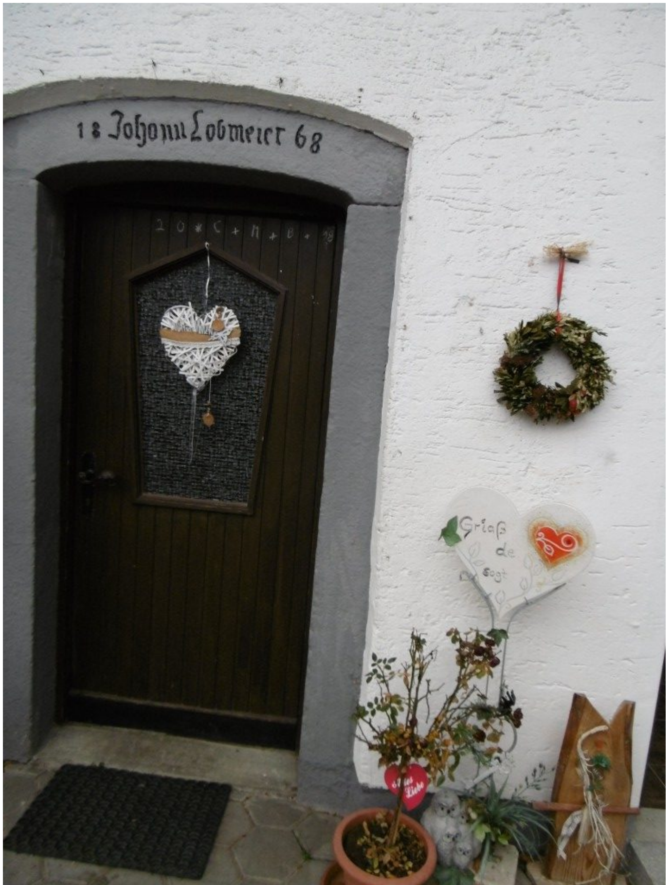
Mit Liebe geschmückt: Hier begegnen sich neu und alt.