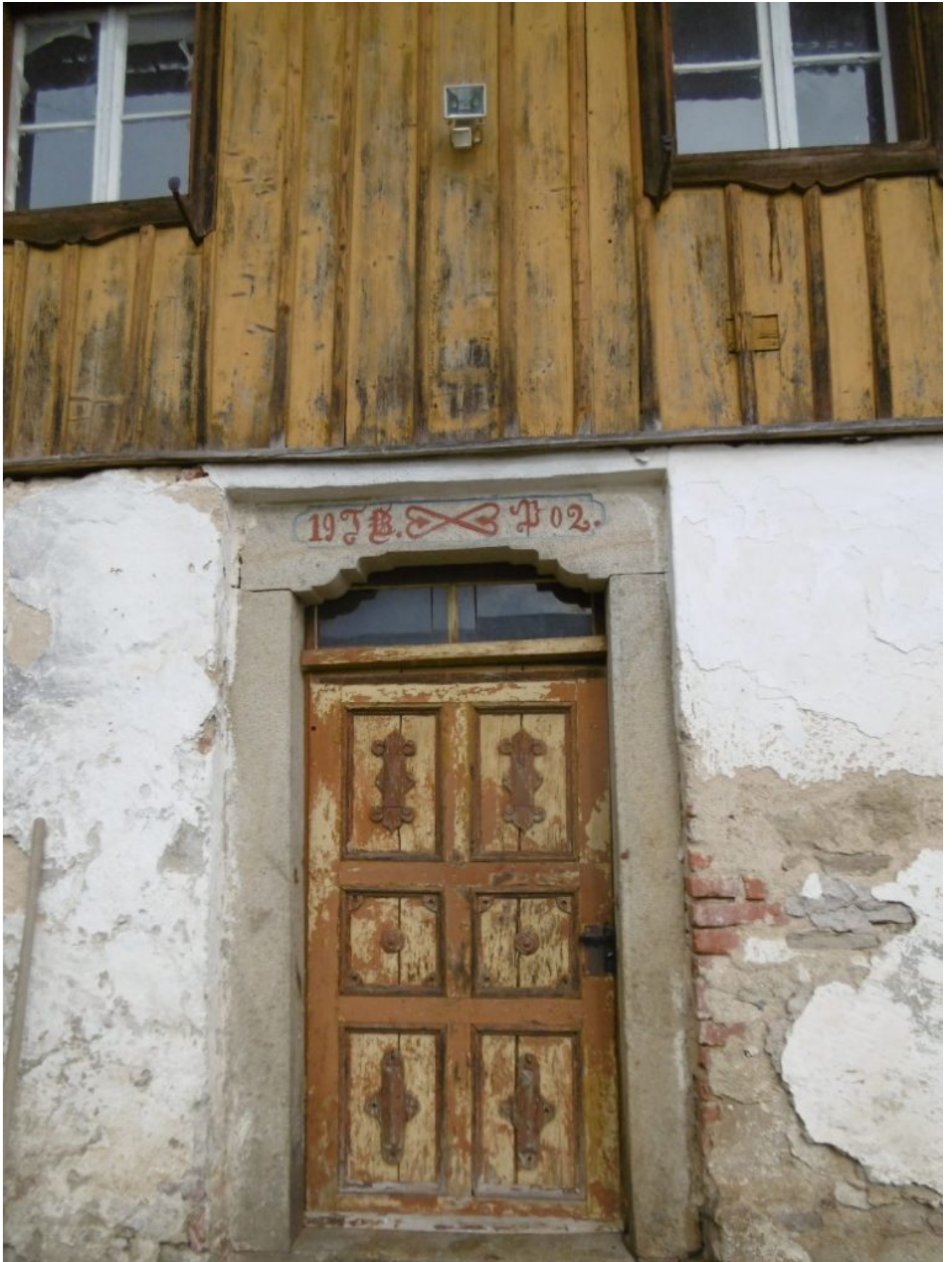
Am Wolfgangsweg liegt vor Ramersdorf der „Penzkofer“. Der Hof, der noch mit der Original Ockerfarbe auf den Holzbalken