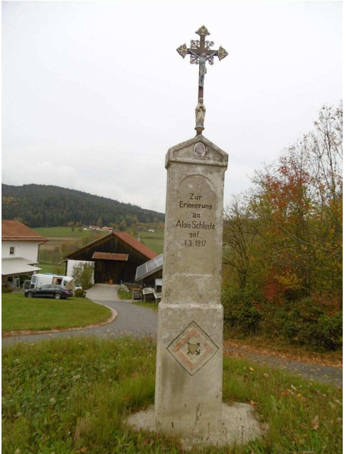
Fast jeder alte Hof hat ein historisches Gedenk-Kreuz.