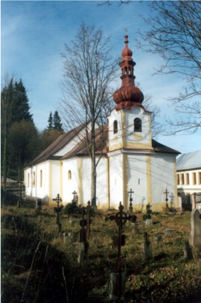
Die Gunther geweihte Kirche in Gutwasser

Sehr geehrte Damen und Herren, liebe Gunther-Verehrer mit dieser Information möchte ich Sie über die diesjährige Feier des St.-Gunther-Festes in Gutwasser (Dobrá Voda) bei Hartmanitz am 10./11. Oktober informieren.