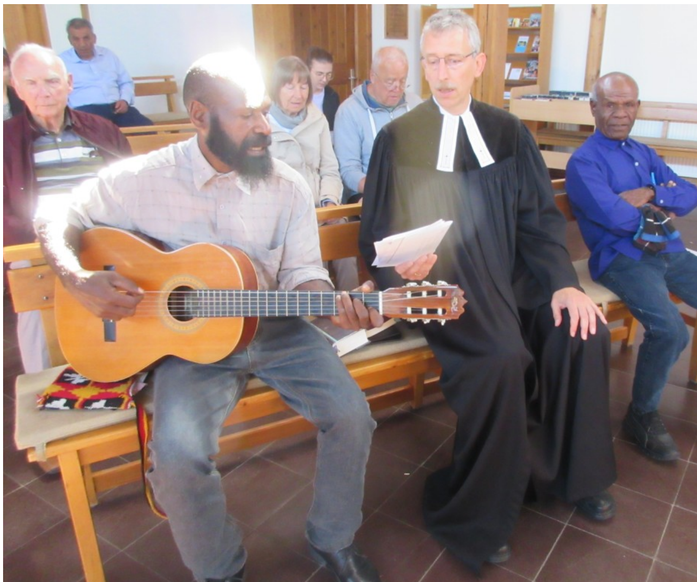
Zwei Lieder in Pidgin-Englisch: „Jesus liebt uns allesamt“ und „Jesus, auf dich schau ich allein“