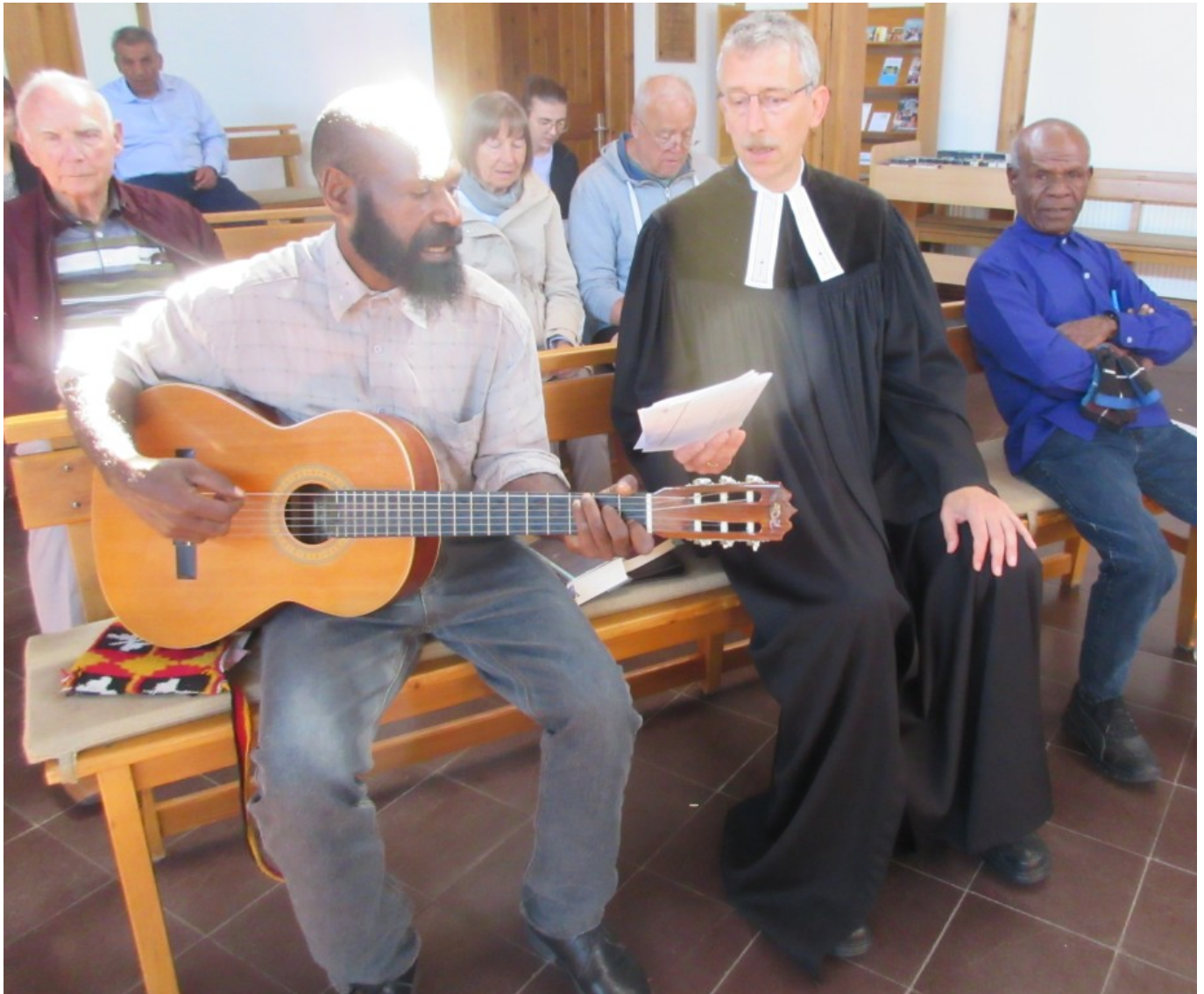
Zwei Lieder in Pidgin-Englisch: "Jesus liebt uns allesamt" und "Jesus, auf dich schau ich allein"