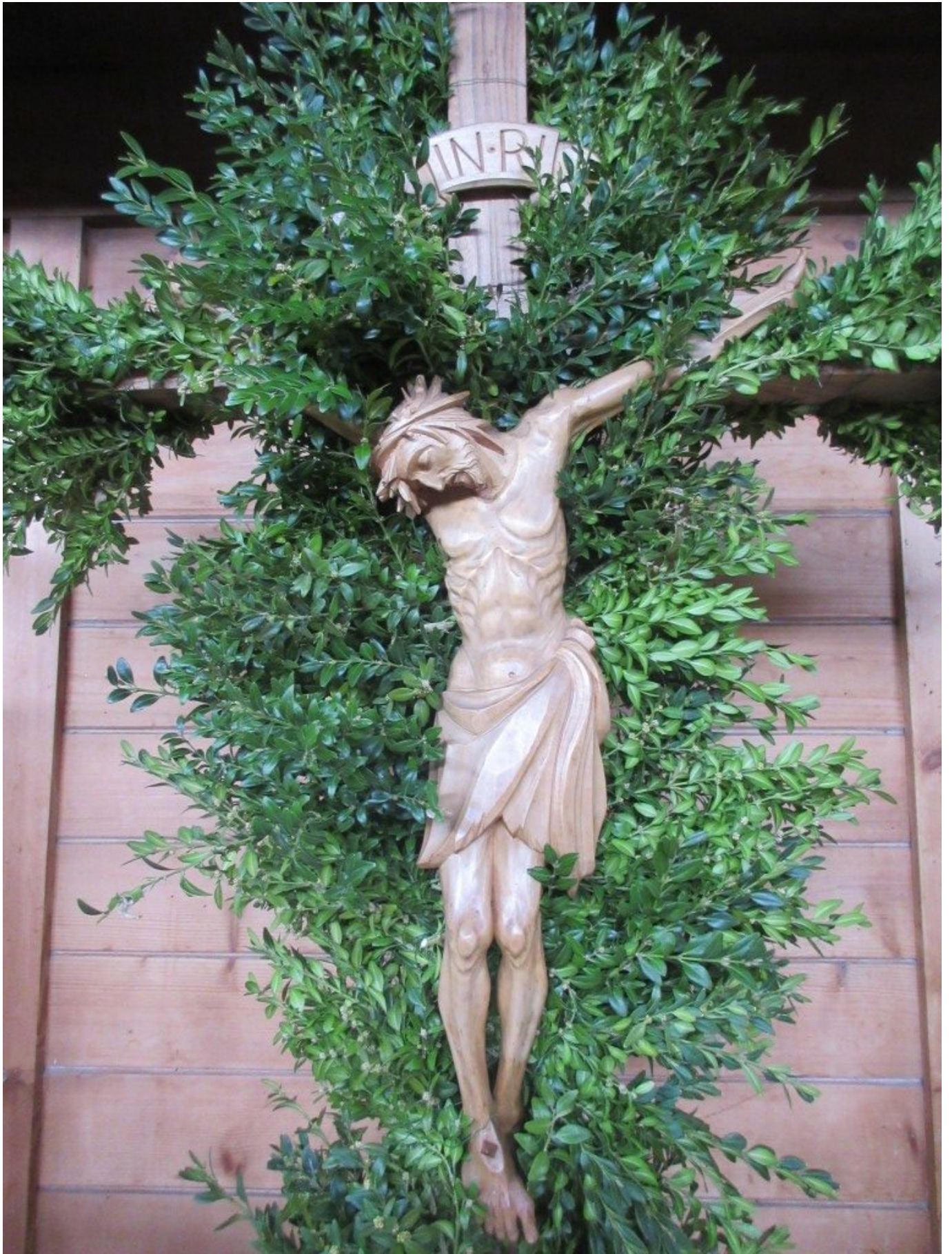
Vom Tod zum Leben