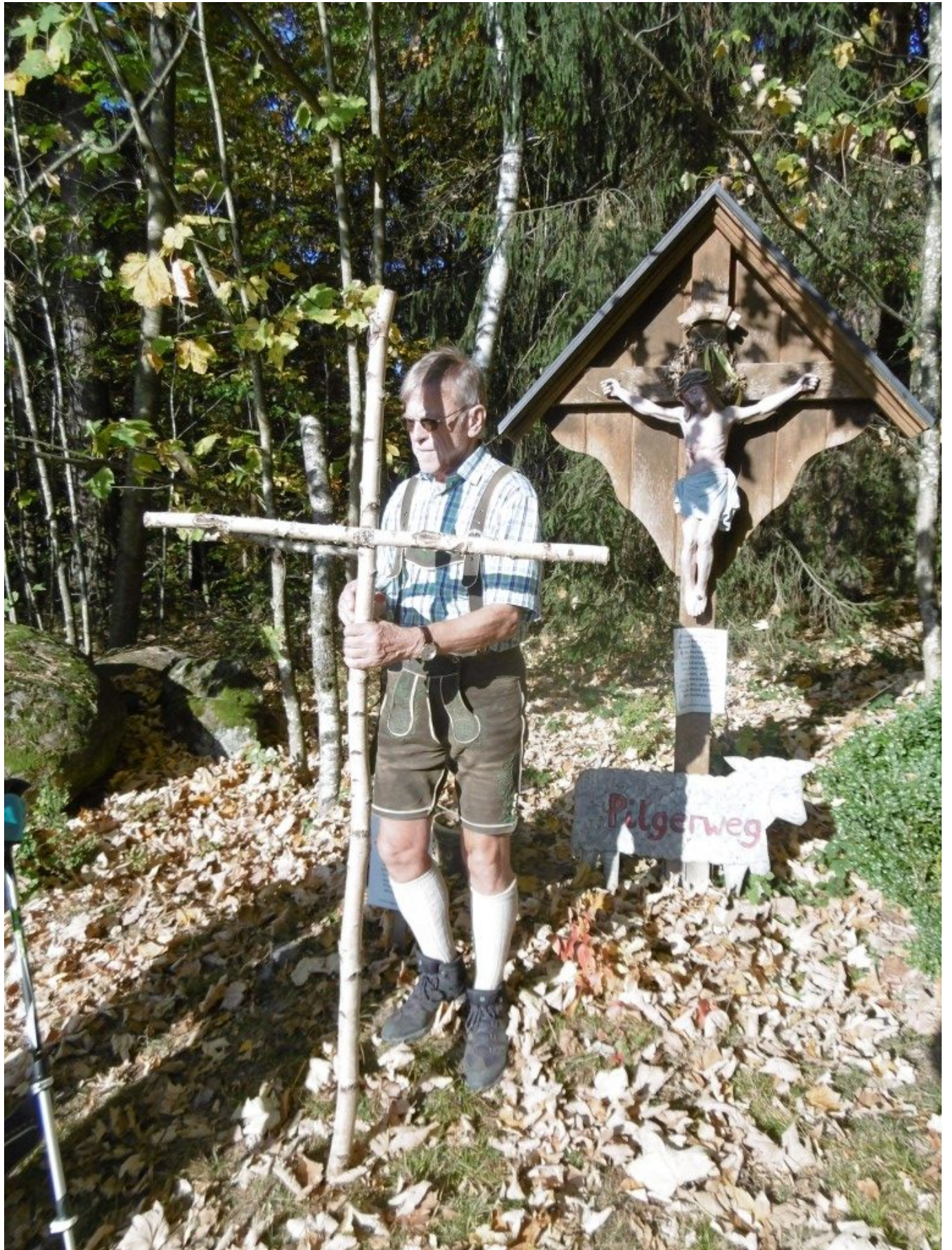
Ein schöner Brauch: Birkenkreuze zur Wolfgangskapelle tragen