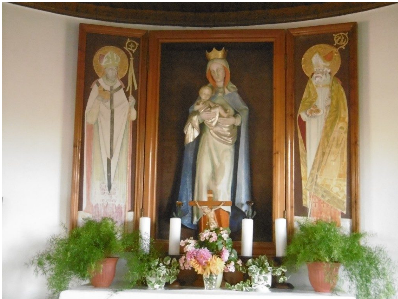
Altar der Frathkapelle: Links der heilige Wolfgang – Mitte Maria und Jesuskind – rechts der heilige Nikolaus