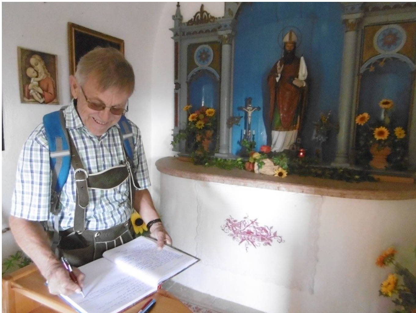
Eintrag ins Kapellenbuch