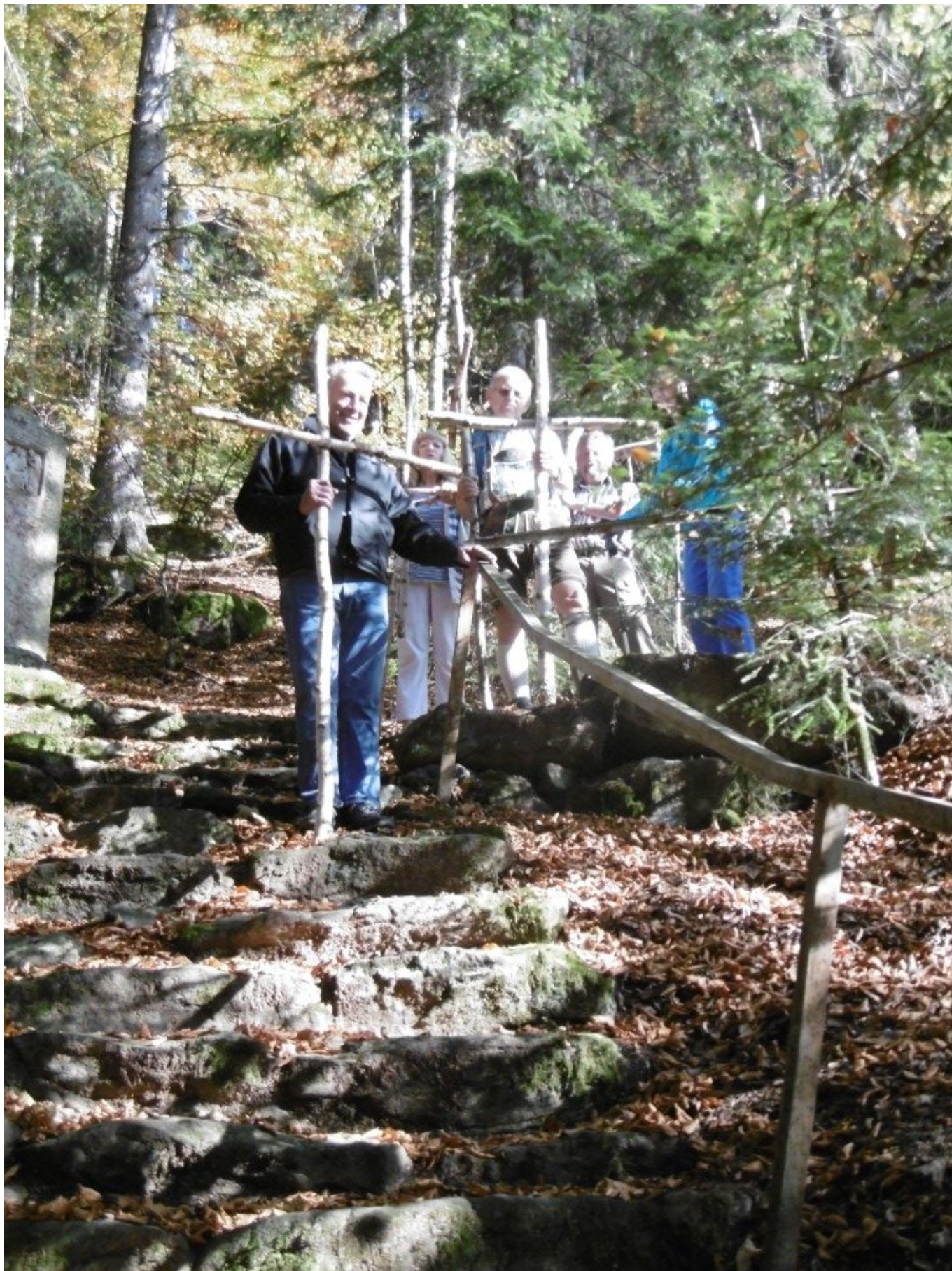
Abstieg zum Höhenweg zur Frath, Kreuze mit nach unten nehmen