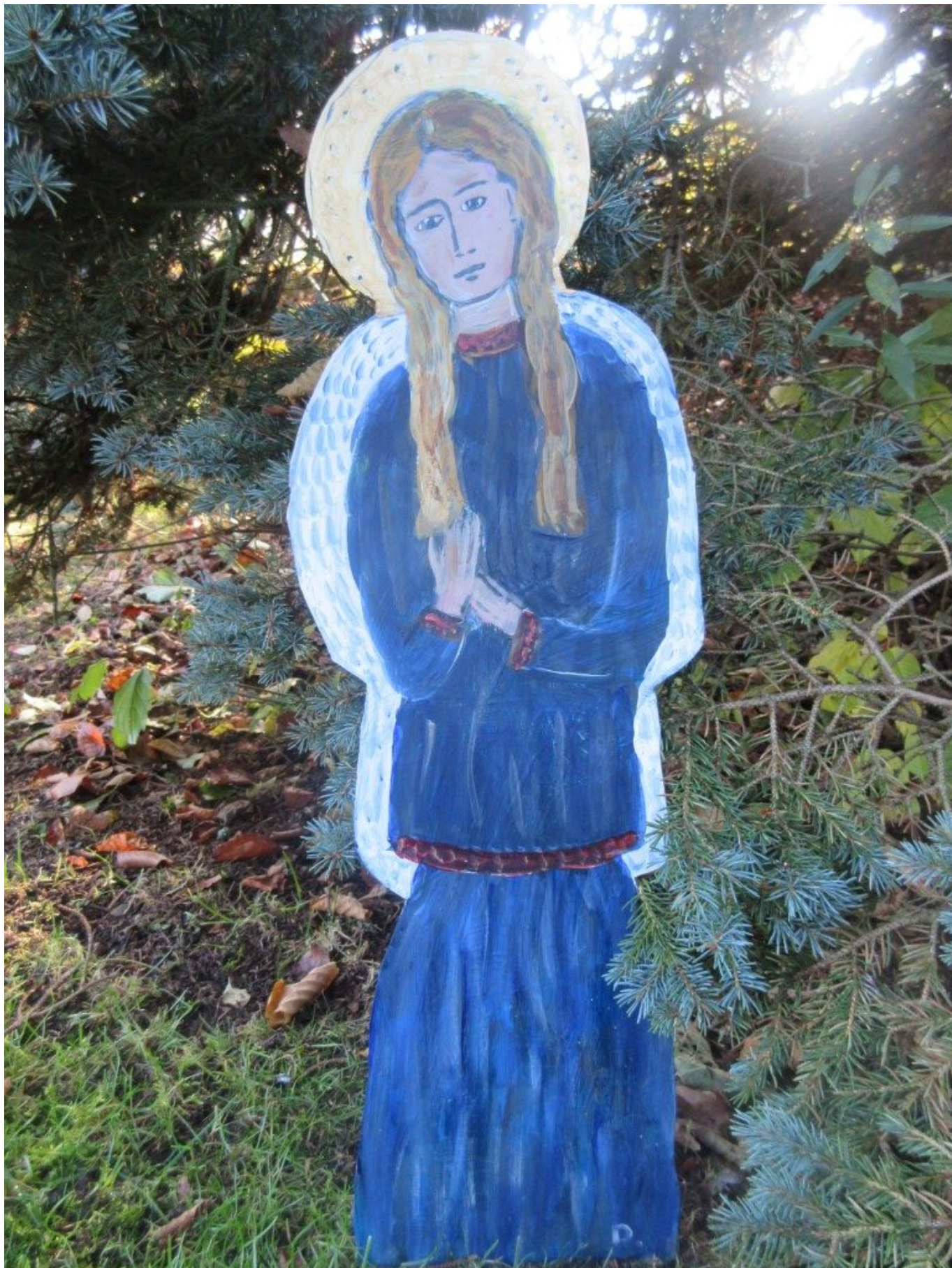
Dieser Engel ist einer der Preise bei der Foto-Verlosung