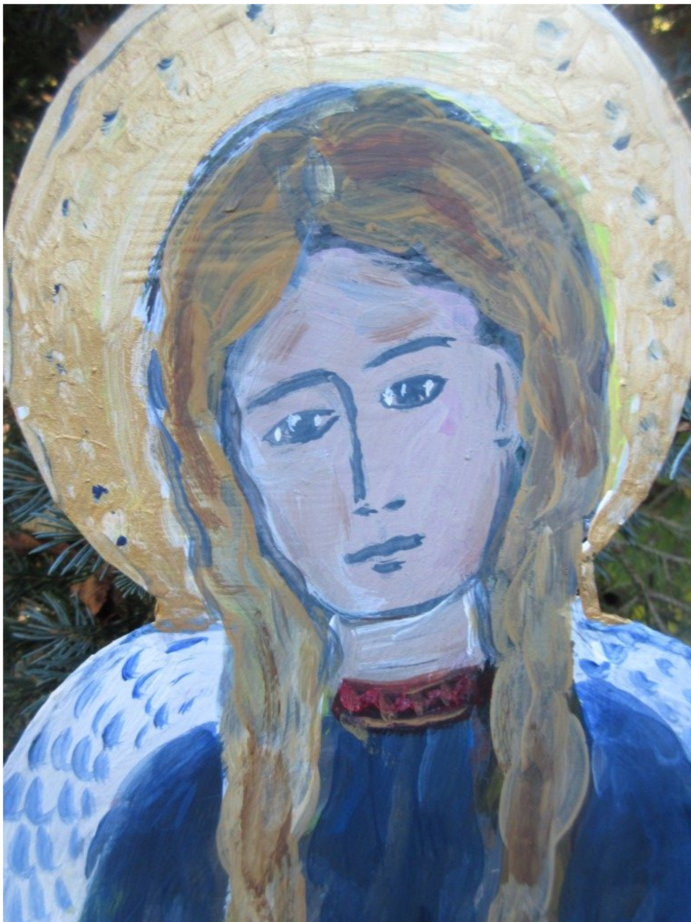
Gesicht der „Verlosungs-Engels“