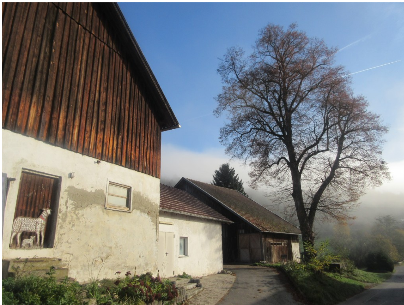
Piller-Anwesen in Gstadt