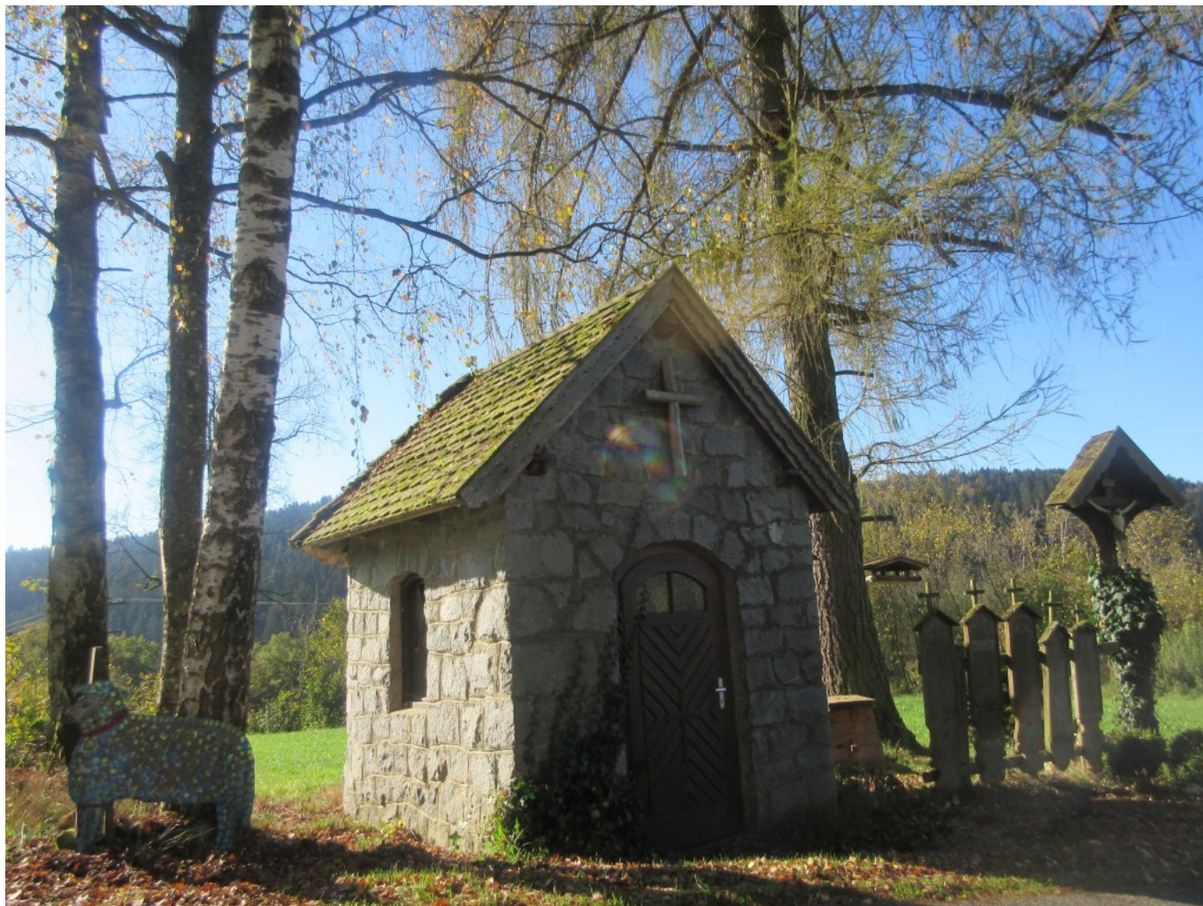
Kapelle mit Schaf in Gstadt

Wegweiser mit Schaf und Wolfgang von Gstadt nach Schönau