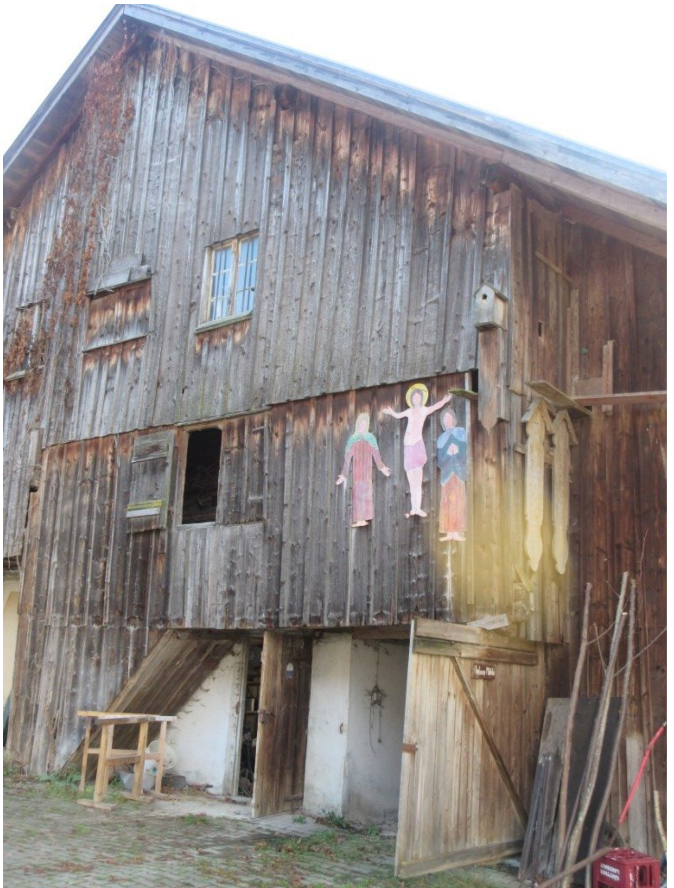
Kreuzigungsgruppe am Piller jun. Anwesen