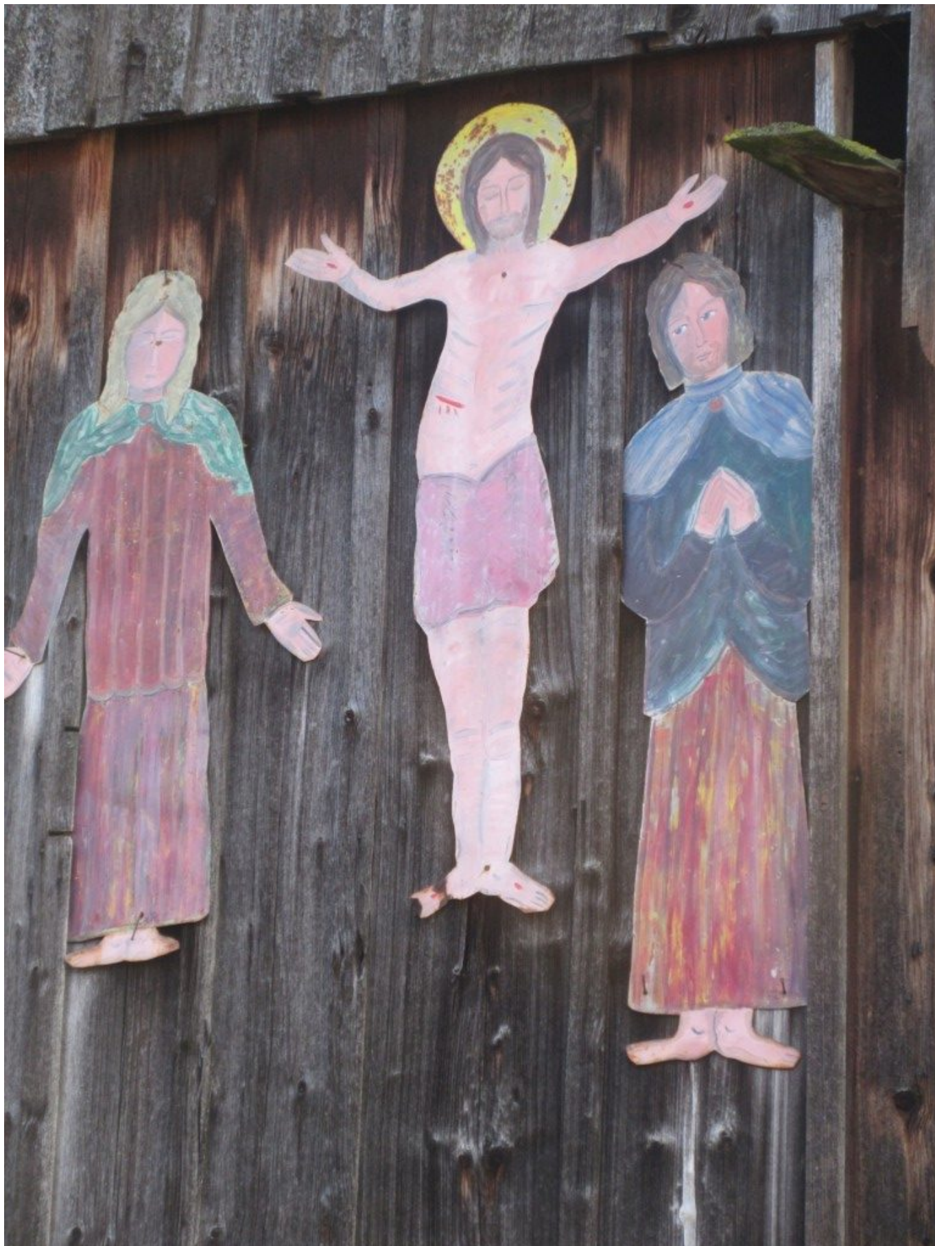
Franziska Piller sen.+ wünschte sich diese Gruppe