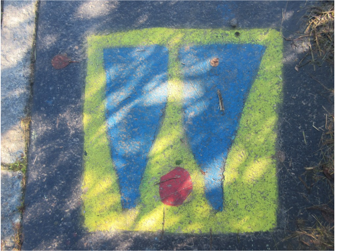
„W“ in Großenau am Gehsteig