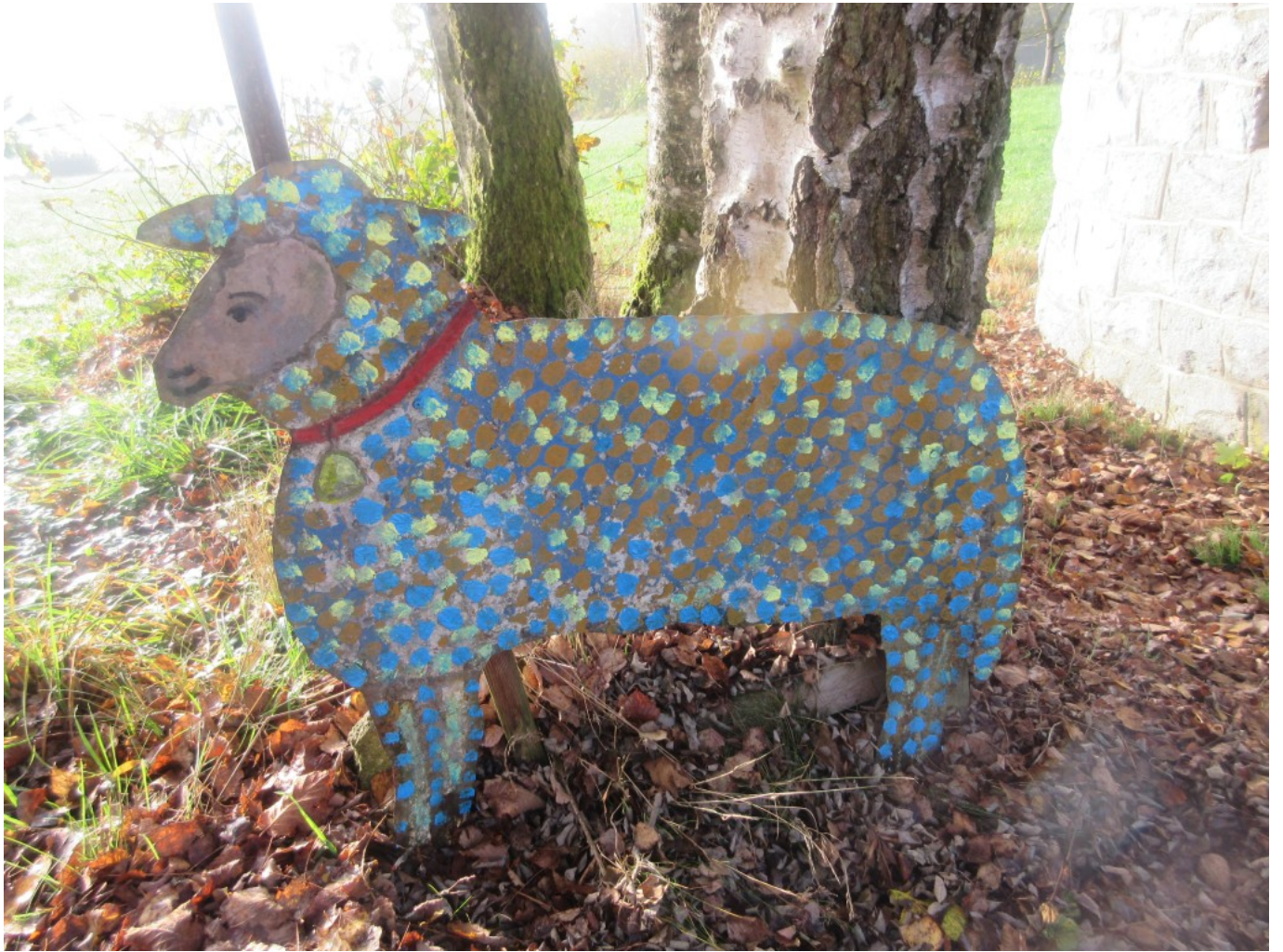
Gstadter Kapellenschaf neu aufgefrischt