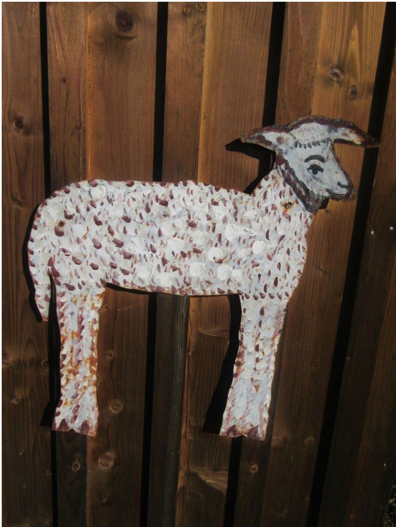
Schaf in Schwiebleinsberg