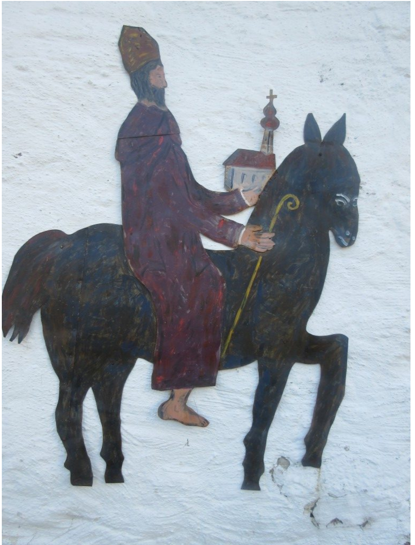
Wolfgangsfigur an der Kirchmuer