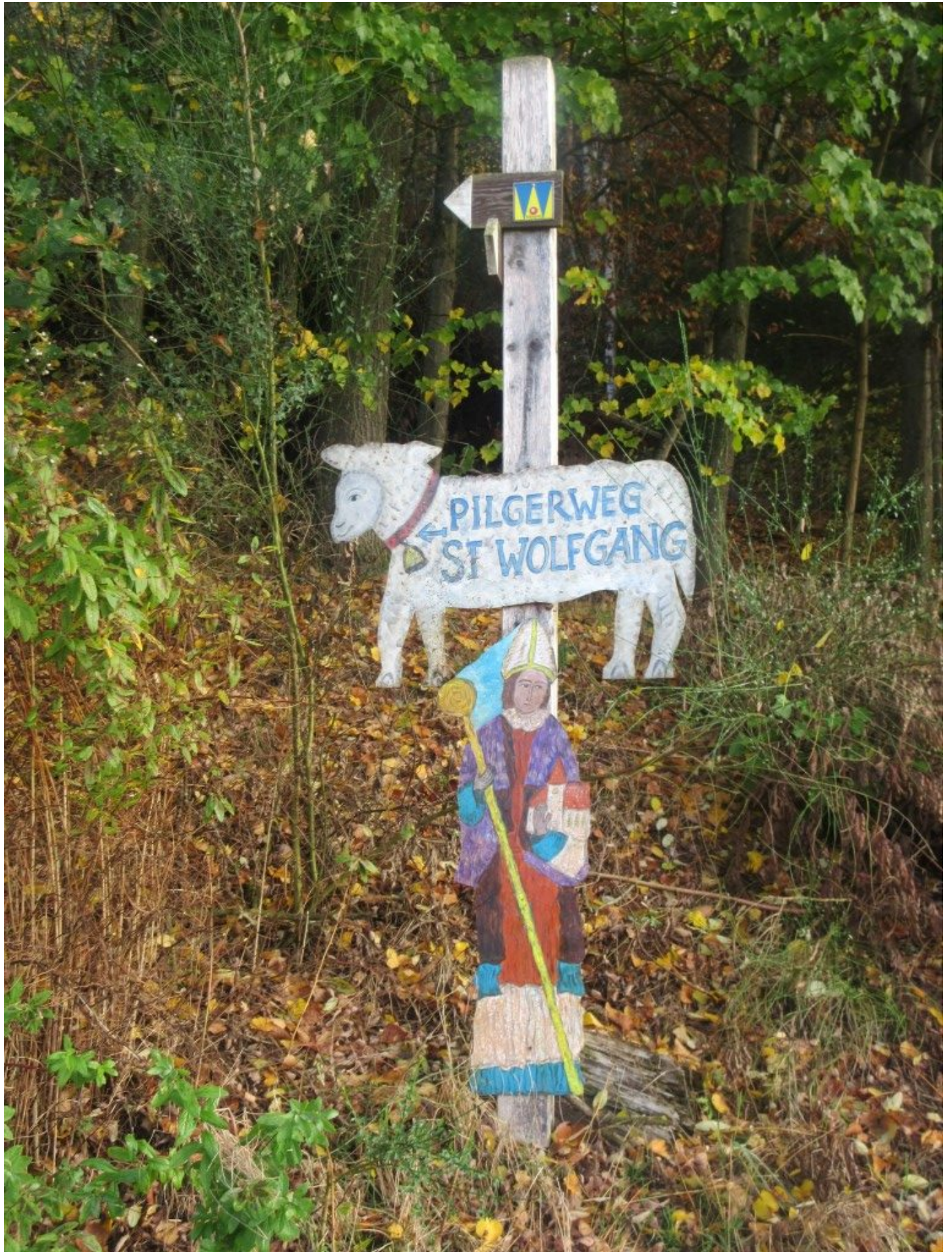
Wegweiser mit Schaf und Wolfgang von Gstadt nach Schönau