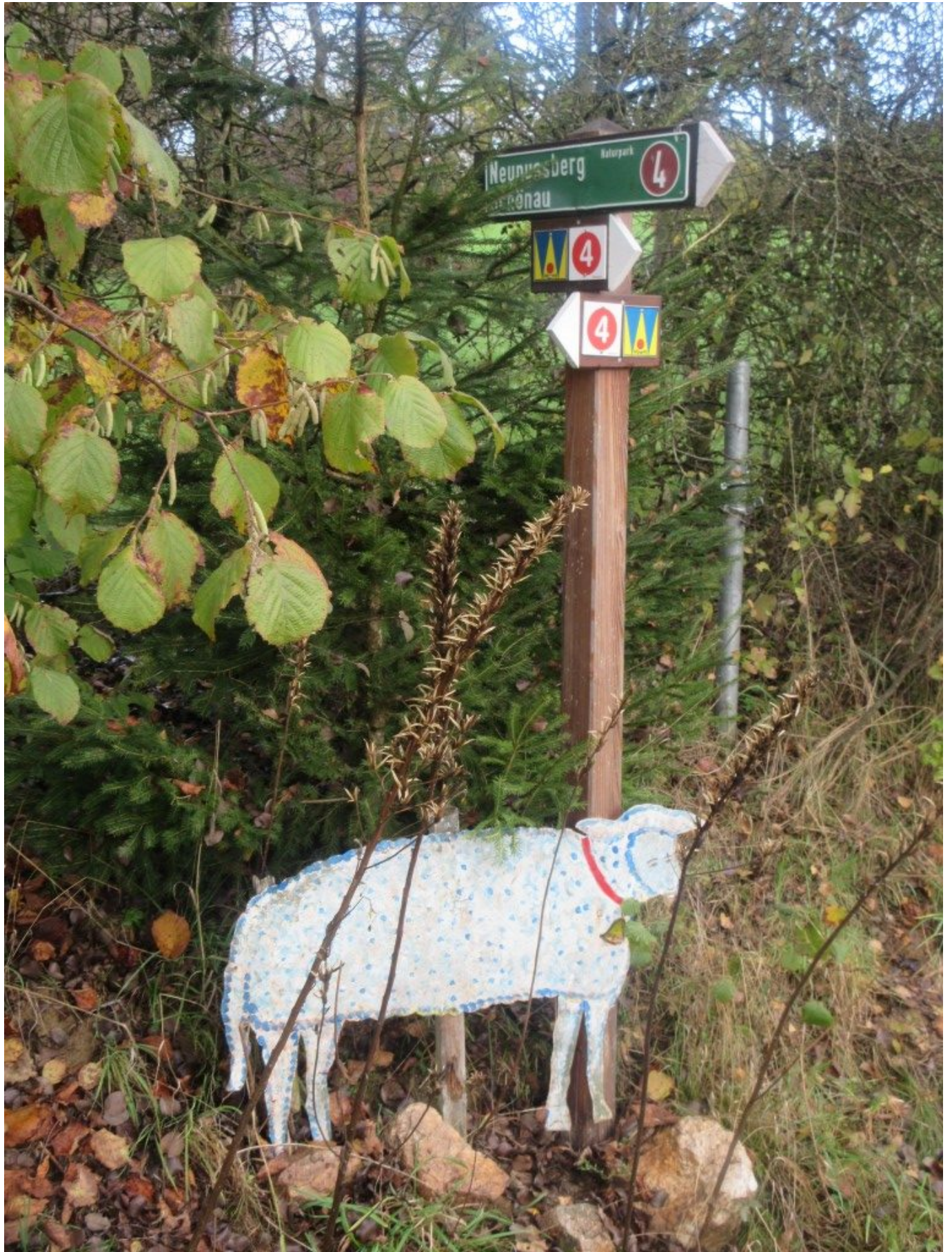
Blechschat in Richtung Gstadt