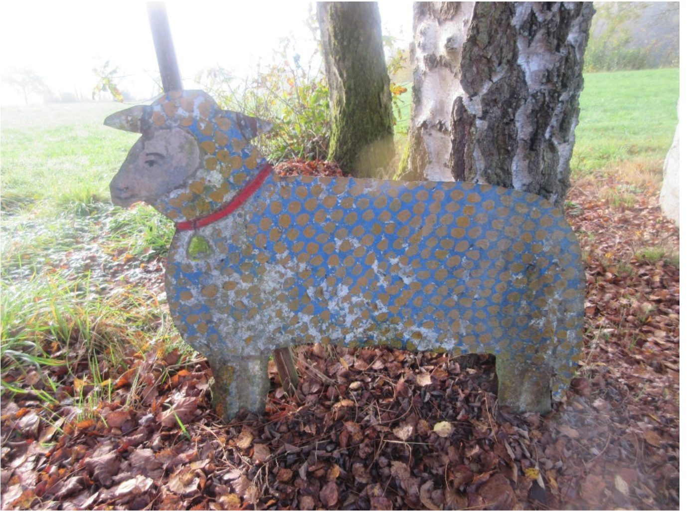
Gstadter Kapellenschaf vorher