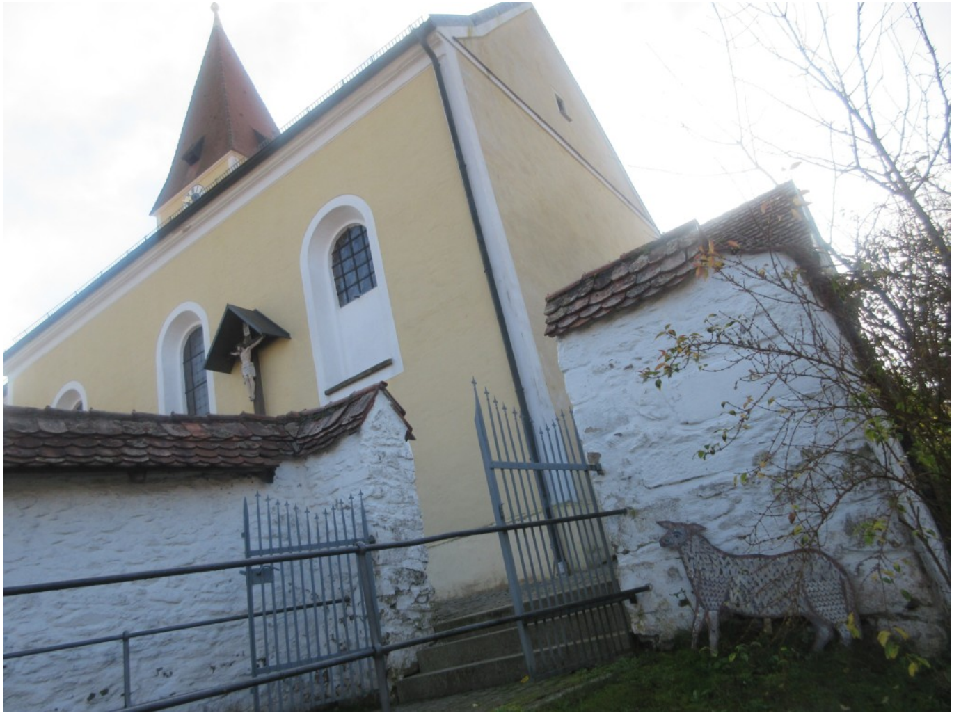
Schaf an der Kirchmauer in Schönau