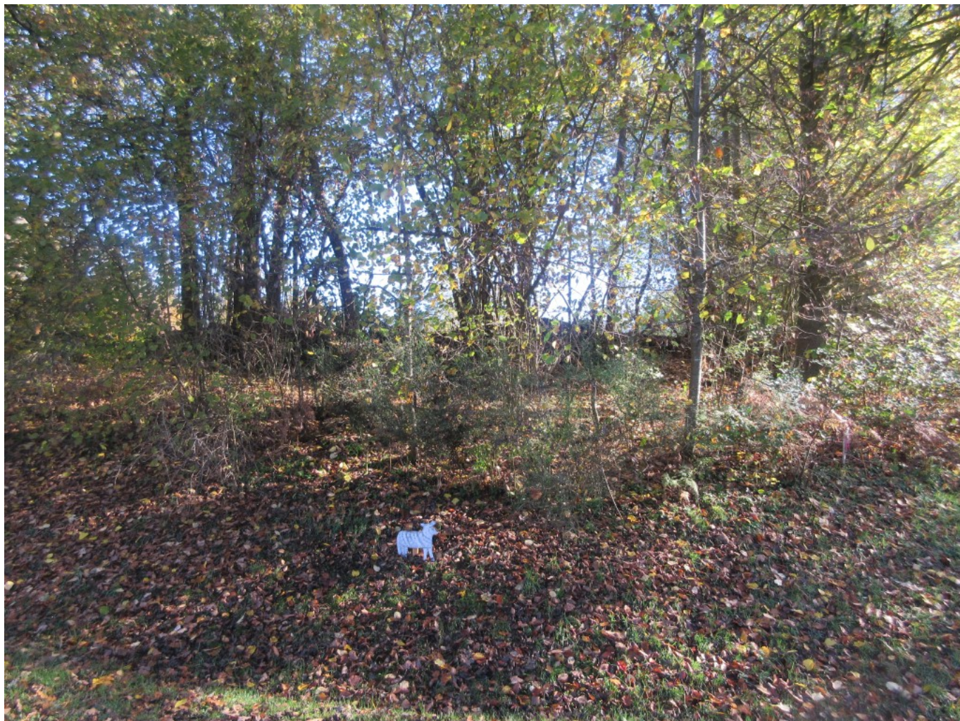
Dieses kleine Schaf markiert die Wegstrecke weiter nach Staudenschedl