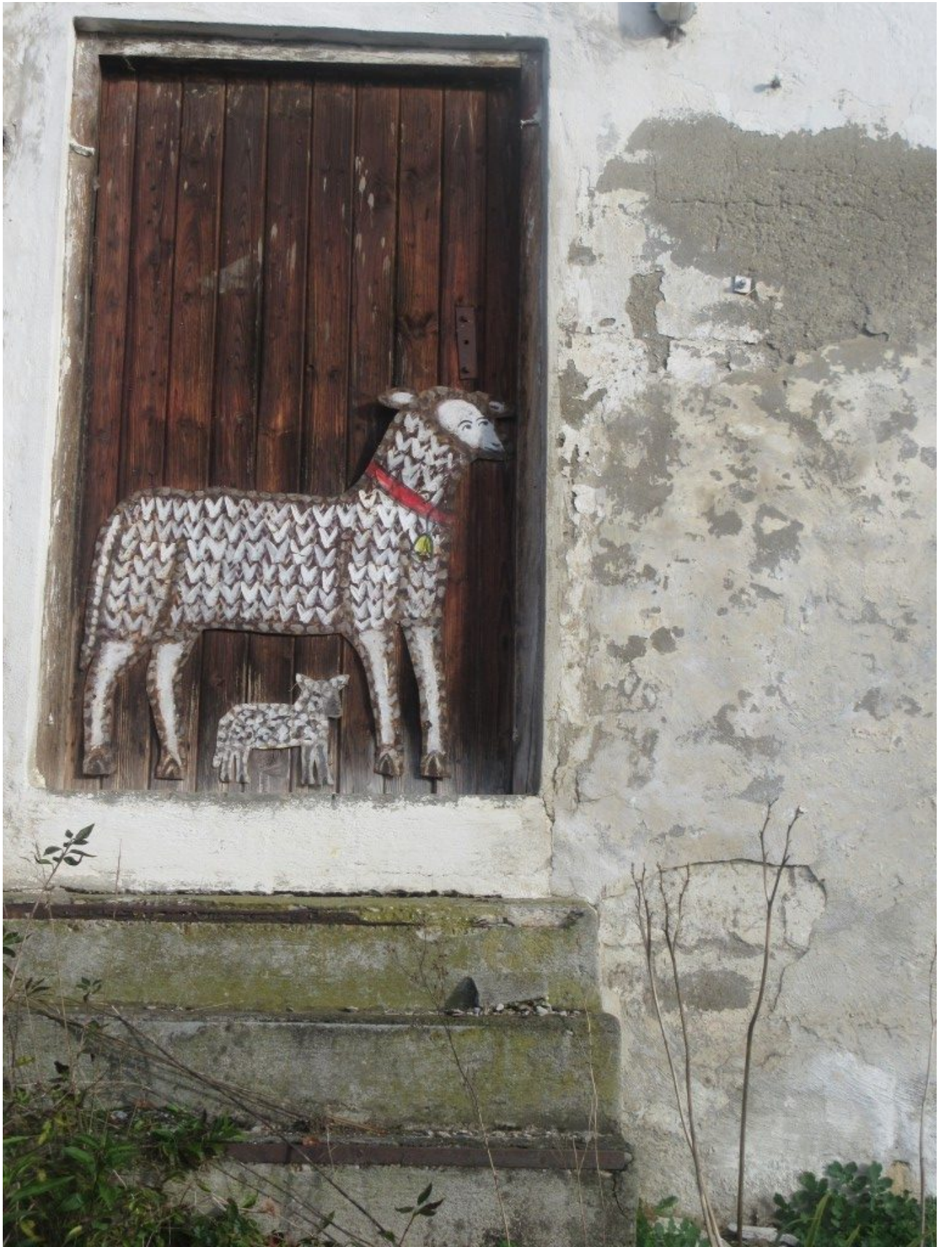
Schaf mit Lamm