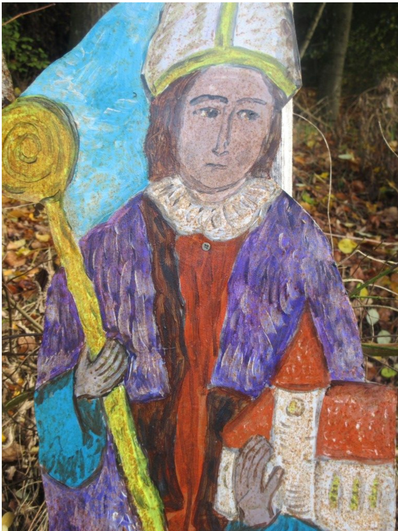
Wolfgangfigur mit Kirche und Stab