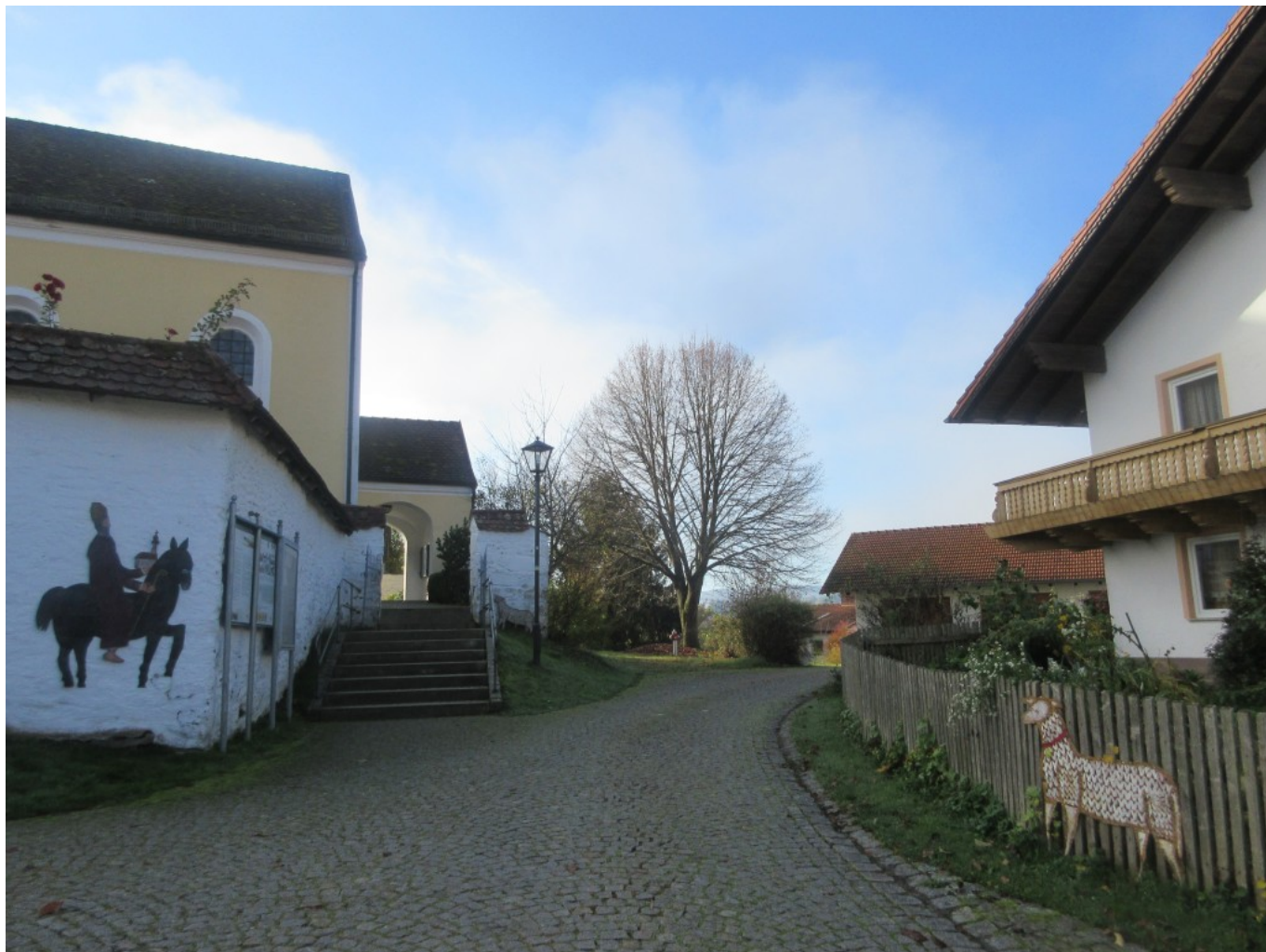
Am Zaun ein weiteres Schaf