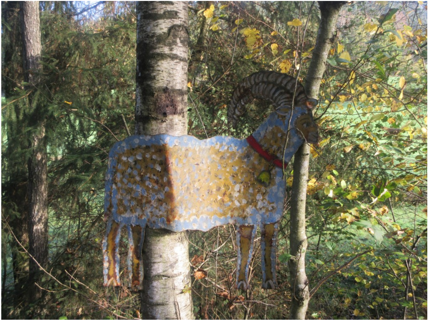
Widder im Gebüsch