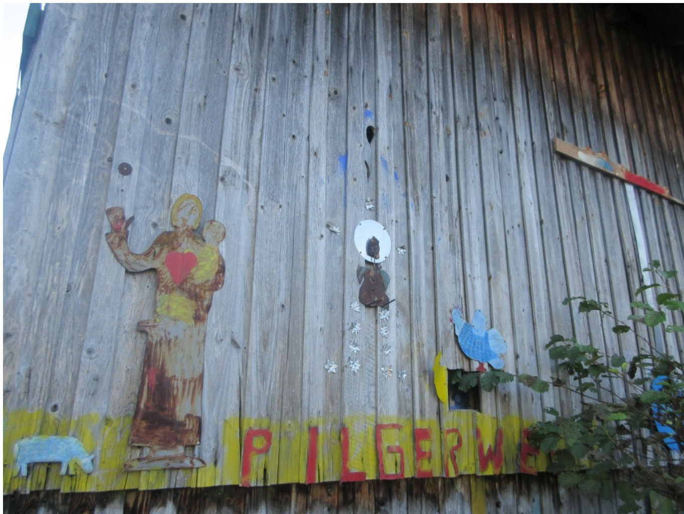
Lustige Bemalung einer Hütte in Großenau