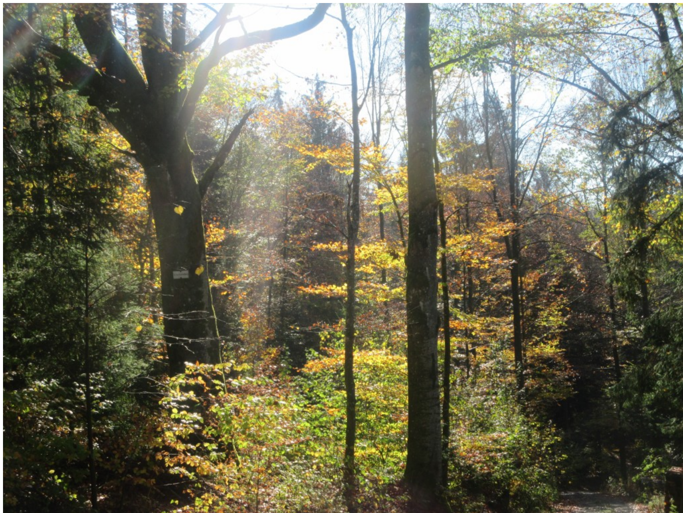
Blick in den Wald