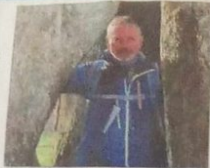
Rudi Simeth führt zu mächtigen Baumdenkmalen.