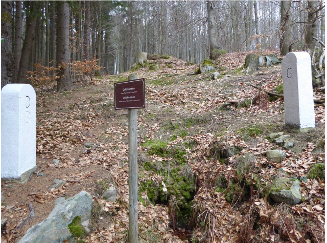
Der Goldbrunnen – die Quelle der Bayerischen Schwarzach an der Grenze

Bayerns. Nach der Wanderung ist eine Einkehr in Charlottental geplant. Zur Wanderung mit heimatkundlichen Beiträgen und QiGong-Übungen bitte um verbindliche Anmeldung bis kommenden Freitag, bei Rudi Simeth aus Stachesried möglichst unter waldaugen@t-online.de oder Mobiltelefon 0173 5947879. Unter www.waldaugen.de sind weitere Infos zu finden.