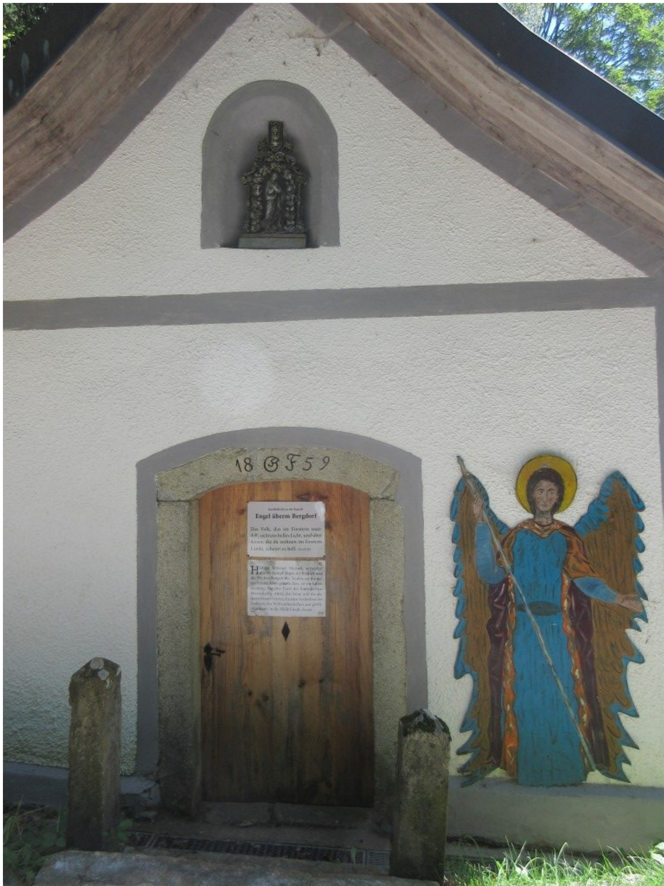
An der Eingangsfront der Marienkapelle bei Ramersdorf wacht der ehern Erzengel Michael