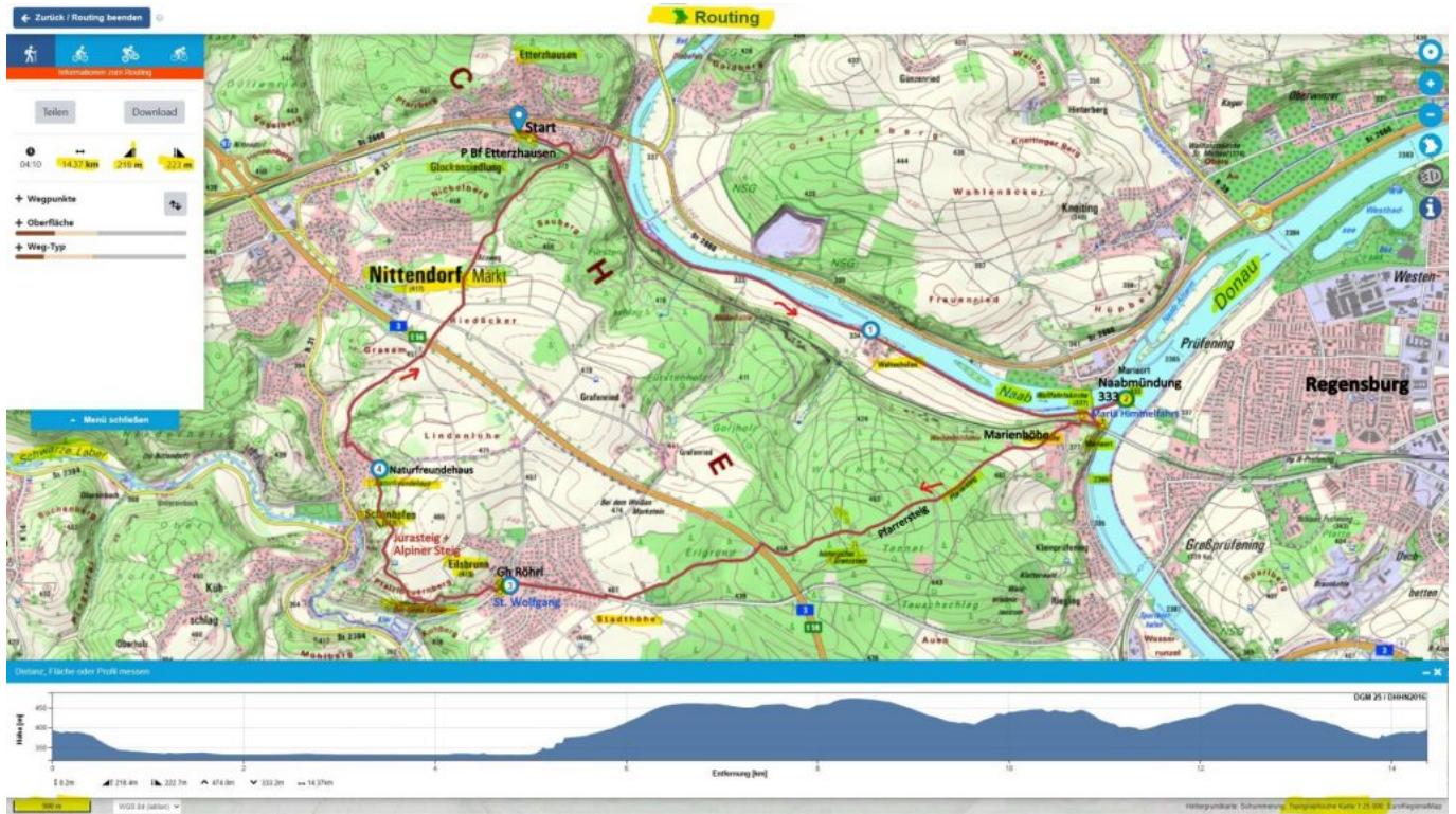
Bayern-Atlas – – Etterzhausen-Mariaort-Eilsbrunn