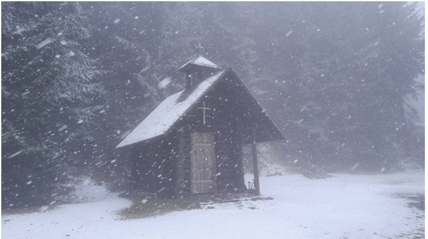
Bergwachtkapelle Hohen Bogen

Eine frohe Osterzeit und ein fröhliches „na zdraví“ – Prost / Auf Gesundheit!