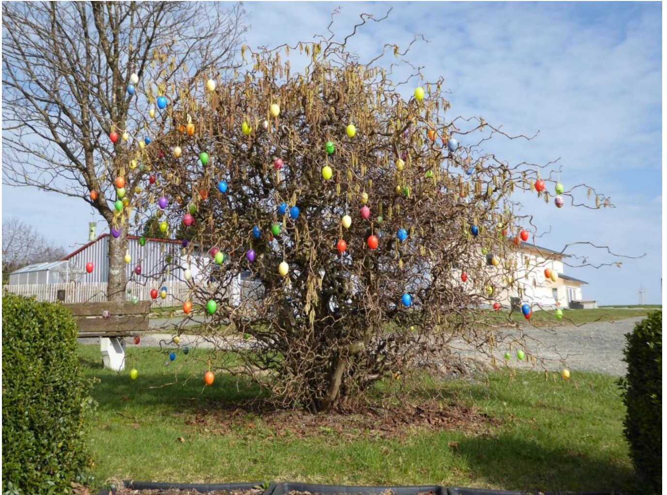
Osterstrauch in Stadlern