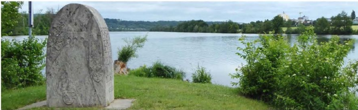
Bild: Naabmündung in die Donau bei Mariaort