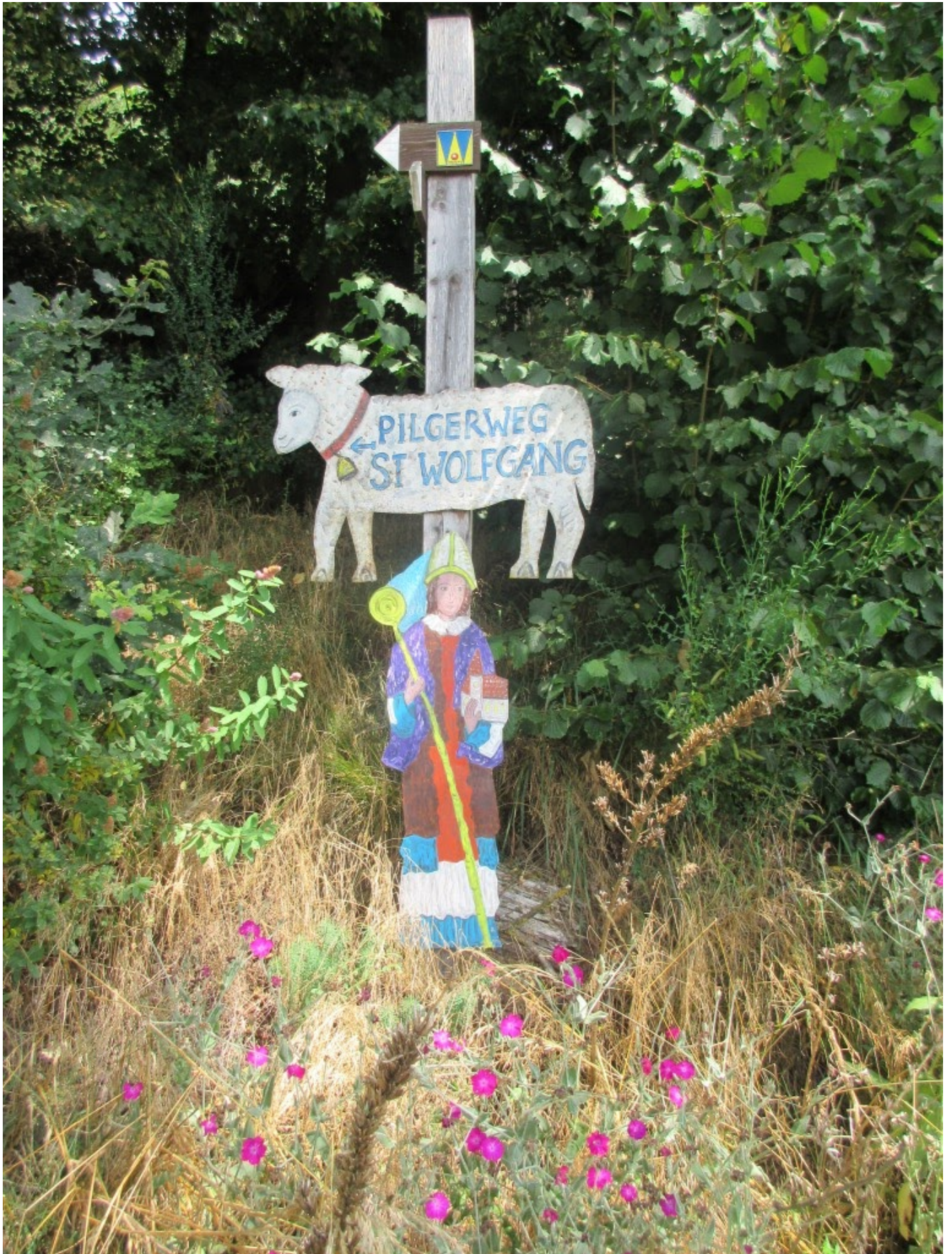
Die beliebten Blechschafe, Wolfgangsfigur und „W“-Markierung