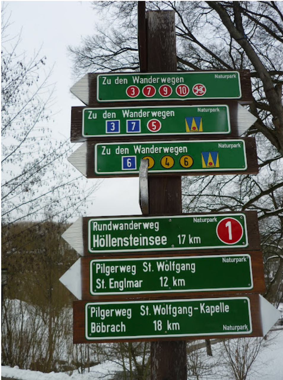
Hinweis auf den Wolfgangsweg in Viechtach (Herzstück)