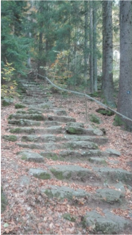
Aufstieg zur Wolfgangskapelle