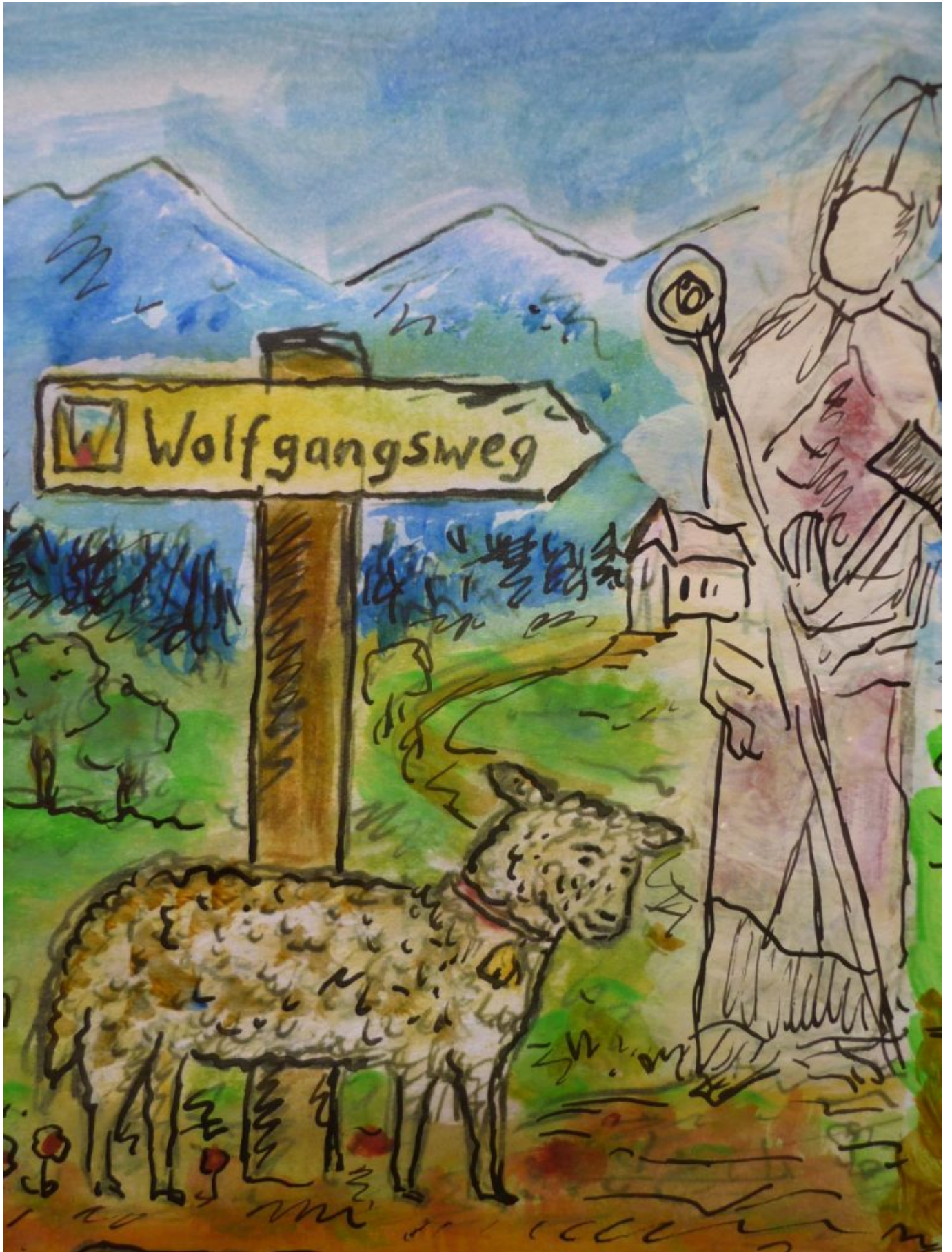
Gezeichnete, aquarellierte Inspirationen von Dorothea Stuffer