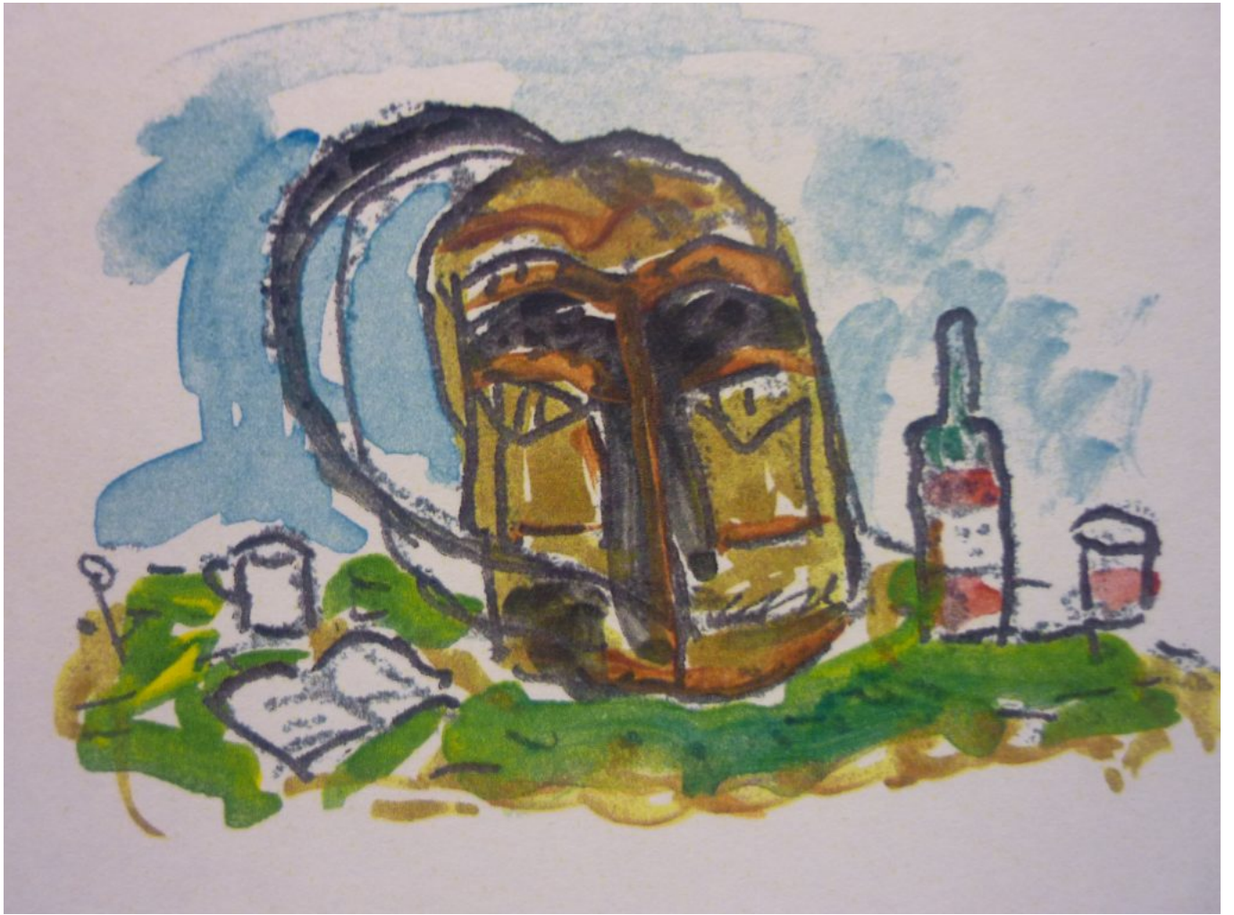
Pilgern, ein weiter Weg in die Mitte