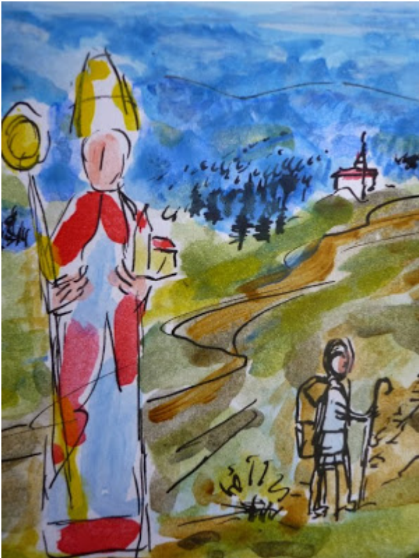
Der heilige Wolfgang, eine Leuchte Gottes in dunkler Zeit

Weitergeben, was Jesus lehrt. Auf bewährten Wegen Neues wagen (Angela Merici)