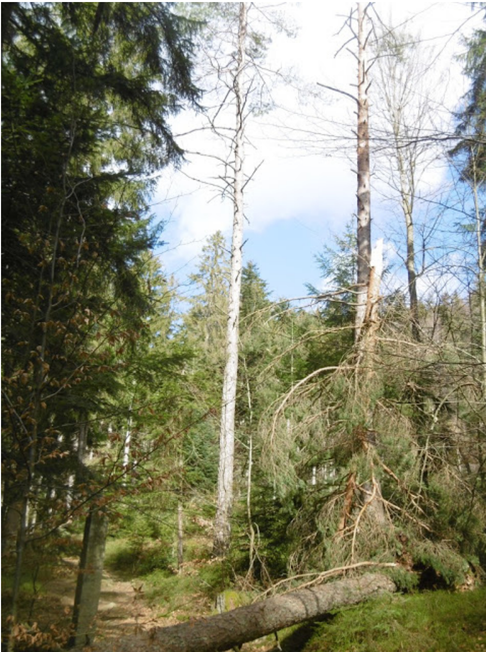
Baumschäden von den Winterstürmen am Kreuzweg zur Wolfgangskapelle stellen kein wirkliches Hindernis für den Aufstieg dar.