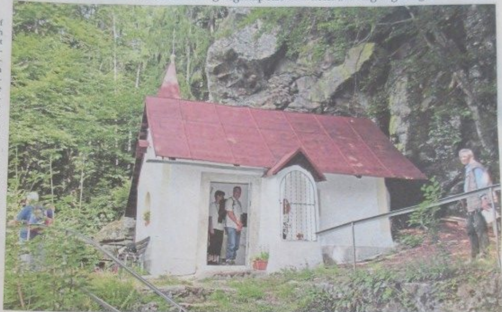
Beliebtes Ziel von Pilgern und Wanderern: die Wolfgangskapelle auf dem Wolfgangriegel hoch über Böbrach.

Die Zahl der Pilger zur Wolfgangskapelle ist heute überschaubar. Es sind vor allem Einzelpilger, die den Kreuzweg hinauf zur Kapelle beten oder die auf dem ausgewiesenen Pilgerweg St. Wolfgang unterwegs sind. Eine treue Pilgerschar bildet die Wolfgangi-Bruderschaft aus der Pfarrei Ruhmannsfelden, die noch regelmäßig am ersten Juli-Wochenende hierher kommt.