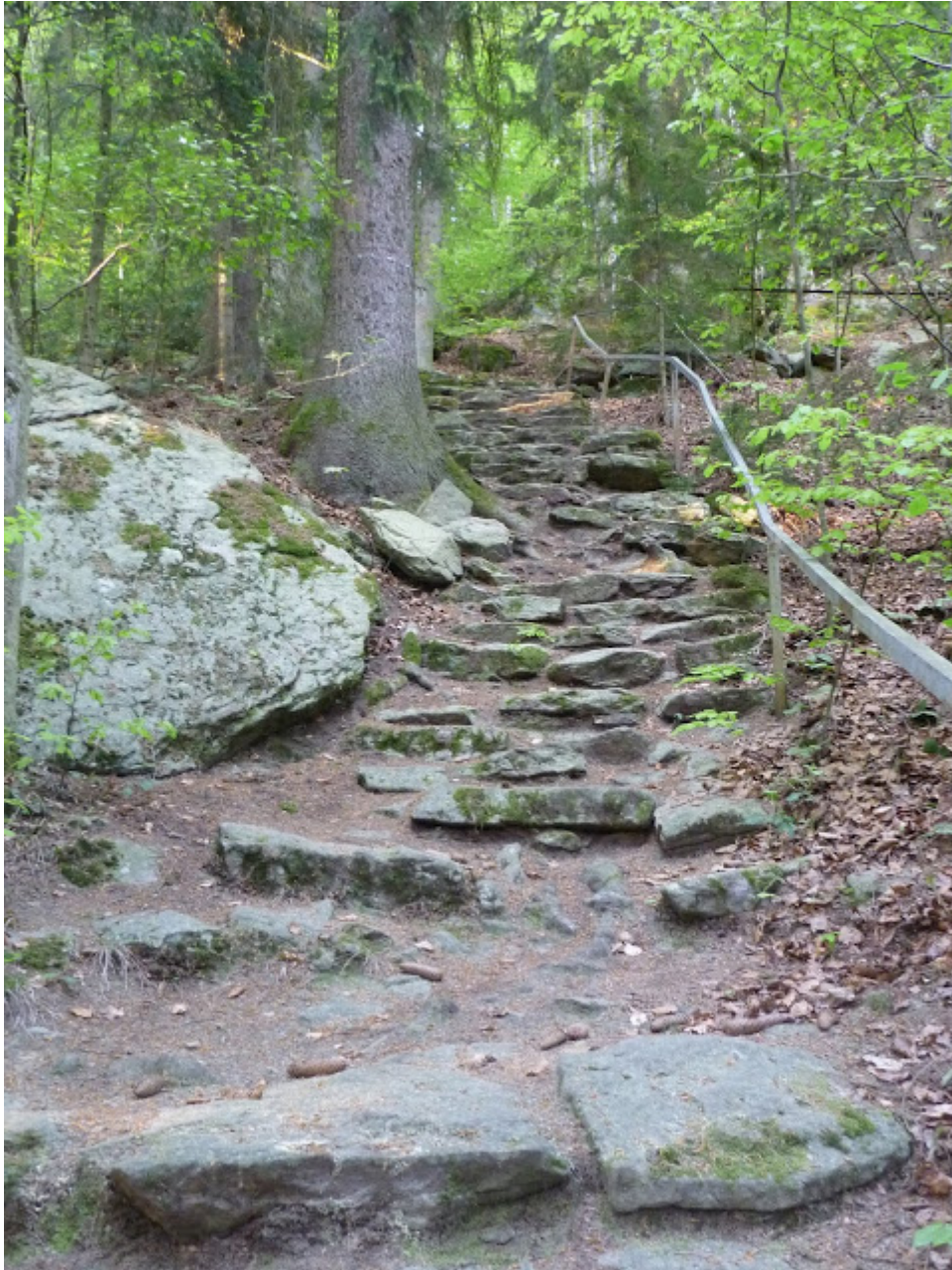
Der mystisch- steinerene Weg hinauf zur Wolfgangskapelle