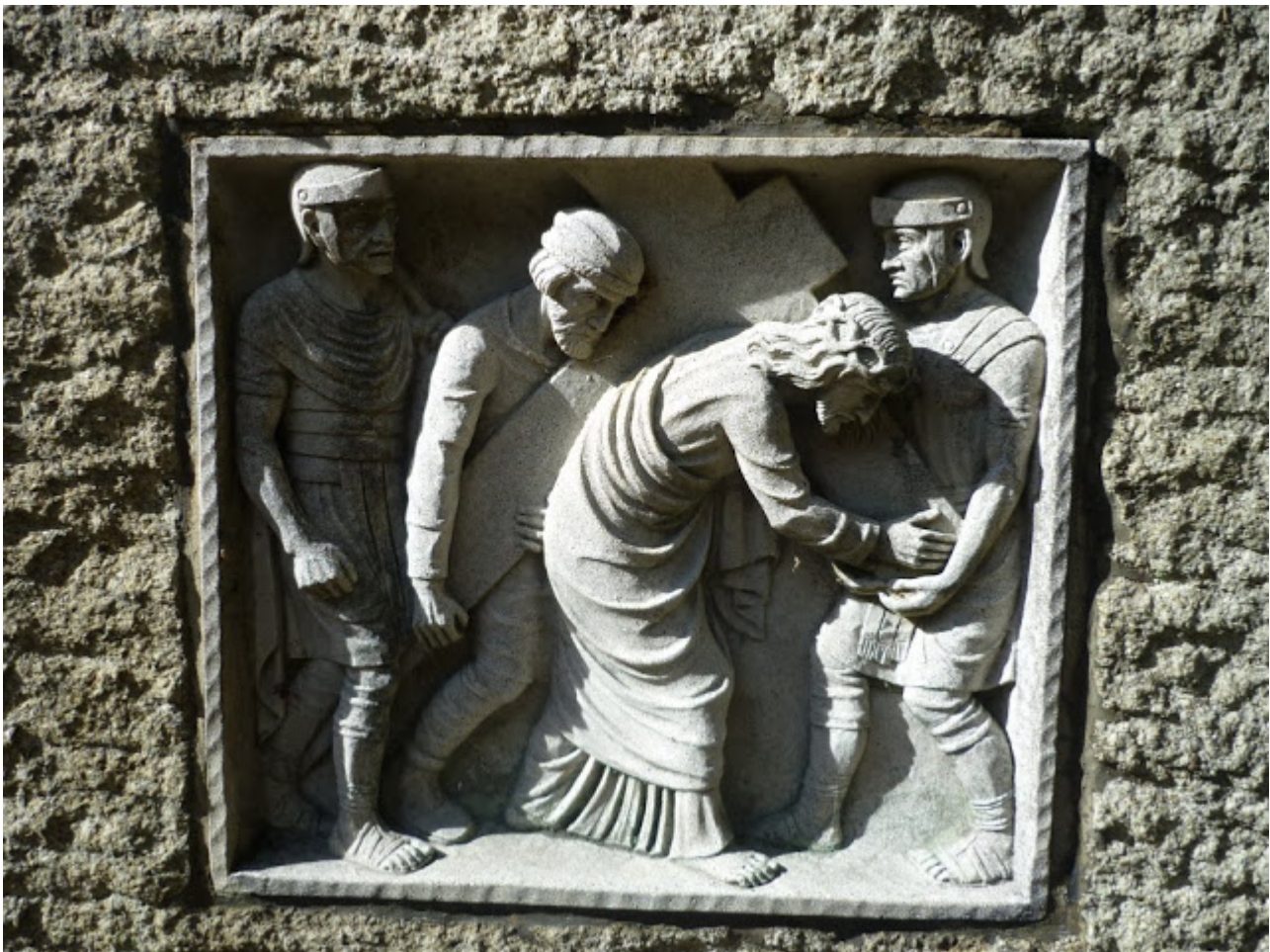
Jes us und römische Soldaten zum Beginn des Kreuzweges zur Kapelle

Kapelle führenden Kreuzweg. Mindestens ebenso mühevoll wie die Errichtung der Kreuzwegstationen dürfte der Bau der steinernen Treppen in dem steilen und unwegsamen Gelände gewesen sein. Gut 100 Jahre nach der Errichtung des Kreuzweges, nämlich 1959, ließ Ortspfarrer Josef Knorr den neuen Kreuzweg errichten. Die etwa 1.20 Meter hohen Kreuzwegstationen aus Granit wurden von den Pfarrangehörigen gestiftet. Die Reliefs aus Kunststein sind in den Granitstein eingelassen und zeigen den Leidensweg Jesu bis zur Grablegung.”