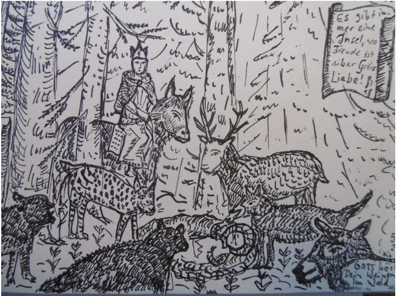
Der heilige Wolfgang, unterwegs im Urwald mit wilden Tieren, begegnet dem Jesuskind. Zeichnung von Dorothea Stuffer