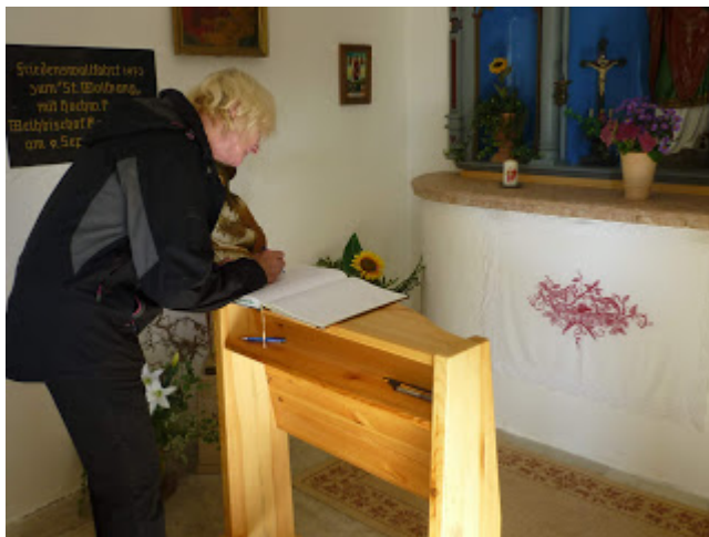
Besucher tragen sich ins Kapellenbuch ein.

"Die Einträge im Kapellenbuch machen ersichtlich" so Hildegard Weiler", wie viele Besucher gerade jetzt in der Coronakrise zur Kapelle pilgern. Durch die Winterstürme sind zwar einige größere Bäume umgefallen, doch man kann sie gut umgehen, und sie scheinen kein Hindernis zu sein, dass Menschen ihre Gebetsanliegen dem Schutzpatron Wolfgang auf der Kapelle vorbringen."