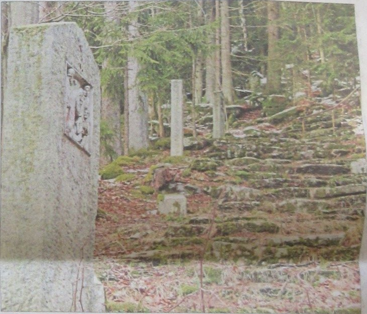
Steil und steinig ist der Kreuzweg hinauf zur Wolfgangskapelle auf dem Wolfgangriegel.

Steil und steinig ist der Kreuzweg hinauf zur Wolfgangskapelle auf dem Wolfgangriegel .