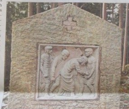
Auf den Reliefs ist der Leidensweg Jesu dargestellt: hier die fünfte Kreuzwegstation: „Simon von Cyrene hilft Jesus das Kreuz tragen“.