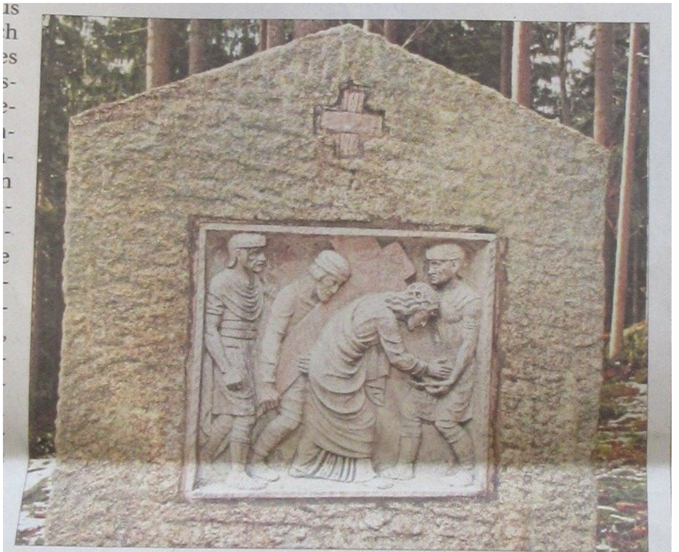
Auf den Reliefs ist der Leidensweg Jesu dargestellt: hier die fünfte Kreuzwegstation: „Simon von Cyrene hilft Jesus das Kreuz tragen“.

Eine der Kreuzwegstationen: "Simon von Cyrene hilft Jesus das kreuz tragen"