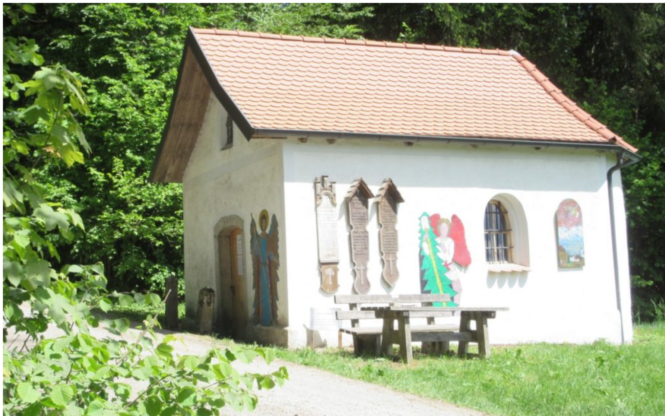
Die Ramersdorfer Marienkapelle mit Totenbrettern, 2 ehernen Engeln und einer Engel-Votivtafel (rechts)