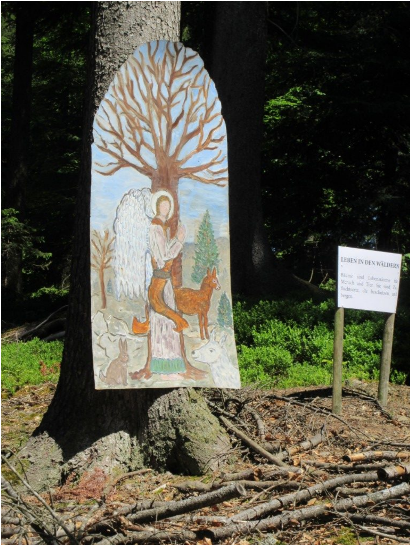
Baumschutzengel "Leben in den Wäldern"