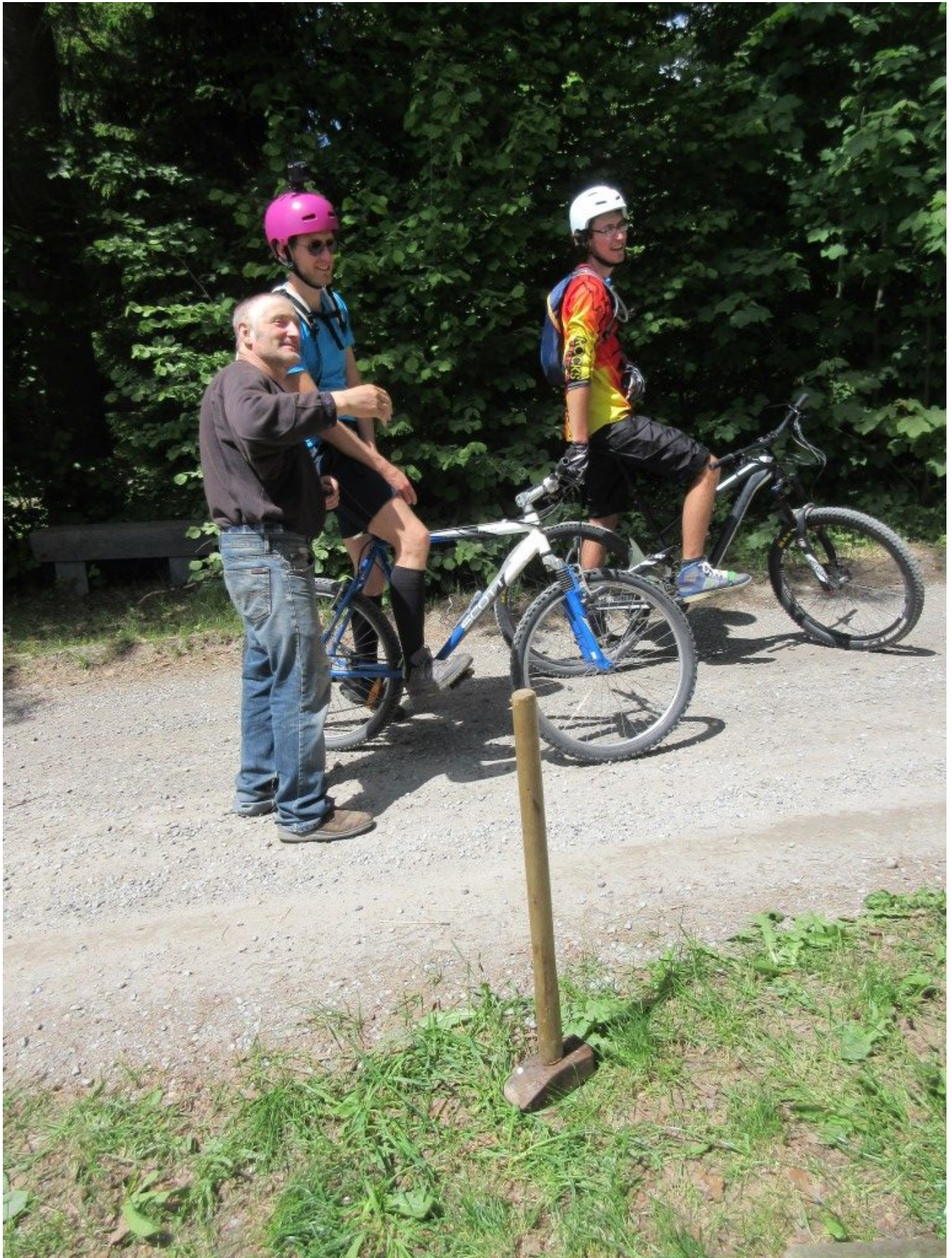
Erste Passanten – hier 2 Biker – interessieren sich für die aktuelle Bildgestaltung an der Kapelle und am Lehrpfad durch