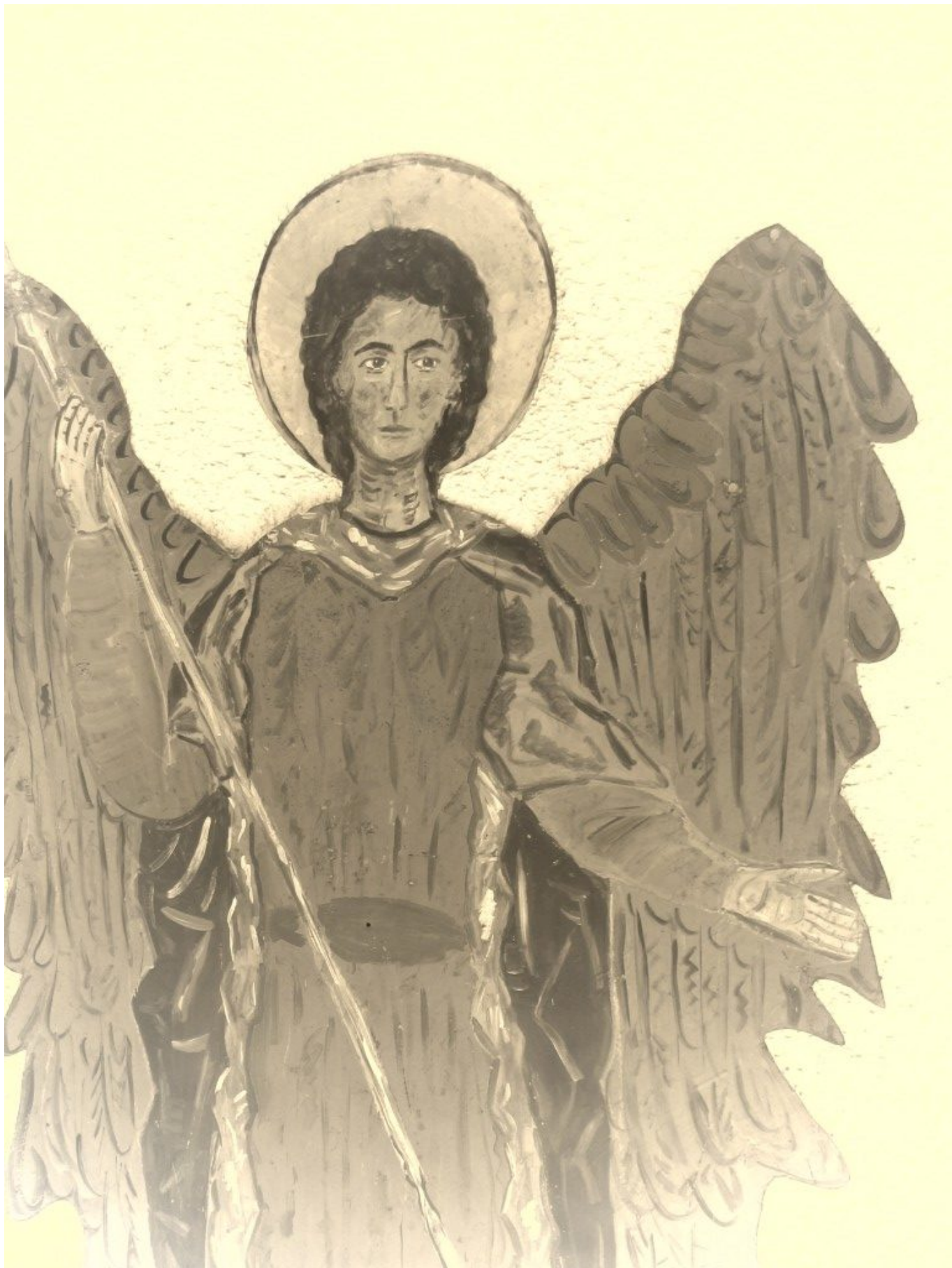
Der Erzengel Michael an der Marienkapelle in Ramersdorf