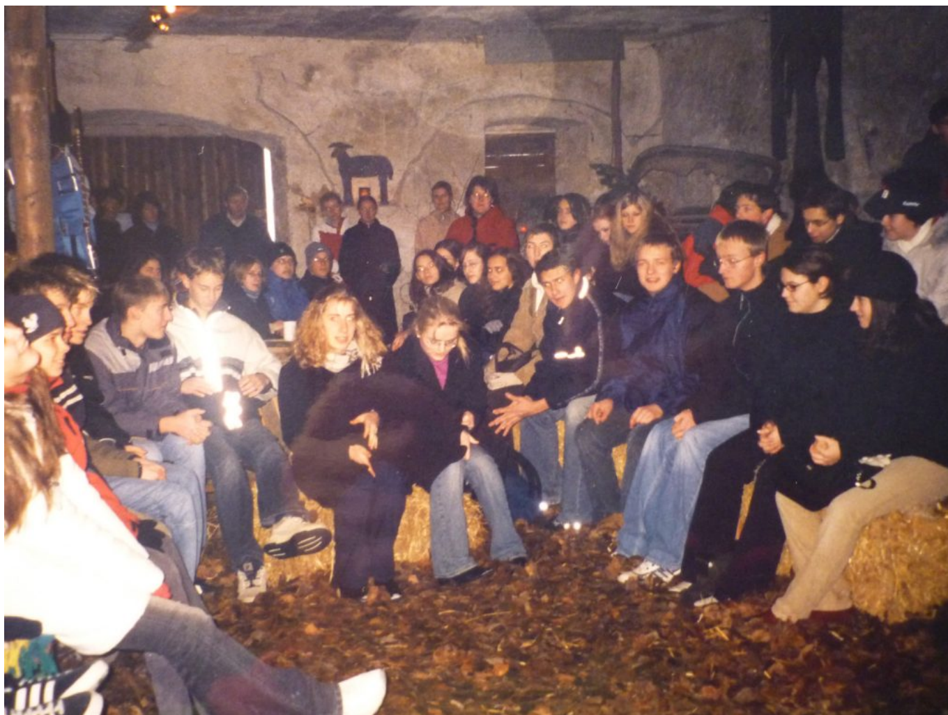
Pilger-Gottesdienst mit Jugendlichen in der „Pilgerstube“ im alten Pferdestall