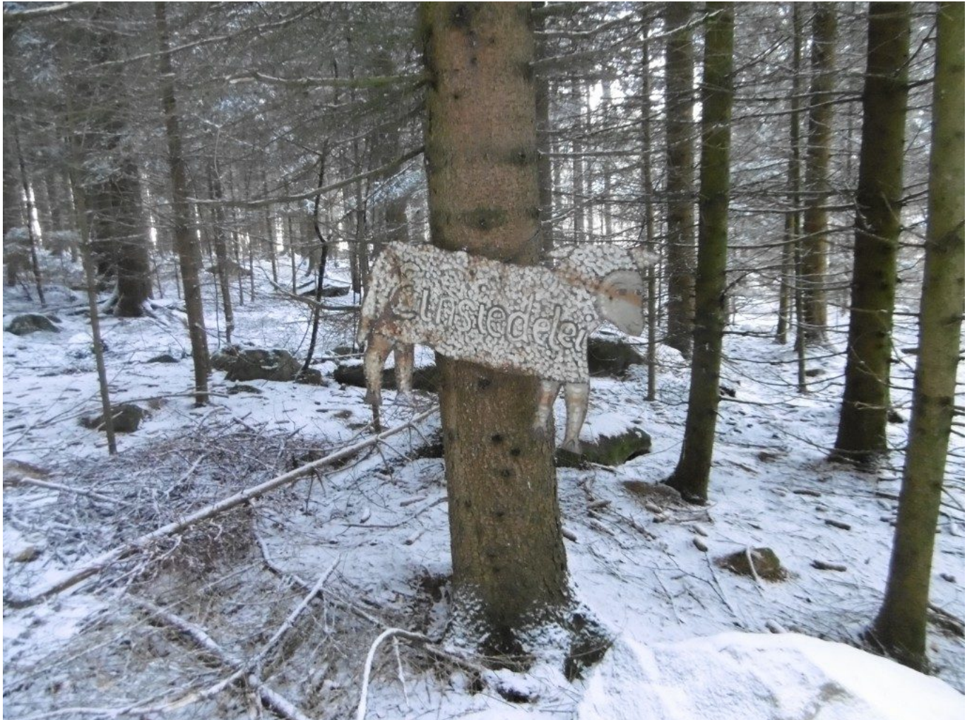
Blechschatz mit der Aufschrift “Einsiedelei” im Wald bei Münchshöfen am Wolfgangsweg

Wenn man durch den Wald von Stein nach Münchshöfen geht – das ist die rote 12 und auch der Wolfgangsweg – trifft man auf einer einsamen Waldlichtung auf die “Einsiedelei” vom Volker Sierig. Dieses Wegstück ist nun temporär auch ein Stück “Advent-auf-der-Einöde-Weg” .