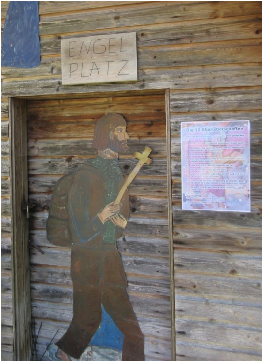
Der Pilger geht zu den Glücksbotschaften