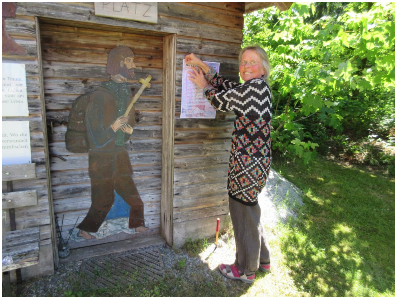
13. Juni 2021: Anbringen der 12 Glücksbotschaften