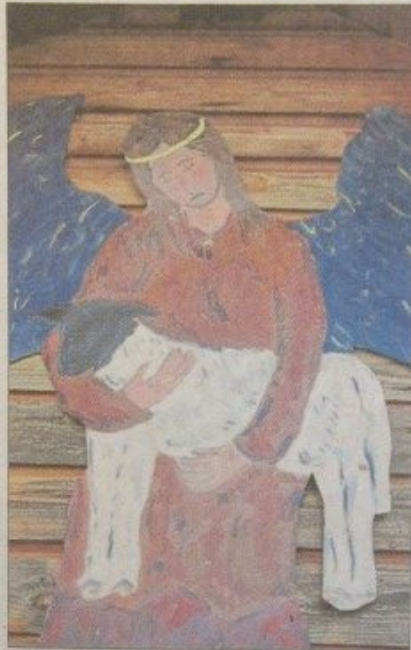
Der „Engel mit dem Lamm“ ist bei der Herz-Jesu-Kirche in Ayrhof zu finden.

Von der Ortskirche in Fernsdorf geht man nach Süden in Richtung Bundesstraße 85. Vor der B 85