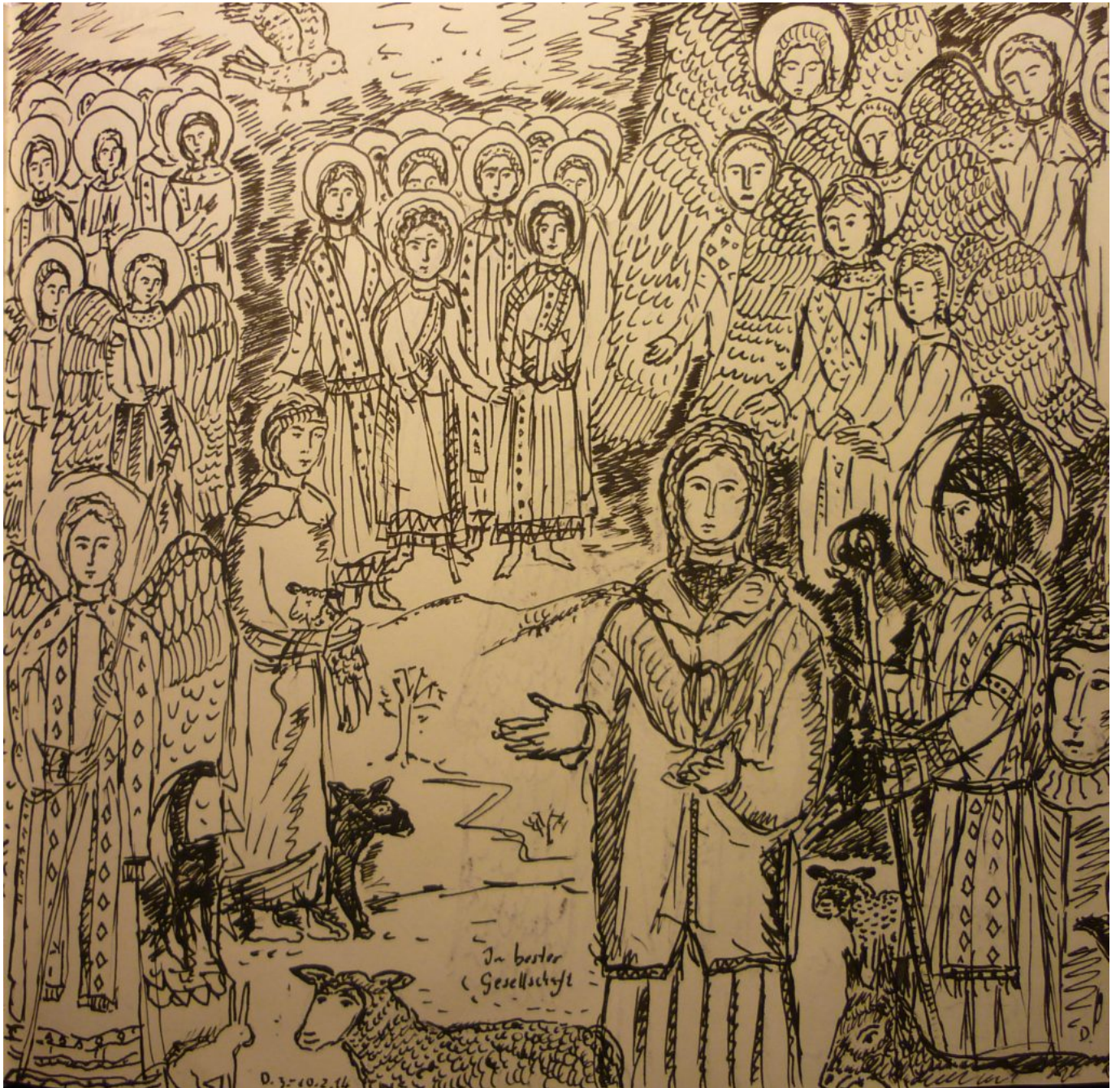
„In bester Gesellschaft“ eine Tuschezeichnung von Dorothea Stuffer