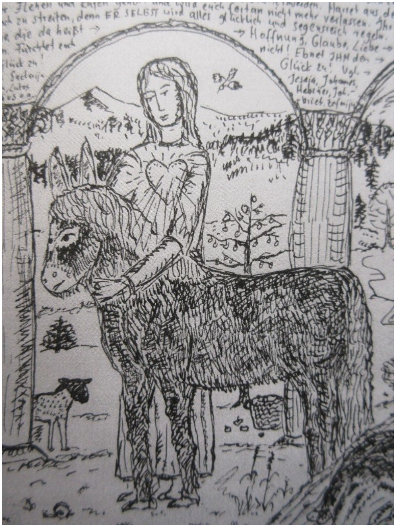
Tagebuch von Dorothea Stuffer: Aus dieser Zeichnung „Die Herzensbotin“ wurde eine lebensgroße Glücksboten-Figur – die