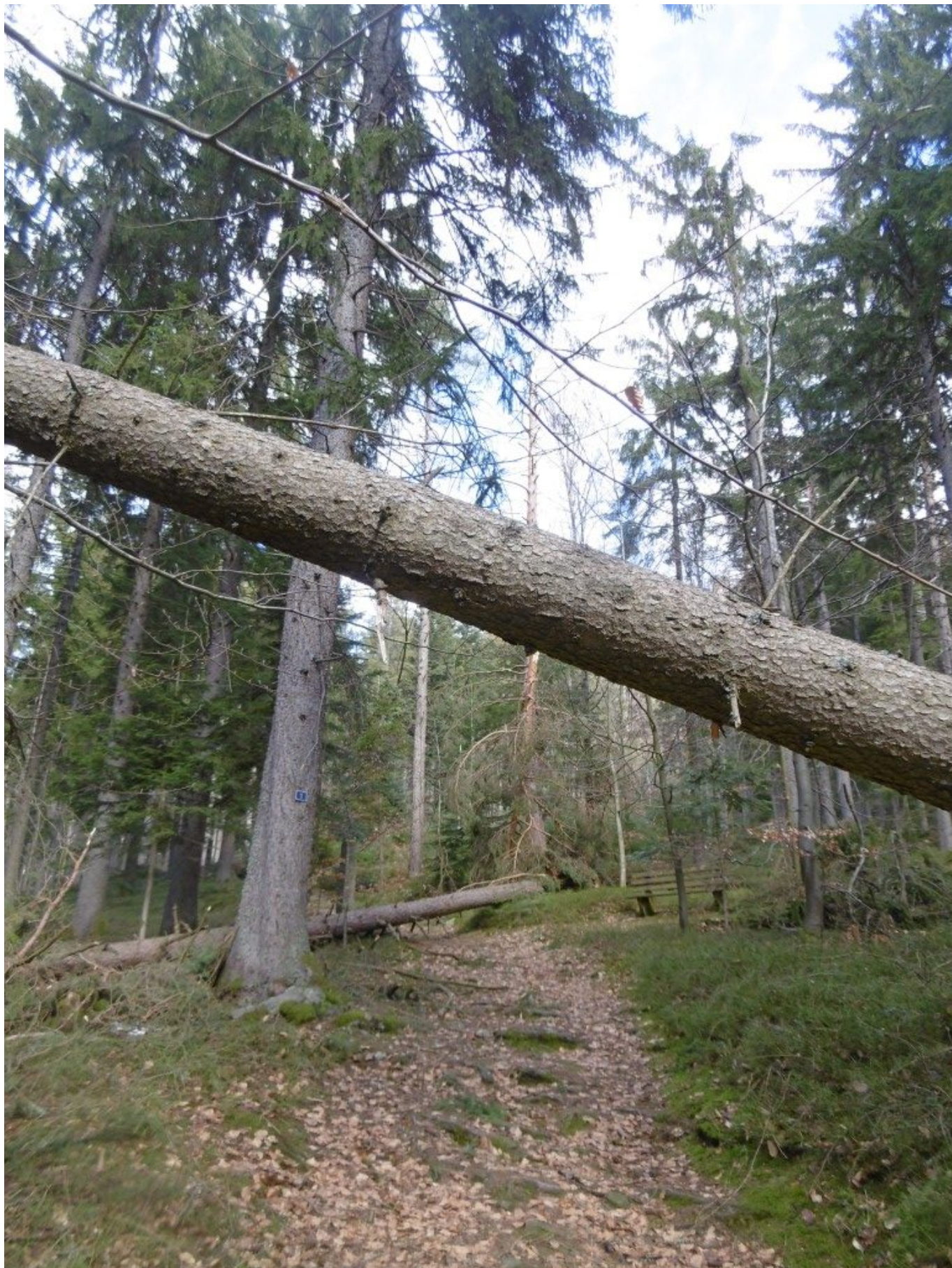
Wie eine Brücke: Die umgestürzte Tanne wird von einem gegenüberliegenden Baum wie magisch gestützt.