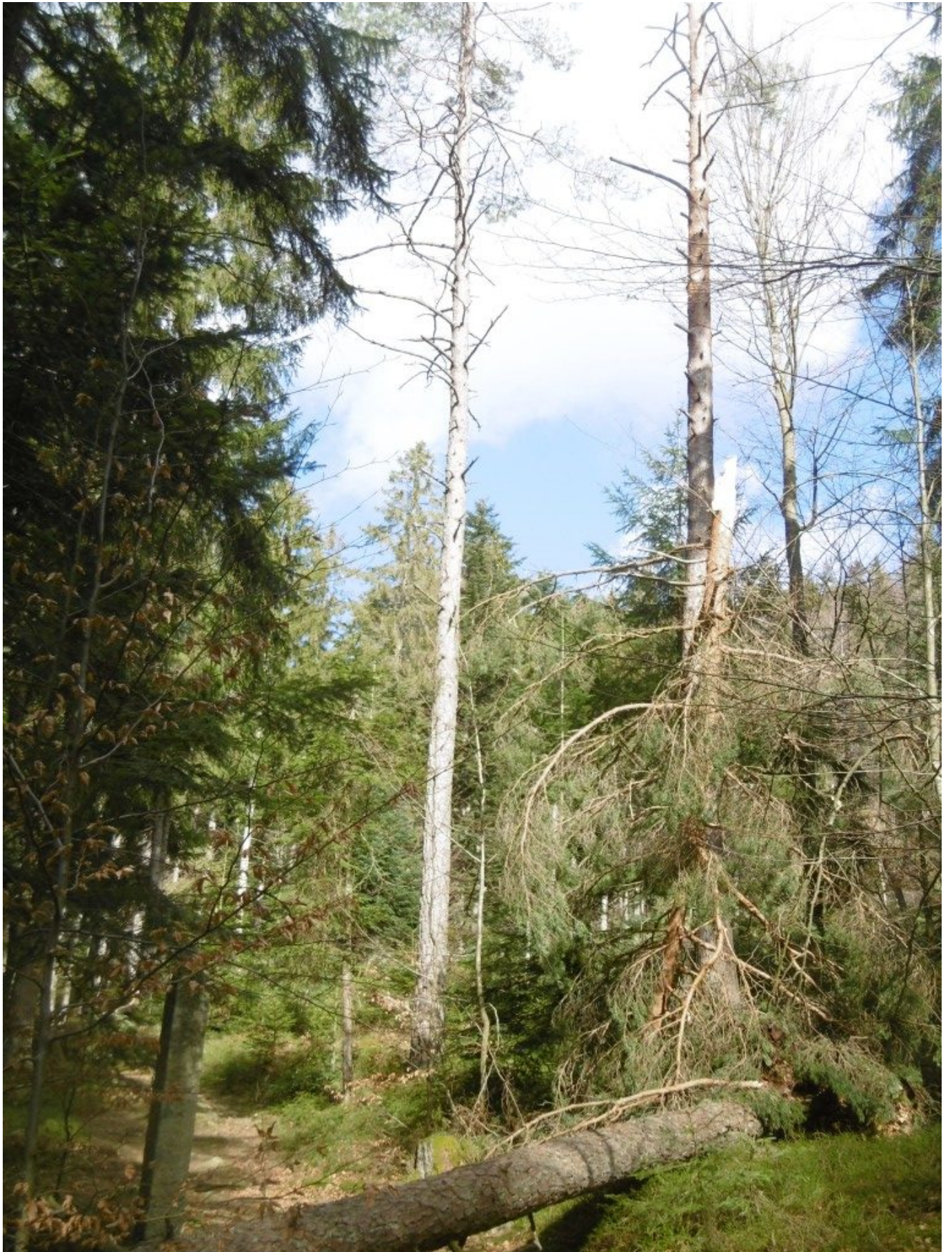
Bei anderen Bäumen ist die Spitze abgebrochen.