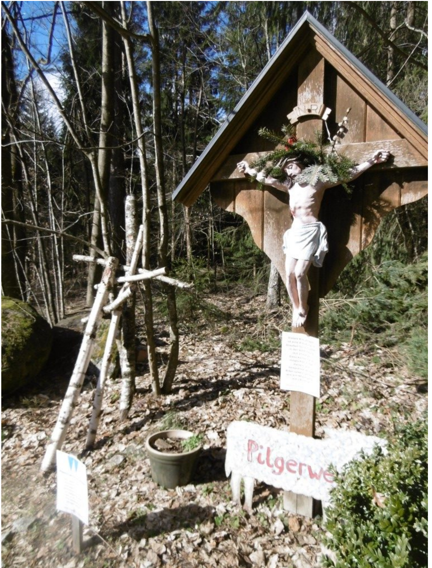
Birkenkreuze beim Einstieg zum Kreuzweg laden ein Das Kreuz beim St. Wolfgangshof oberhalb von Böbrach ist der