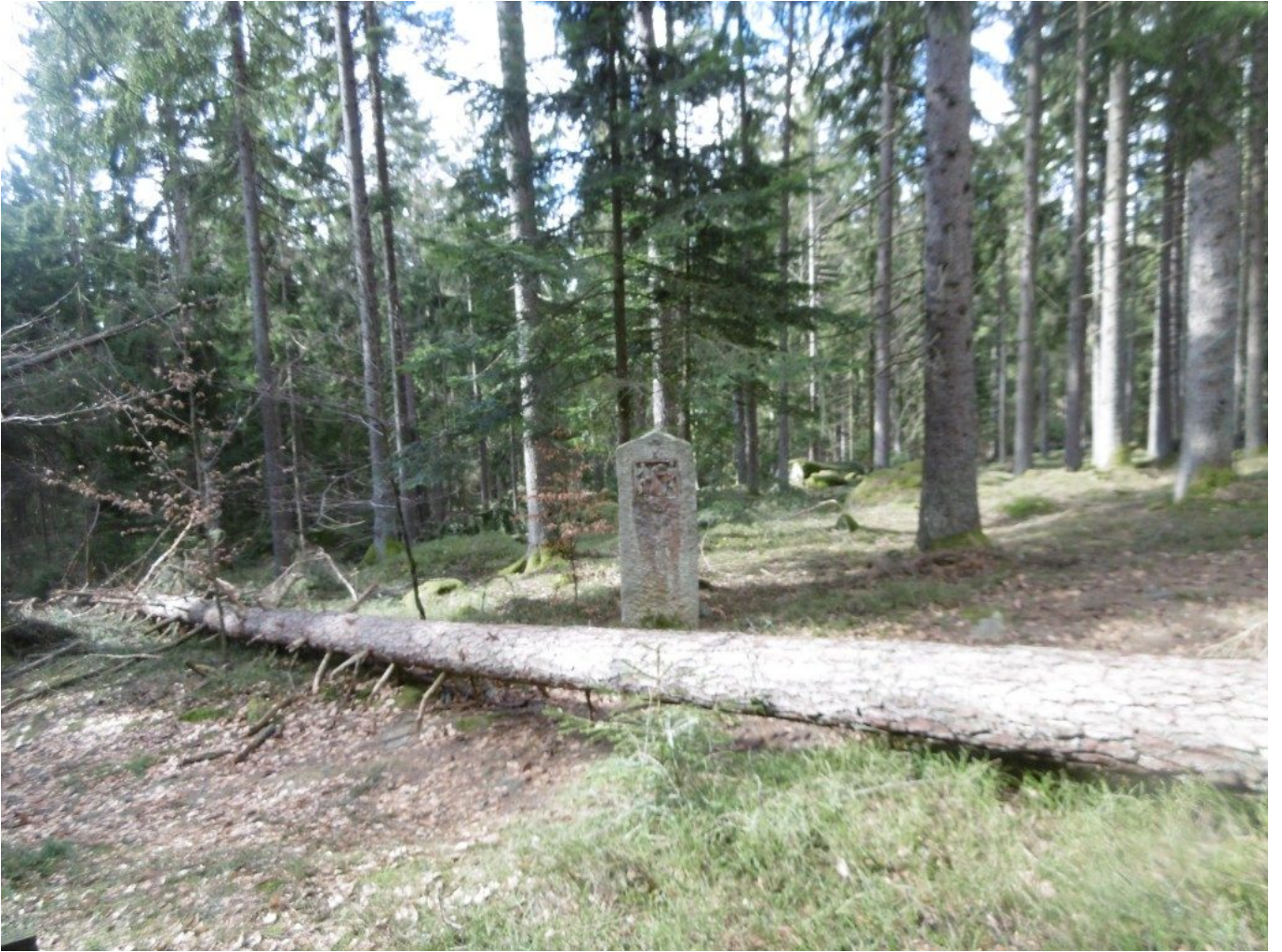
Die Kreuzwegstation aus Stein blieb unbeschadet stehen.