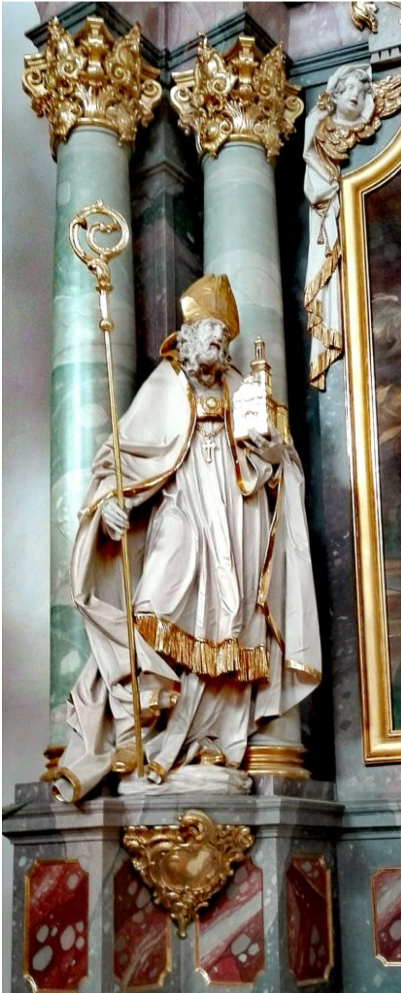
Wolfgangfigur in der