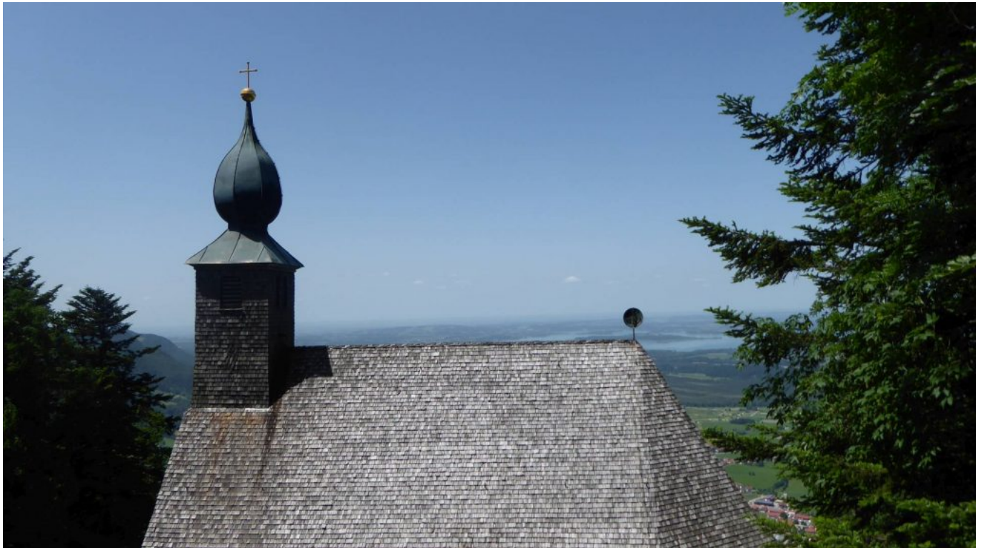
Wunderschön mit Holzschindeln unverkennbar: Die Schnappenkirche im schönen Chiemgau