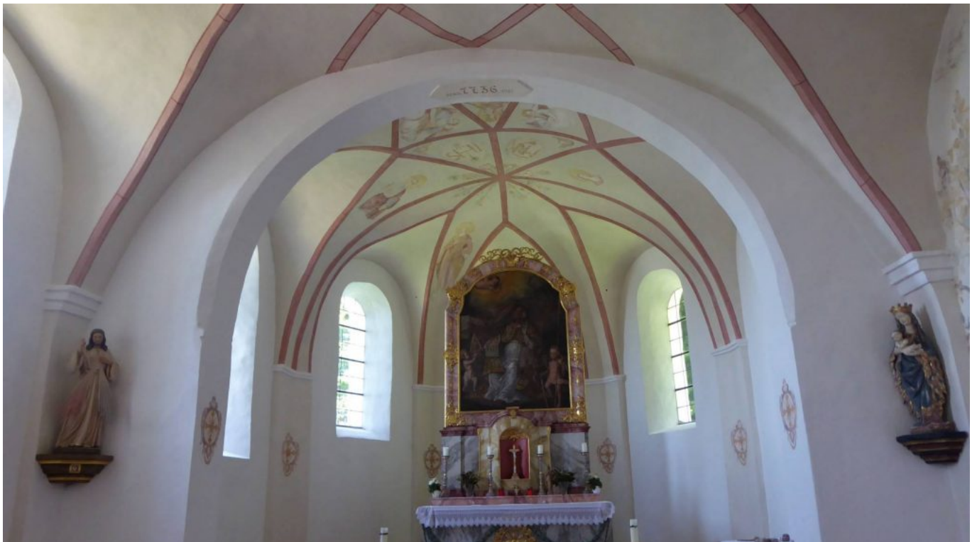
Altarbild in der Schnappenkirche: Der heilige Wolfgang, von Engeln umgeben