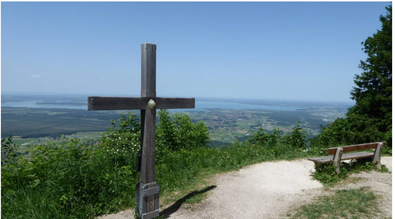
Bei der Einweihung dieses Kreuzes vor der Schnappenkirche war Rudi Simeth dabei!