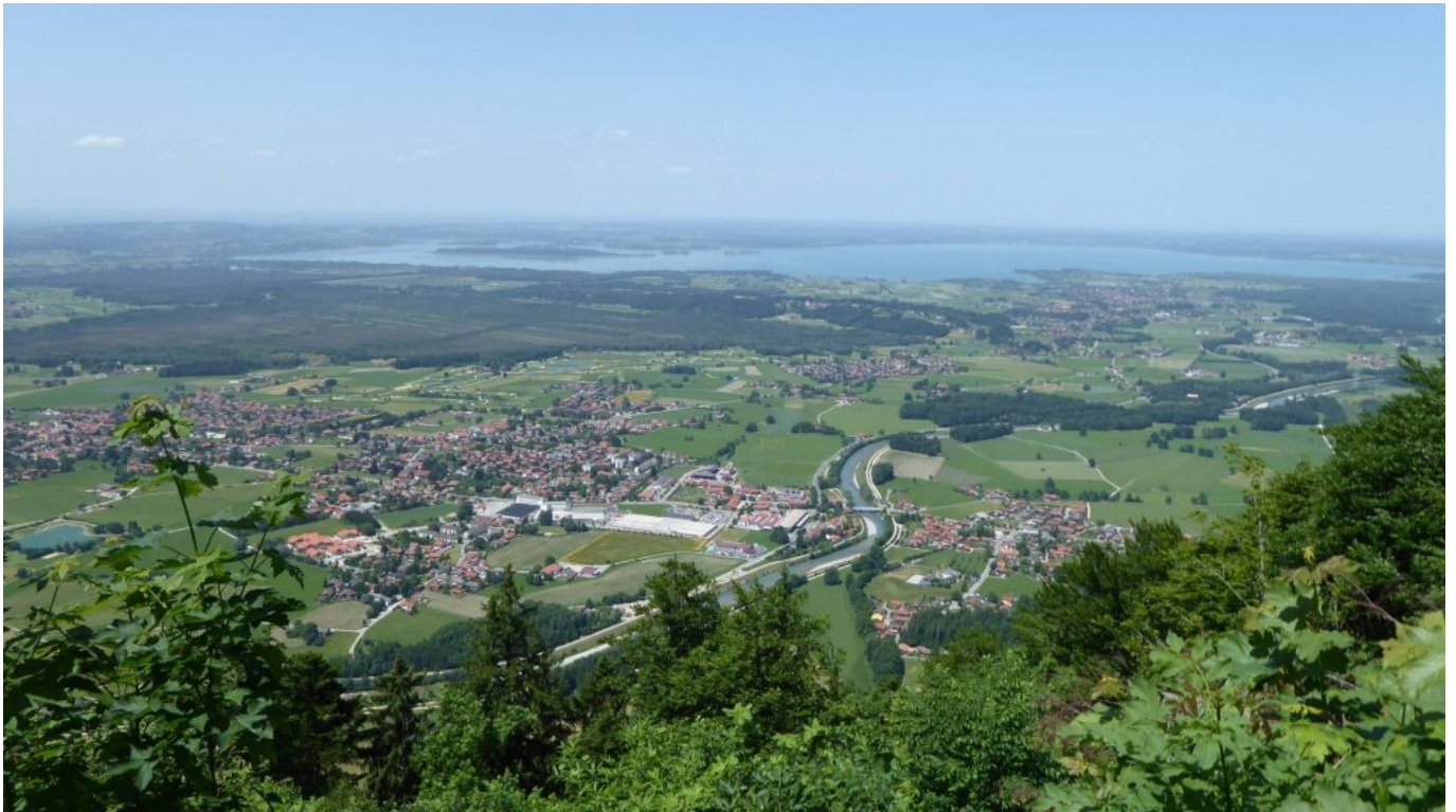
Blick von der ebenfalls dem heiligen Wolfgang geweihten Schnappekirche im schönen Chiemgau