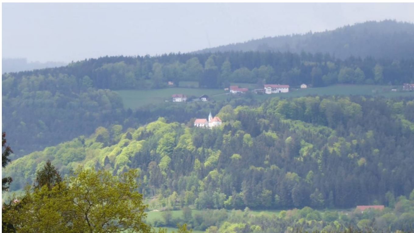
St. Ursula, Pilgramsberg

Wenn man den Wolfgangweg in acht Etappen – von der Wolfgangskapelle ausgehend bis nach Regensburg – einteilt, so ist dieser Streckenabschnitt die 4.Etappe in einer Länge von 16 Kilometern: