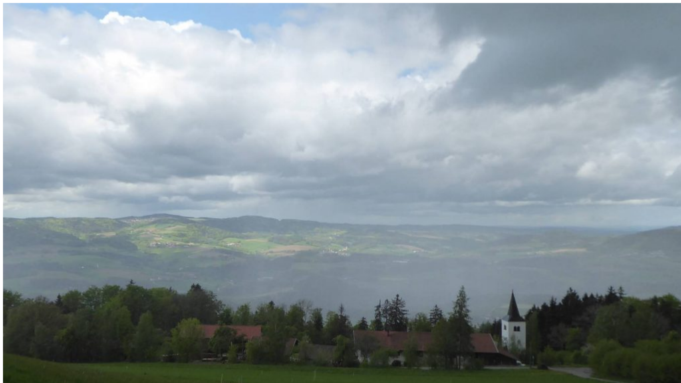
St. Sixtus am Gallner