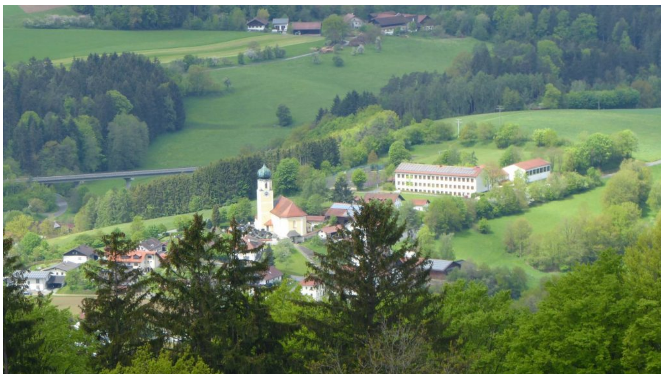
St. Michael, Stallwang