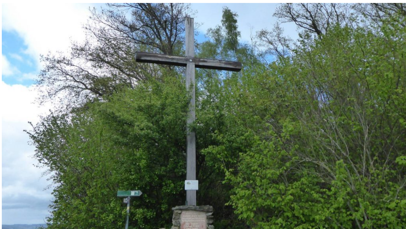
Gipfelkreuz Gallner Berg