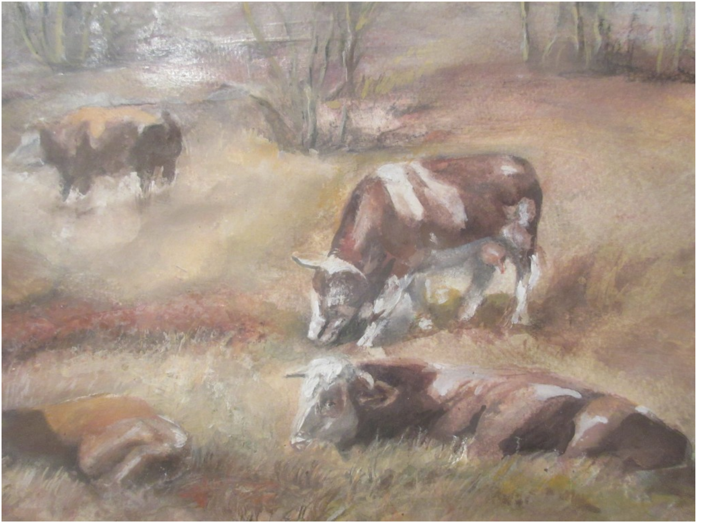
Anna : Kühe am Schachten (Ölgemälde, Detail) )