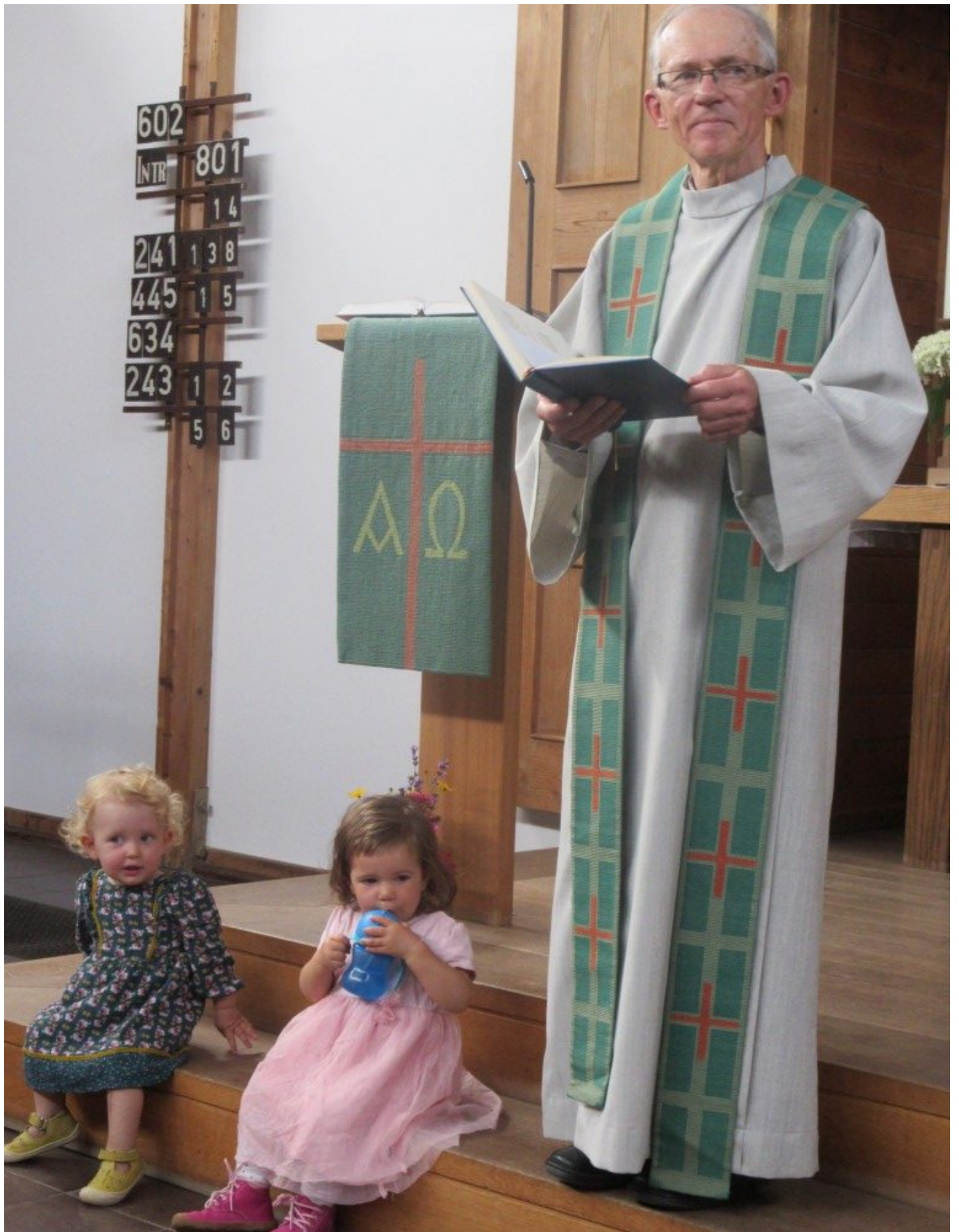
Unsere Kleinen fühlen sich im Kirchraum und in der Nähe des Altpfarrers wohl und angenommen.