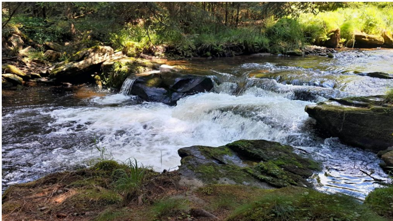
Romantischer Rotbach

Auf dem schönen Diavideo mit dem nachdenkliche Lied aus alter, armer Zeit im bayerischen Wald "Mei Hoamat" – vorgetragen von Pilger Rudi ist auch ein Blick zur Wolfgangskapelle zu erhaschen, ebenso die Erz-Wolfgangfigur am Brunnen der Böbracher Ortskirche St. Nikolaus und noch mehr fromme Orte in herrlicher Sommerlandschaft. Es lohnt sich!