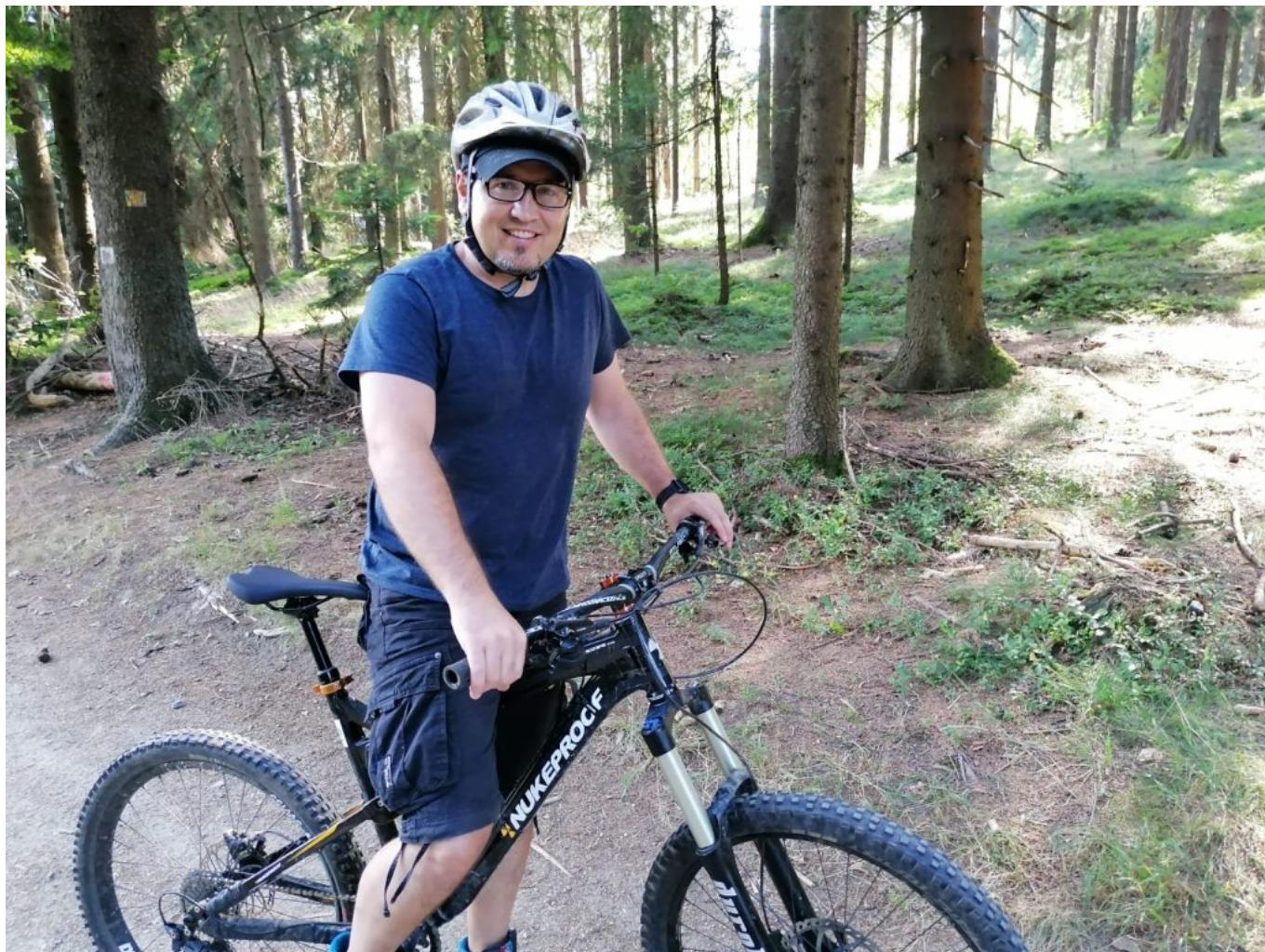
Durch den Wald