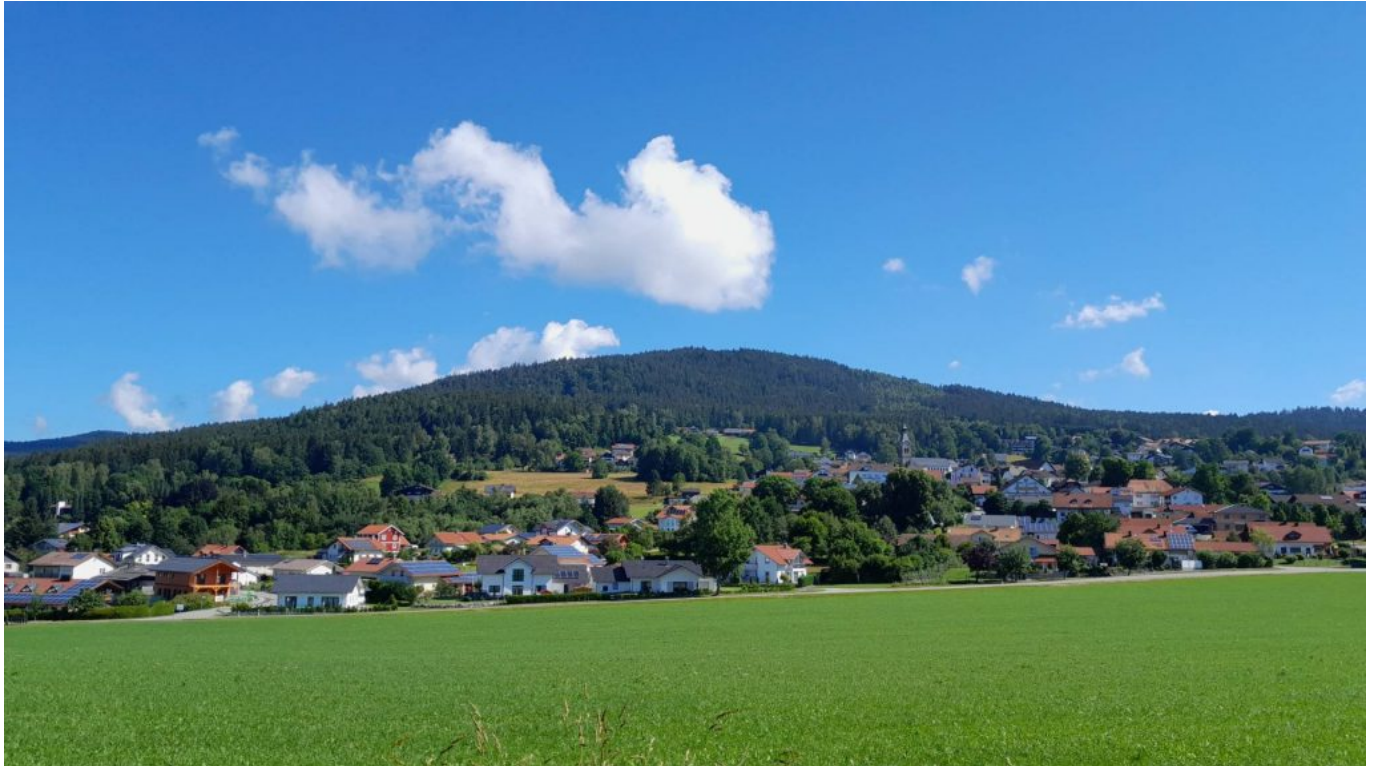
Böbrach unterm Wolfgangssriegel – Foto: Pilger Rudi Simeth

Pilger Rudi Simeth lädt am Sonntag, den 24. Juli zu einer “Heilsamen Pilgerwanderung” ein. Krönender Abschluss der Heilsamen Wanderungen 2022. Lesen sie selbst!