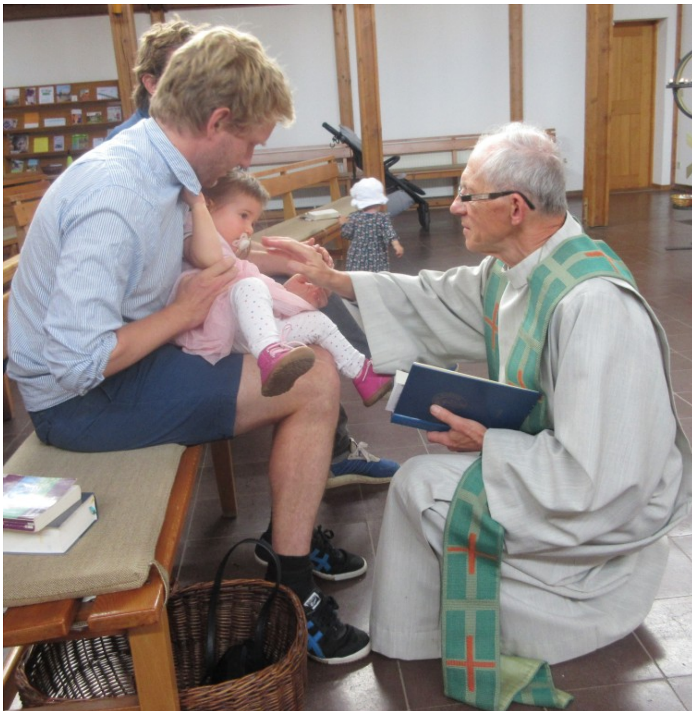
Segnung vor der Taufzeremonie (Pressefoto)