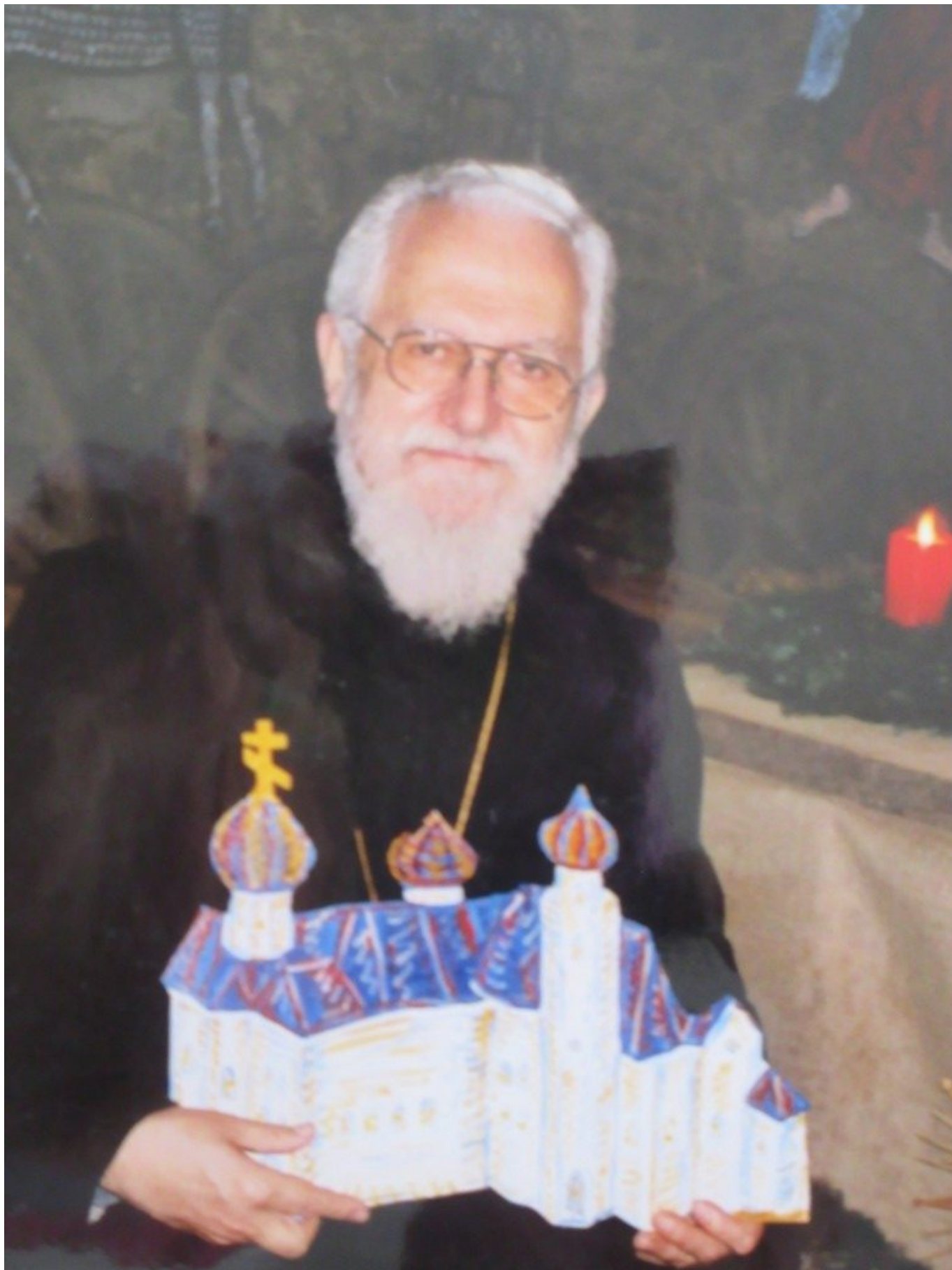
Altabt Emmanuel mit einem russischen Kloster, 2003, Blecharbeit von Dorothea Stuffer