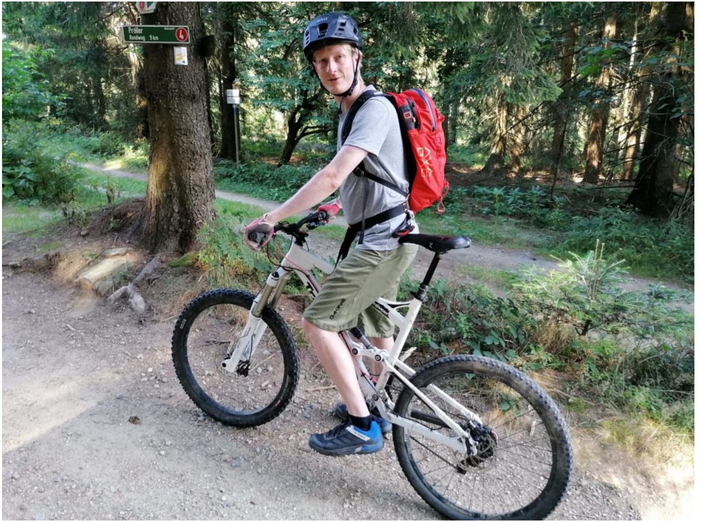
Sportlich über Schotter und so manche Wurzel