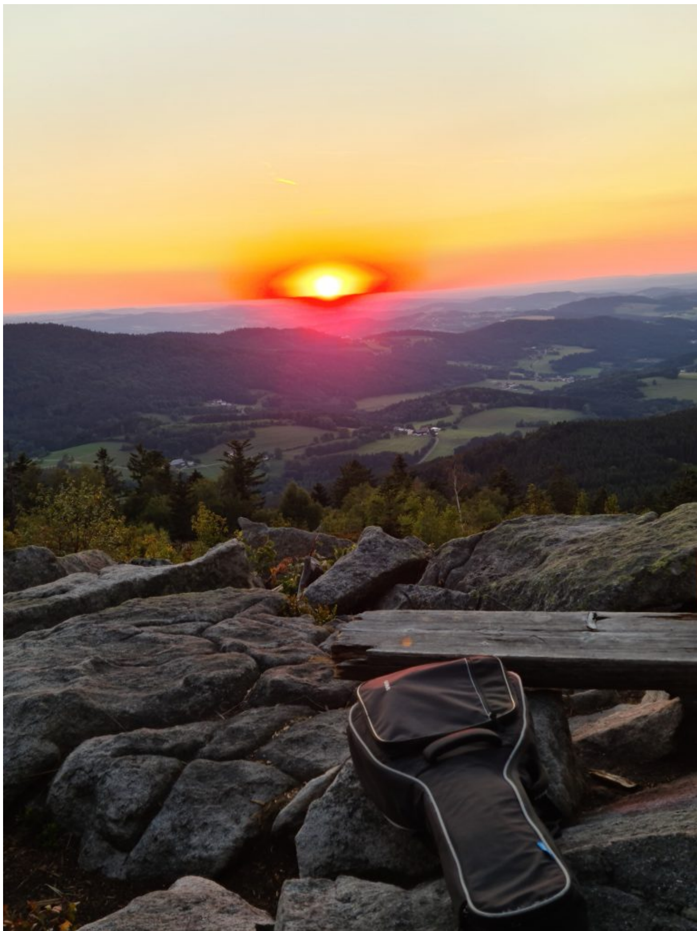
Blick in Richtung Donauebene mit Pfarrer Roland's Gitarre