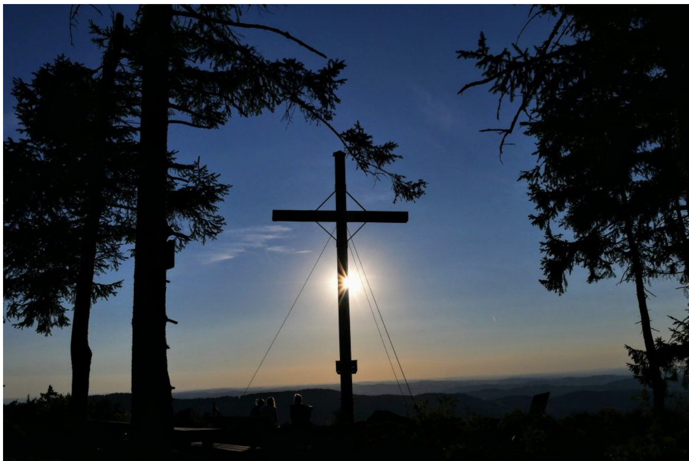
Gipfelkreuz und Licht