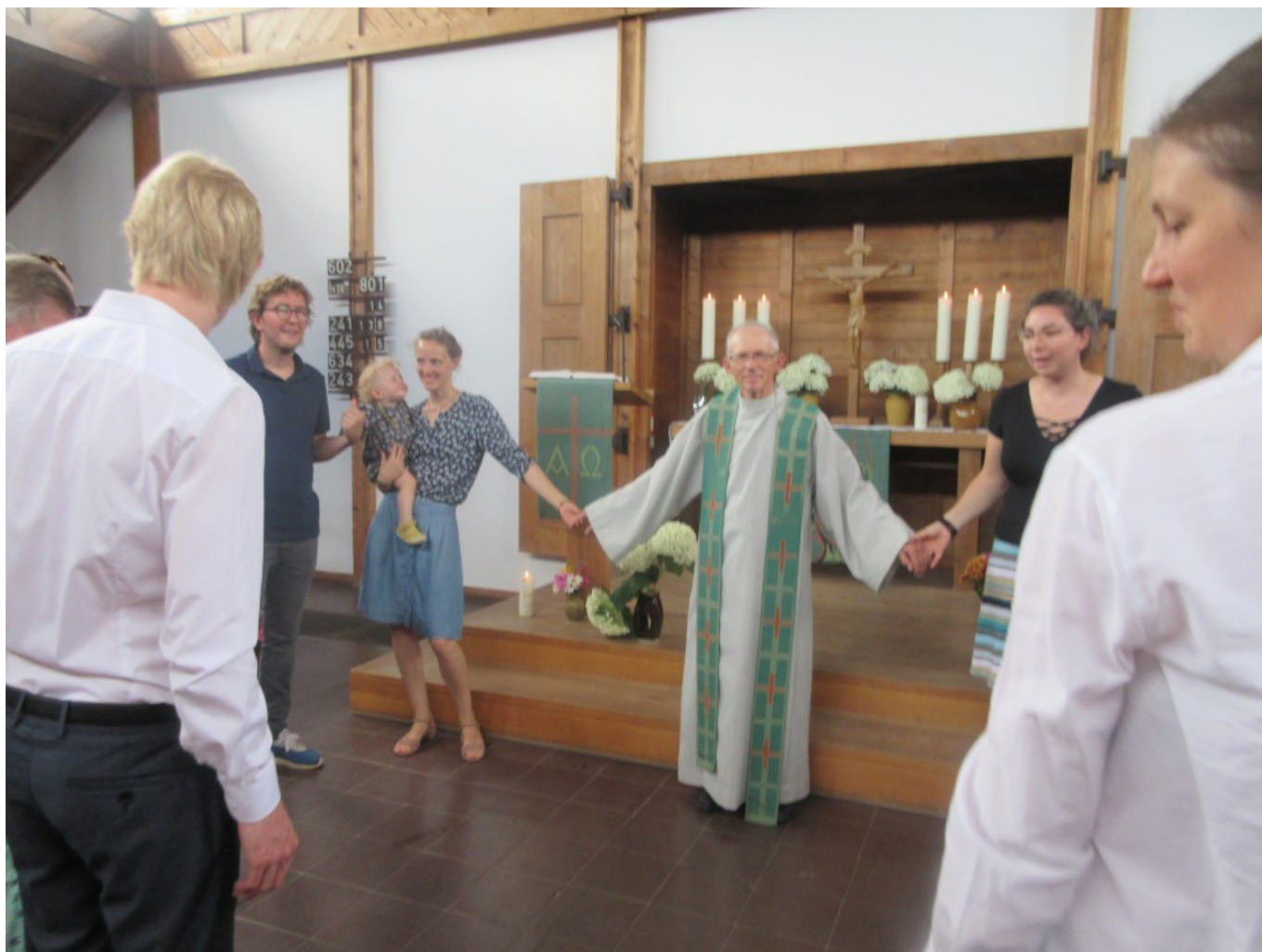
Ein gelungener und grenzüberschreitender Familiengottesdienst!