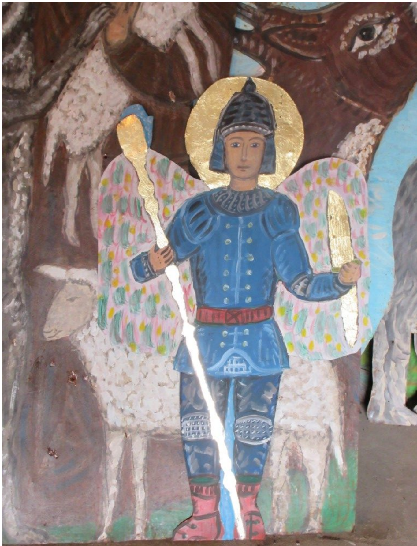
Dieser "wehrhafte Engel" aus Blech, z.T. mit Blattgold versehen, wartet in der Stuffer-Blechwerkstatt auf seinen Einsatz bei der Burgruine Neunussberg