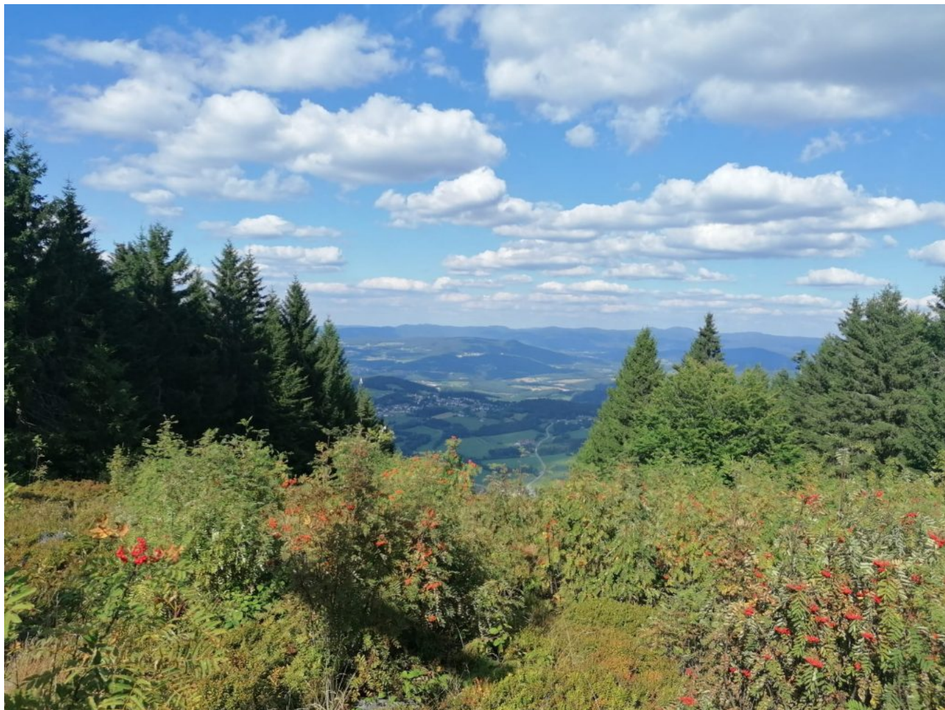
Der Pröllergipfel bietet eine herrliche Aussicht über den Bayerischen Wald