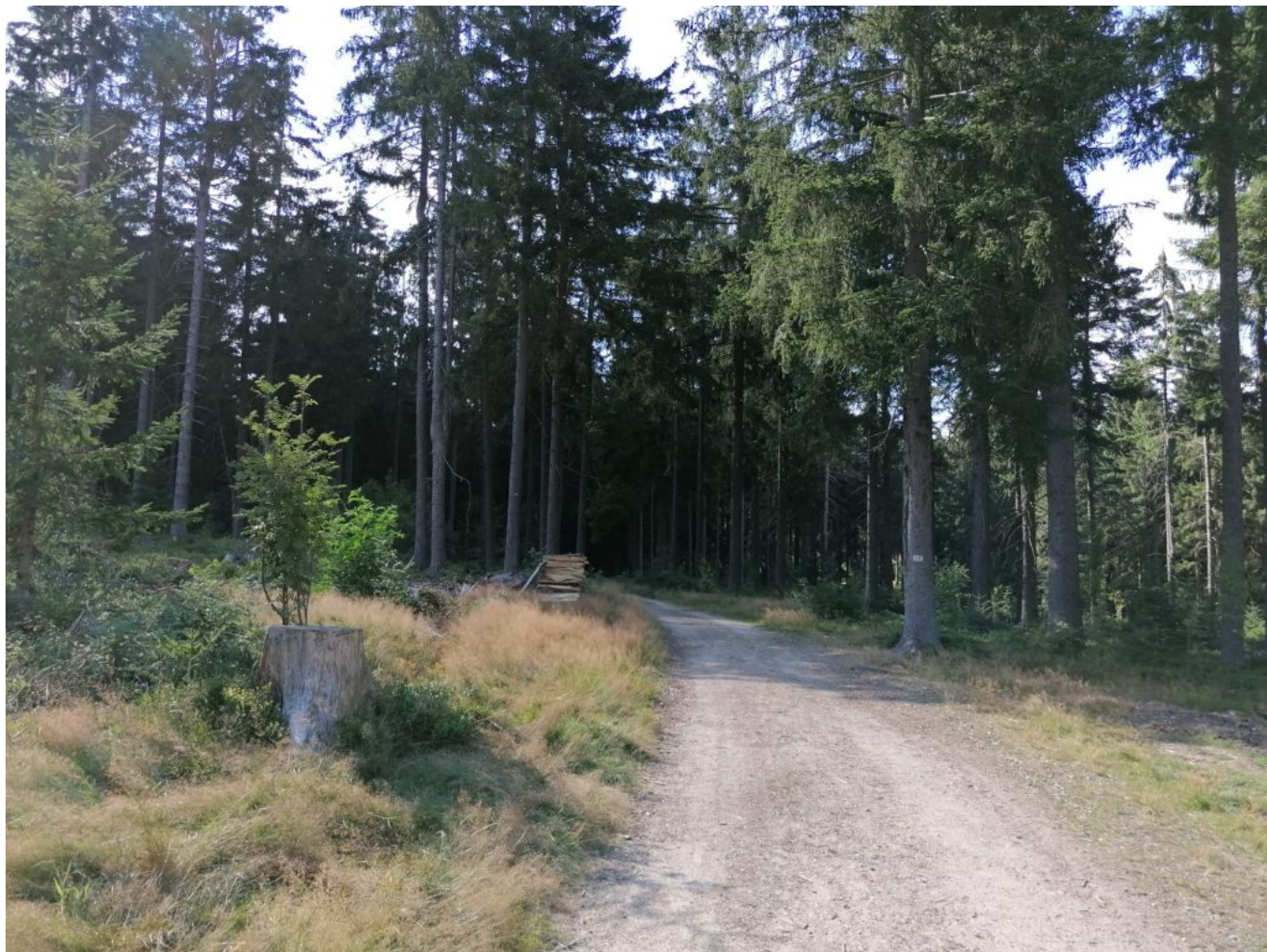
Durch den Wald zum Pröllergipfel