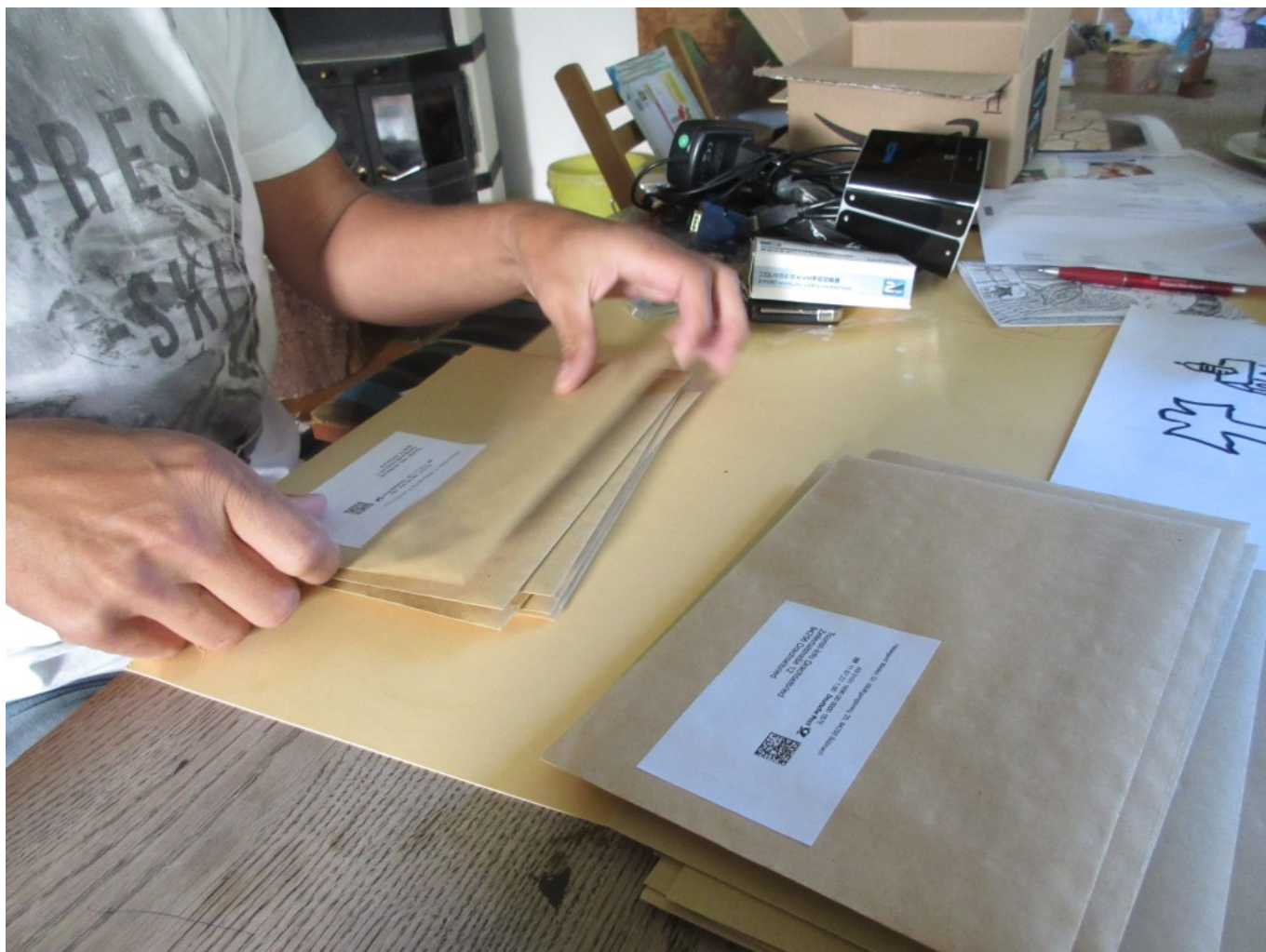
Eingetütet und mit frankierten Adressaufklebern versehen