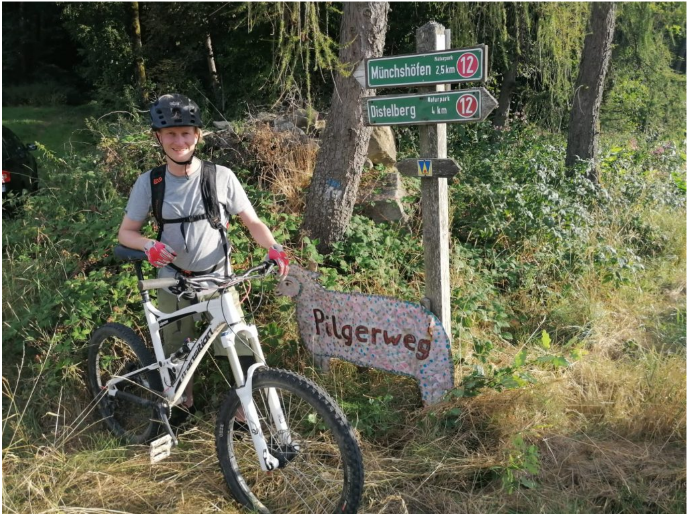
Das Wolfgangs-“W” und ein Original Pilgerschaf auf dem Waldweg Ramersdorf/Münchshöfen