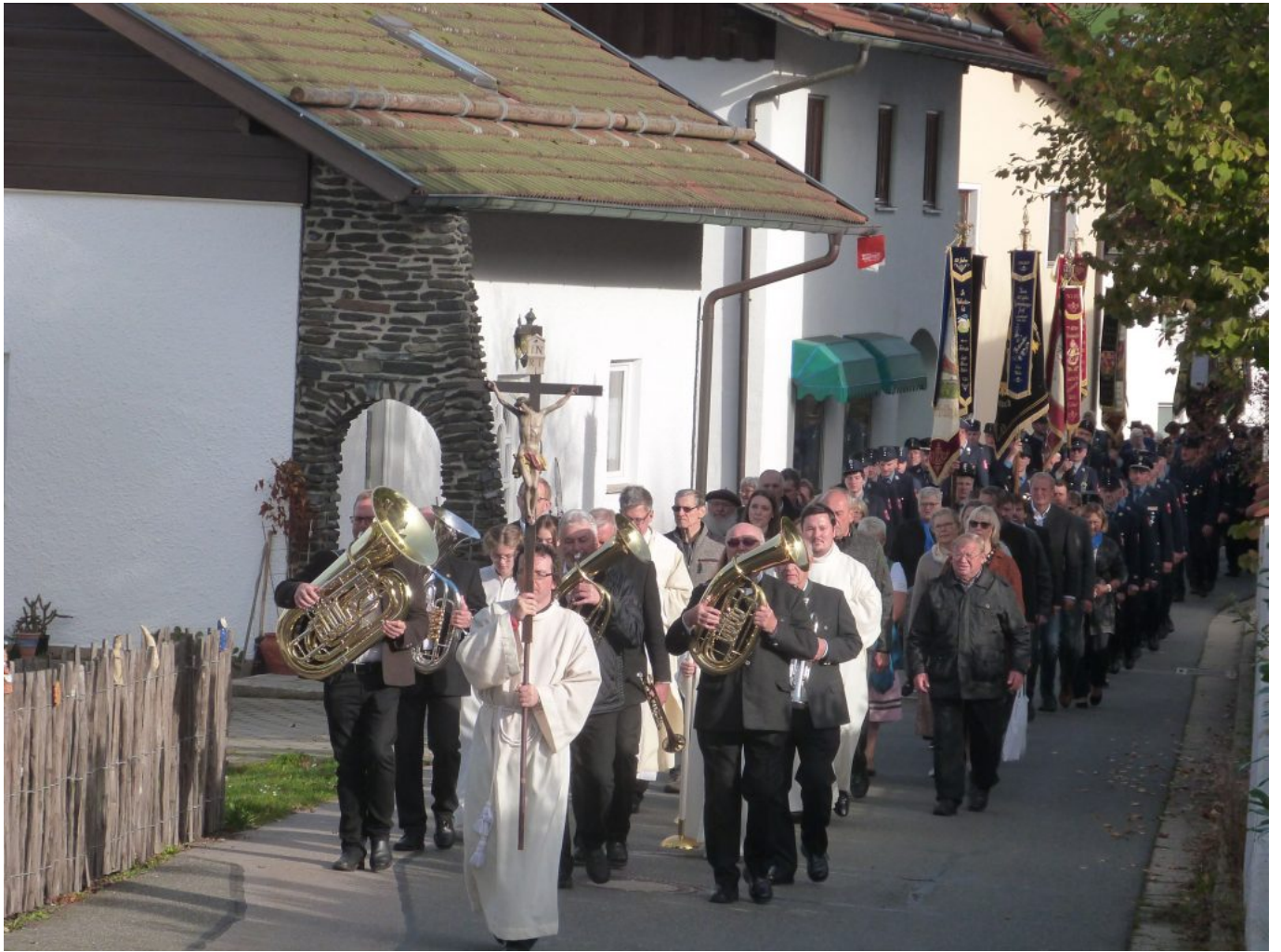
Unter den Marschklängen der Blasmusik formierte sich der Zug ab der Dorfmitte Haibühl.