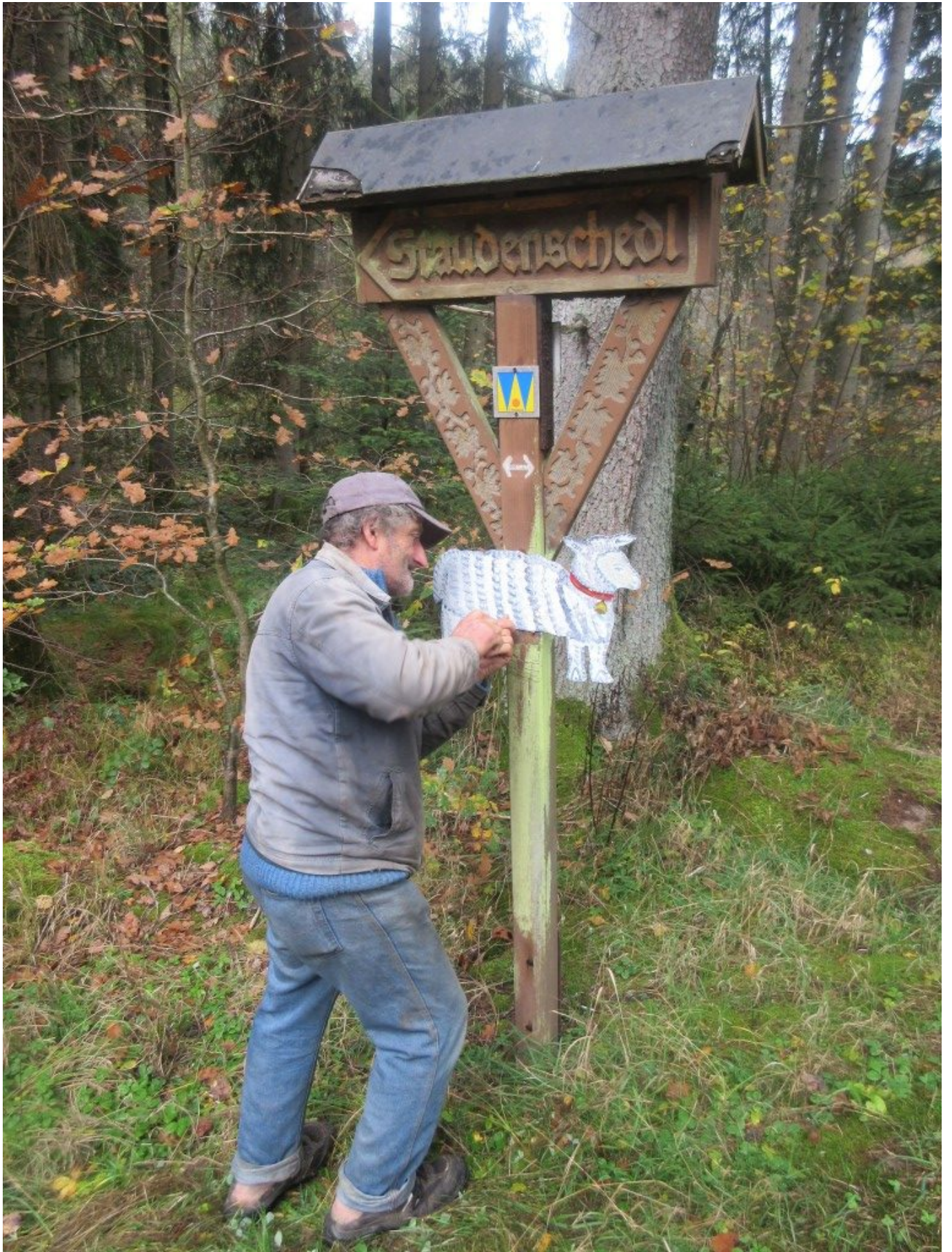
Neues Blechschaaf montieren