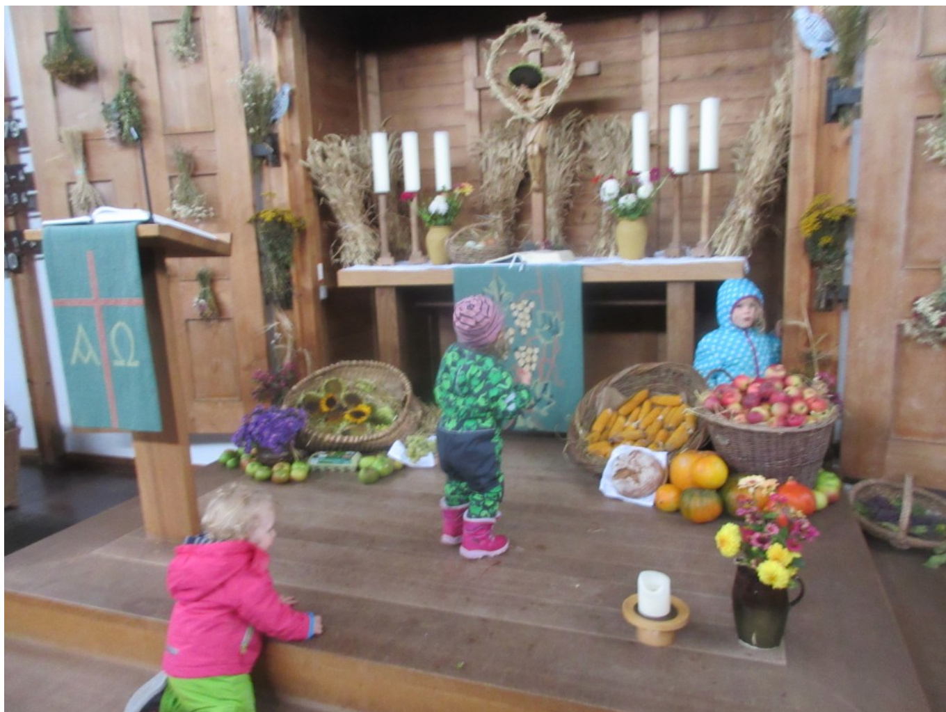
Nach dem Gottesdienst: Kinder bestaunen den Erntedank-Altar