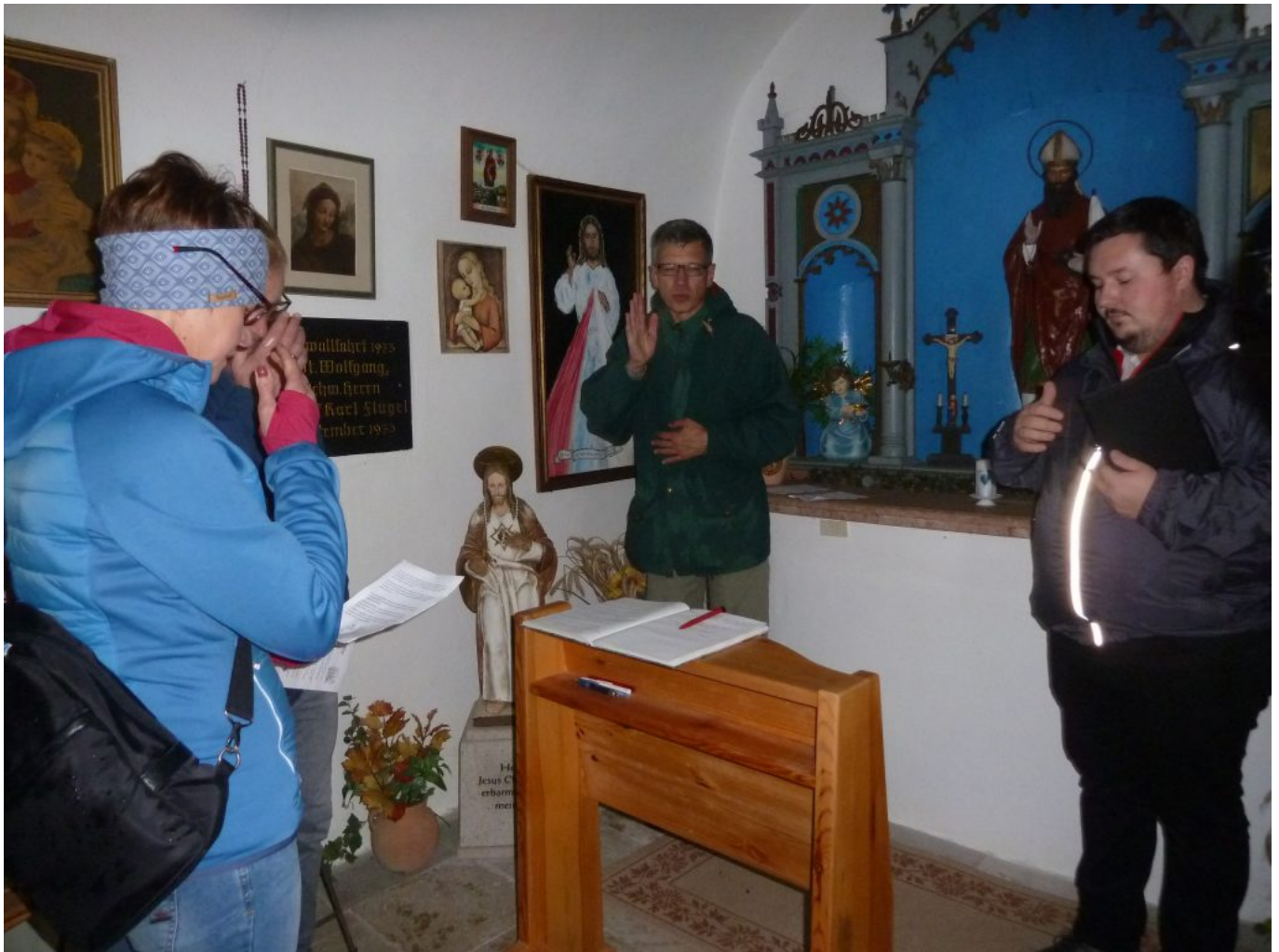
Besinnlich in Gebet und Andacht

völkerverbindende Heilige hat einmal mehr seine Strahlkraft bewiesen und die beiden Wolfgangsorte Böbrach und Haibühl zusammengeführt.