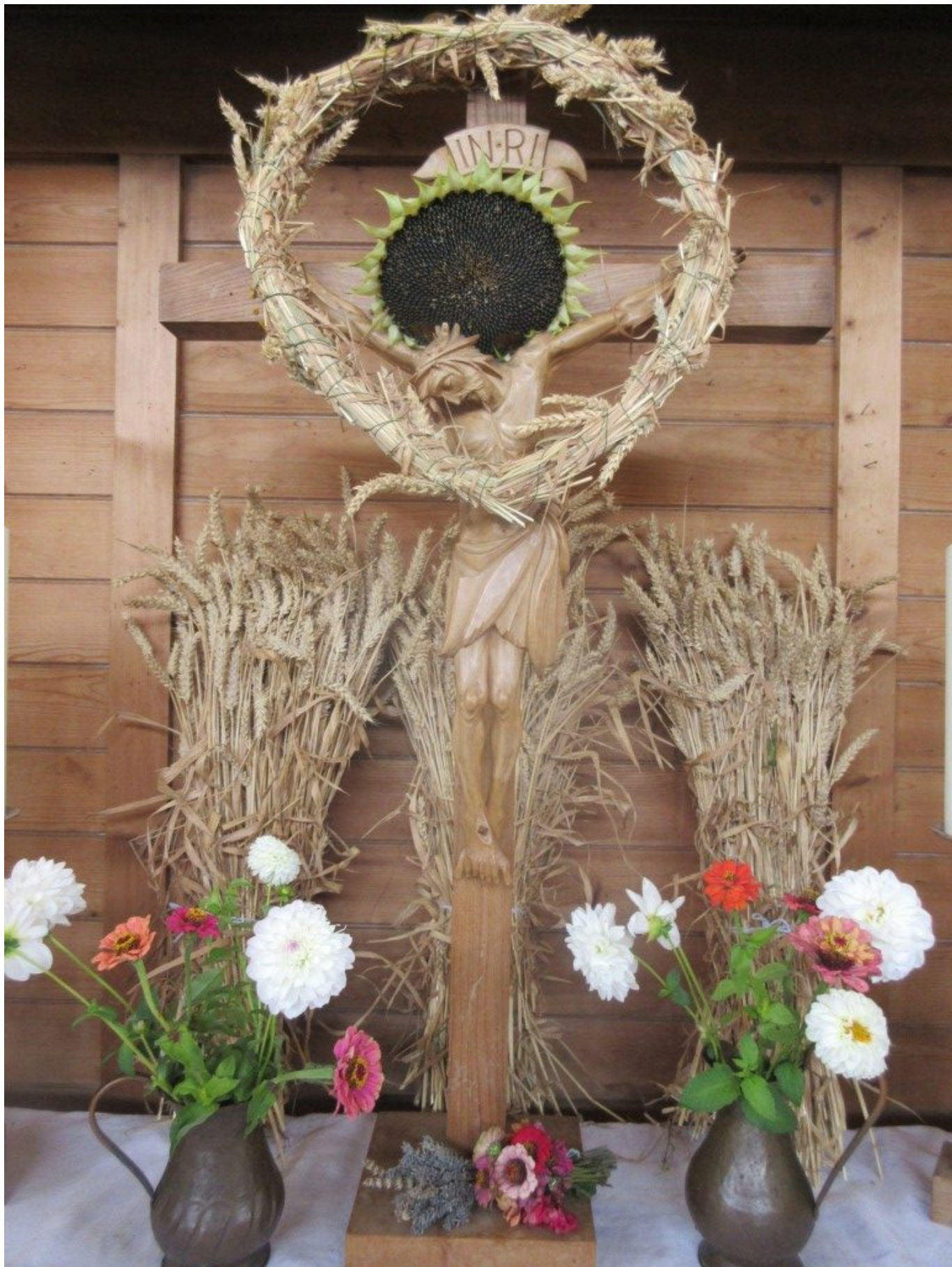
Geschmücktes Kreuz an Erntedank