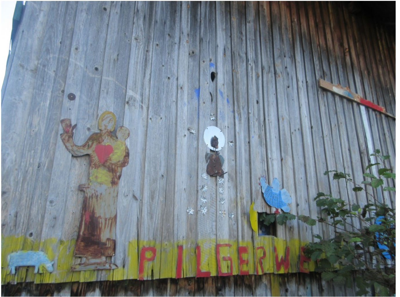
Lustige Bemalung einer Hütte in Großenau