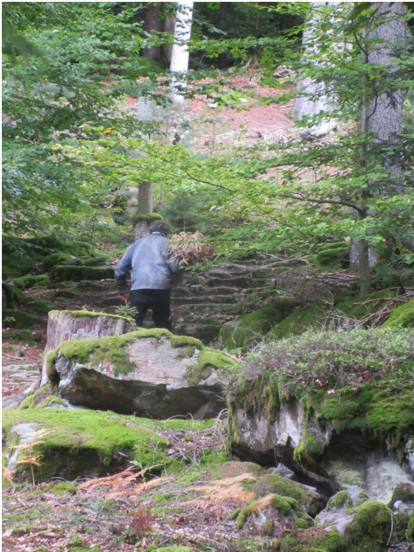
Für das Erntedankfest am Sonntag trägt Xaver eine Bund Kornähren über die steile Treppe des Kreuzweges zur