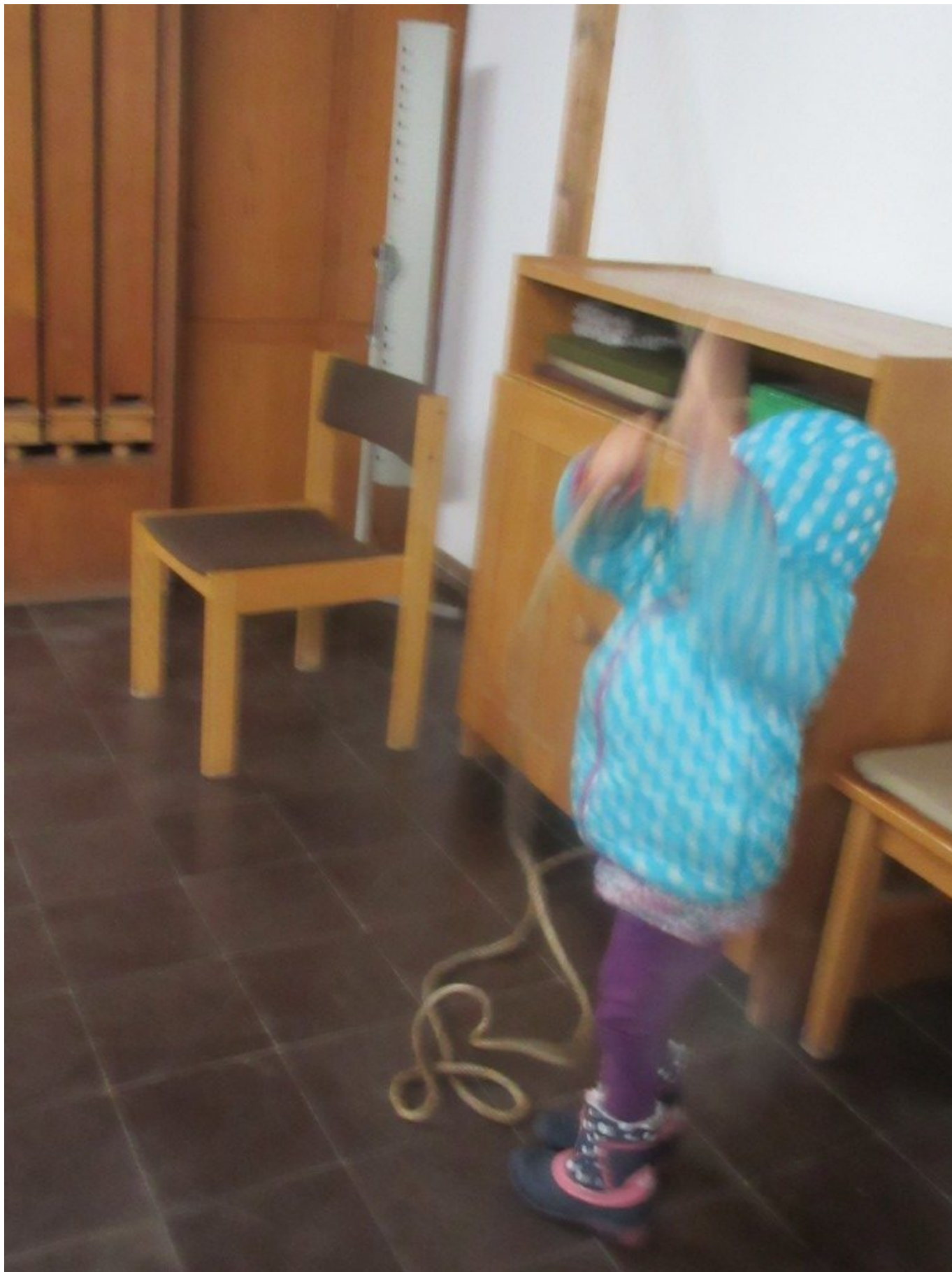
Das Glockenläuten mit dem Seil muss geübt sein – hier ein junges Naturtalent am Werk!