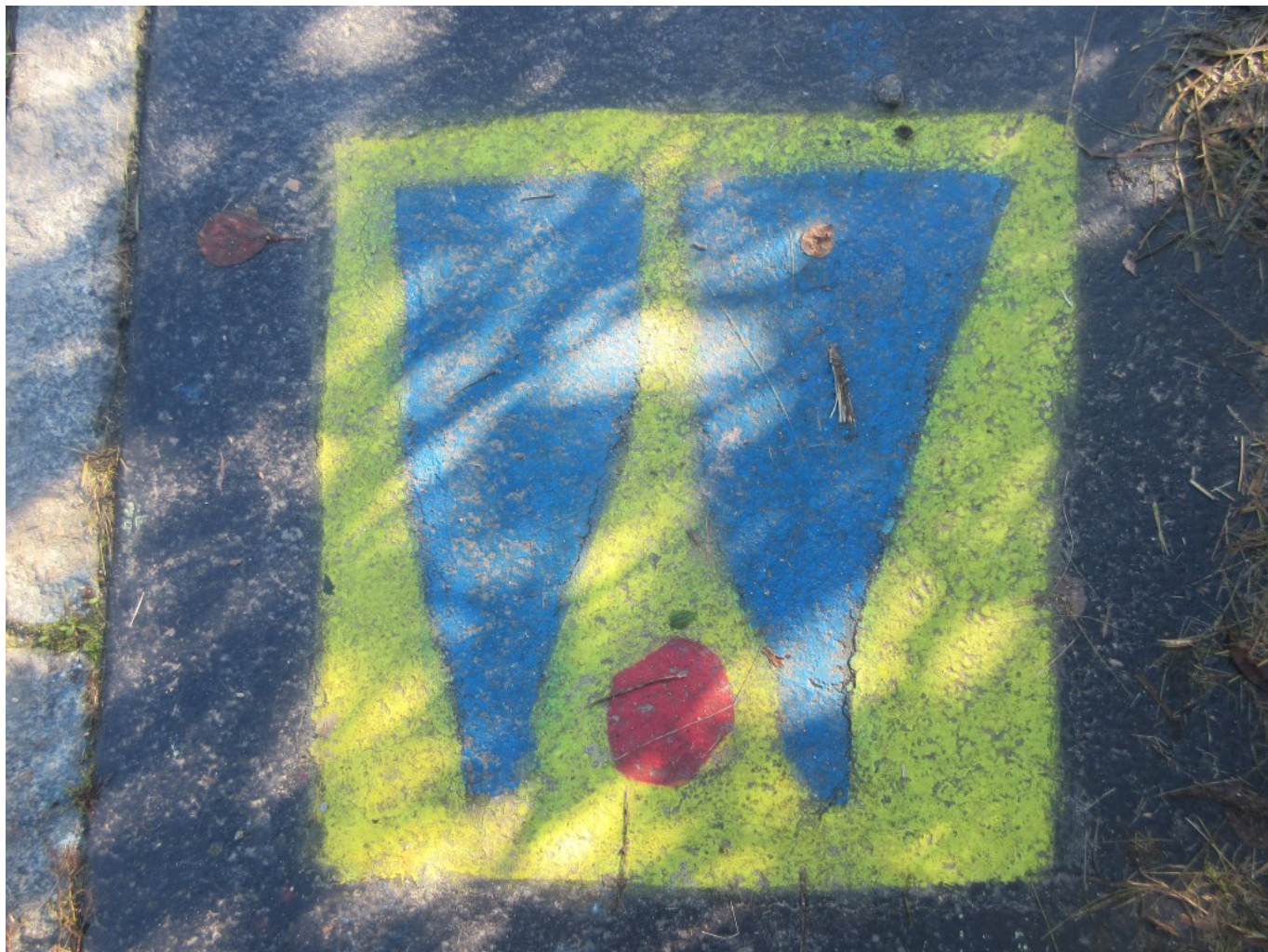
“W” in Großenau am Gehsteig