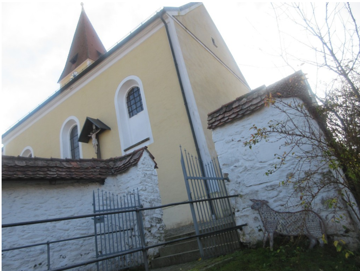
Schaf an der Kirchmauer in Schönau