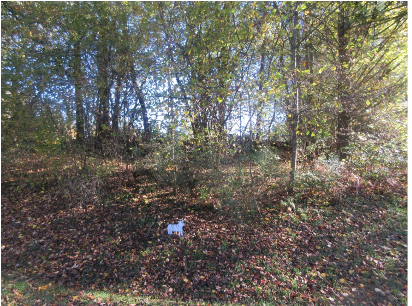
Dieses kleine Schaf markiert die Wegstrecke weiter nach Staudenschedl