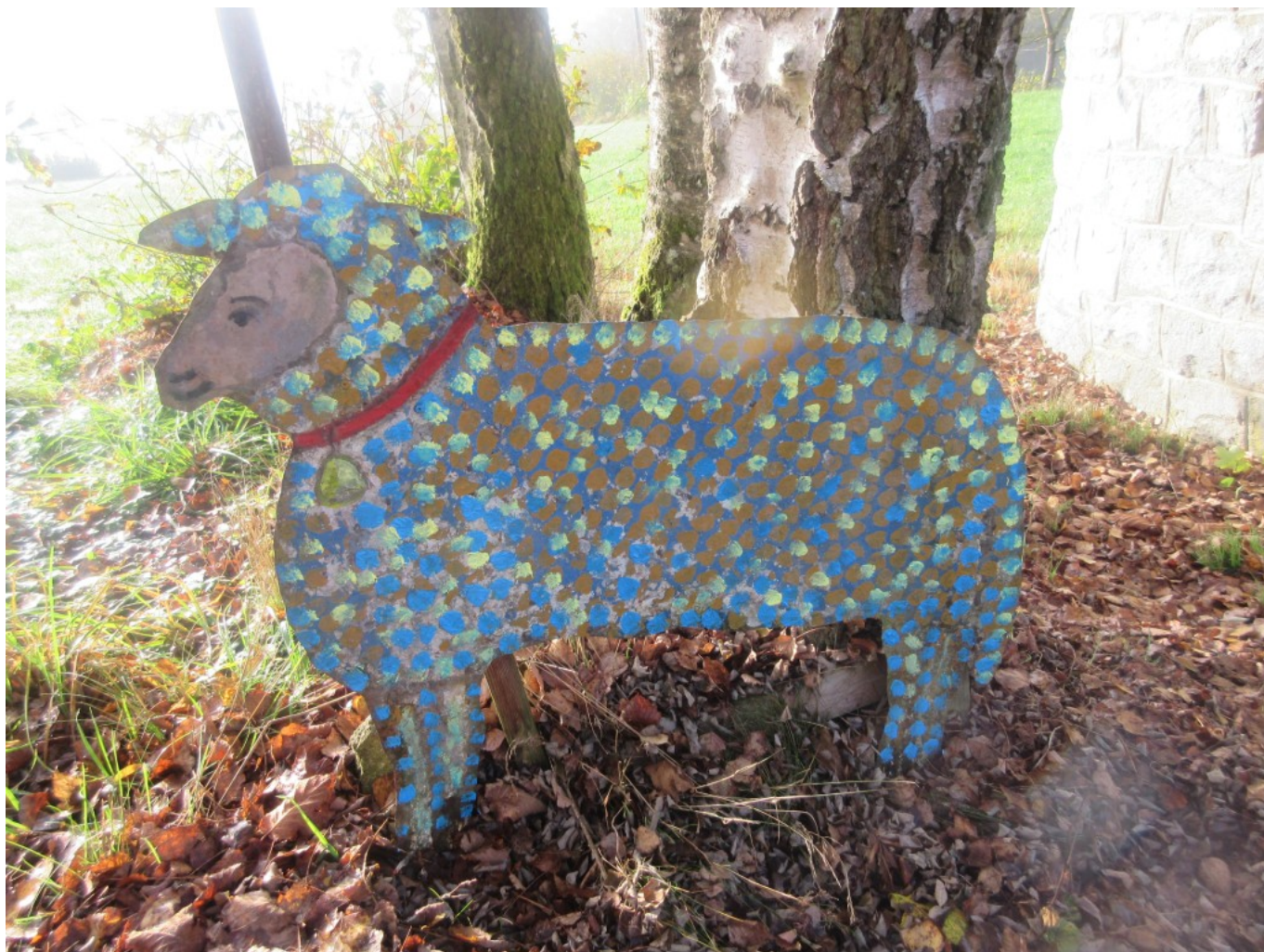
Gstadter Kapellenschaf neu aufgefrischt