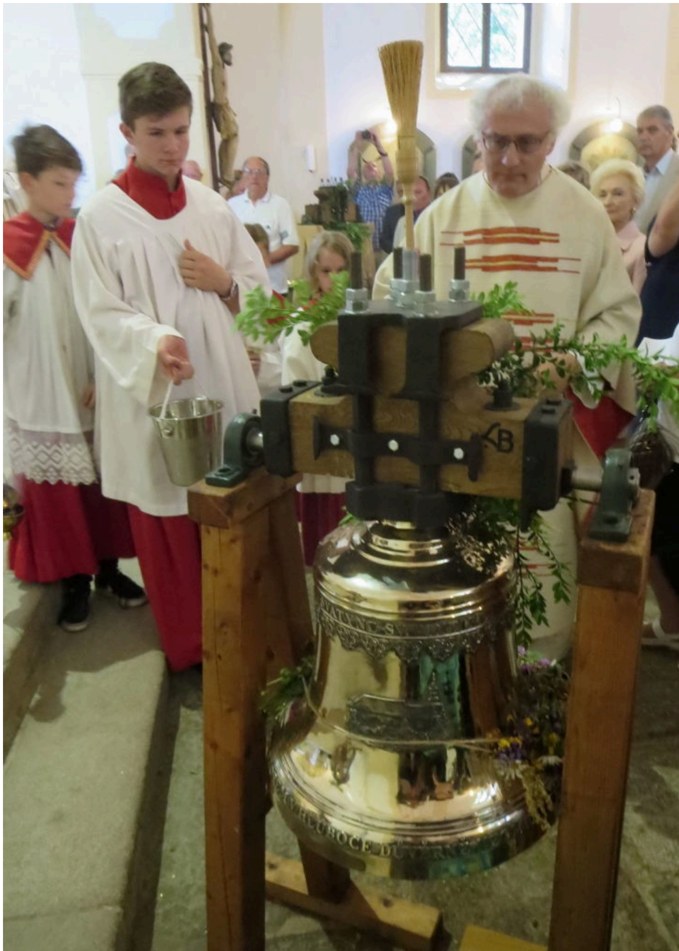
Feierliche Glockenweihe im letzten Jahr