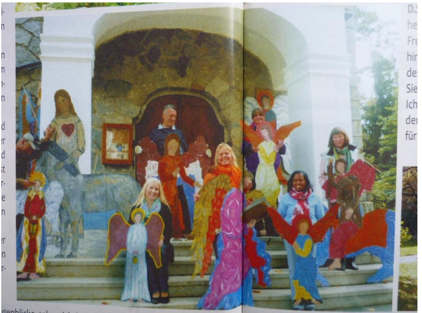
Engelweg-Aufbaugruppe Verein Pilgerweg St. Wolfgang vor der