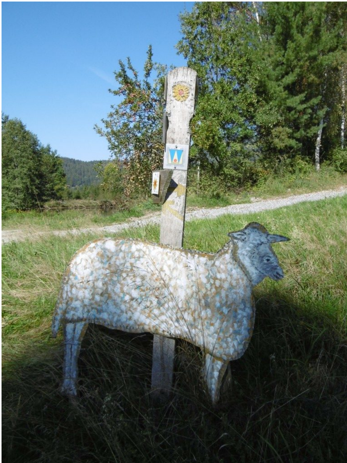
Bei diesem Schaf ist er Einstieg zum „Sonnenblumenweg“