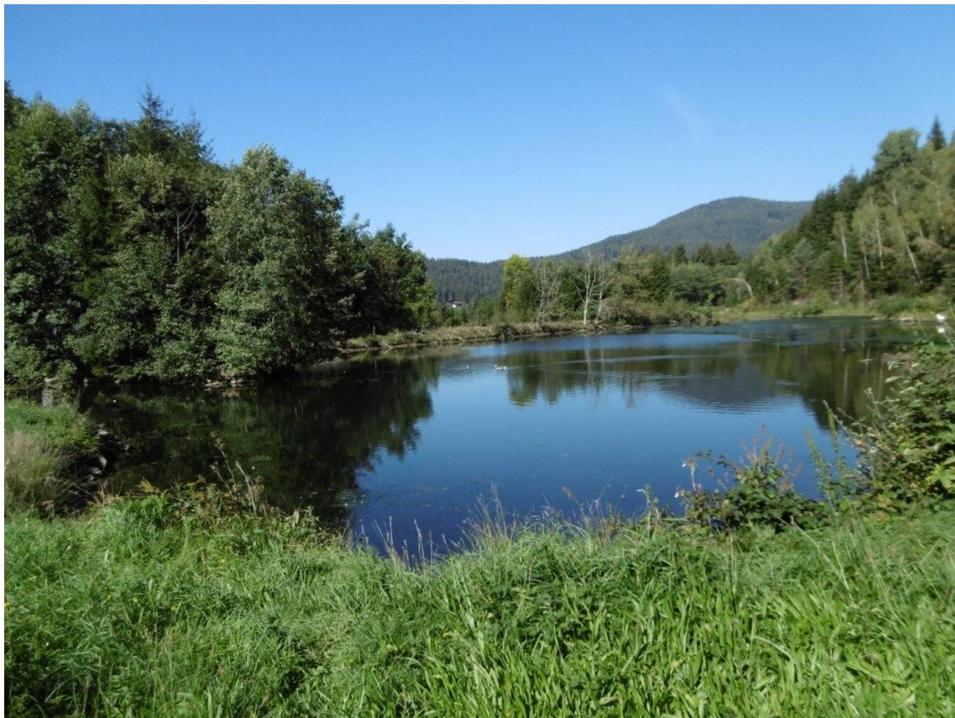
Teich mit Wasserkanal und Enten- es geht immer am Wasser entlang