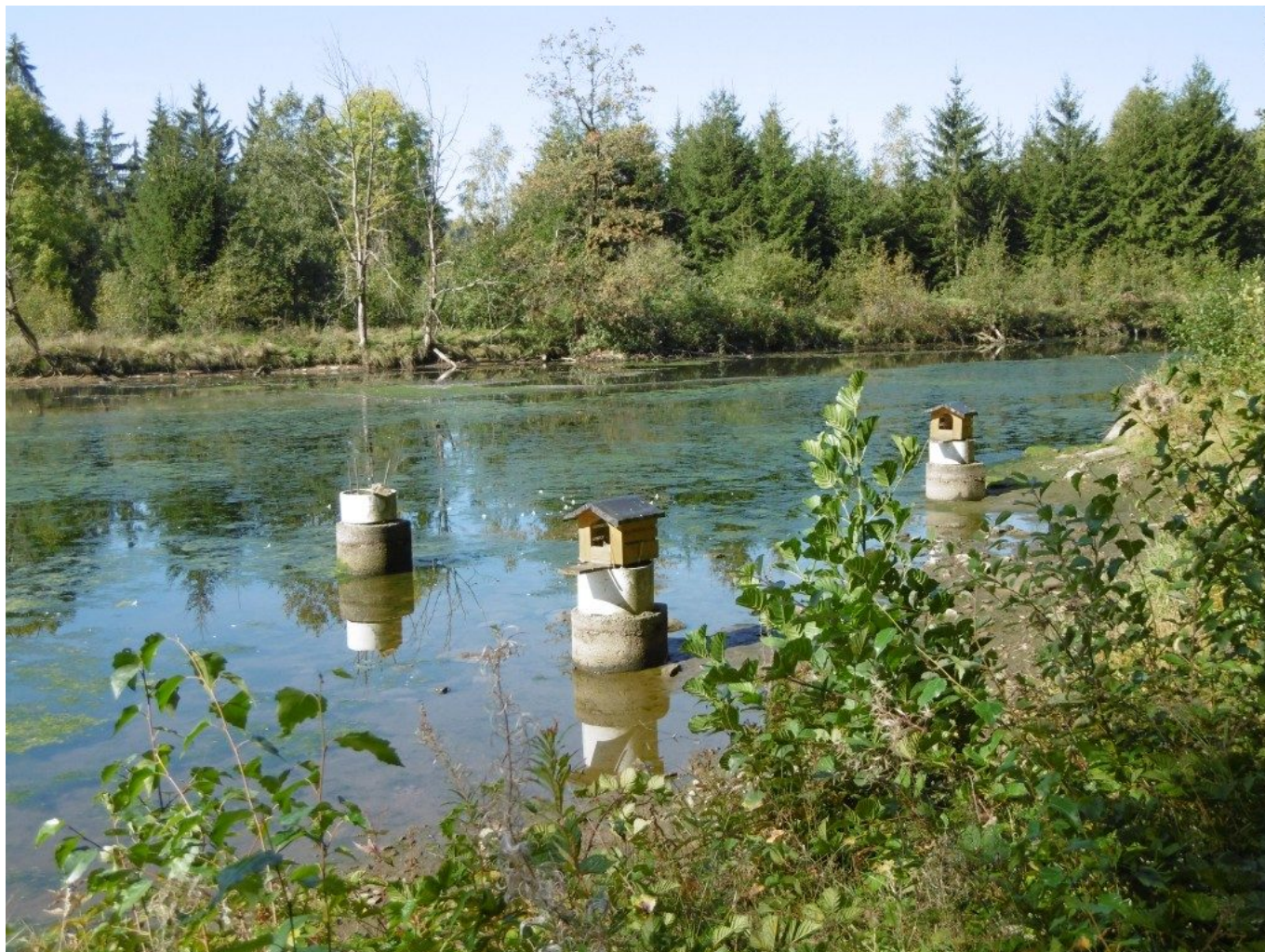
Nette Enten-Häuschen für die Enten