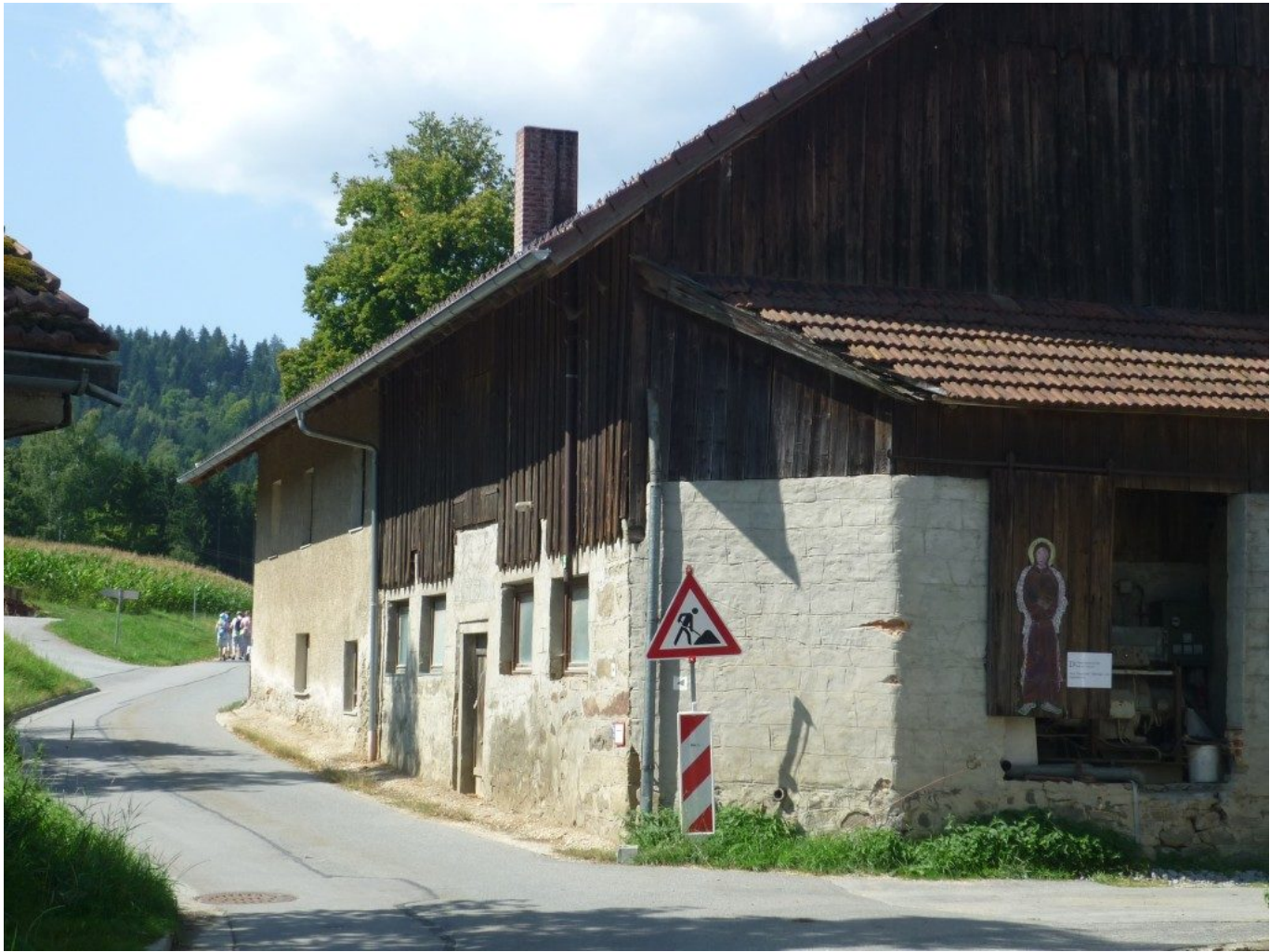
Auf dem Weg nach Hof