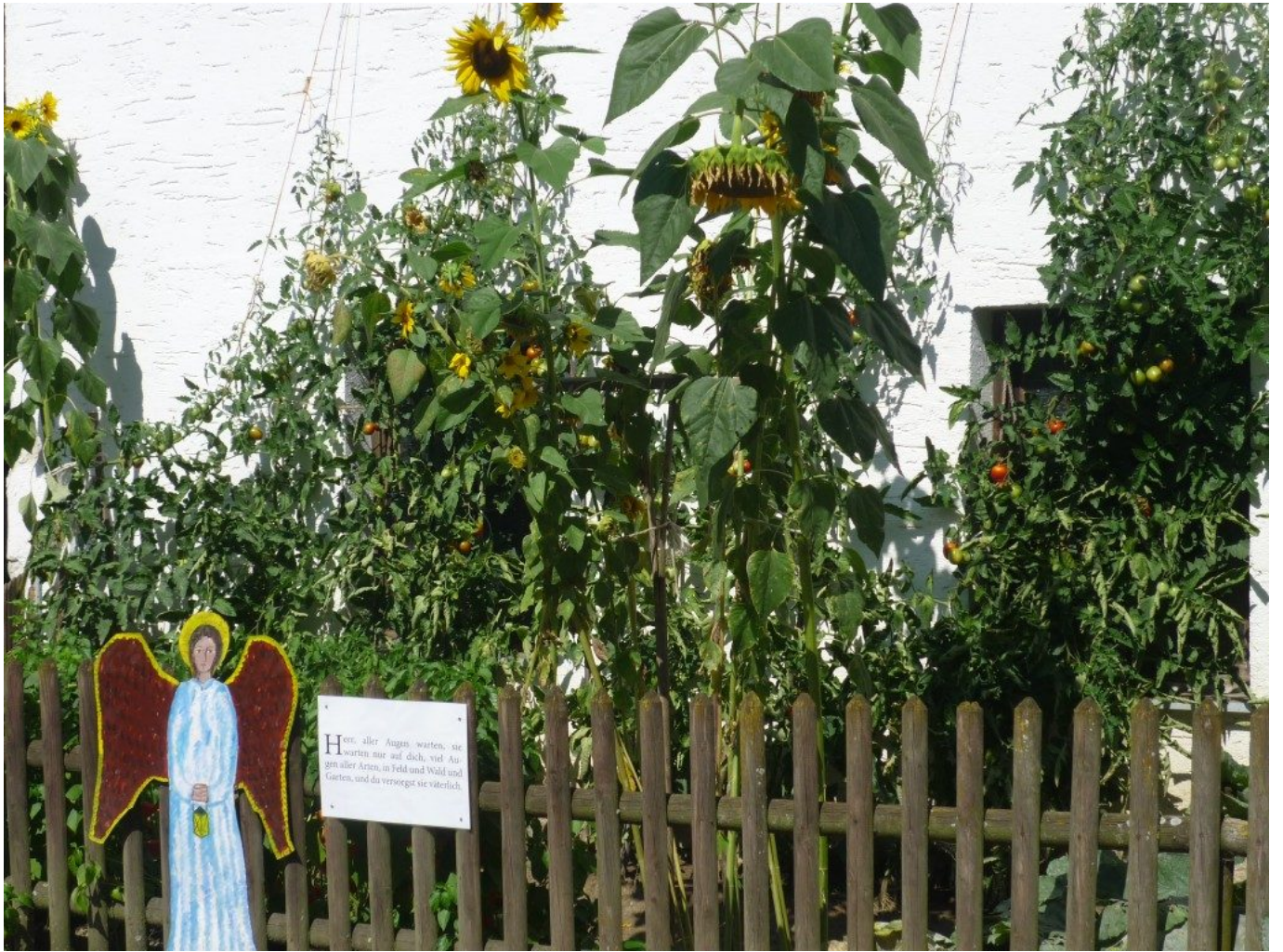
Schöne reiche Gärten