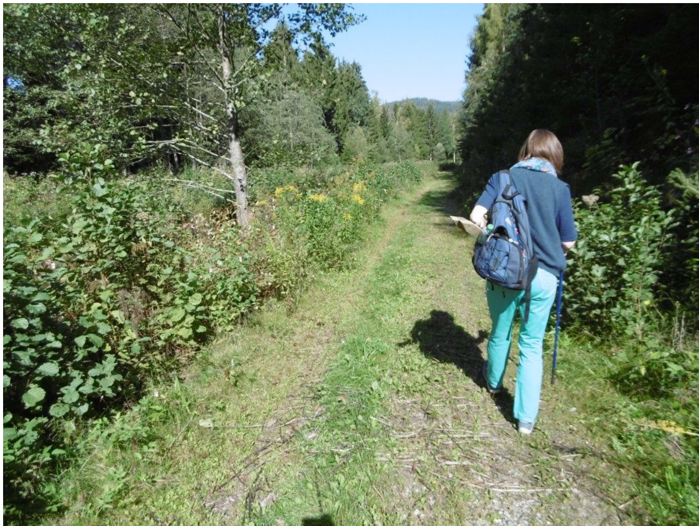
Der Weg verläuft eben dahin