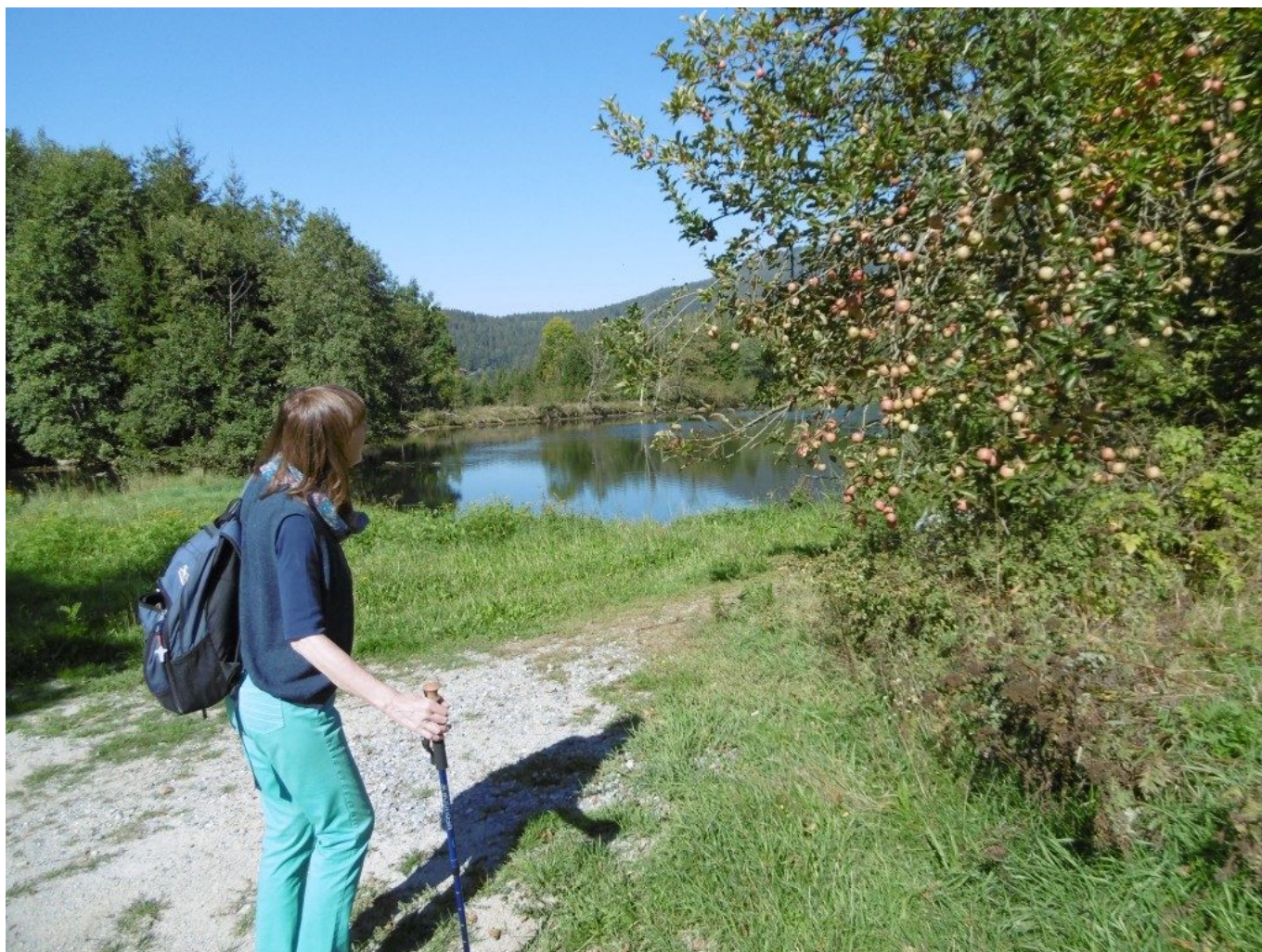
Reich beladener Apfelbaum zur Begrüßung und Wegzehrung