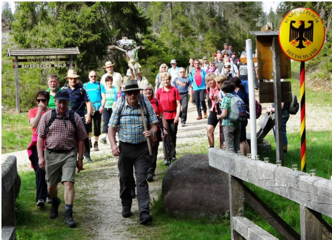
Wallfahrer in Böhmen