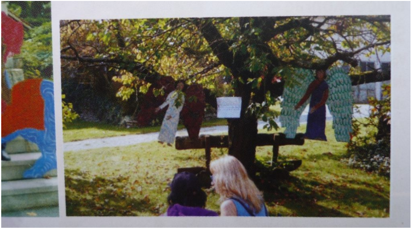
Zwei Engel im Apfelbaum in Hof um Thema Gastfreundlichkeit