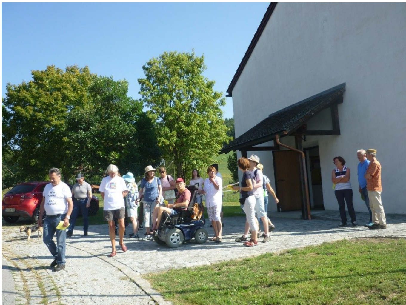
Start: die Fernsdorfer Dorfkirche