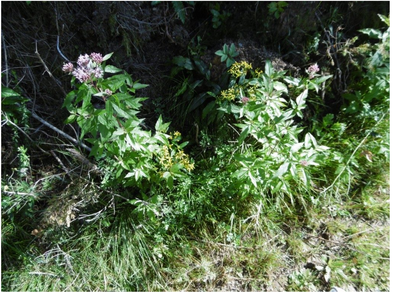
Wildblumen am Wegesrand