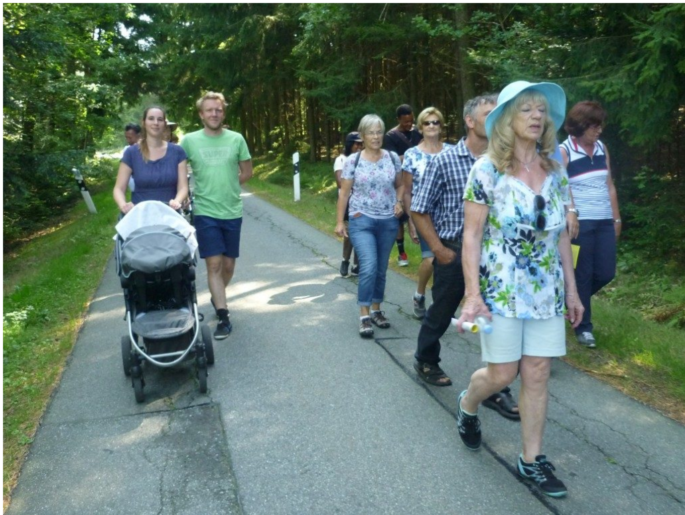
Angenehm durchs kühle Waldstück wandern