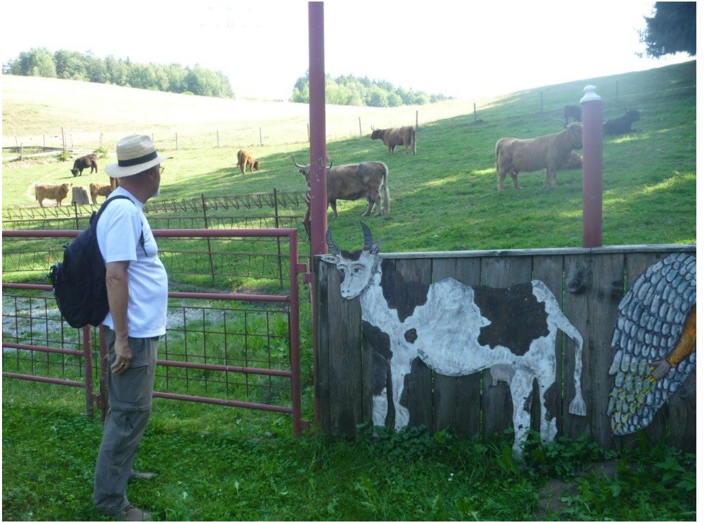
Die Station „Erst die Rinder, dann die Kinder!“