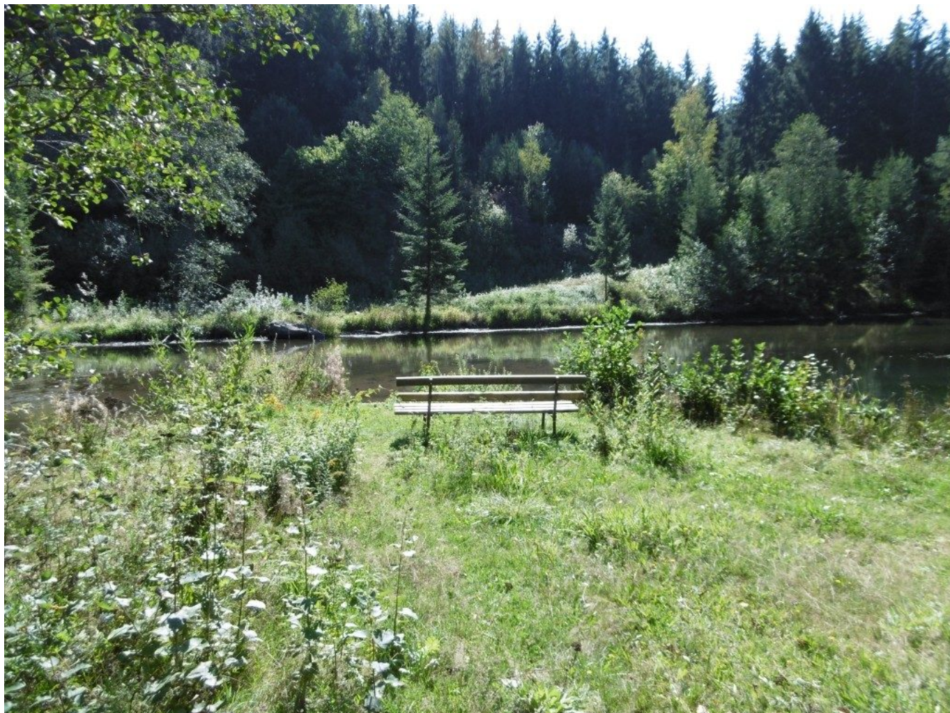
Bank zum Stillehalten und Meditieren.