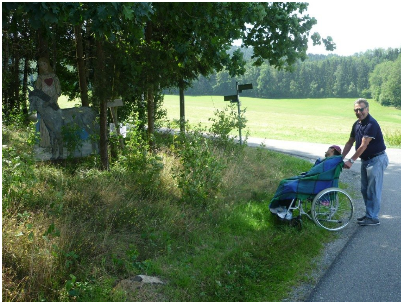
Beim Herzens-Engel oberhalb von Schwarzgrub