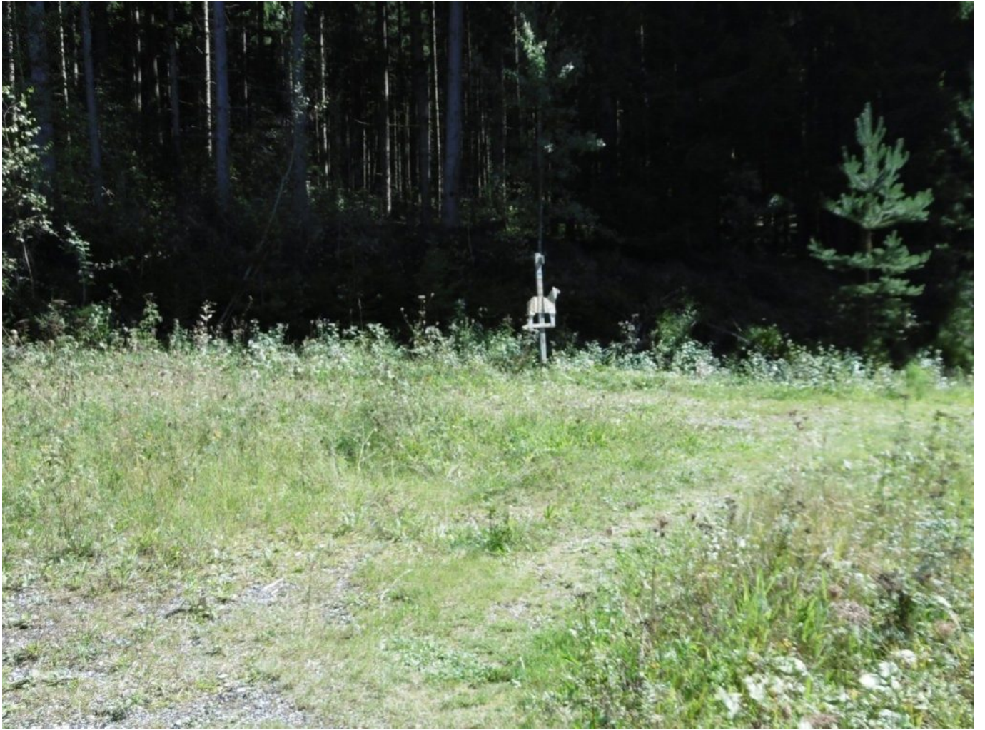
Der süße Schafbock grüßt in der Stille