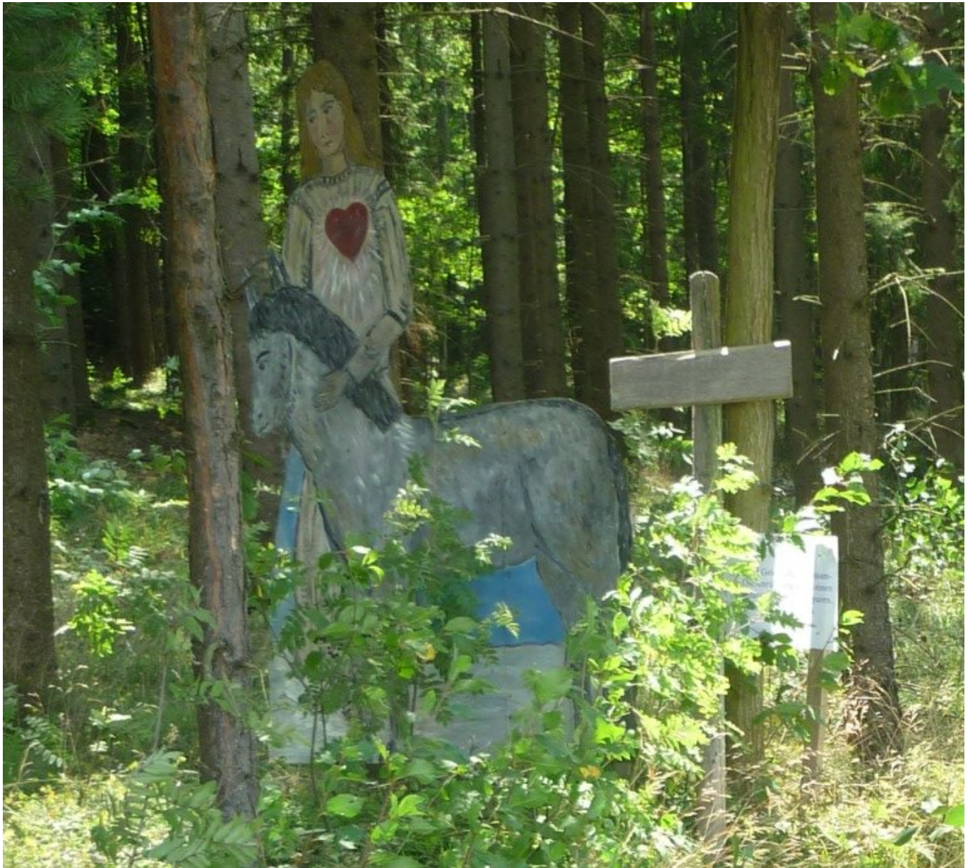
Der Herzens-Engel am Engelweg Das Interview haben wir dem Tourist Guide entnommen.