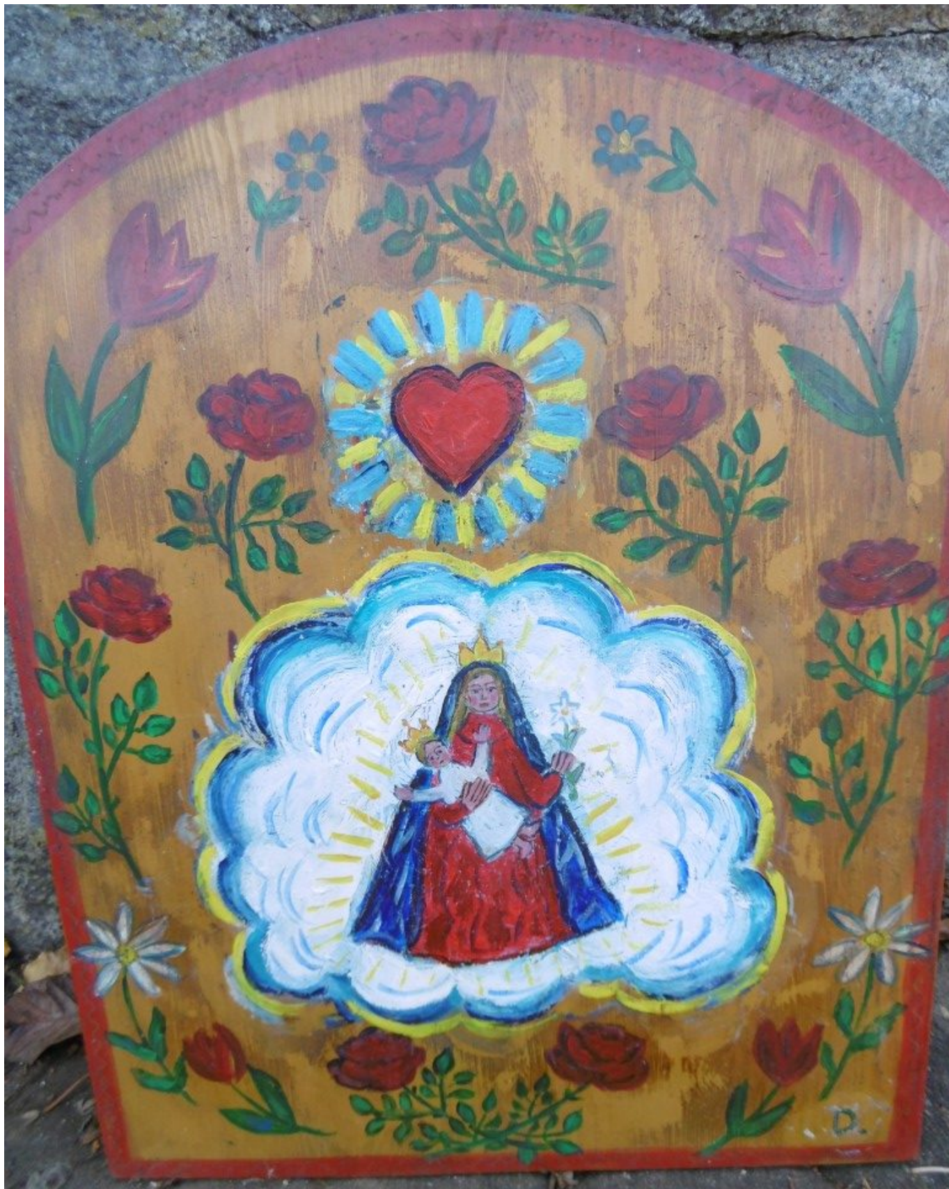
Holztafel "Maria Frömmigkeit" am Einödweg, Gudatkapelle