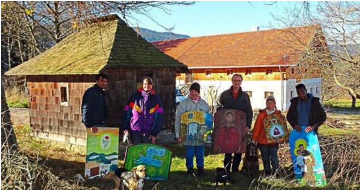
Aufhängen der Votivtafeln am Einödweg im November 2018 beim Anwesen "Bernhard".

Dieses bereits historische Pressefoto, aufgenommen von Marion Wittenzellner für den Viechtacher Bayerwald Boten, hat jetzt einen ganz besonderen Wert... Was ist geschehen?