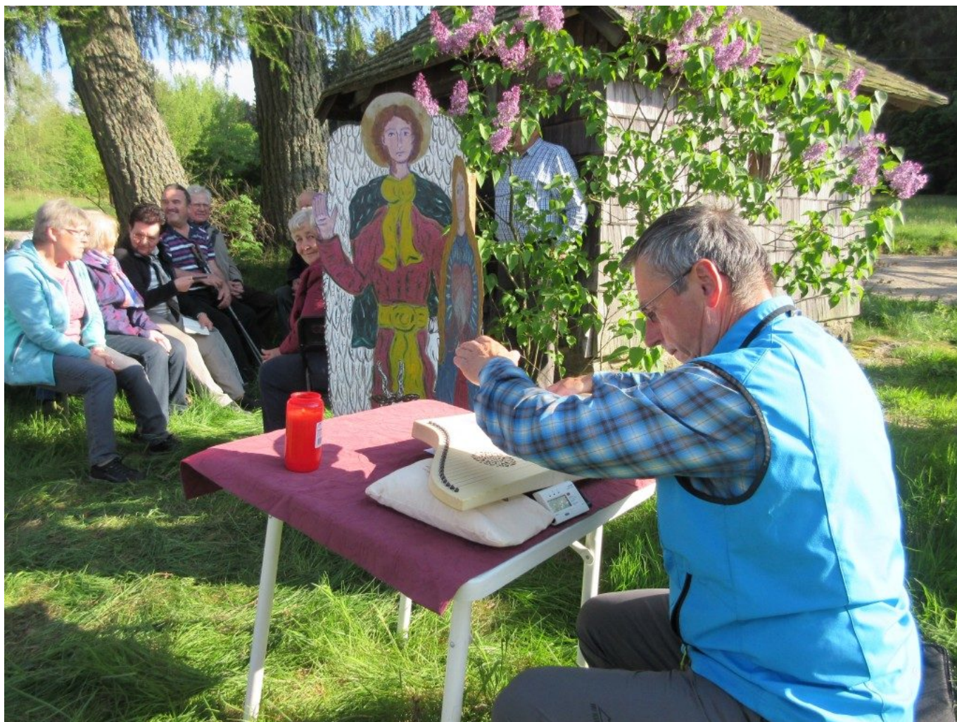
Veeh-Harfe stimmen, erstes gemeinsames Lied anstimmen: "Wie lieblich ist der Maien" von Paul Gerhard.