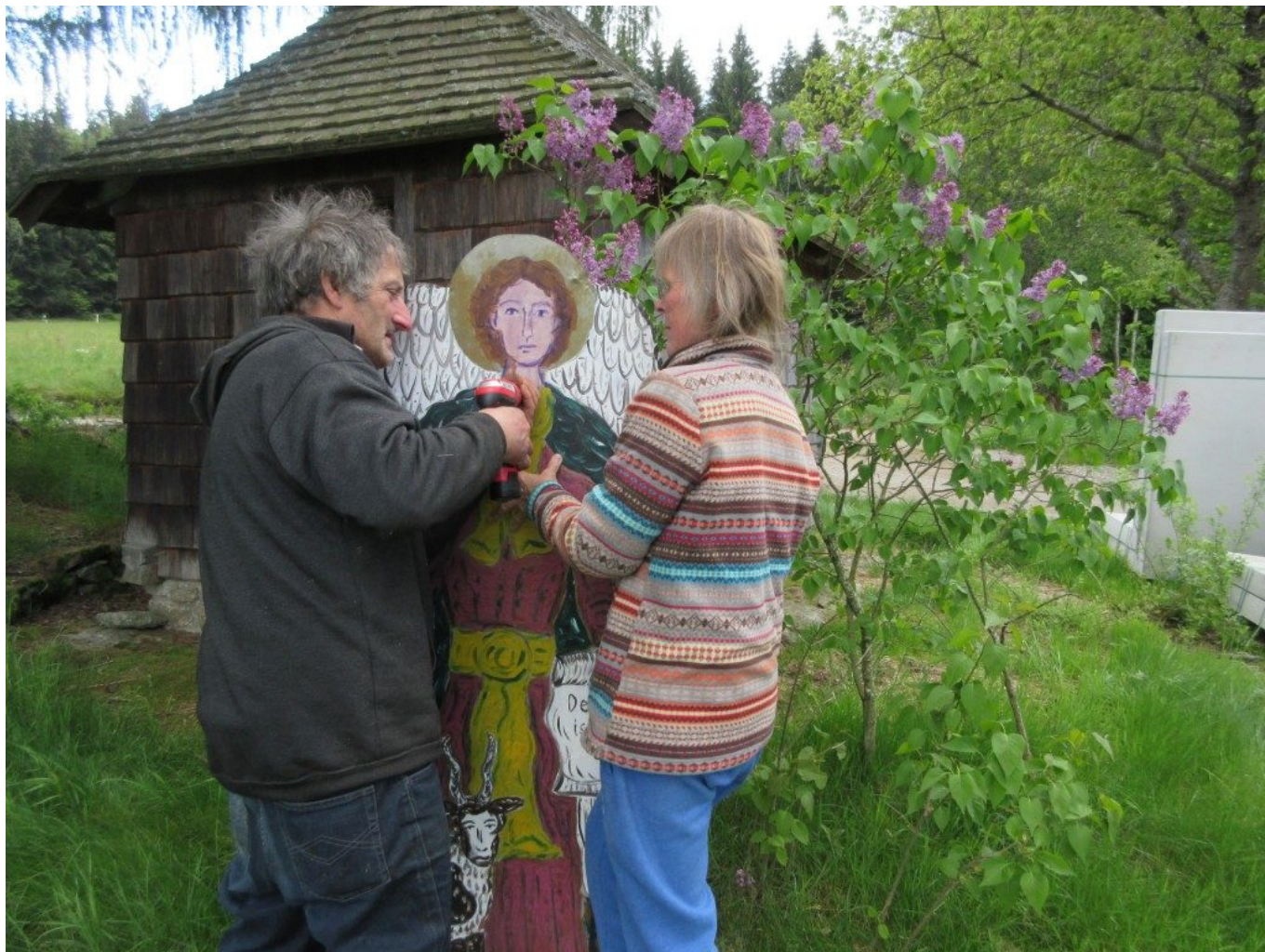
Engelfigur mit Schrauben am Stempfen befestigen. In dieser Arbeit sind sie bereits Profis und ein eingespieltes Team.