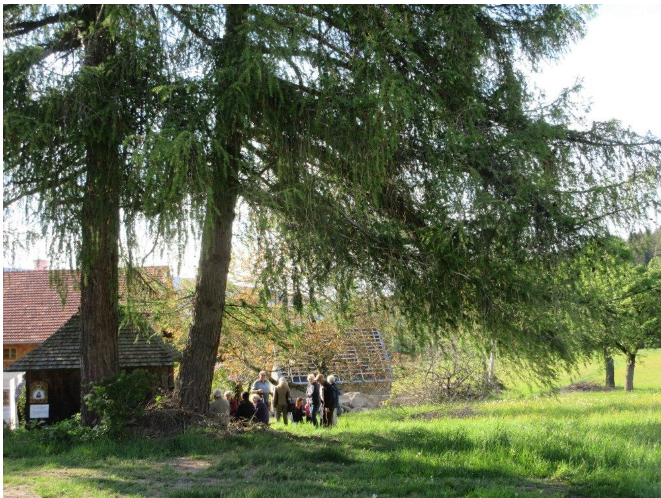
Erste Andacht-Teilnehmer haben sich bereits eingefunden.