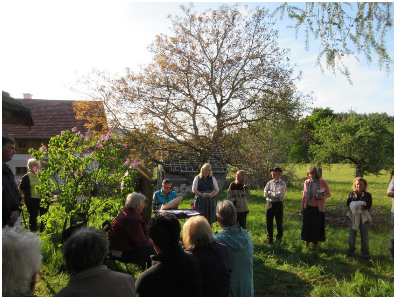
Beim Vortrag von liebevollen Marienliedern singen die älteren Andacht-Teilnehmer/innen auswendig mit.