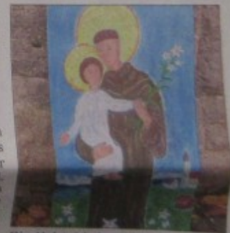
Die Holztafel des Heiligen Antonius von Dorothea Stuffer.

Stuffer betont auch, dass sie den Weg regelmäßig wartet, ebenfalls eine Bedingung dafür, dass ihr Kunstprojekt aufgenommen wird. Der Engelweg der Künstlerin aber, rund um Ayrhof und teilweise auf dem Pilgerweg Sankt Wolfgang gelegen, erfülle schon jetzt die Voraussetzungen und kommt in den Bayernatlas.