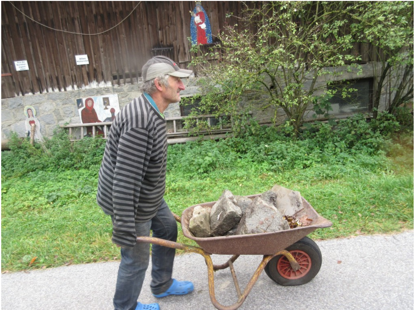
Einige schwere „Weydling-Stoa“ = Natursteine werden zusätzliche Stabilität bringen.