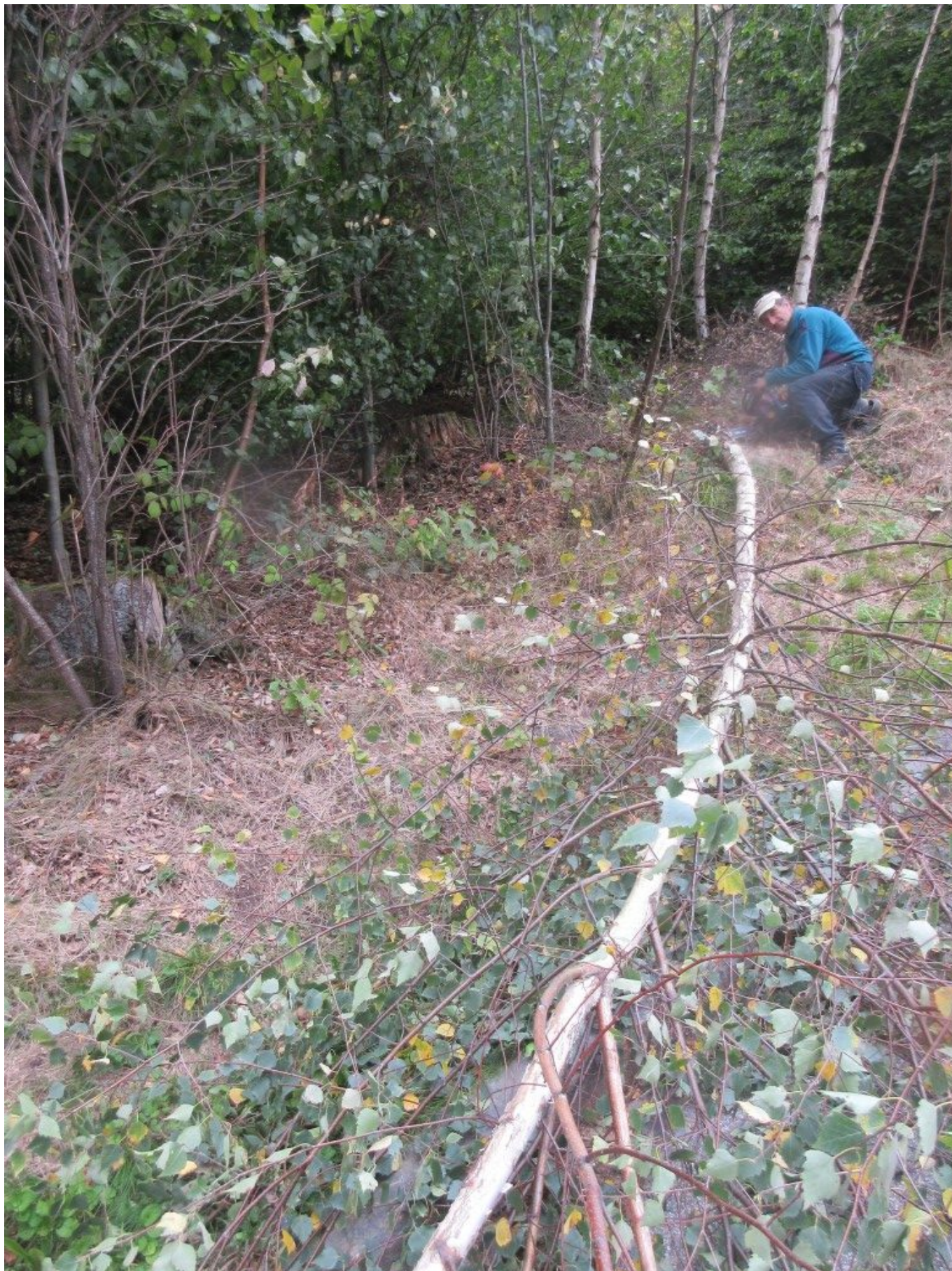
Frisch umgesägt: Mit Wucht fiel die Birke auf den Boden. Das könnten 2 schöne helle Kreuze werden. Entschuldige, liebe