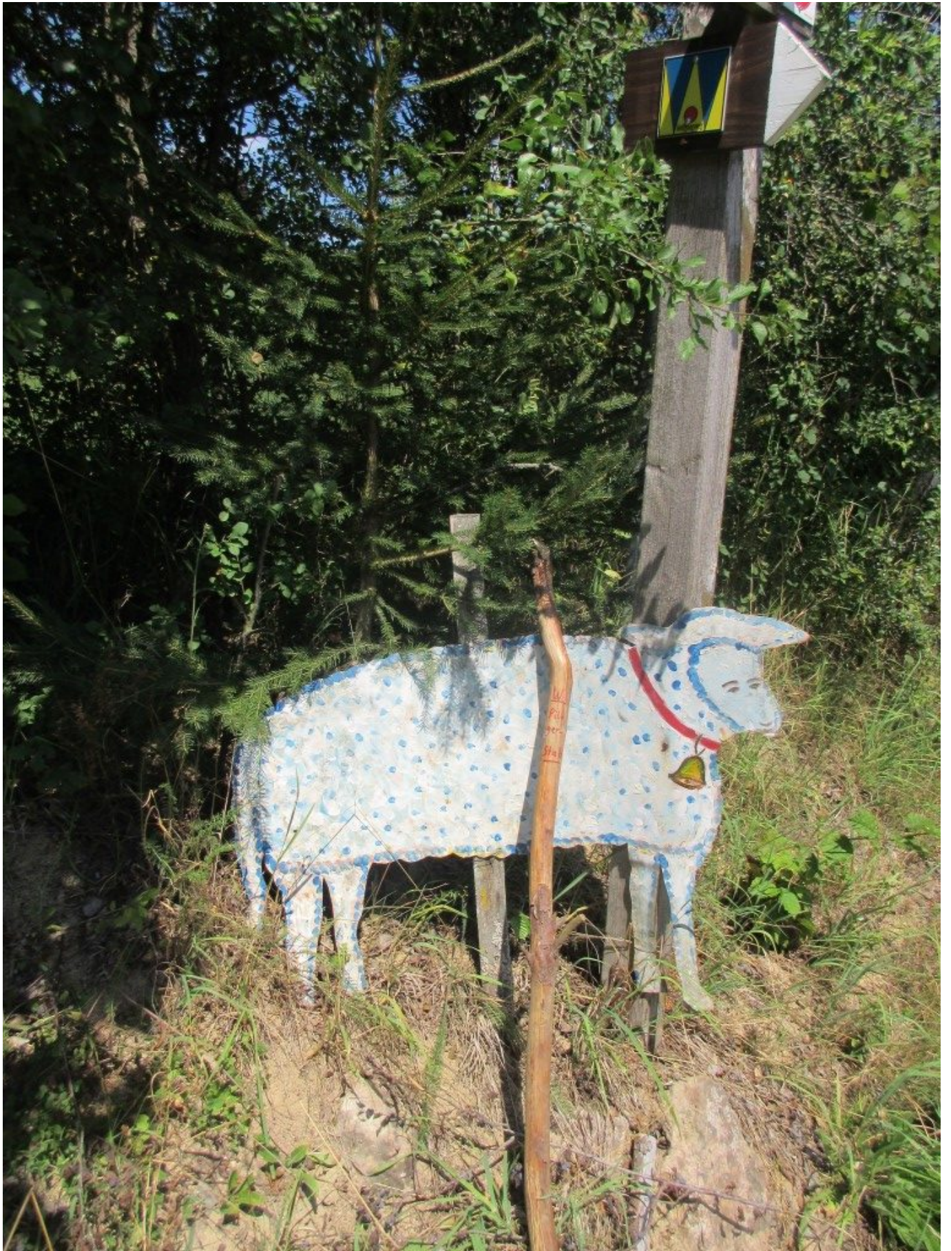
Vor Gstadt geht es rechts un den Wald.