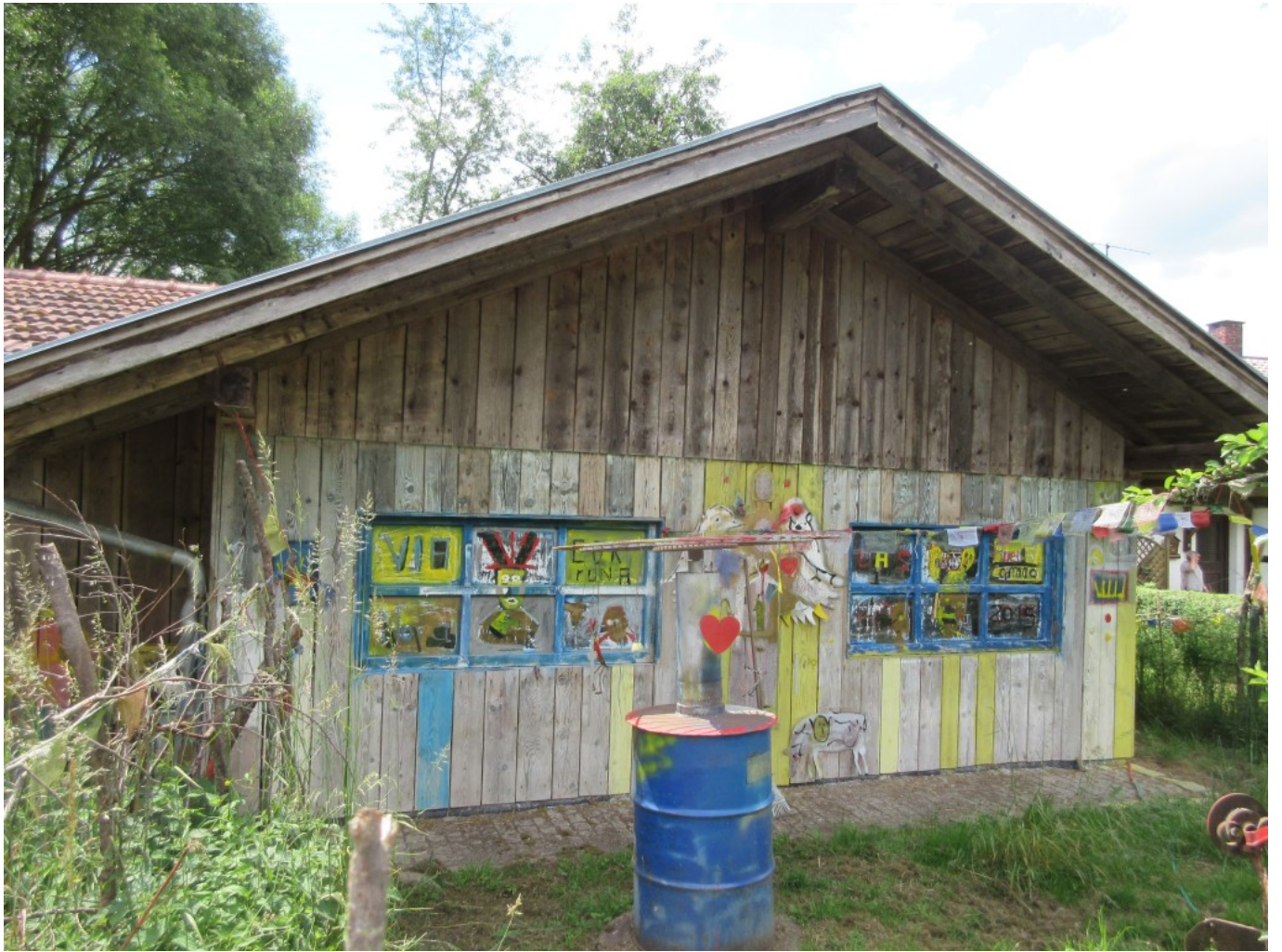
Ölfass als Dekoration und geheimnisvolle Fenster