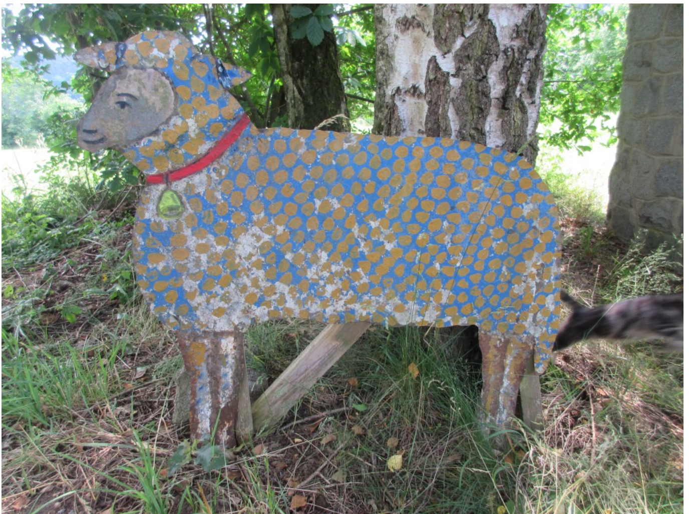
Blehschaf bei der Kapelle in Gstadt

Als Wegmarkierung dient das Blaugelbe “W”.