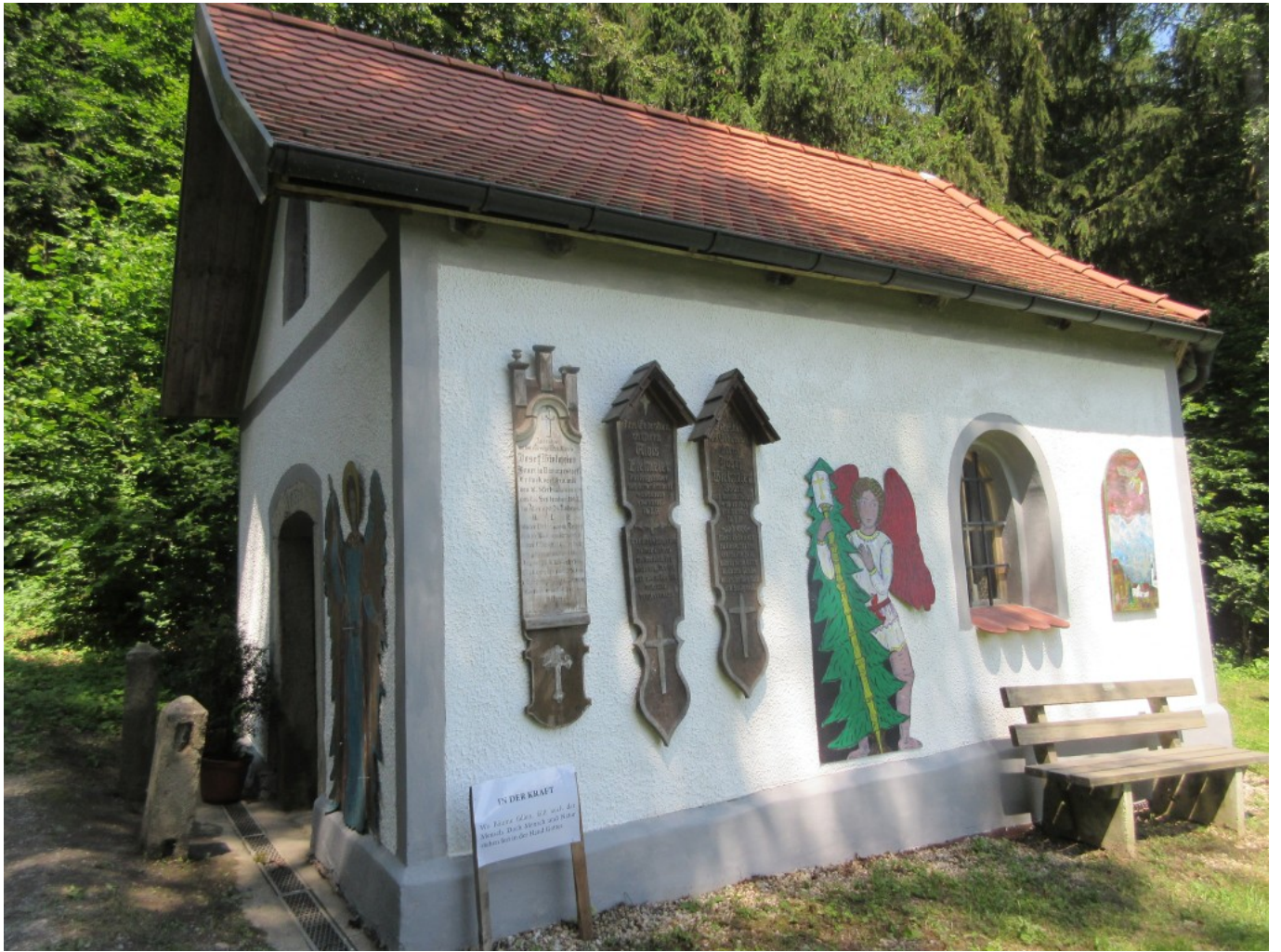
Die Kapelle wurde extra noch frisch gestrichen!