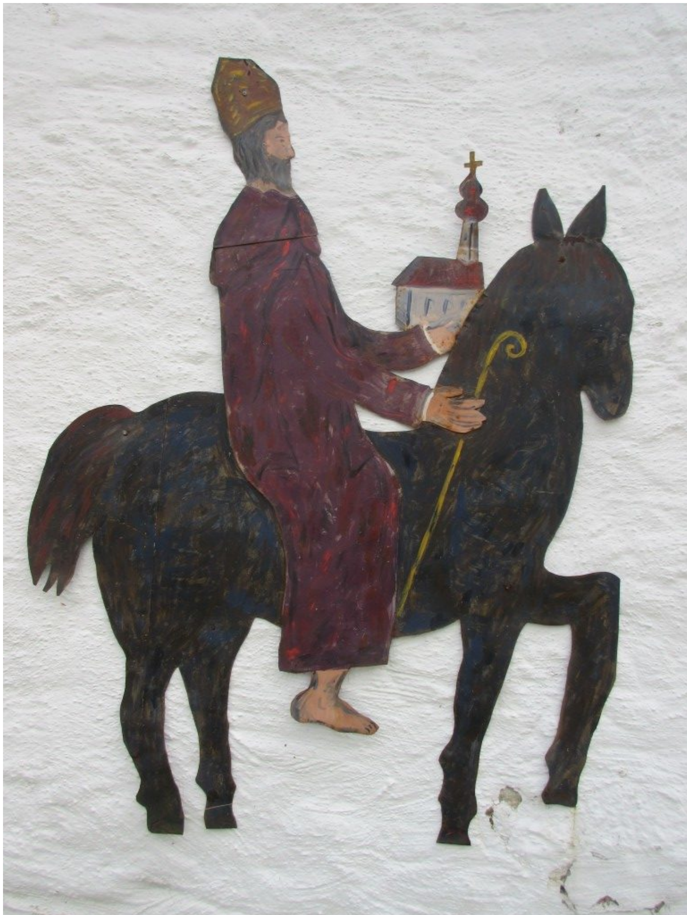
Der heilige Wolfgang als berittener Pilger an der Kirchenmauer in Schönau