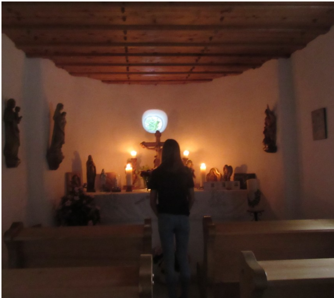
In der erleuchteten Kapelle