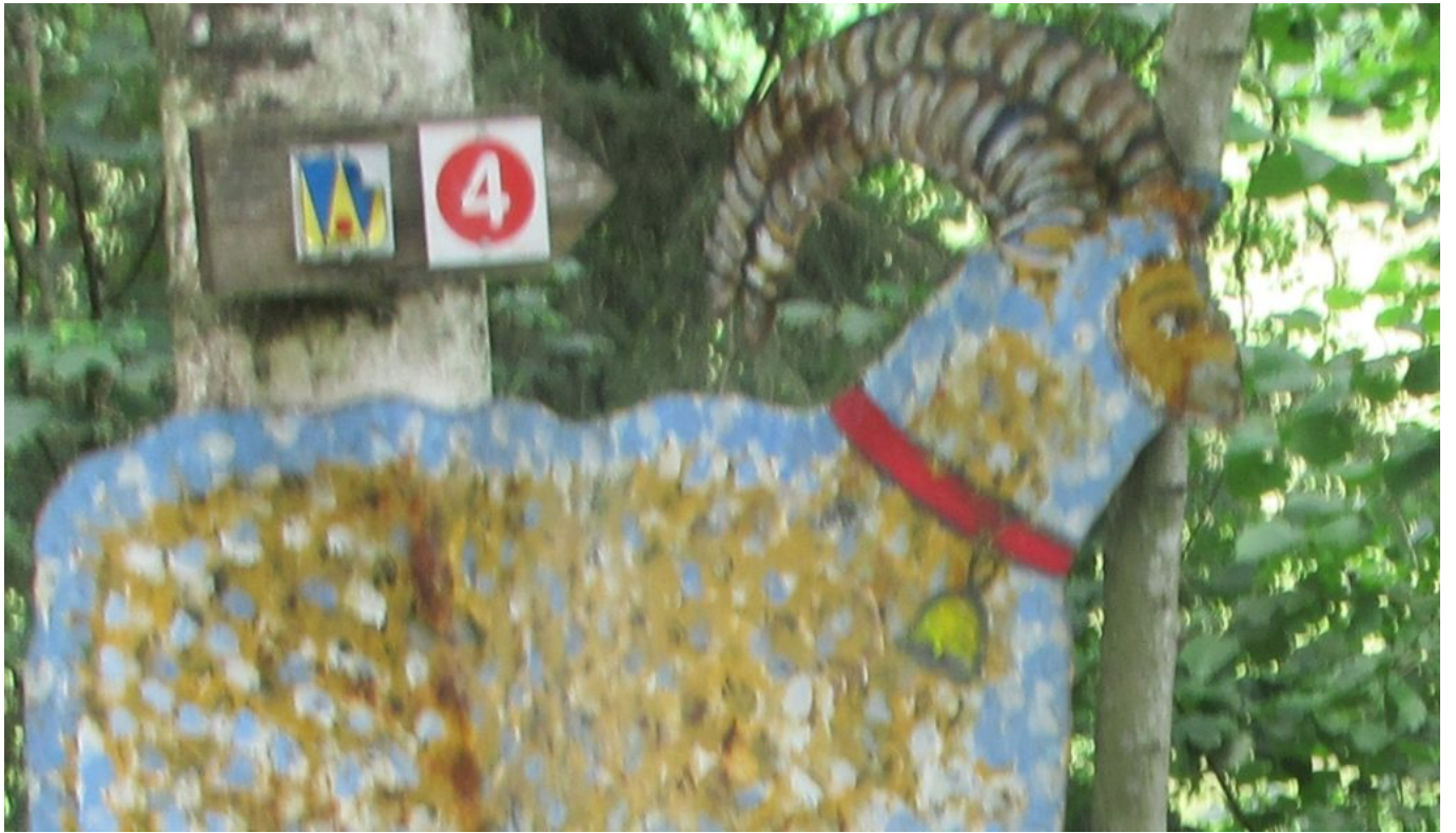
Markierung und bunter Schafbock nach dem Waldstück vor Gstadt