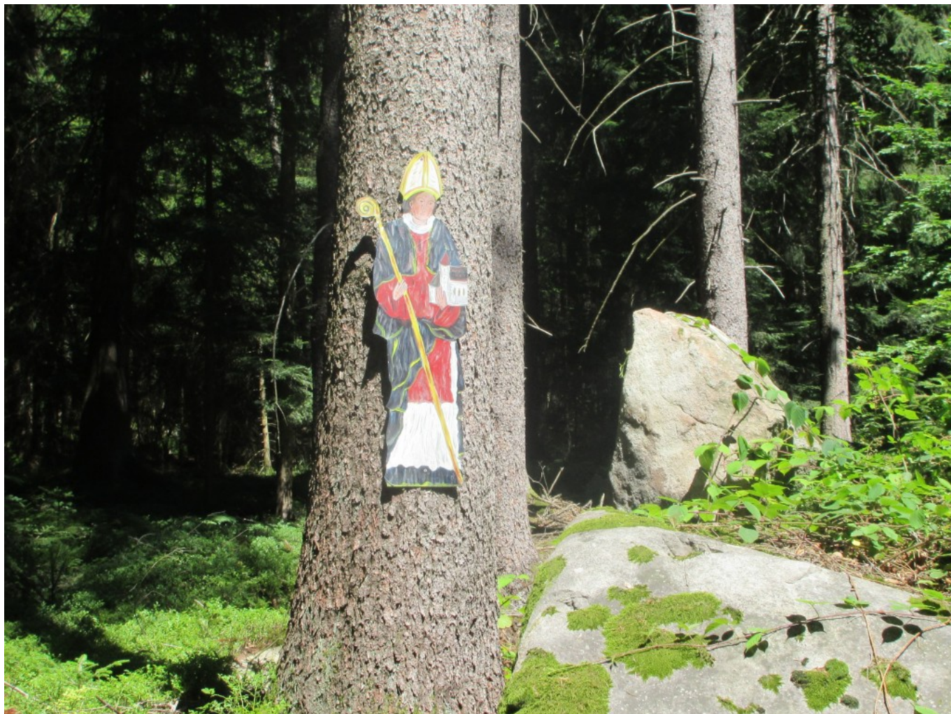
Wolfangsfigur von Dorothea Stuffer im Wald am Baumschutz- ENGEL-Weg bei Ramersdorf in der Nähe einer alten keltischen Kultstätte