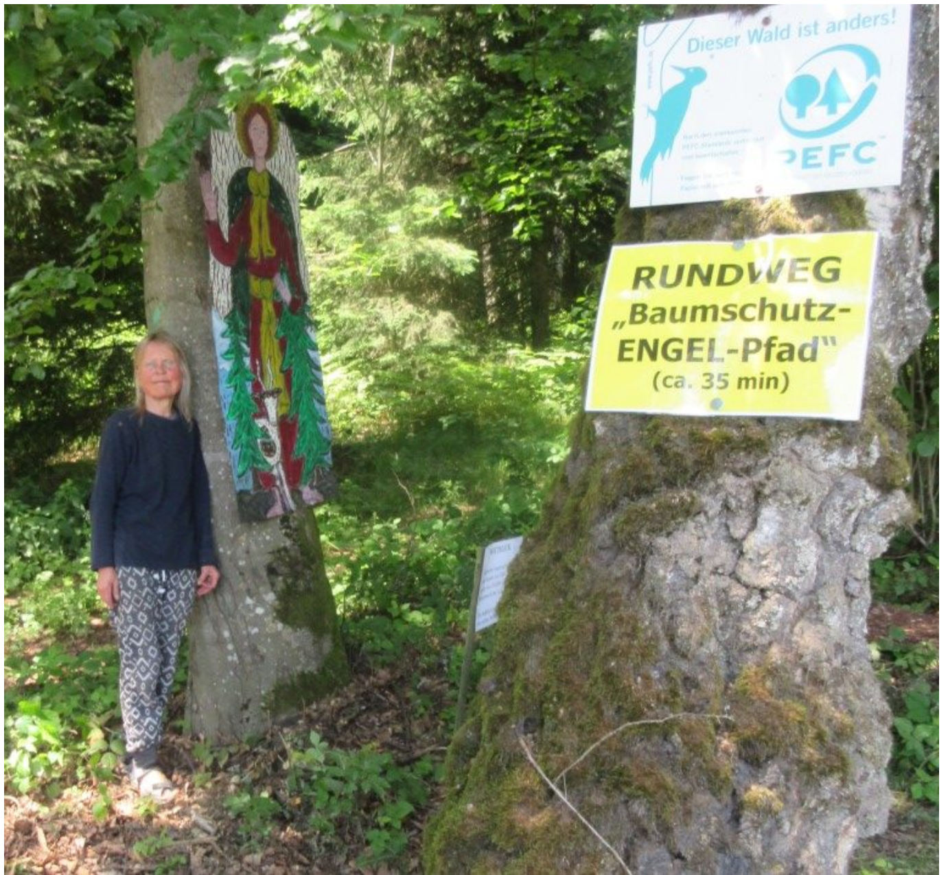
Ab der Kapelle führt der 35-minütige Baumschutz-ENGEL-Pfad durch den Wald