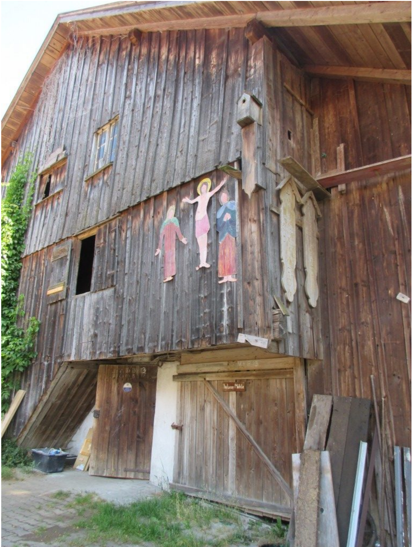
Totenbretter und Kreuzigungsgruppe aus Blech beim Piller-Junior -Anwesen in Gstadt