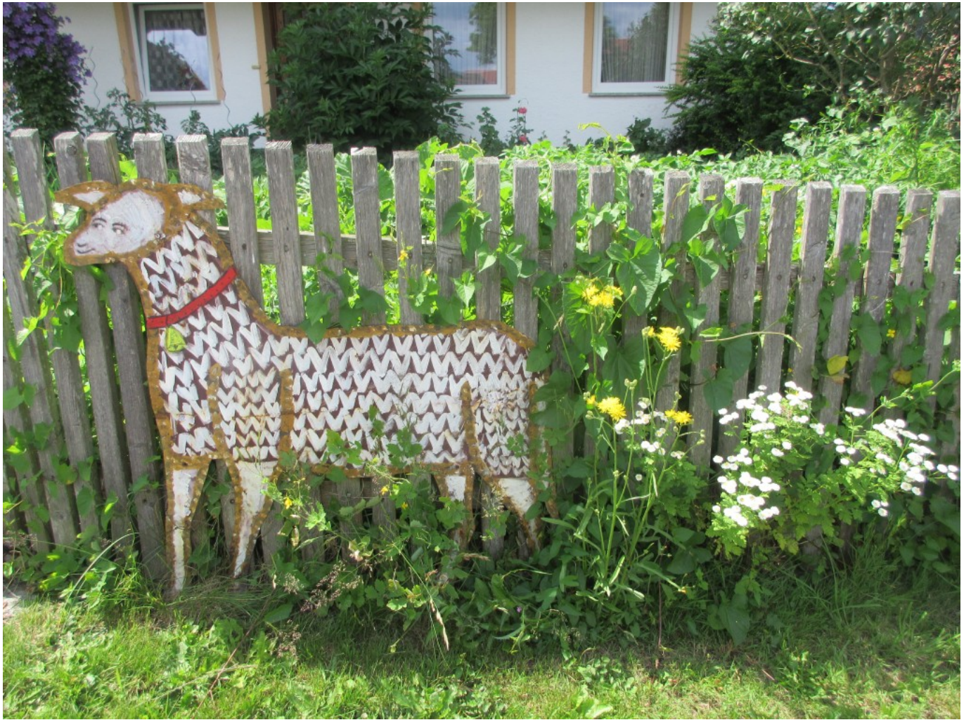
Schaf an einem Gartenzaun in Schönau