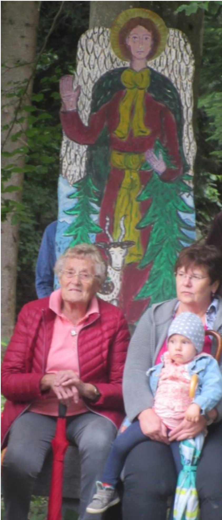
Alle Altersgruppen von