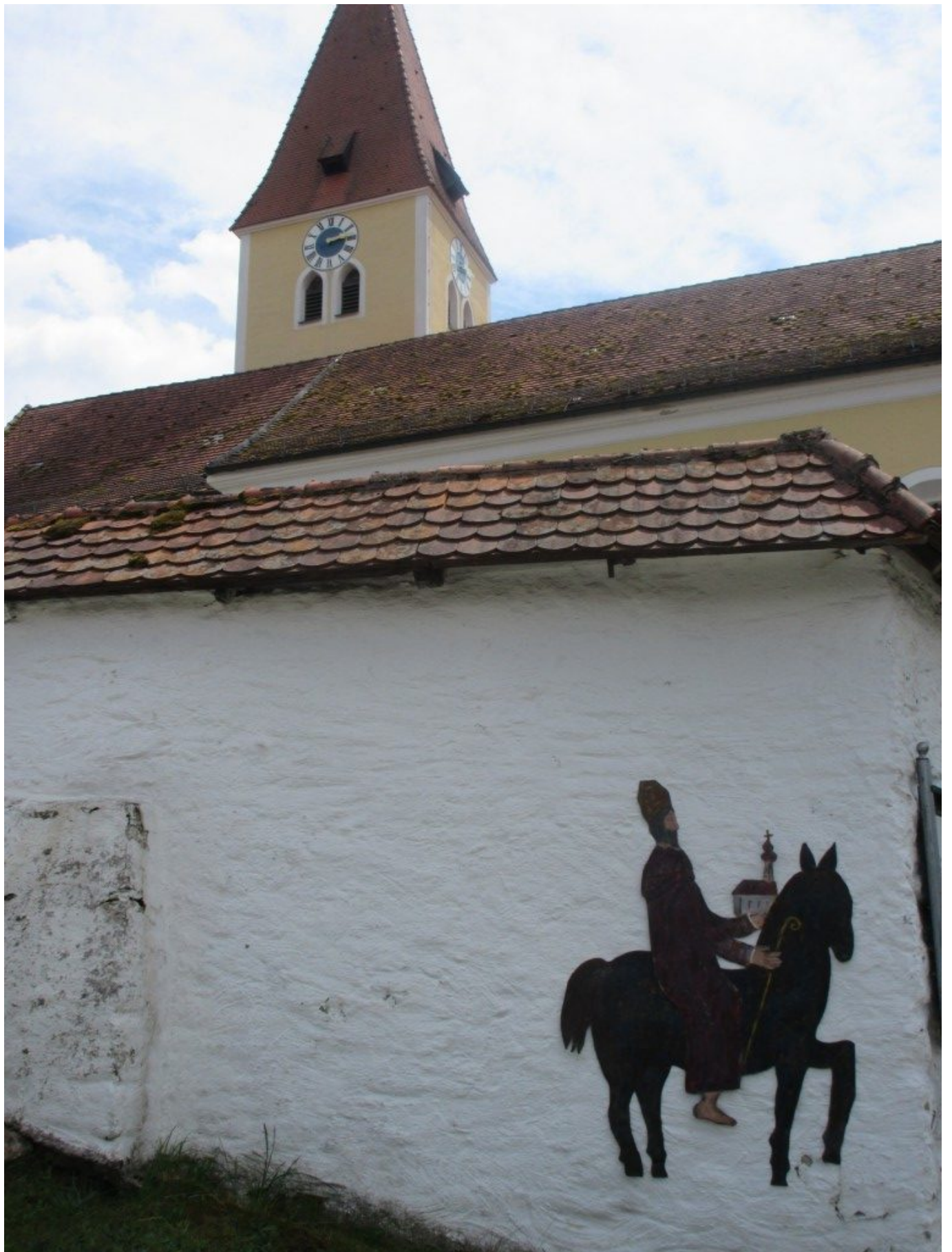
Berittener Pilger: Der heilige Wolfgang bei der Filialkirche in Schönau