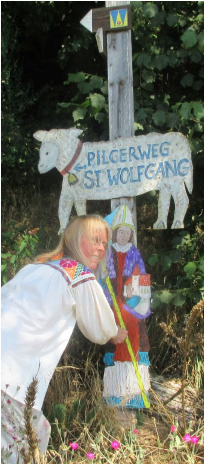
Schaf, "W" und Wolfgangsfigur in Gstadt. Ab hier geht es durch den Wald über Gscheidbühl nach Schönau.