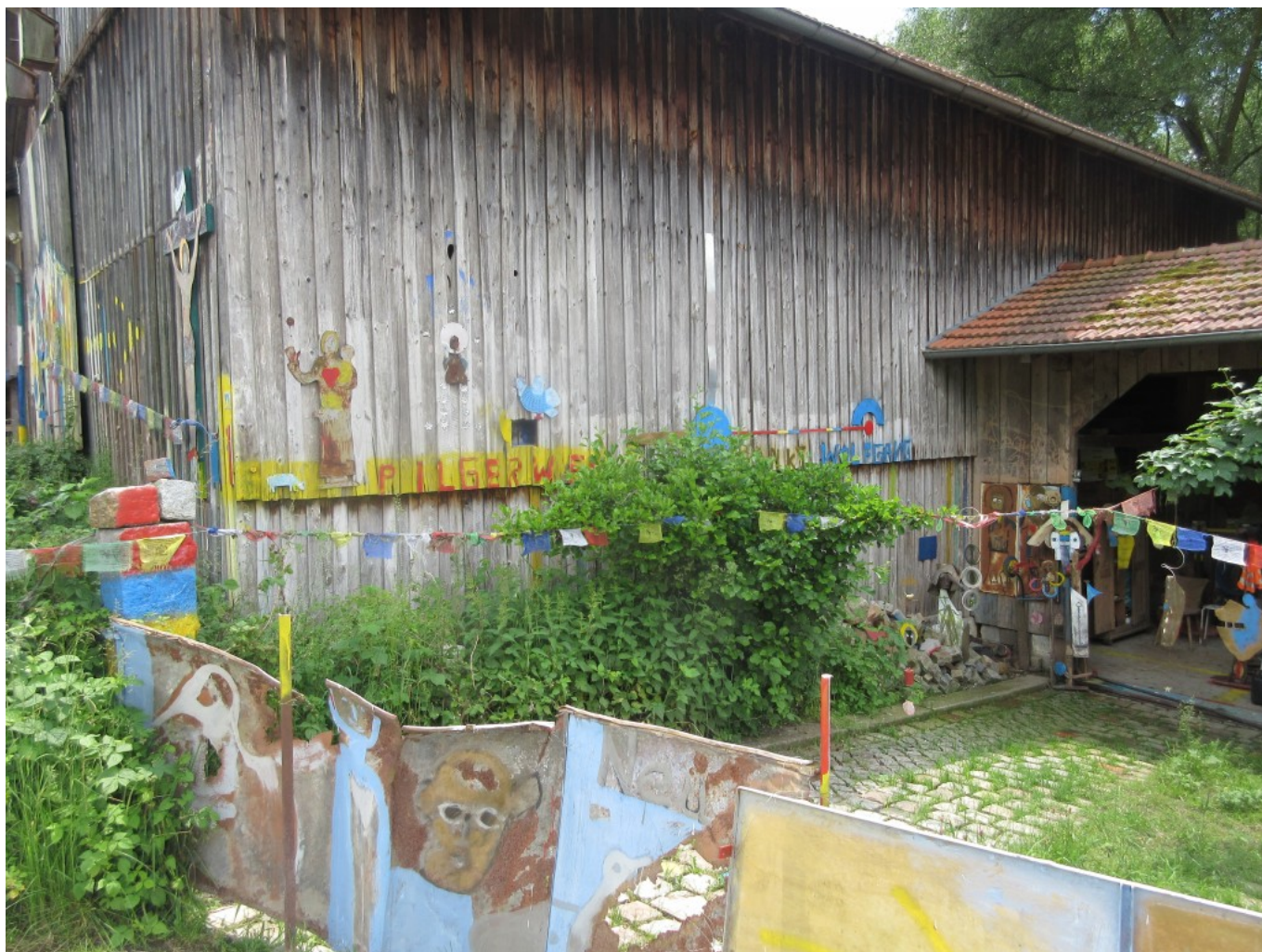
In bunten Metallbuchstaben lesen wir: "Pilgerweg St.Wolfgang"