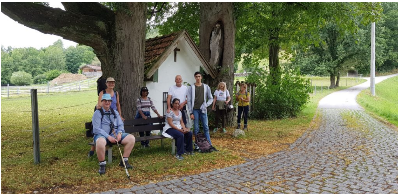
Bei der Kapelle in Gscheidbühl