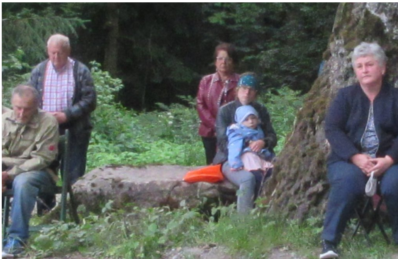
Fast 50 Gottesdienstbesucher lauschen der Predigt.