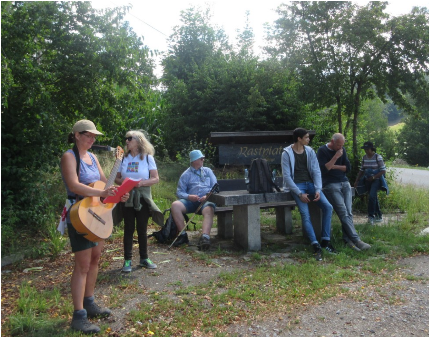
Gedanken und Lieder zur Rast