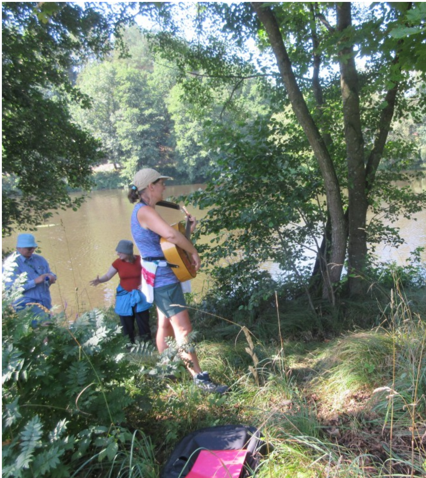
Gedanken und Lieder am Regenfluss (hier die Rodrians)