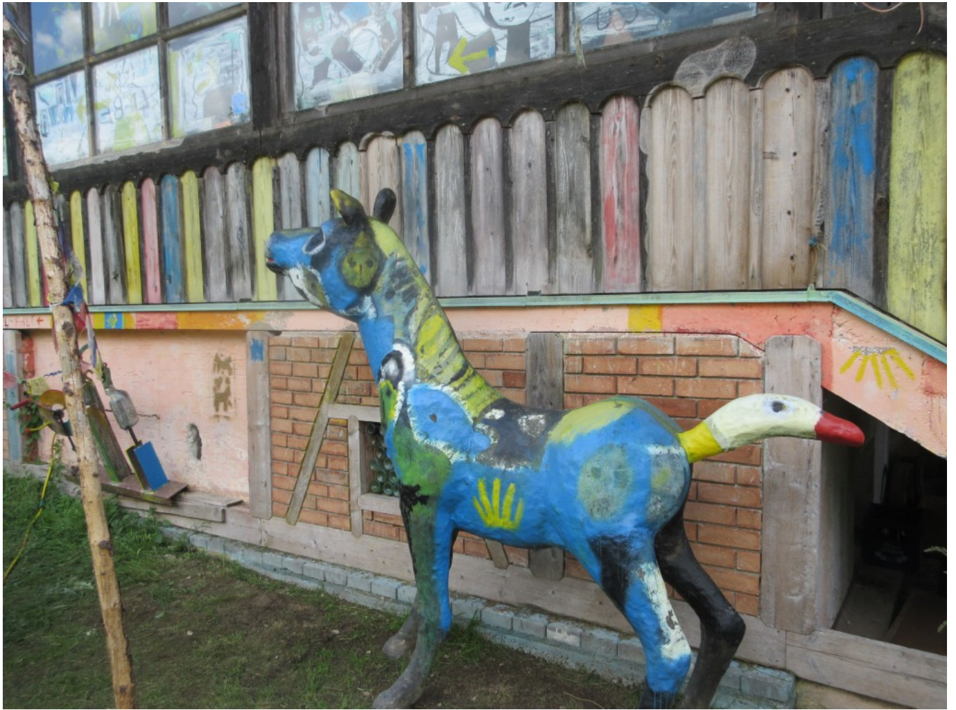
Bemaltes Pferd "Blauer Reiter". Man beachte den Schwanz als Gänsekopf!