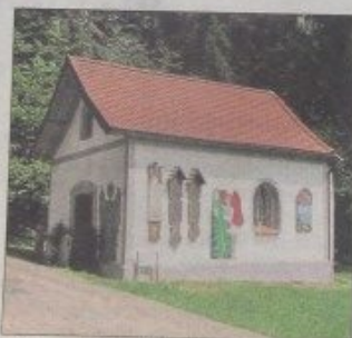
Startpunkt der Wanderung: die Bielmeier-Kapelle.