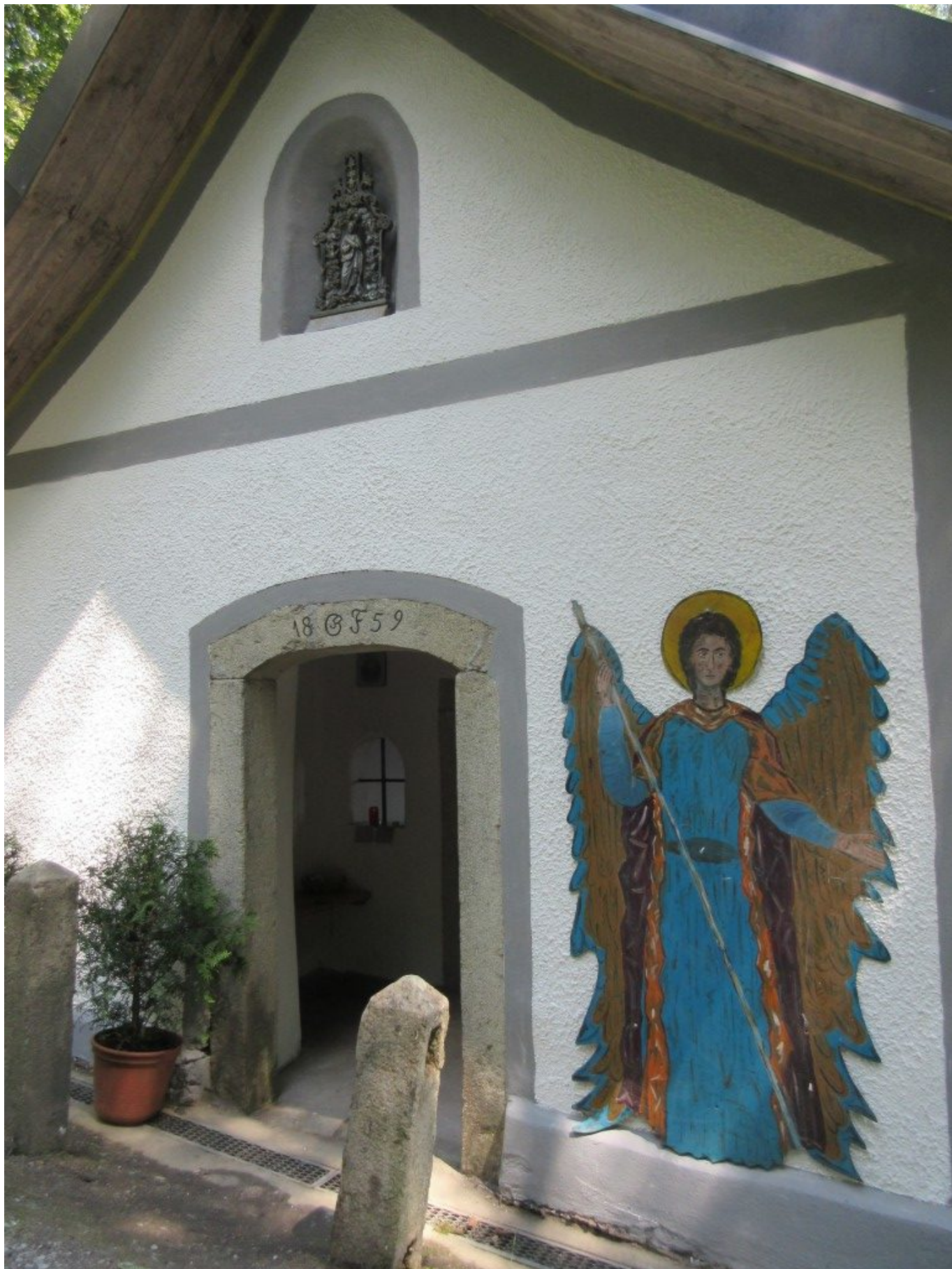
Eingang zur Kapelle