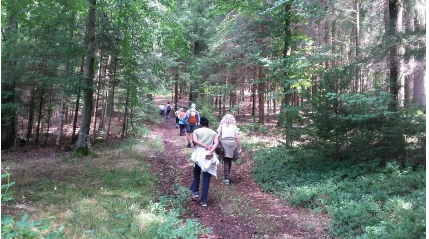
Ab Gstadt führt der Weg durch den Wald nach Gscheidtbühl