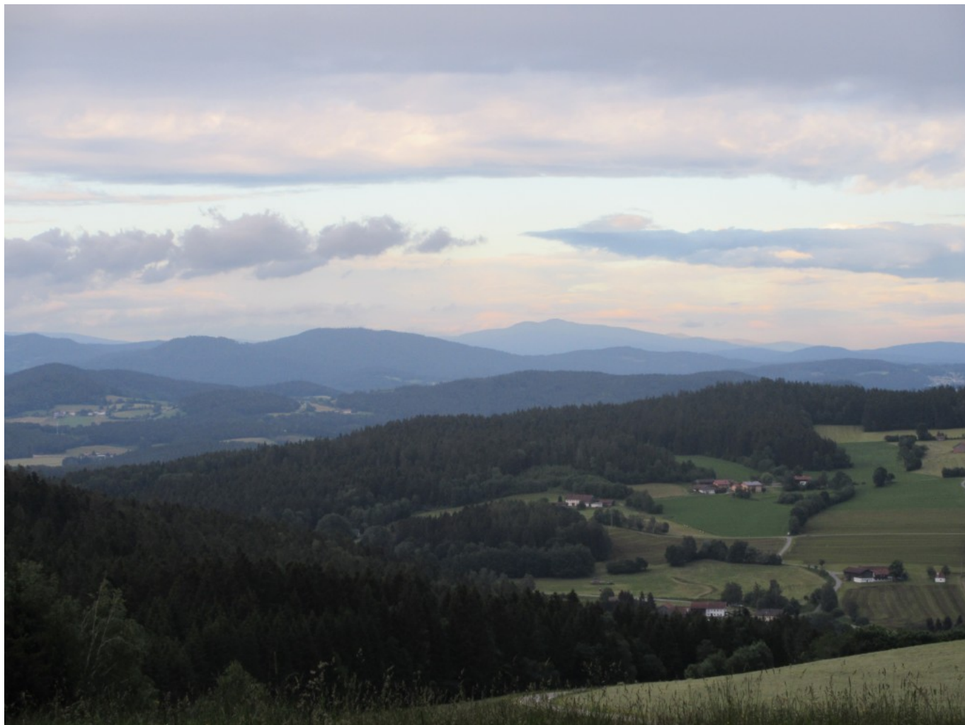
Sanfter Johanni-Abend über den Bergrücken des Bayerischen Waldes – – Blick von der Kapelle