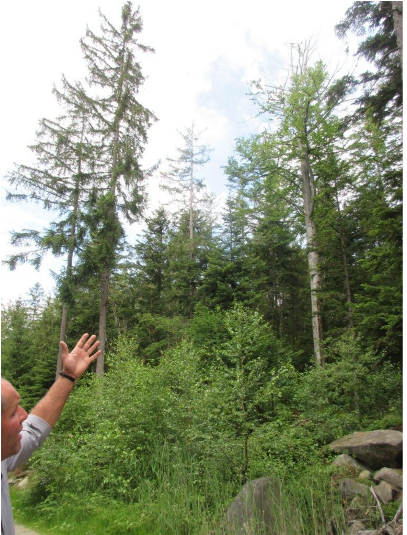
Hier sehen wir ein Buche, die bereits abstirbt. Ihre Rinde wird vom Schwarzspecht besucht. Auch befinden sich an ihrem