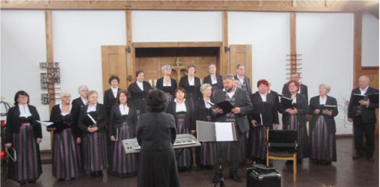
Aufnahme aus dem Archiv: Der Chor Präludium in der Christuskirche Viechtach im März 2023

Der Eintritt ist frei, Spenden sind erwünscht