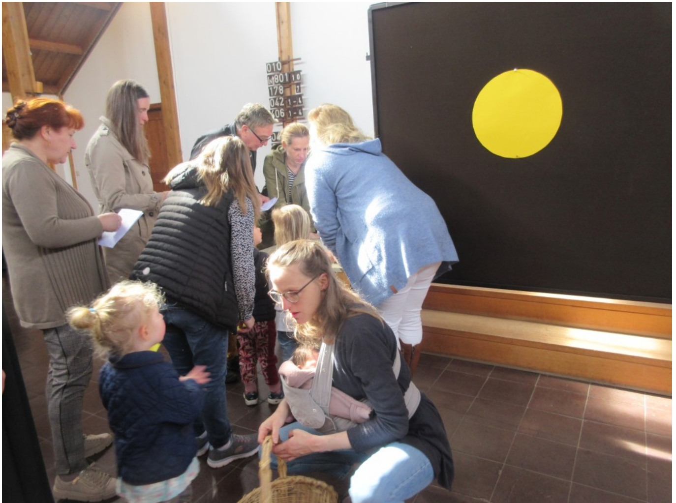
Das kleinste Kindchen war 4 Wochen jung!

“Wofür bin ich dankbar – wie empfinde ich das Gute in Gottes Reich – was ist schlimm – was belastet mich – was finde ich als böse” waren hierbei die Themen.