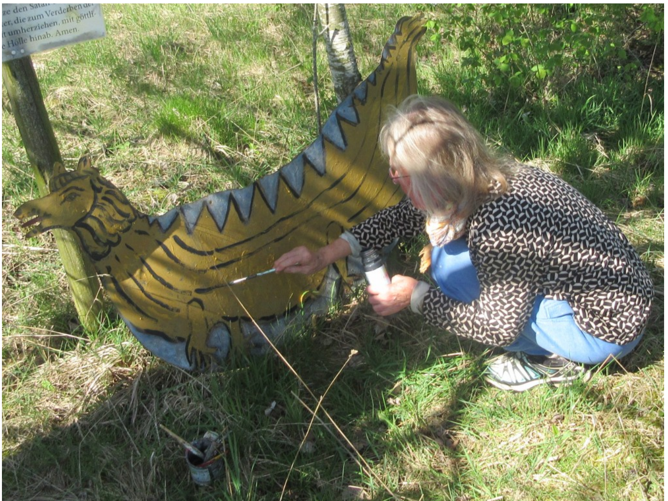
Binnenzeichnung beim Drachen anbringen

Dass dem so ist, erkennt man daran, dass der Engelweg bereits so tief und dauerhaft im Bewusstsein der Anwohner verankert ist, dass die Leute bei Umbauten am Haus oder am Zaun sich selber kümmern, dass “ihre” Engel gut platziert bleiben oder von ihnen einfühlsam umplatziert werden.