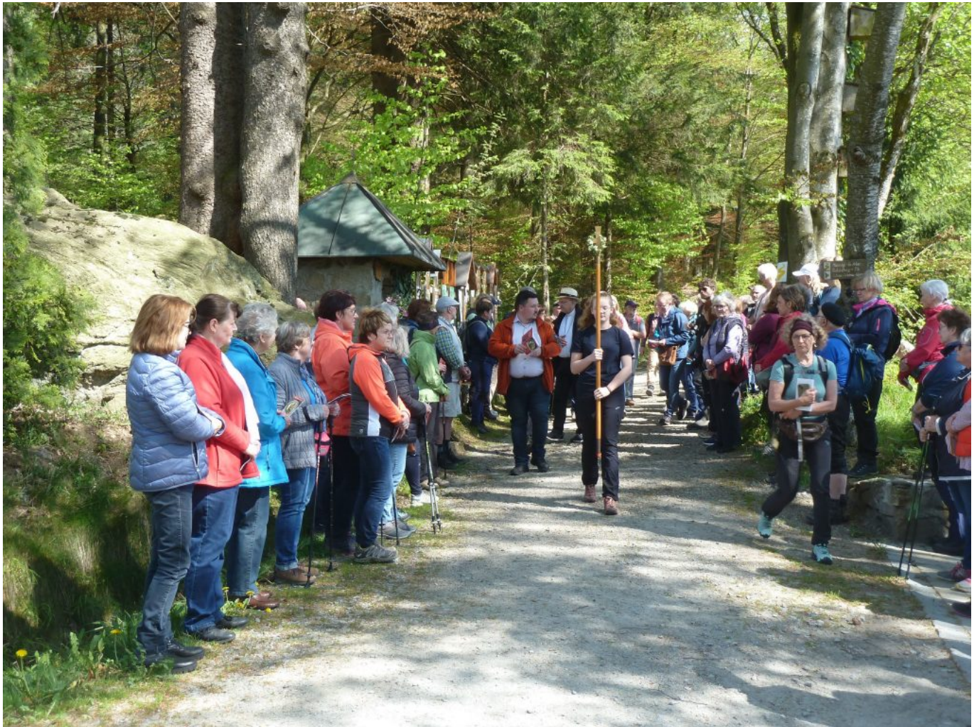
Erste Station des Weges war die Kapelle der Familie Karl Mühlbauer am Wanderweg Eck-Mühlriegel gelegen.