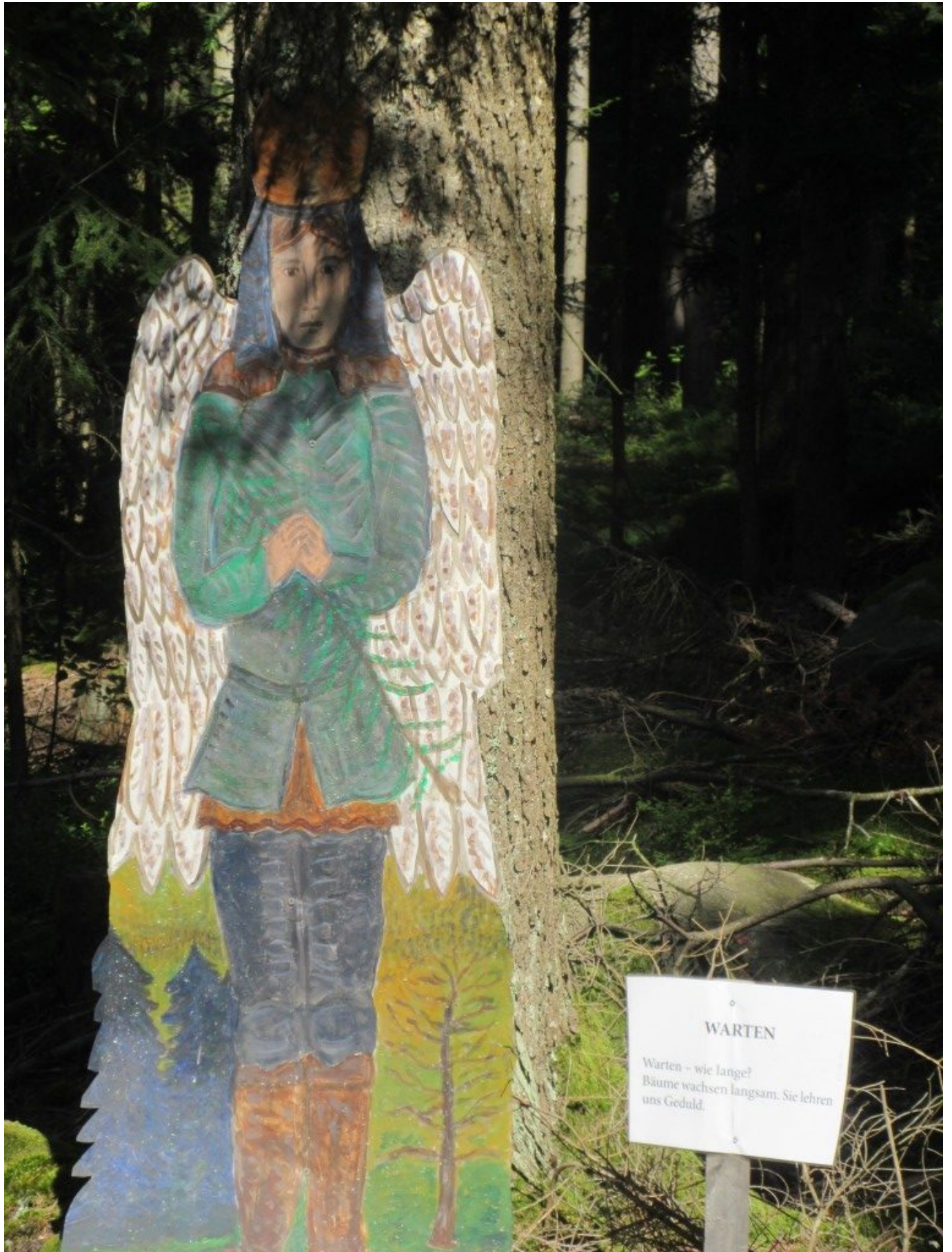
Licht-Schattenspiel beim Engel „Warten.arten“ unterm Tannenbaum