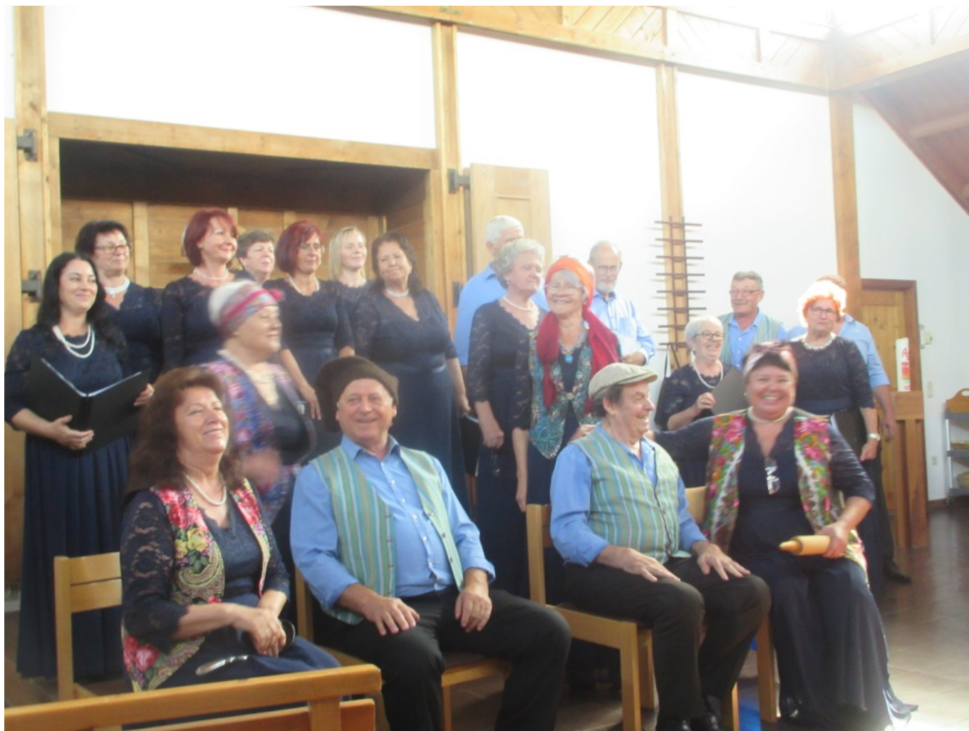
Lustiges ukrainisches Lied mit schauspielerischen Einlagen über verzwickte Hochzeitspläne