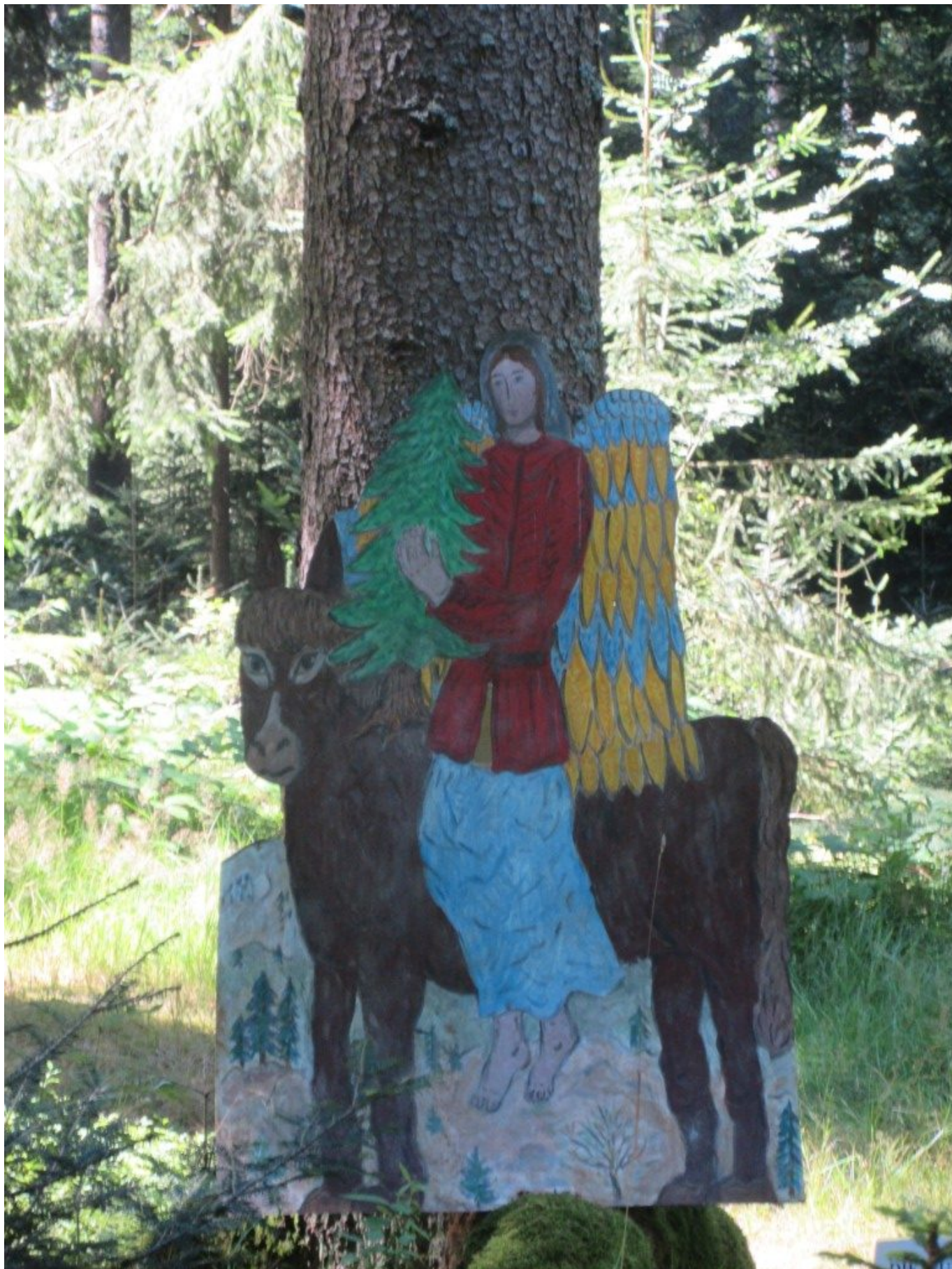
DIE WURZELN PFLEGEN