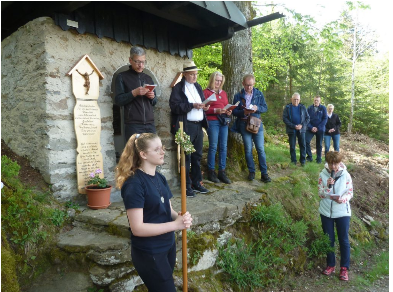
Bei der Kapelle am Schwobmloch „Maria im Woid“ wurde Innegehalten.