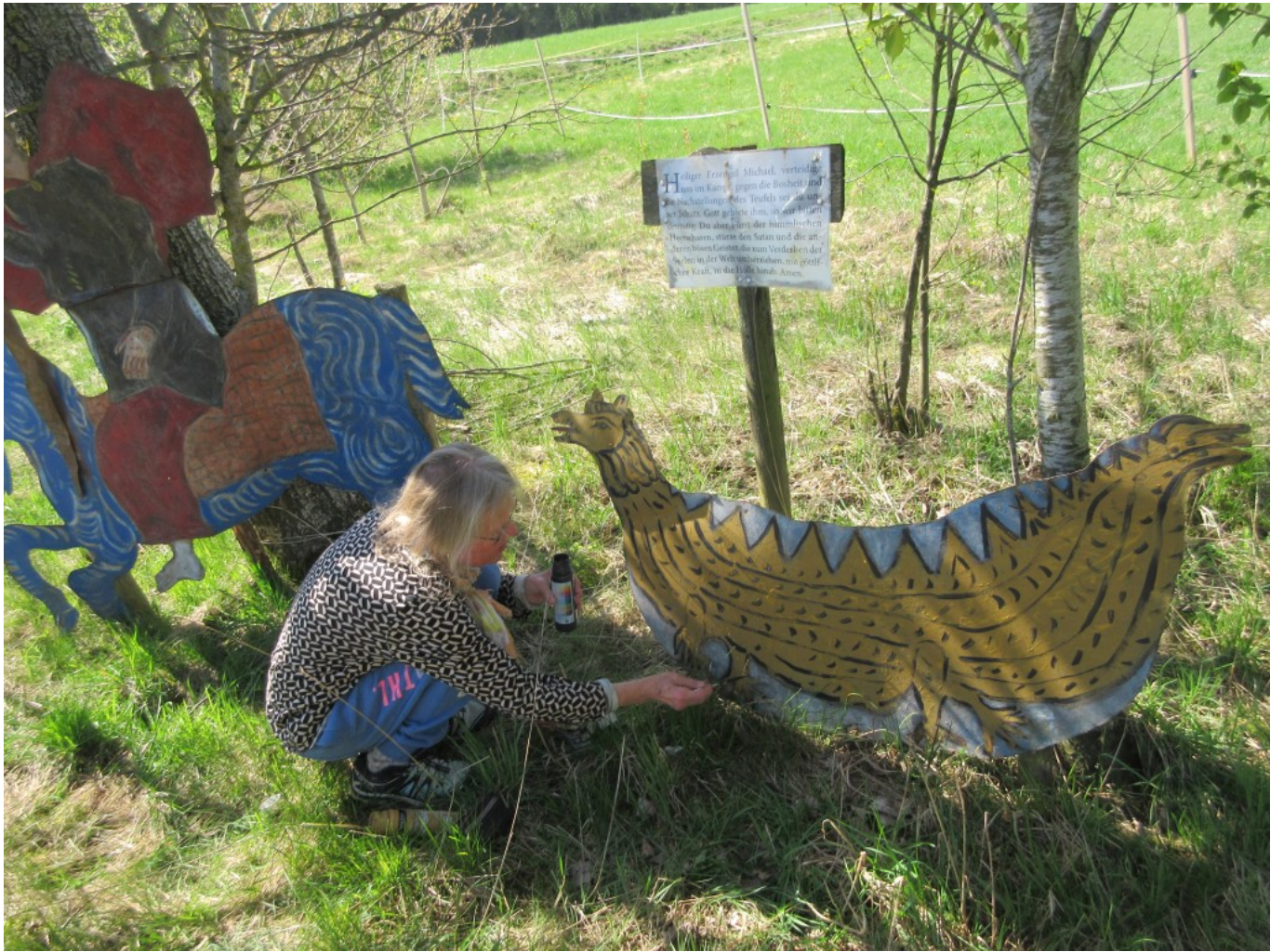
Und nun noch die Füße