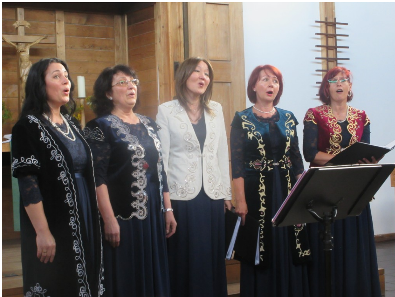
Fünf Sängerrinnen tragen ein kasachisches Lied über sehnsüchtiges Erwarten auf ein Wiedersehen vor