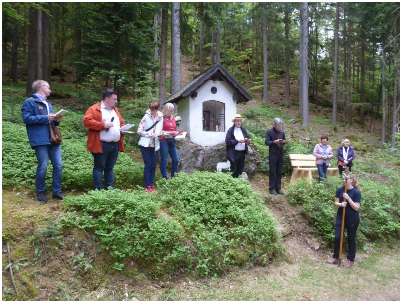
Die „Hütriegel-Kapelle“ am Ortsrand von Arrach lud zum Verweilen im Gebet ein.