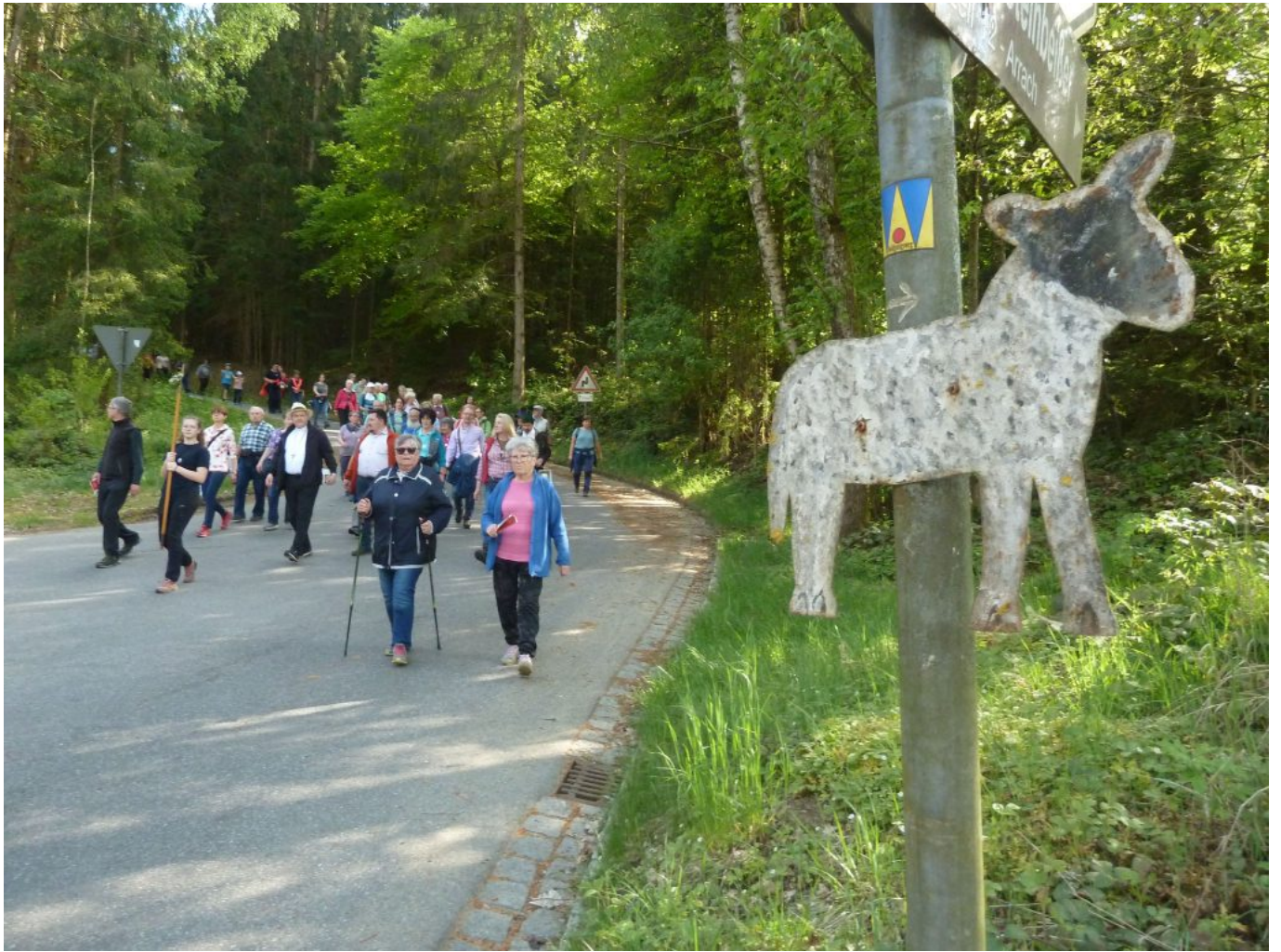
Das Blechschatz und das Symbol des Wolfgangsweges zeigten den Streckenverlauf an.