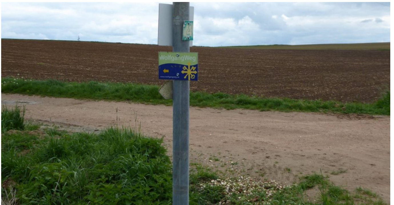
Die uralte Wolfgangseiche steht bei Regensburg am von den österreichischen Pilgerfreunden erstelltem Wolfgangweg (Logo am Weg)