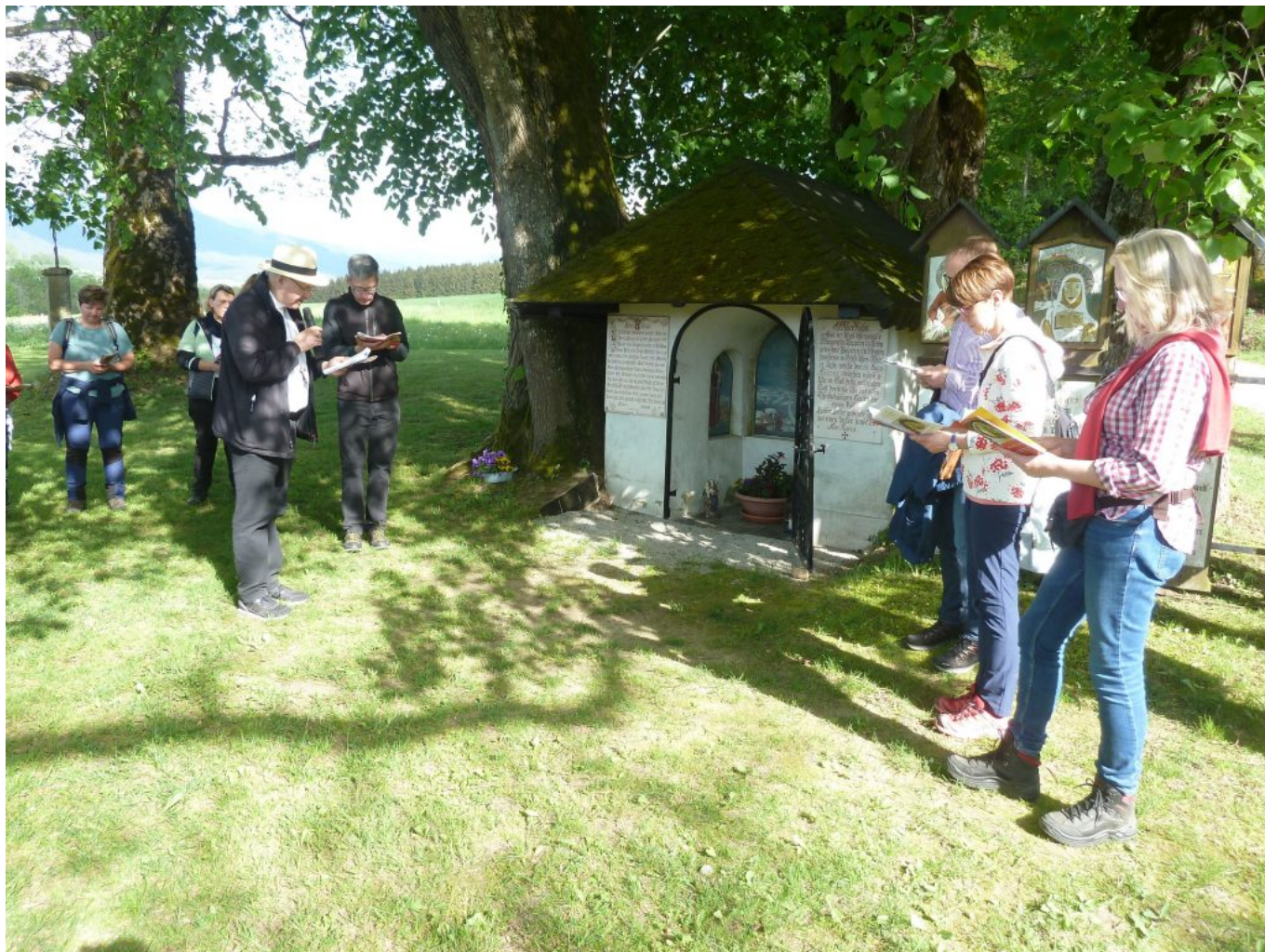
Eine Gebetsstation war die Kapelle auf Gut Kless.