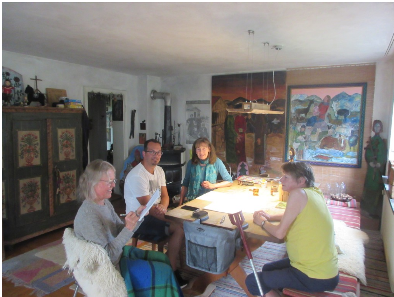
Pilgersitzung im Juli 2023