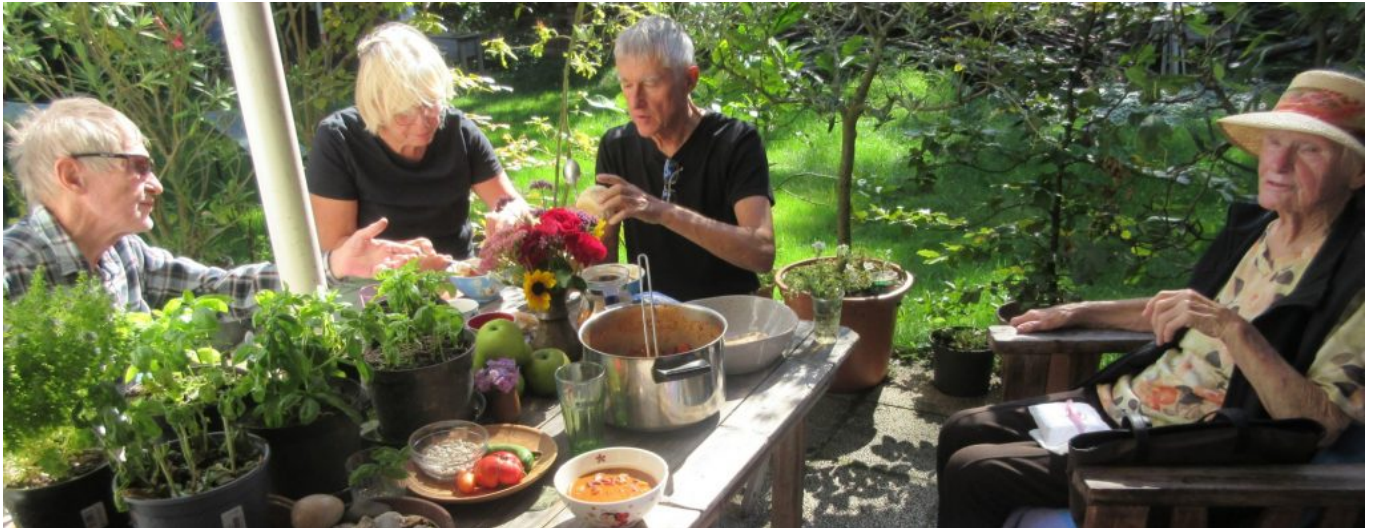
Mittagessen mit den „Kindern“

Der Wunsch ging in Erfüllung. Es wurde eine sehr schöne Feier: