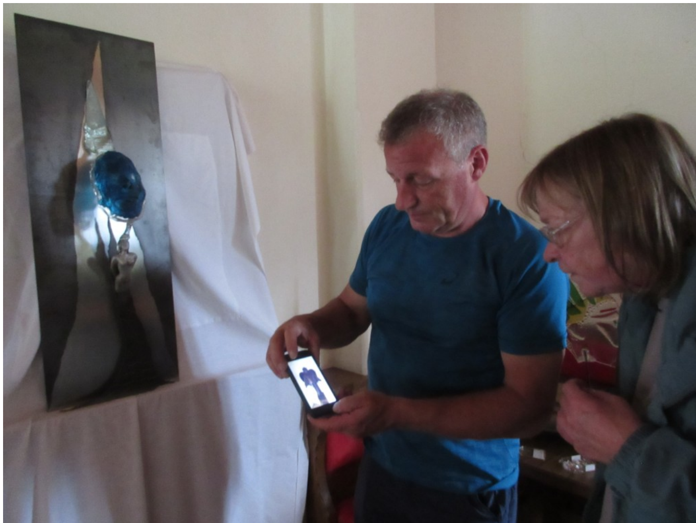
Offen und empathisch für Kunst