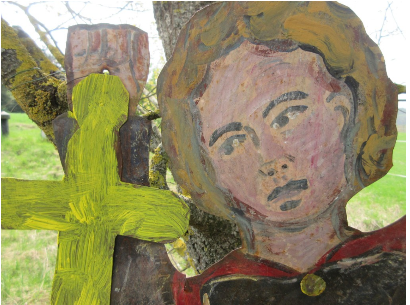
Sanftes Gesicht mit Lichtschwert