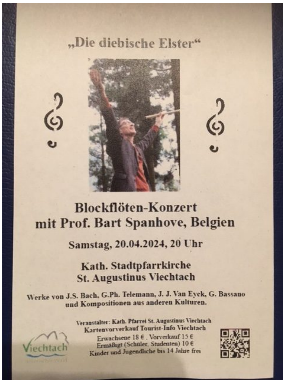
Plakat zum Konzert

Liebe Konzertfreunde, herzliche Einladung zum Konzert