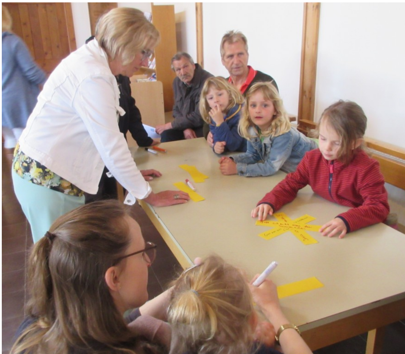
Am Maltisch Nr.1