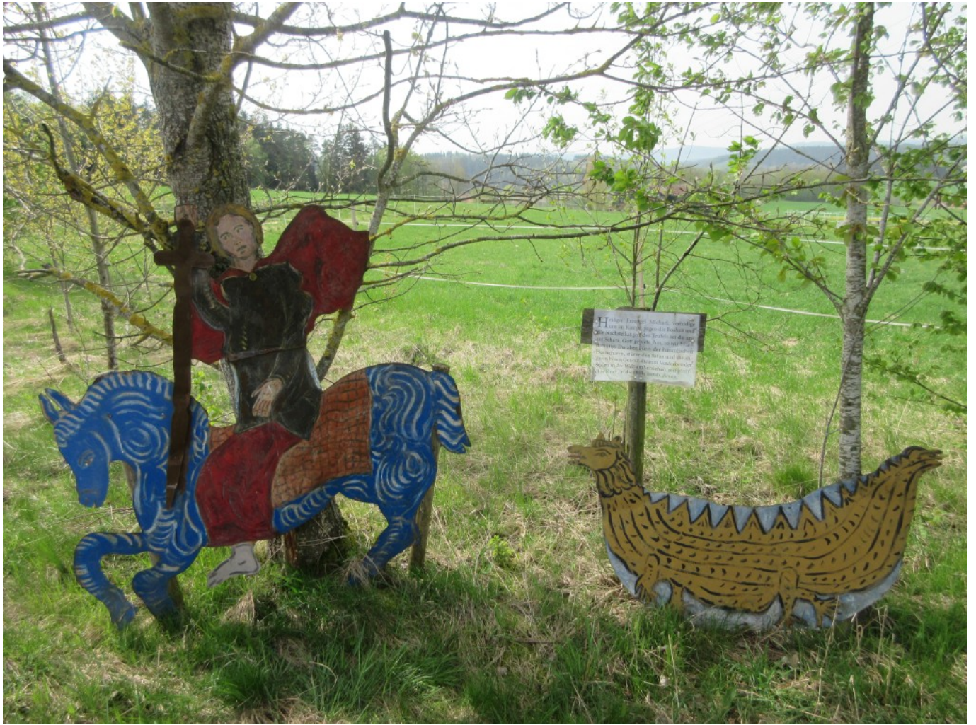
Die Szene in Vollansicht