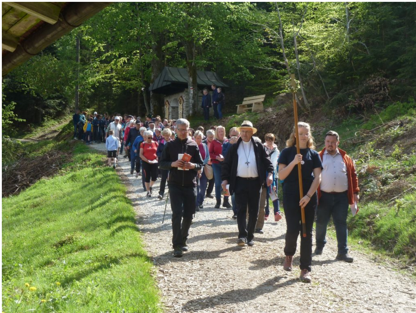
Durch die aufblühende Natur folgten die Pilger dem Prozessionskreuz.