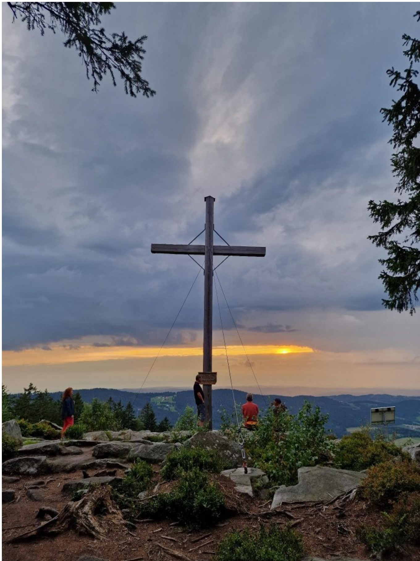
Einige wanderfeste Gläubige finden sich zur Abendandacht auf der Käspattn zusammen.