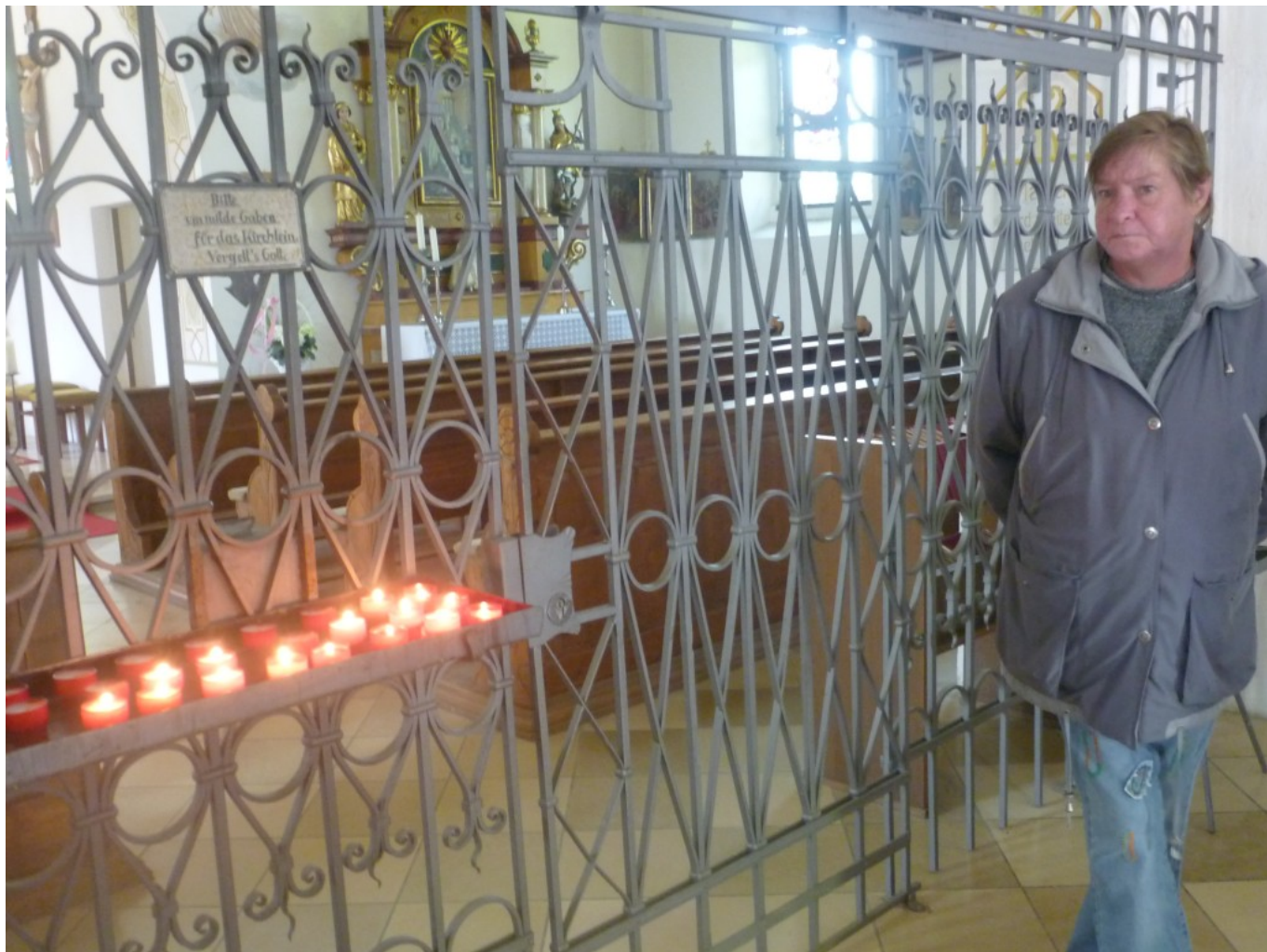
Kerzenlichter im Kolmsteiner Kircherl am Wolfgangsweg