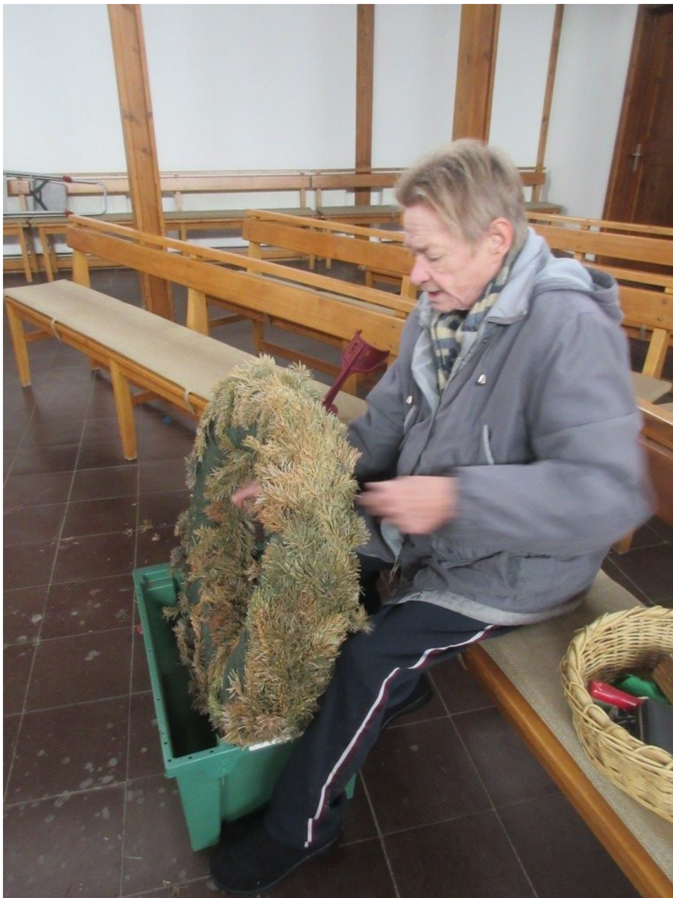
Kirche – Adventkranz vorbereiten