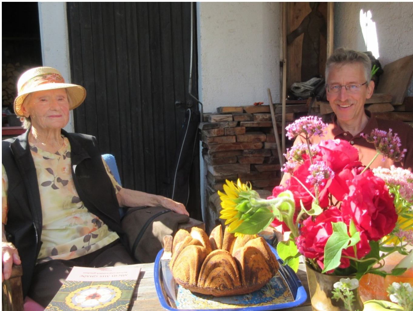
Der Pfarrer ist gekommen!