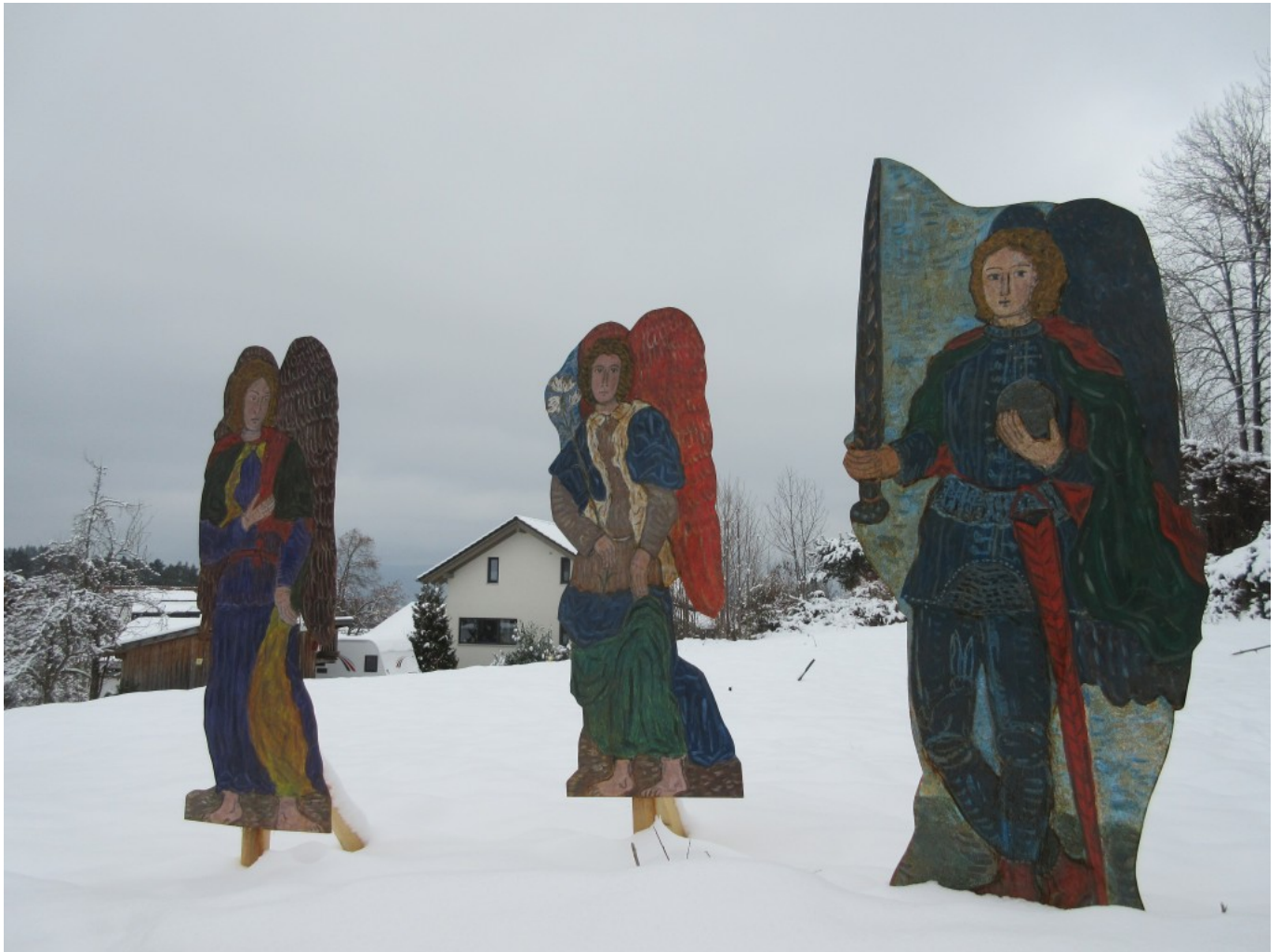
Raffael, Gabriel und Michael, dargestellt in Blech von der Künstlerin Dorothea Stuffer am Lichterweg in Kollnburg im Januar 2021