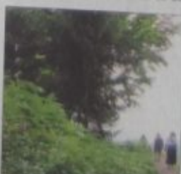
Ein guter Ausblick in die Zukunft.