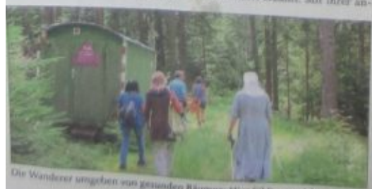
Die Wanderer umgeben von gesunden Bäumen: Hier fühlt man sich wohl.

Der Baumschutzengelweg ist nicht nur ein Appell an alle Waldbesitzer, sondern auch an die vielen Spaziergänger: Der Wald geht alle etwas an und mit sorgsamem Pflege und schützendem Umgang können wir noch lange die wundervollen Seiten der Natur genießen.