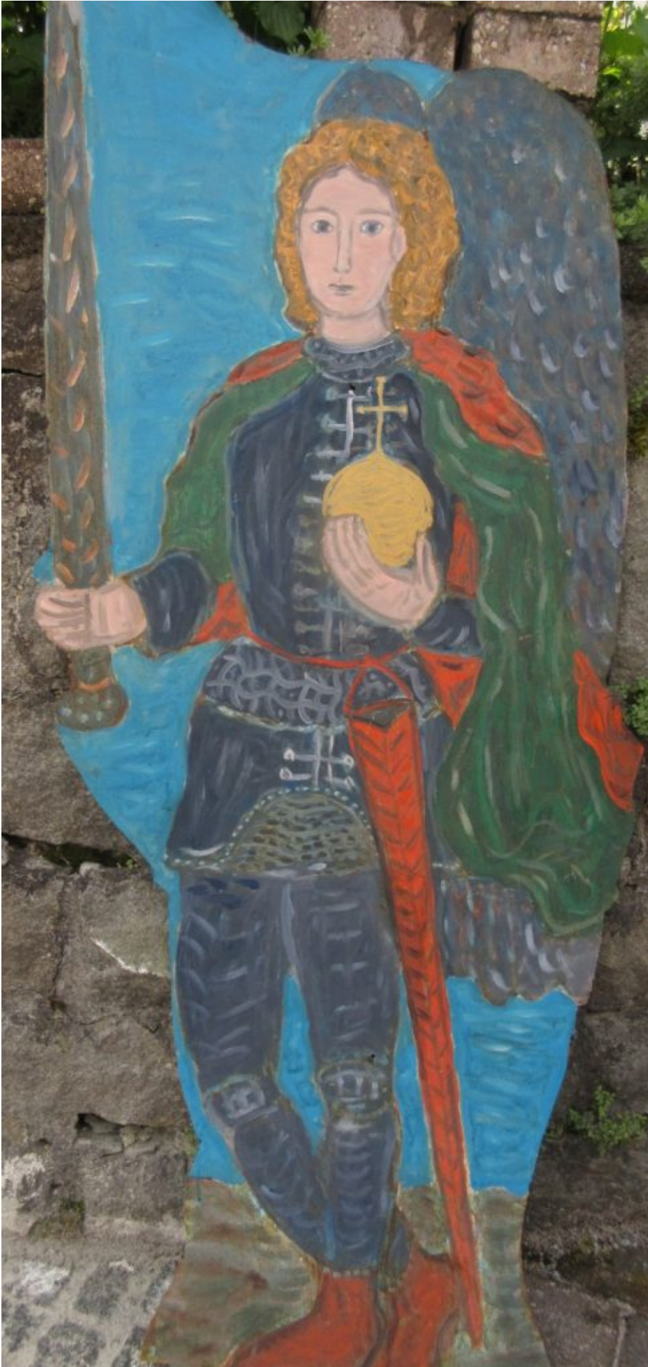
Der Erzeengel Michael