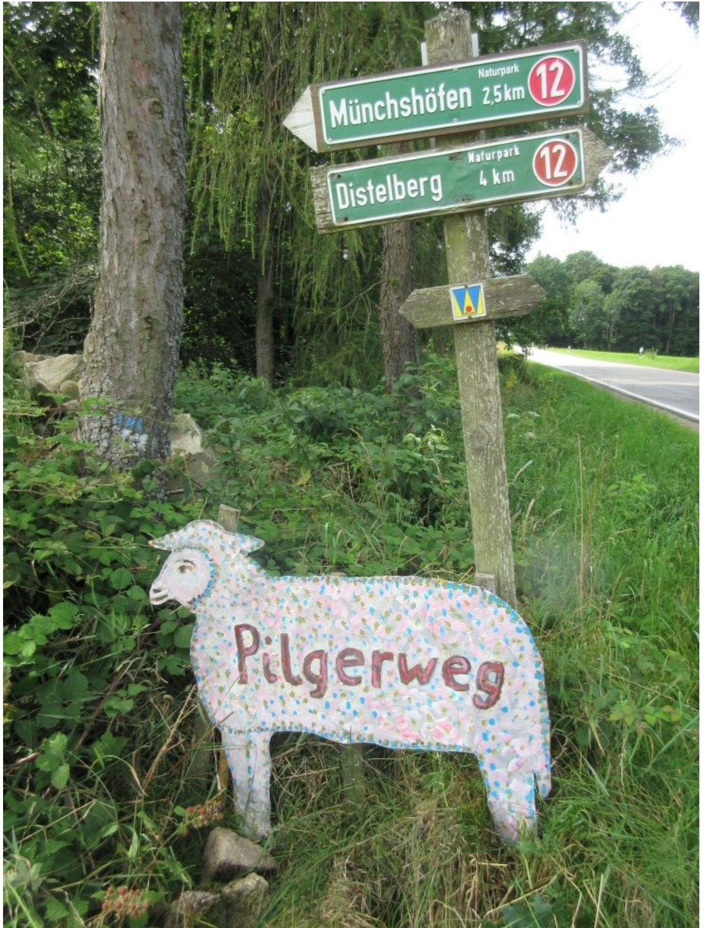
Dieses Schaf heißt "Rosa" und steht in anderer Richtung, nämlich bei Münchshöfen, und wurde auch frisch renoviert.