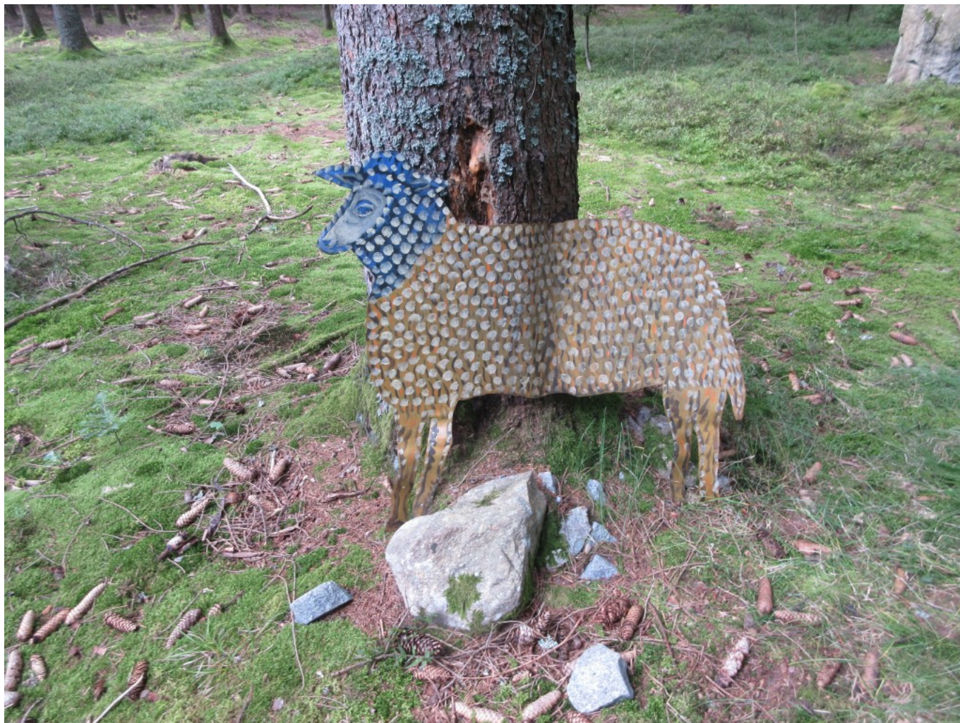
Zuerst mal das Schaf aufrichten