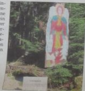
Die Engel bringen Segen für den Weg.