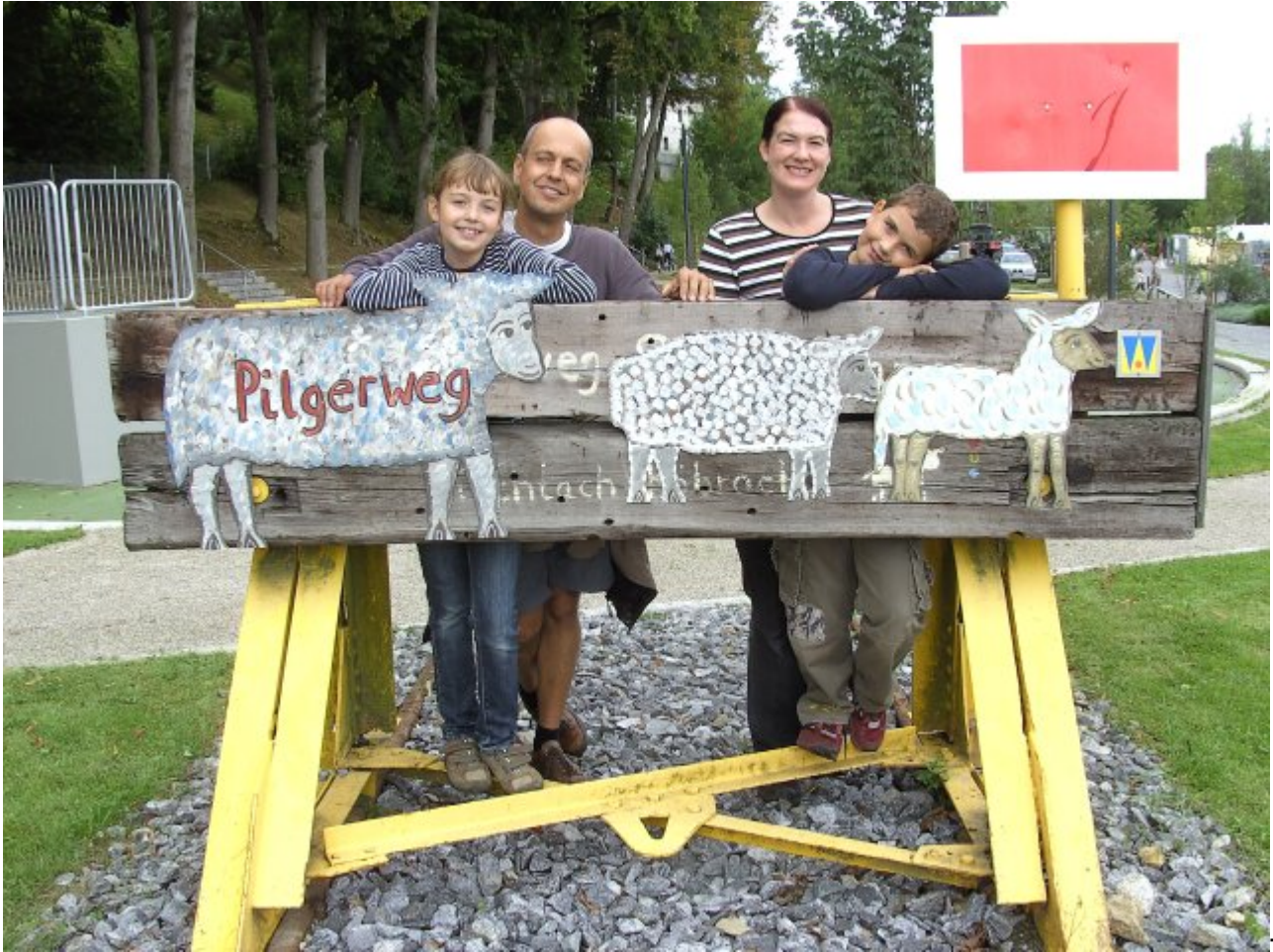
Tou risten bei den Blechschafern beim Bahngleis in Viechtach