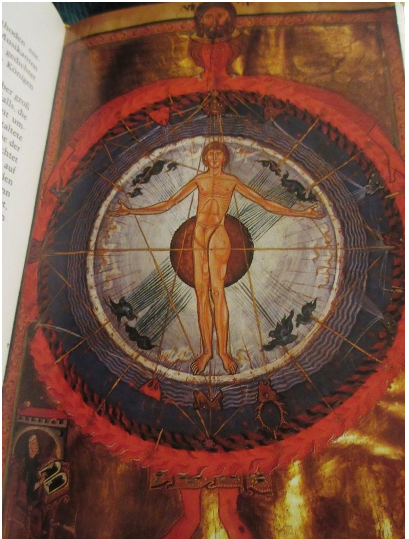
„Kosmos, Leib und Seele“ aus dem Liber divinorum operum I.4 Hildegard schaut den Kosmos – nicht als Welten des Zufalls,