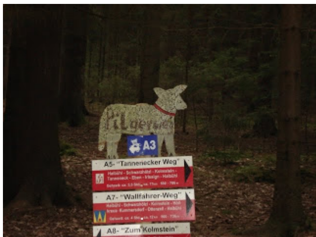
Wolfgangsweg-Blechschaaf im Wald am Wolfgangsweg zum Kolmsteiner Kircherl