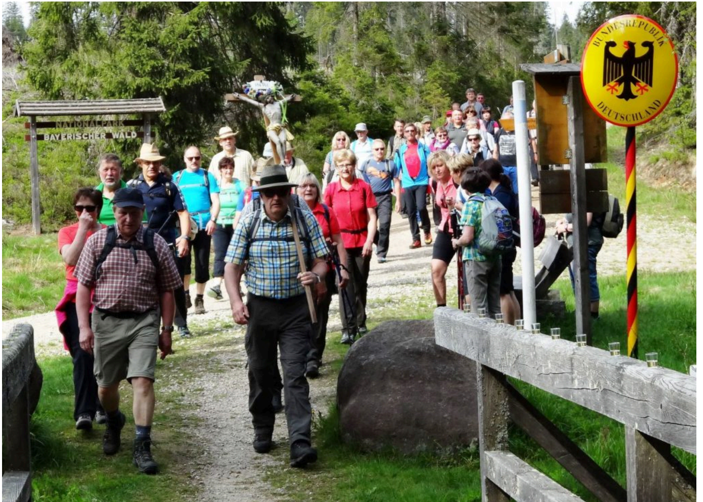
Wallfahrer in Böhmen