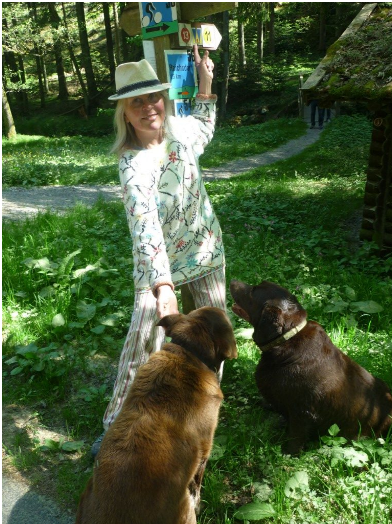
Foto: Dorothea Stuffer, 2.Vorsitzende des Verein Pilgerweg St.Wolfgang, ist mit zwei Pilgerbegleiterhunden unterwegs beim