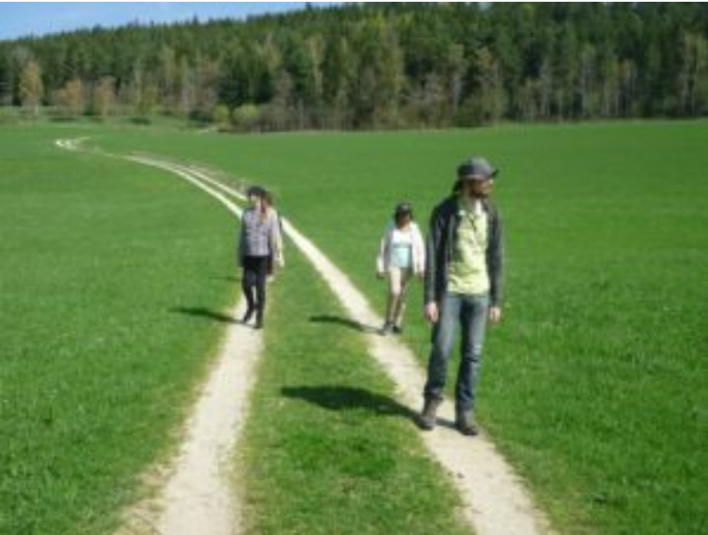
Staunen über den Frühling am Engelweg