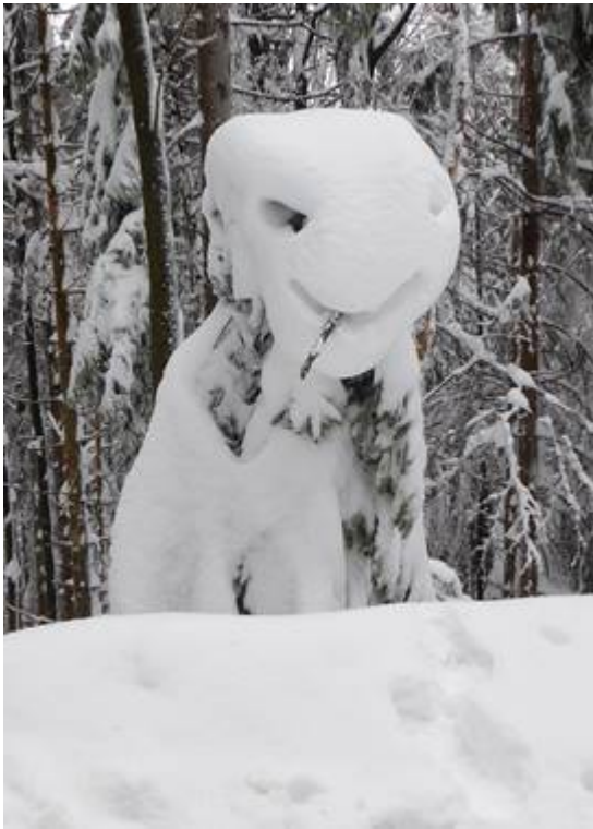
Lachender Schnee-Engel, gefunden und fotografiert von Pilger Rudi Simeth