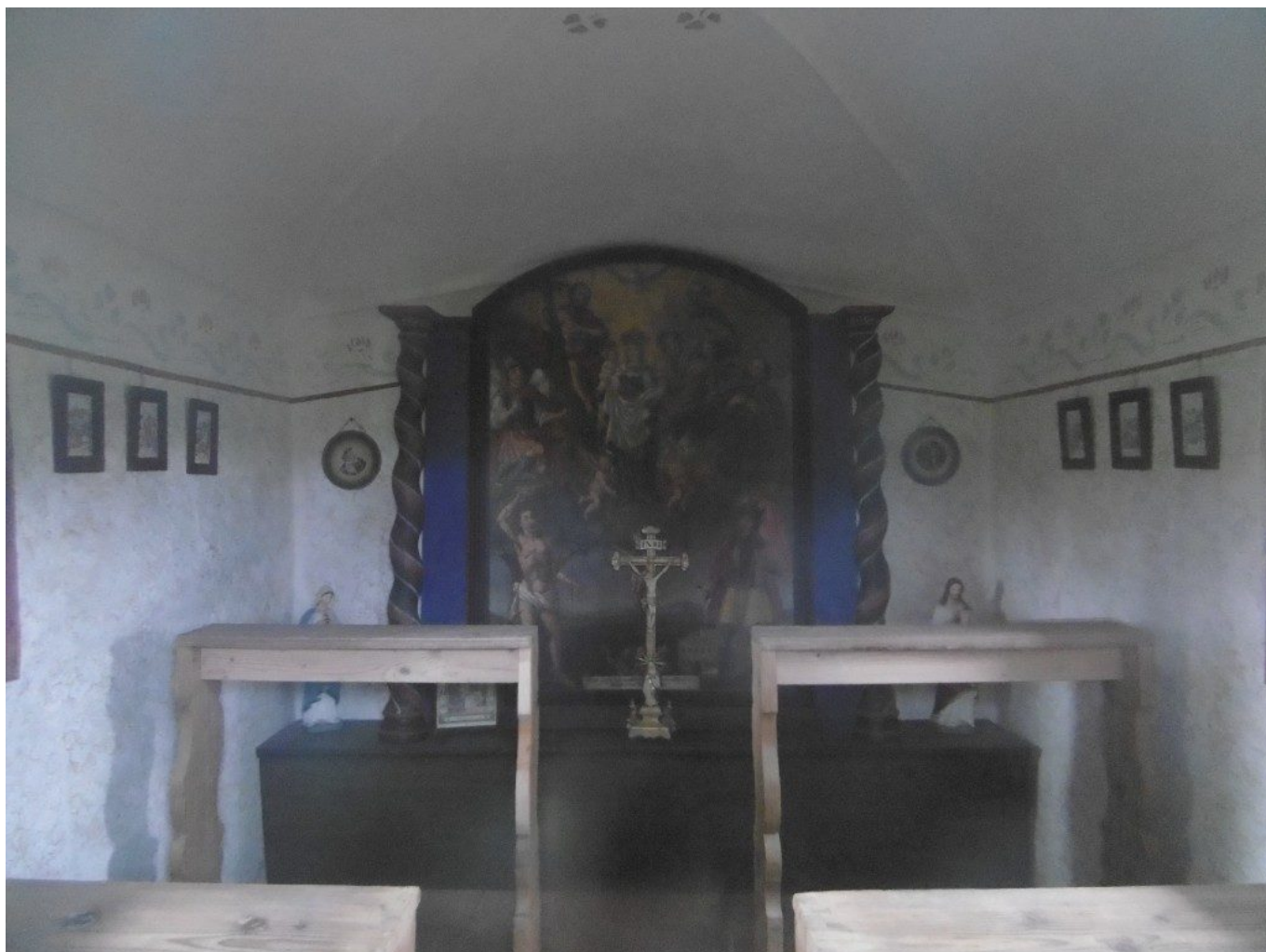
Das Innere der alten Holzkapelle