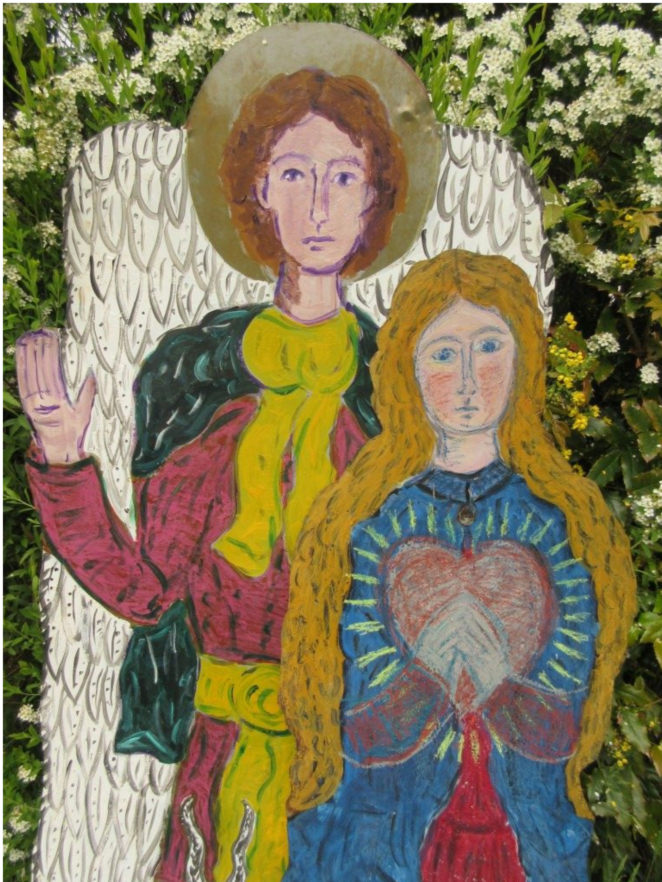
Maria und Engel – eine Blechfigurenkomposition von Dorothea Stuffer