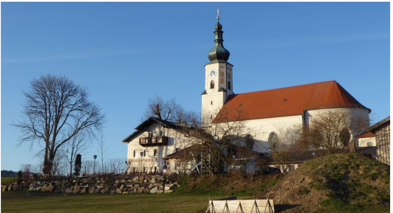
Kirche und Wirtshaus „Zur Klause“ in Weißenregen

Und hier der Link zur Diashow, ortskundig informativ und