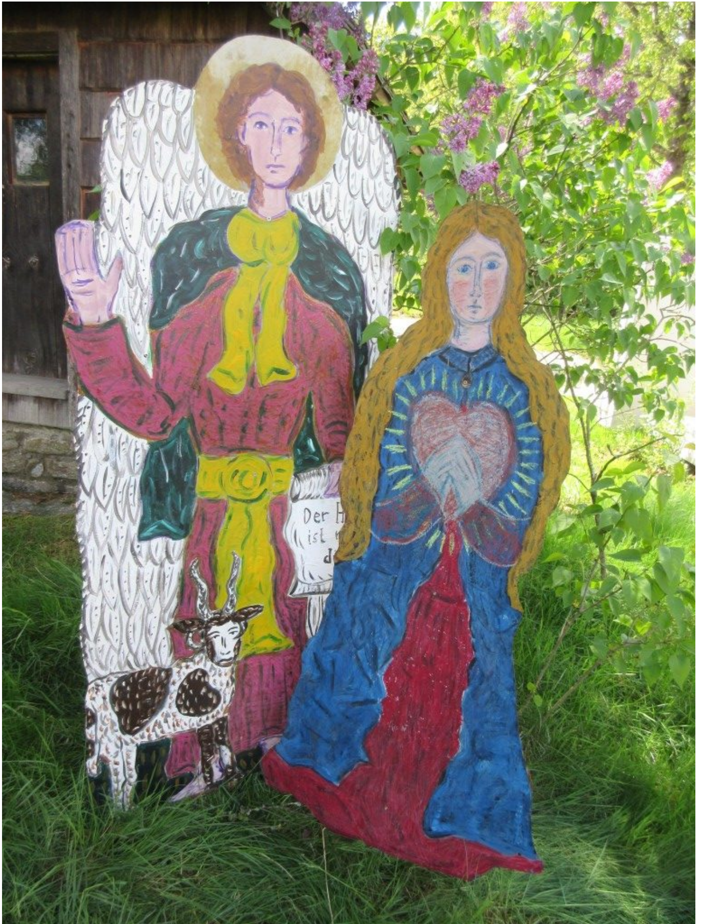
Das Ja der Maria, Blechinstallation