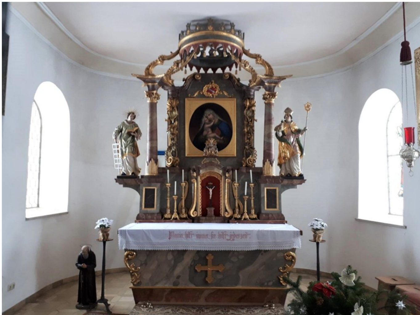
Altar in Osterbrünnl: Links unten Bruder Konrad, rechts oben der heilige Wolfgang mit Bischofsmütze, Hirtenstab und Kirchenmodell.