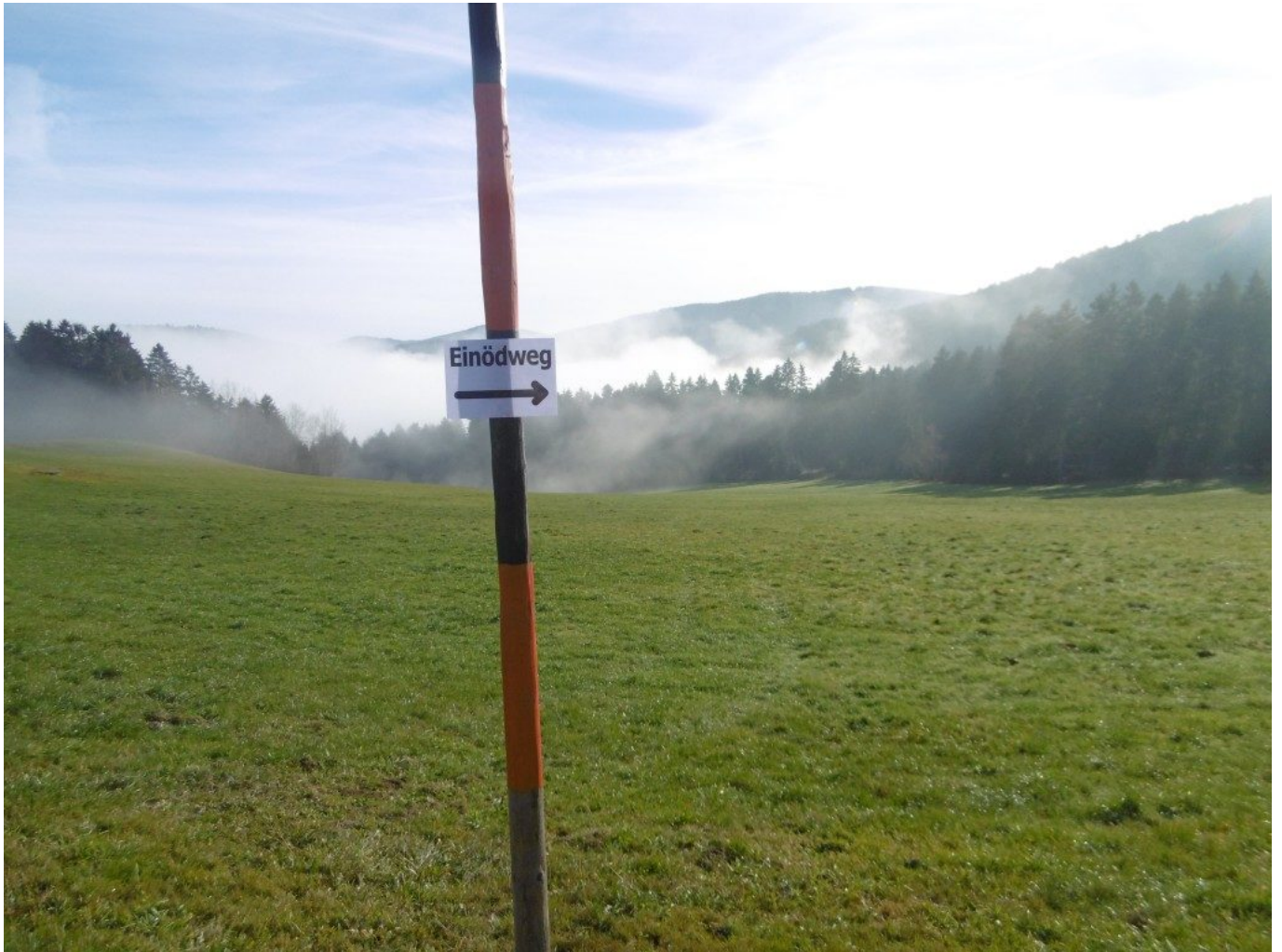
Am Einöd-Rundweg bei Berging

Hinweis aktuell: Wegen Krankheit kann die Lichtmess-Andacht nicht am Wastlhof stattfinden.