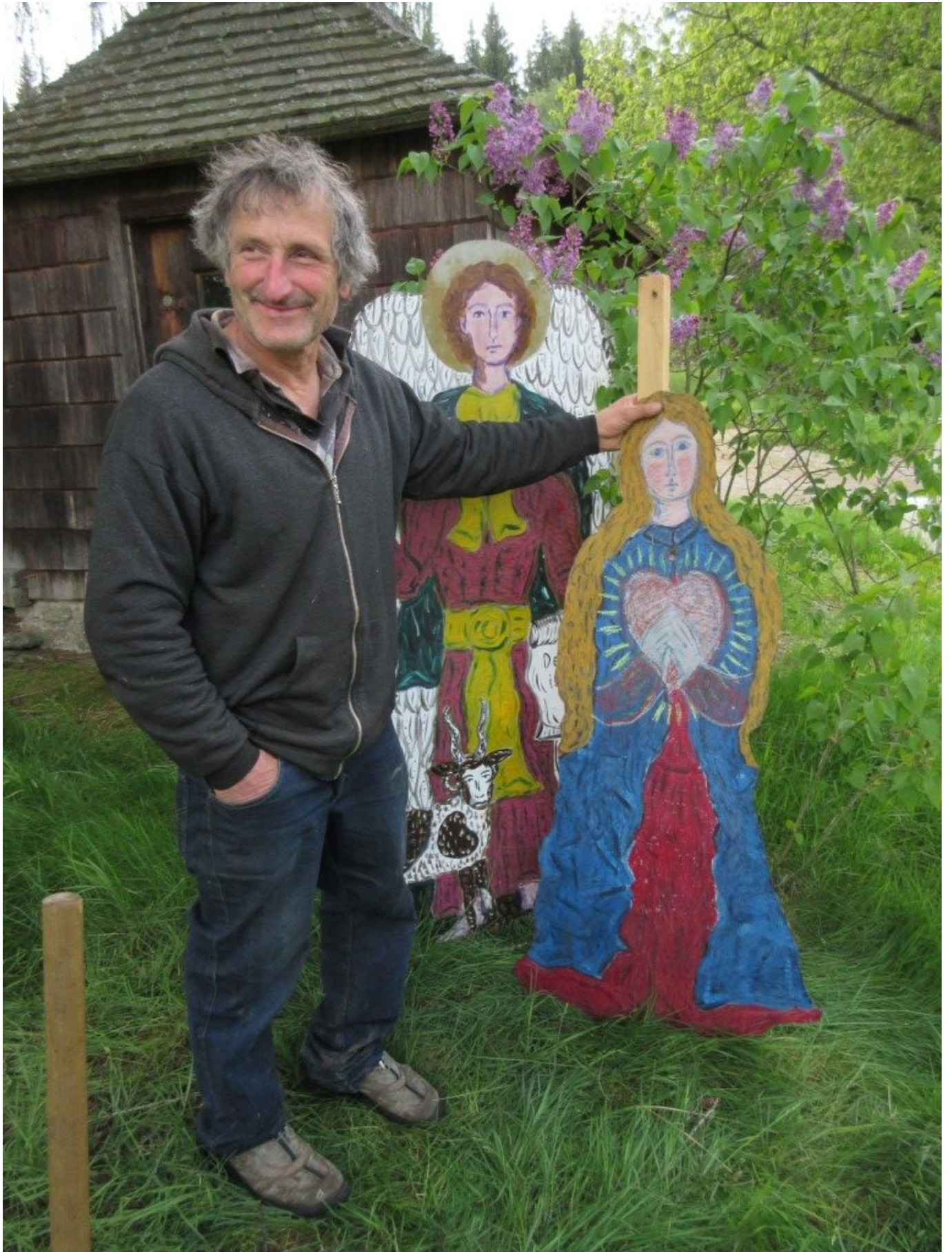
Mit dem Herzen dabei!