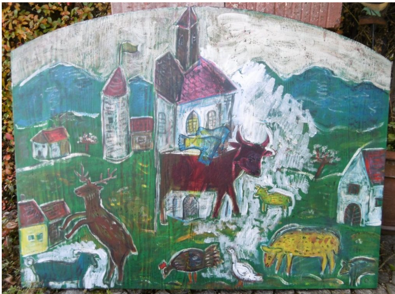
Votivtafel: "Im Dorf mit Tieren leben"