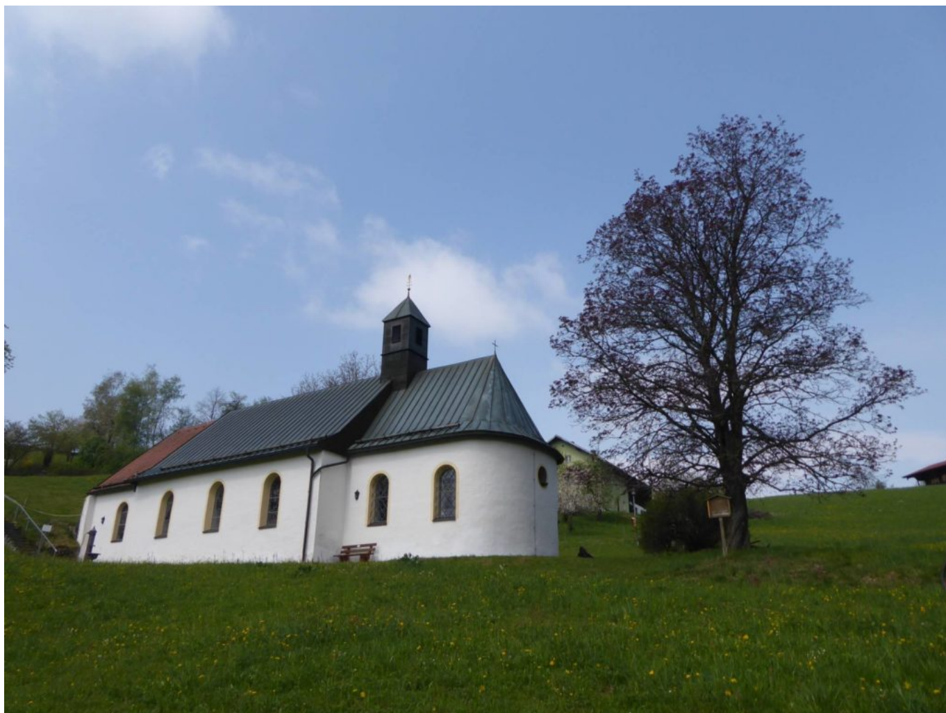
Das schöne Kirchlein Osterbrünnl