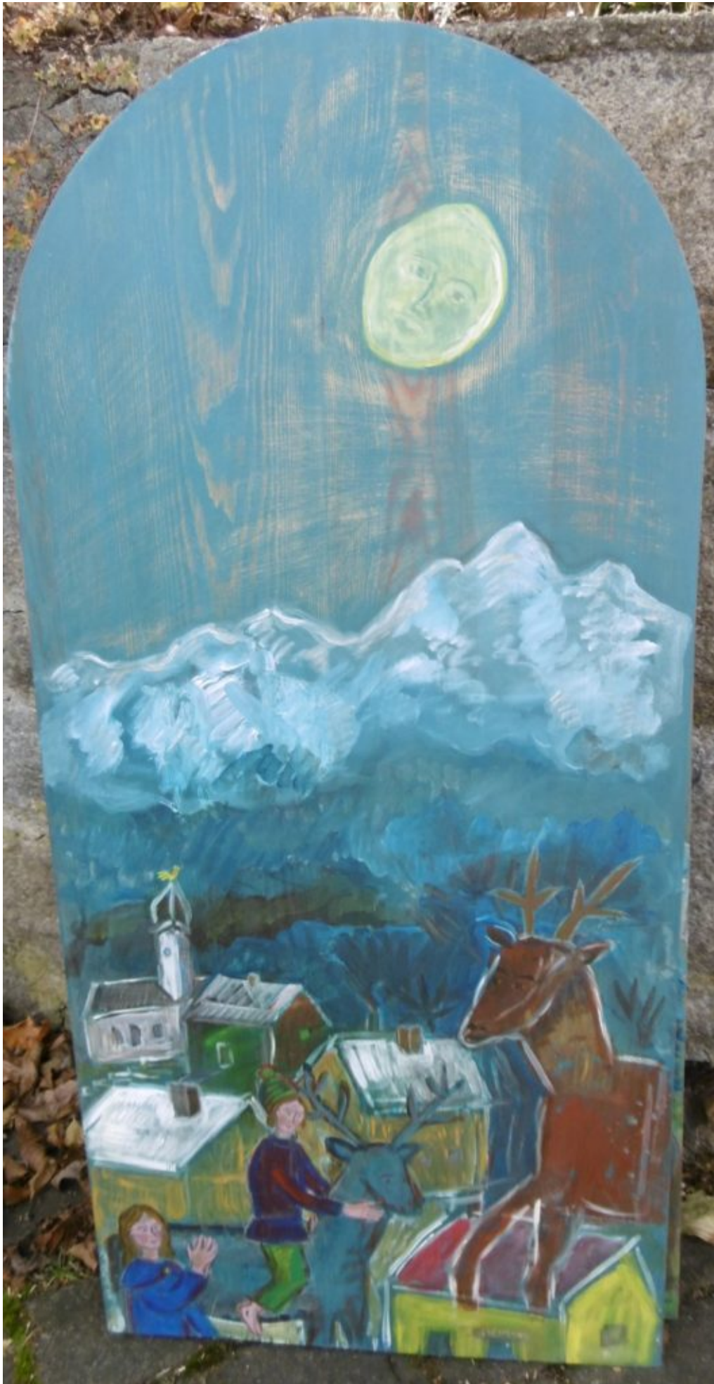
Der Sohn nimmt