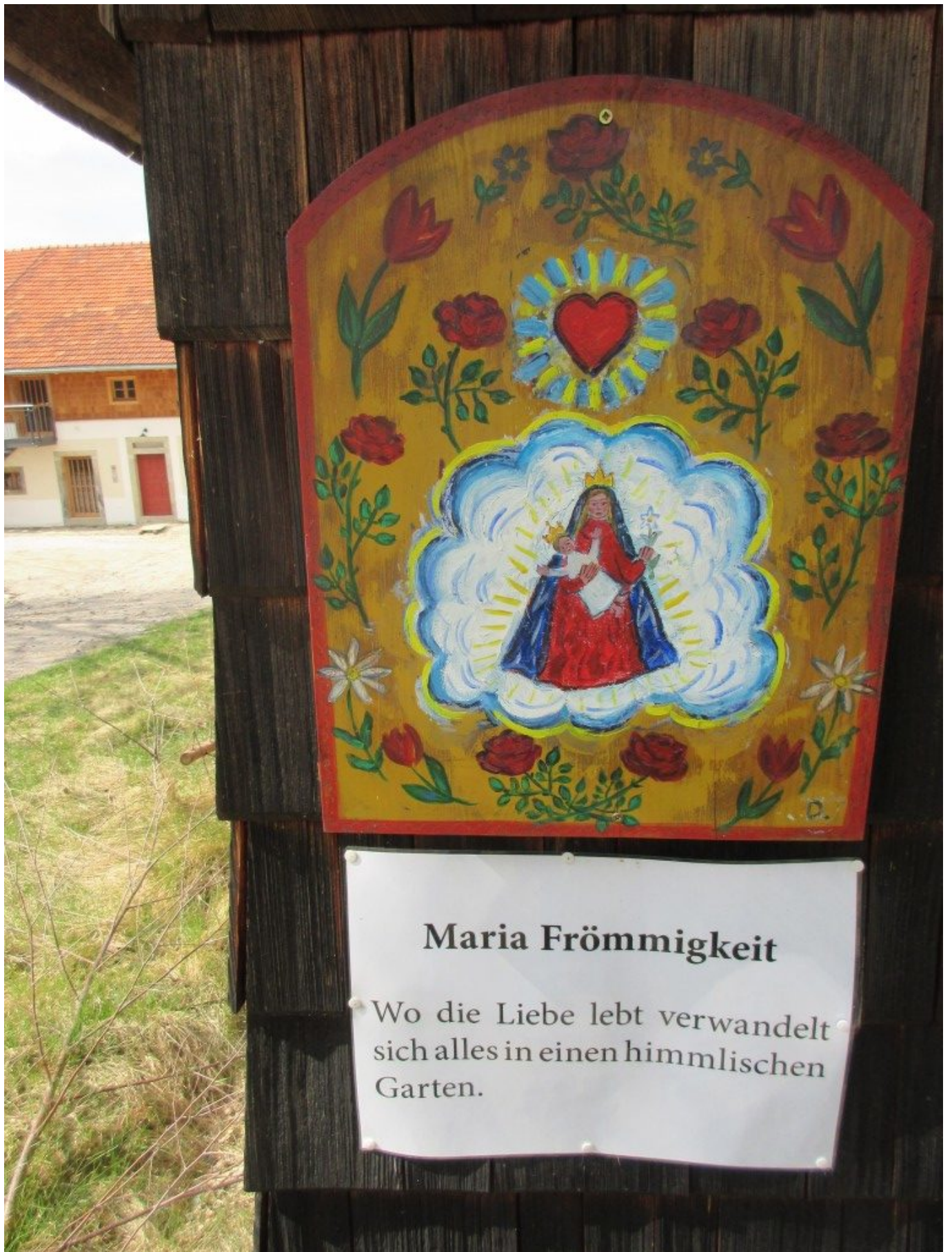
Votivtafel mit Impuls an der alten Holzkapelle, im Hintergrund das sich in Renovierung befindende Wohnhaus „Bernhard“