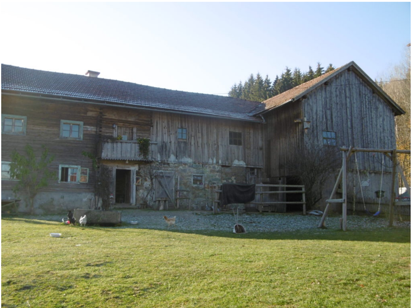
Alter Troidkasten vom Wastlhof

Am Samstag, den 2. Februar 2019 – das ist Lichtmess – findet am Wastlhof in Dörfl 45 eine ökumenische Andacht zum Thema “Licht in der Einöde” statt.