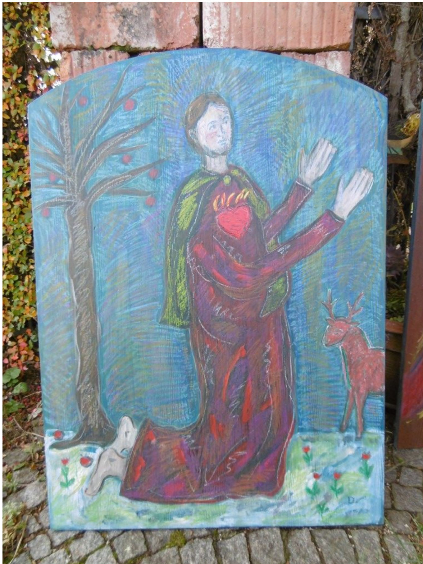
Votivtafel "Nachtbeter im Schnee"

Gerade meine innere Einöde schafft Raum für die Begegnung mit Gott.