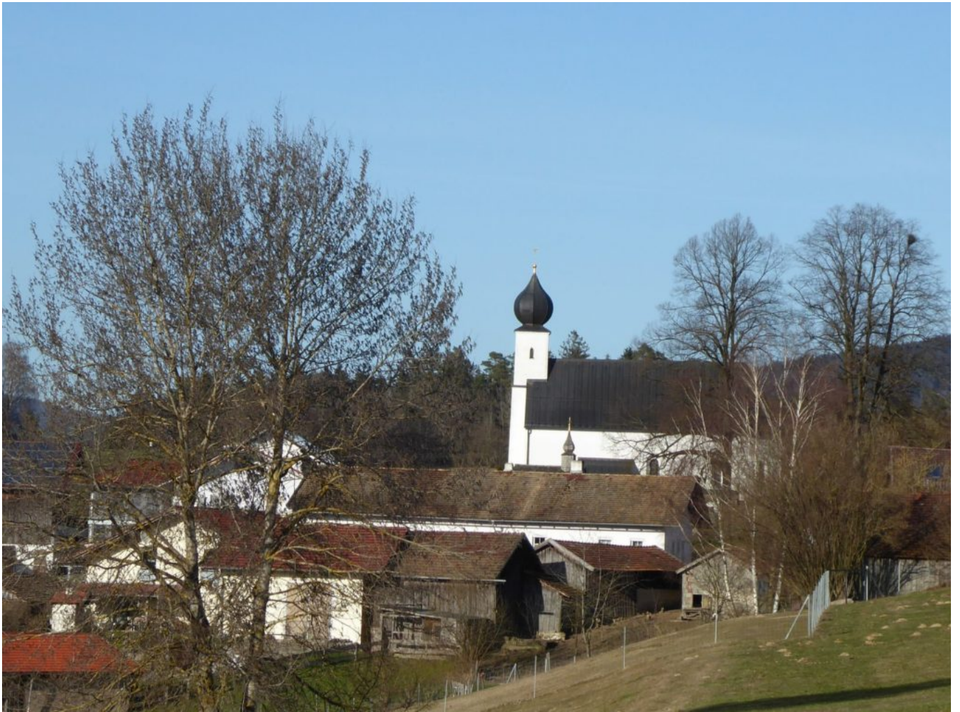
Sackenried Sonnenseite – bei Wallfahrten werden Blechtiere um den Altar getragen – ähnlich wie in Schönau