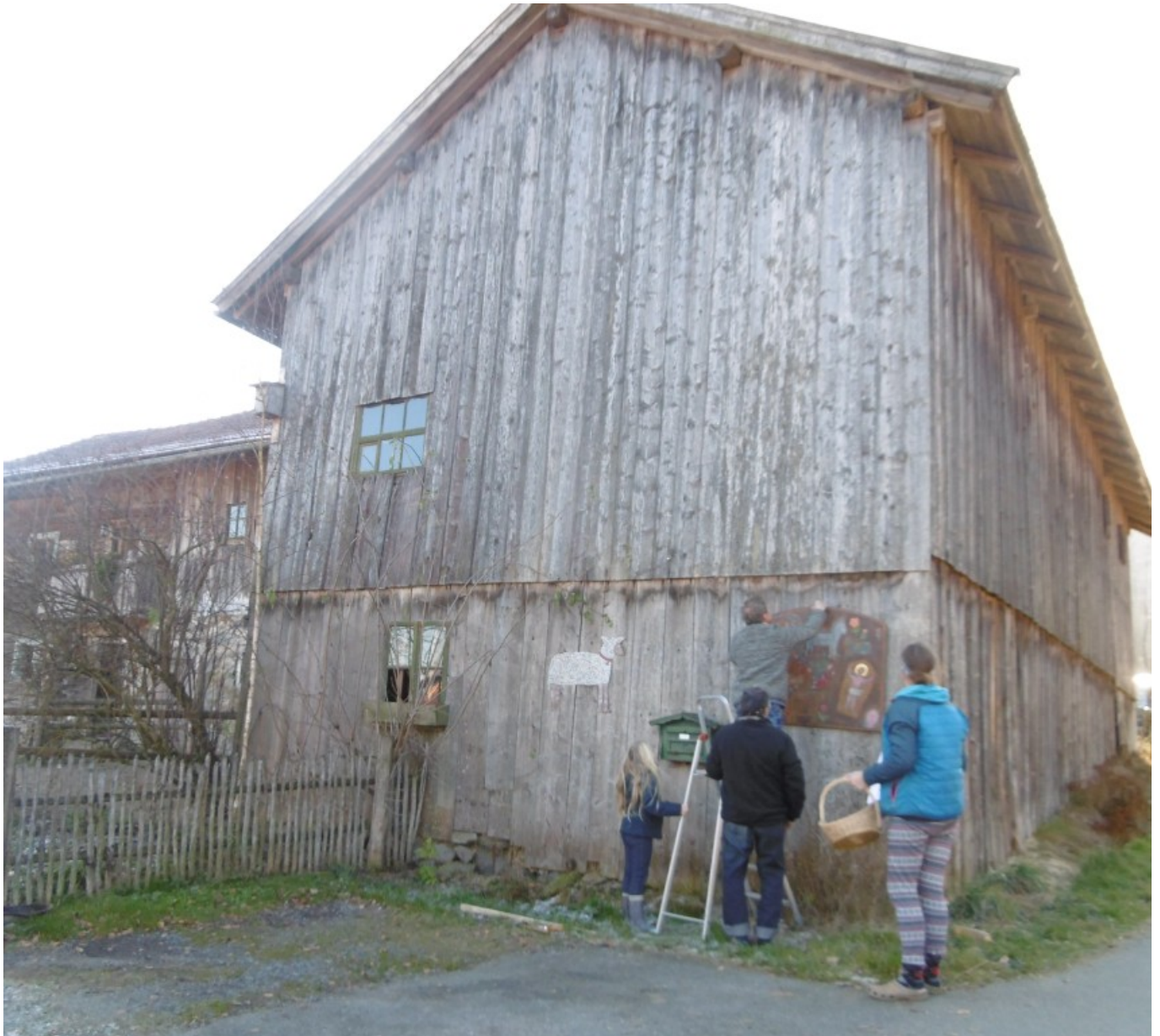
Anbringen der Holztafel "Weihnachten"