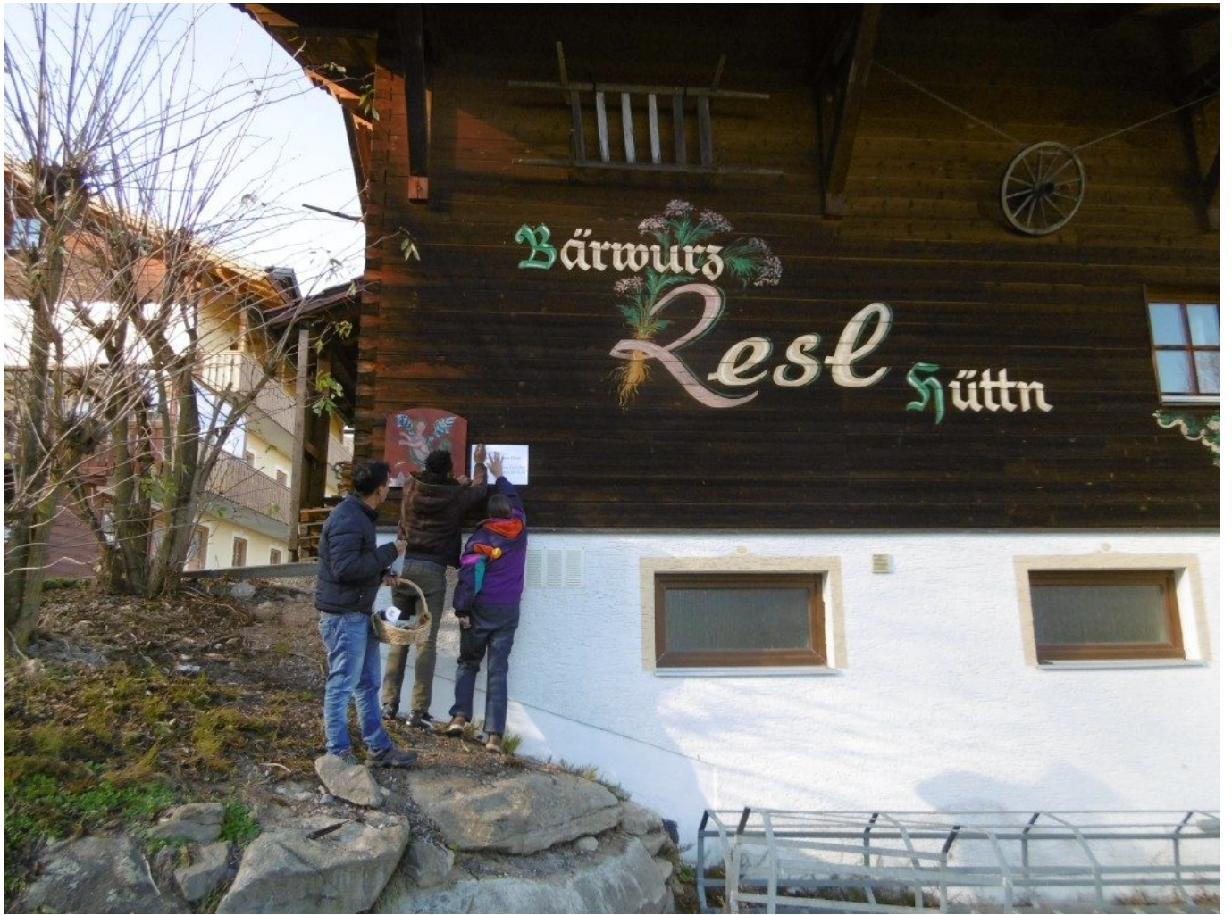
Team bringt Tafel und Impuls an.