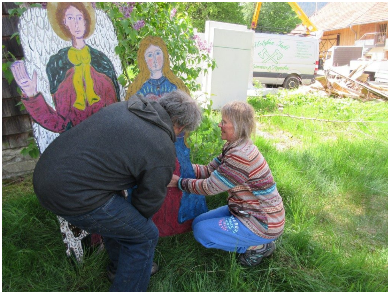
Im Hintergrund das denkmalgeschützte Bernhard-Anwesen, welches derzeit liebevoll restauriert wird