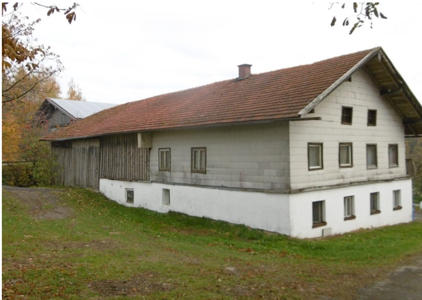
Anton Mader Wohnhaus