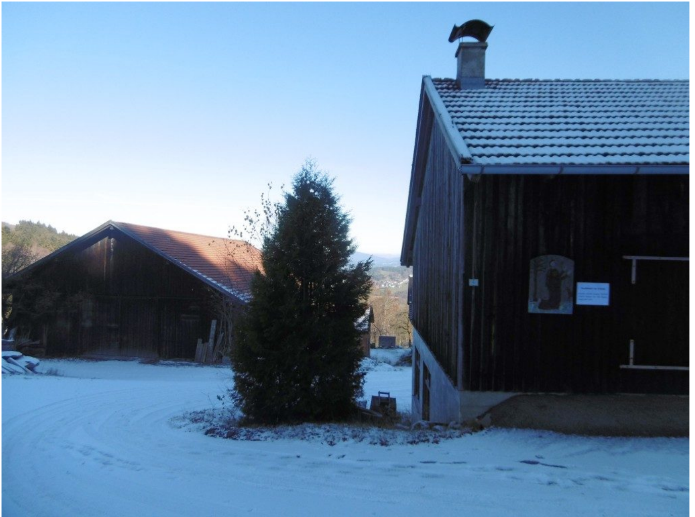
Gogl-Schuppen mit Votivtafel "Nachtbeter" und Impuls