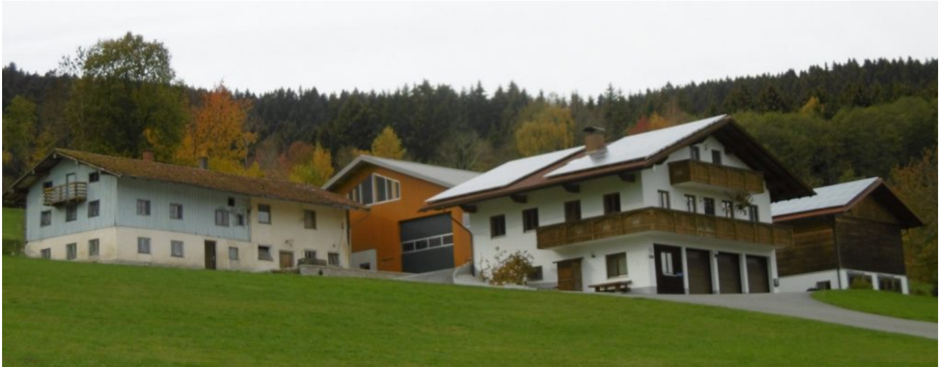
Hellblau: das alte Anwesen des Bruders