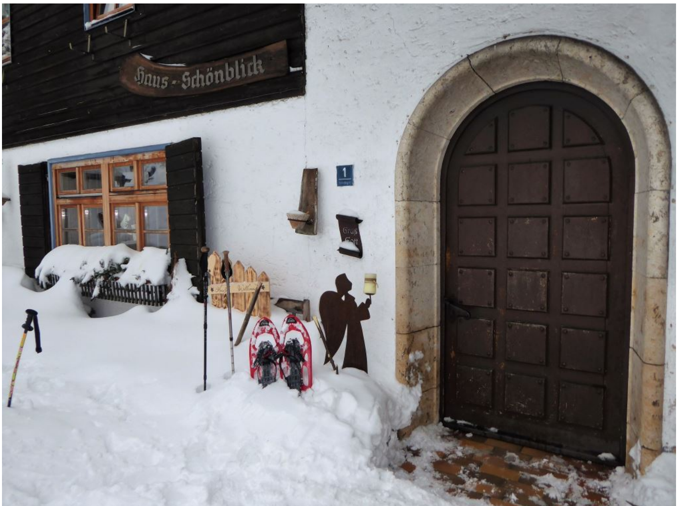
Engel vorm Berggasthaus Schönblick