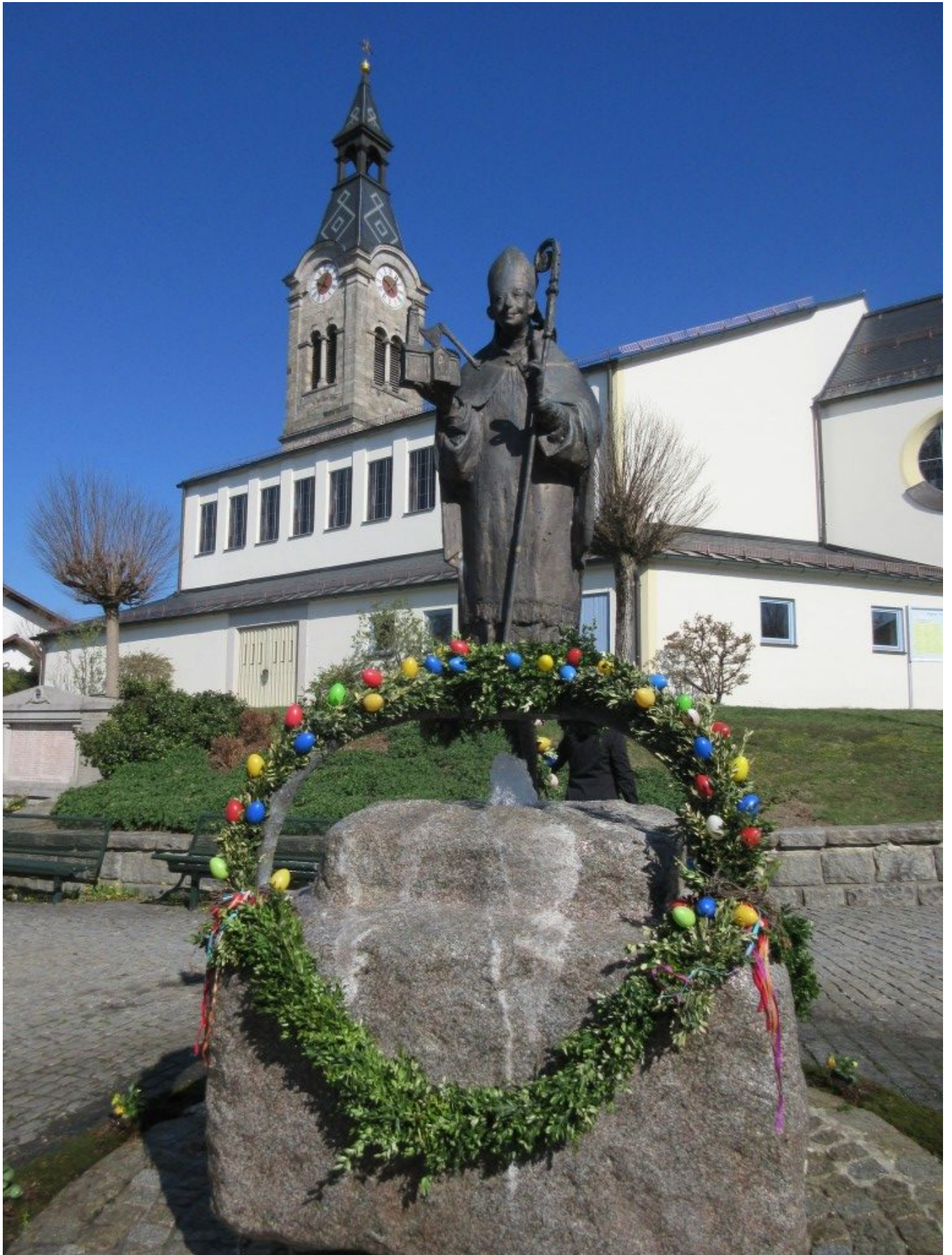
Der Wolfgangsbrunnen vor der Nikolauskirche in Böbrach ist derzeit traditionell österlich geschmückt.