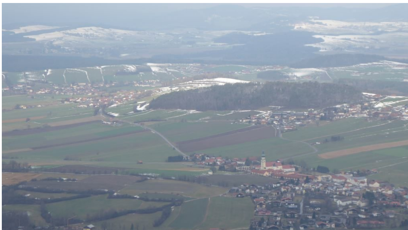
Blick nach Neukirchen beim Heiligen Blut – am Wolfgangsweg Richtung Tschechien