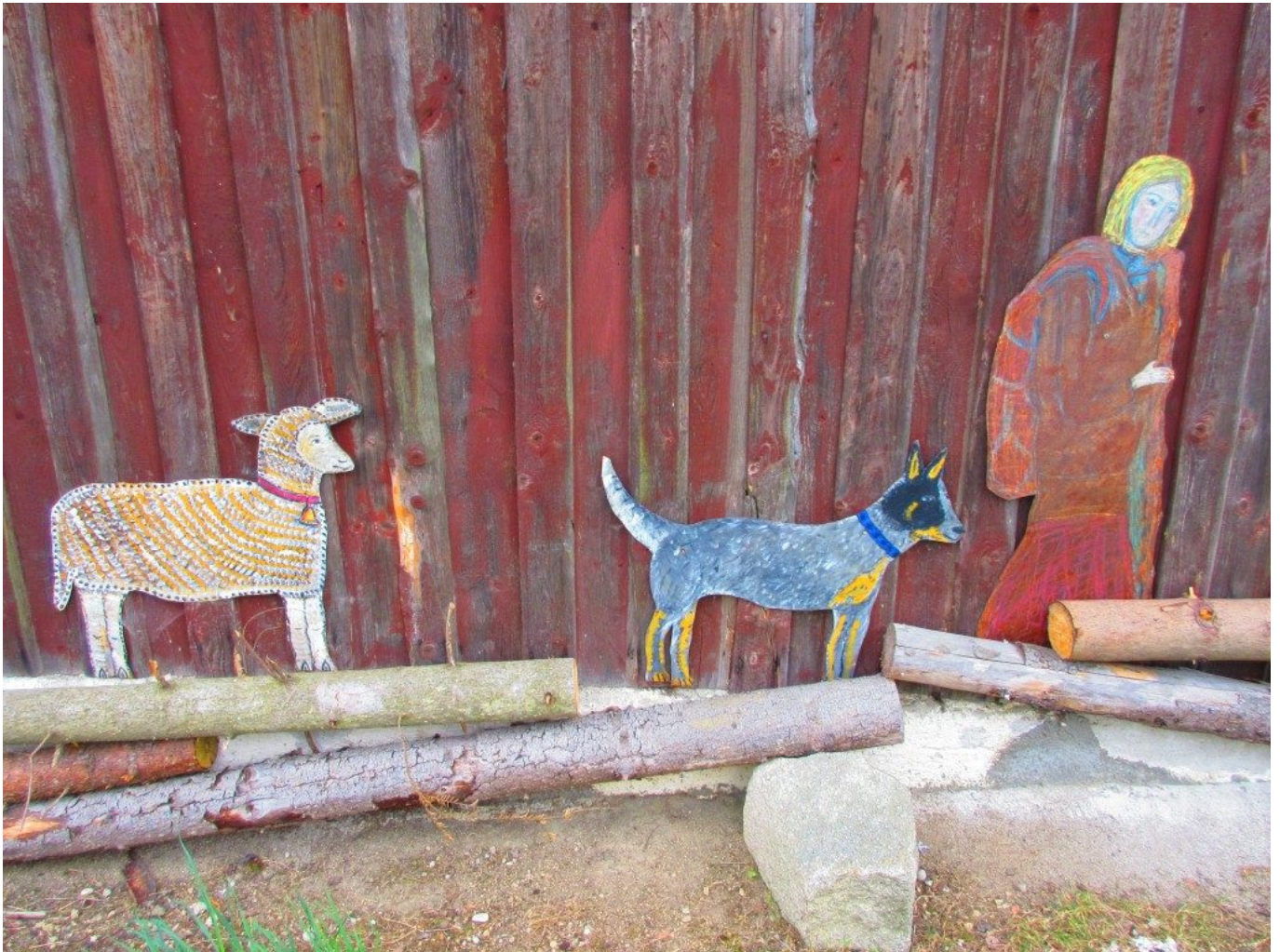
Pilgerin unterwegs mit Hund und Schaf, Blecharbeit am Engelweg, am Gnadenhof Xaverhof

Wir gehn – da trifft sein Wort uns auf der Reise, und da wir anschauen, hat das Wort Gestalt, und dieses Wort wird Antwort uns und Speise, und dieses Wort wird Antwort, Trost und Halt.