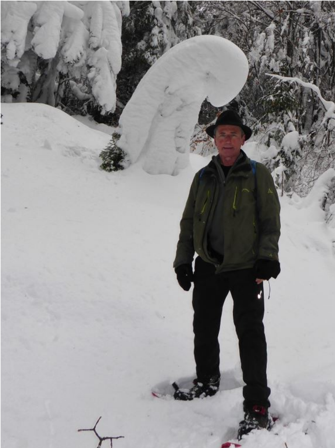
Schnee- Wunderwelt am Hohen Bogen: Schutzengel aus Schnee beschirmt