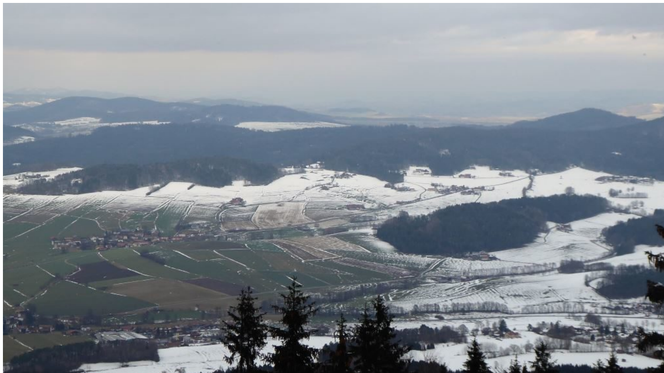
Blick vom Hohen Bogen nach Atzlern, Rudis Geburtsort Richtung Böhmerwald