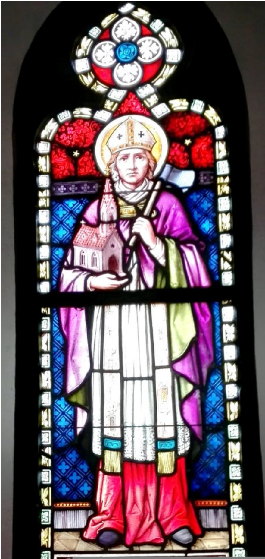
Der heilige Wolfgang