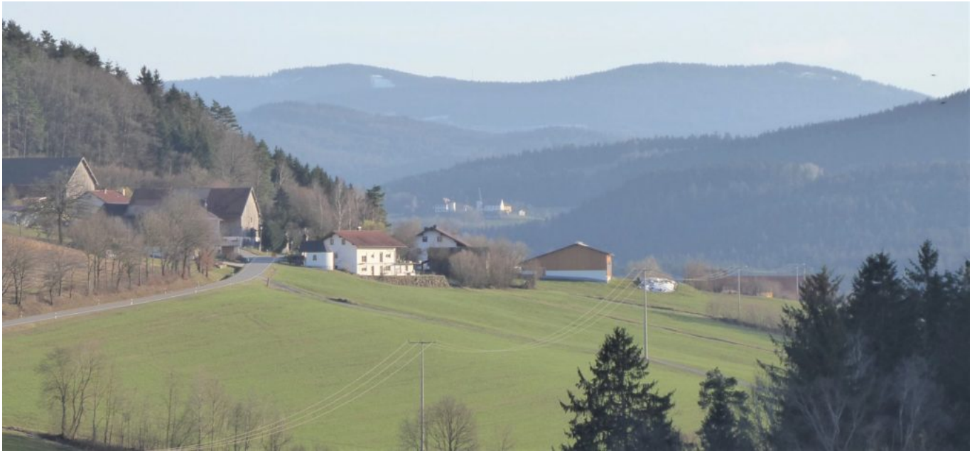
Hafenberg – Krailing – Pröller und Käsplatte vom Abendlicht bestrahlt

Links oben am Horizont Pröller und Käsplatte und das 14- Nothelferkirchlein Sackenried