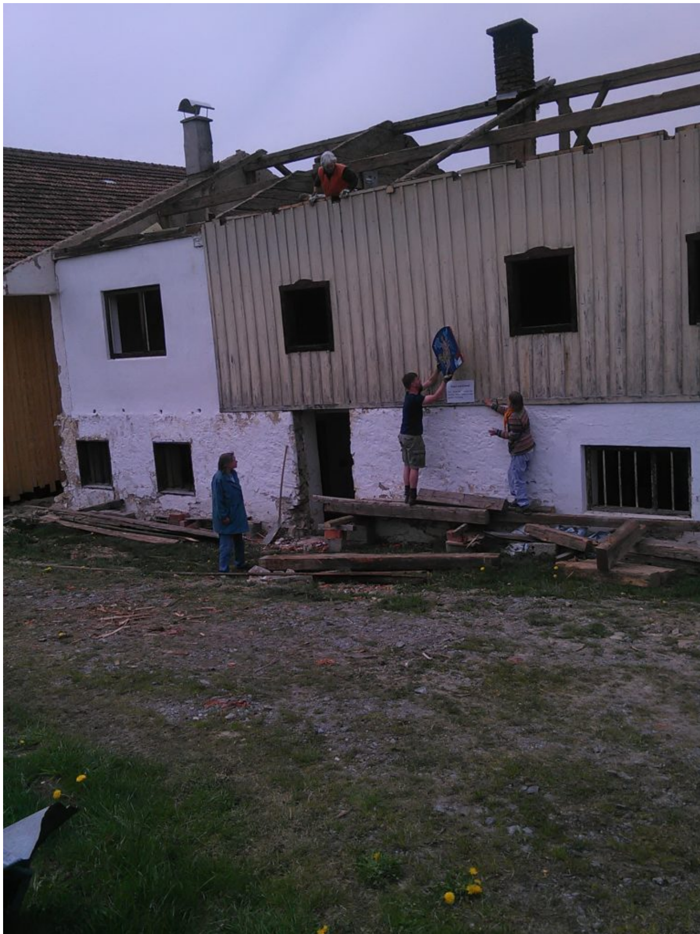
Das Bielmeier-Albert-Wohnhaus wird abgerissen, die Votivtafel mit Engel und Sinnspruch vorsichtig entfernt.