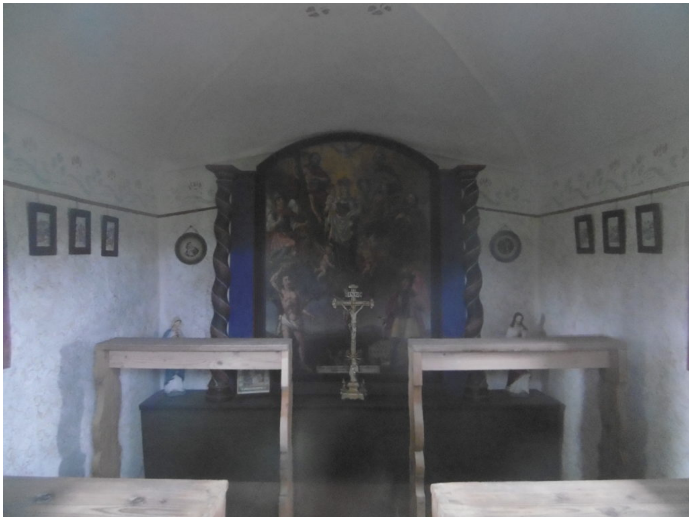
Das Innere der Kapelle