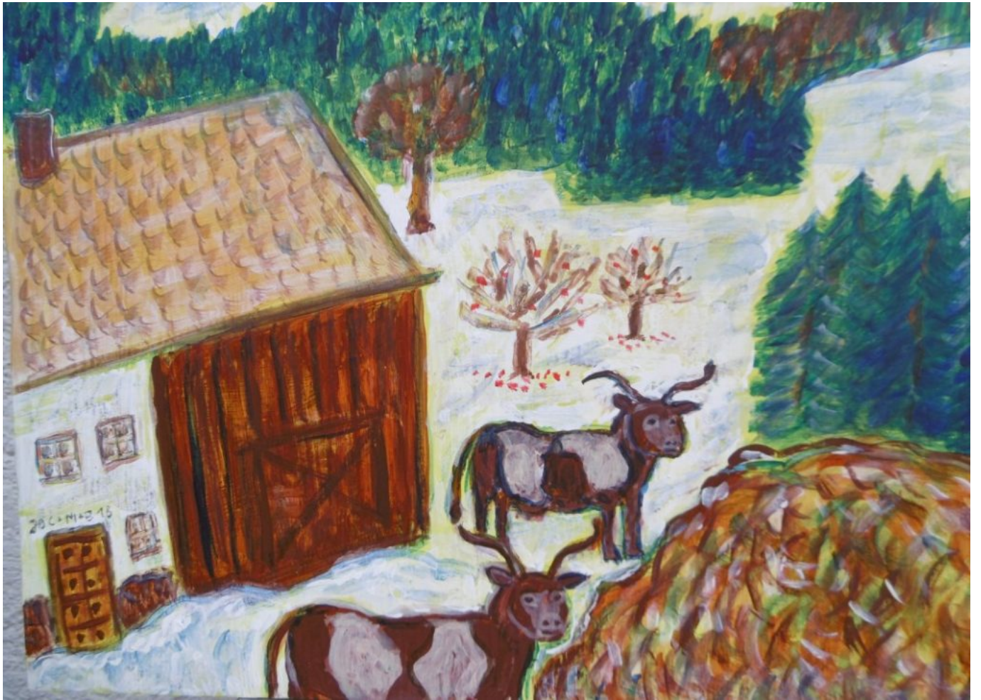
Detail: Kühe im Schnee und Misthaufen