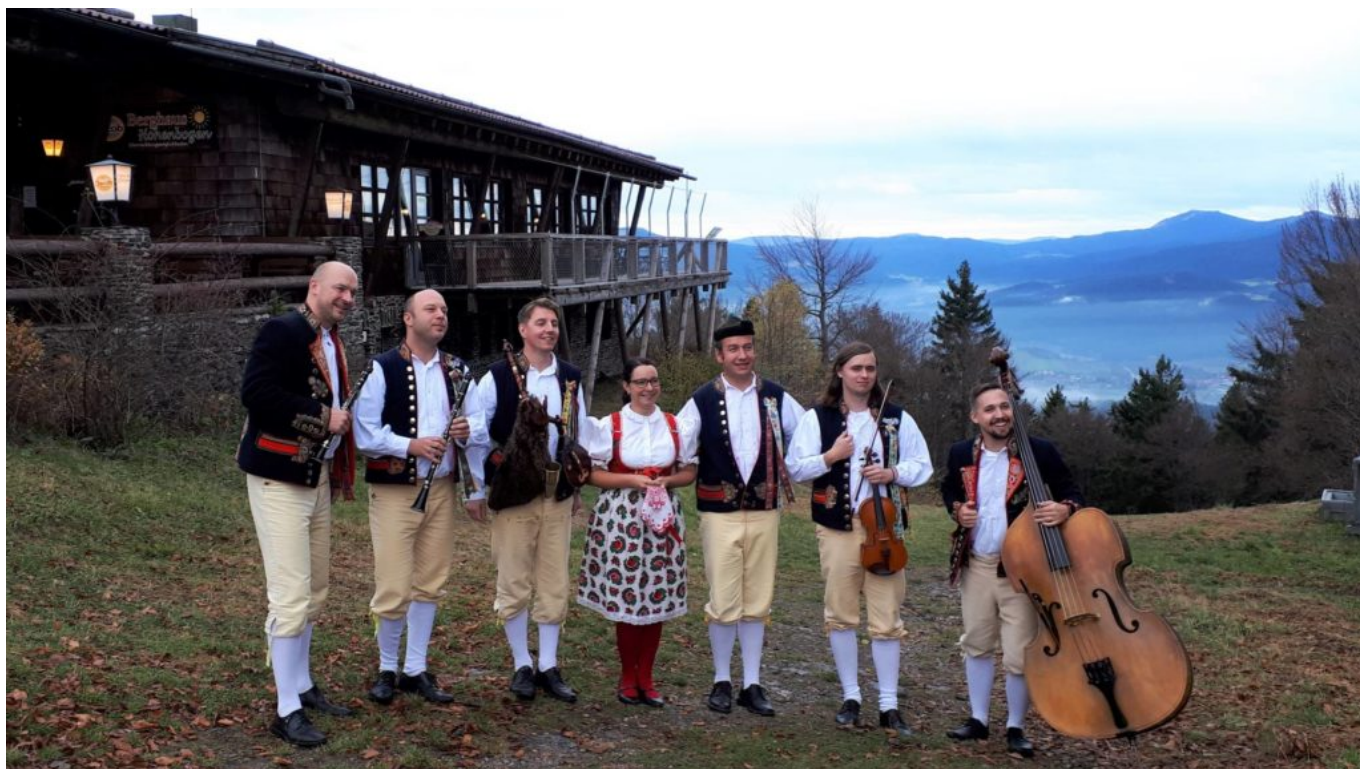
Chodische Musikgruppe aus Mrakov vor dem Berghaus Hohenbogen. Im Hintergrund der Arber und der Ecker Sattel, wo der Wolfgangsweg Richtung Böbrach verläuft.