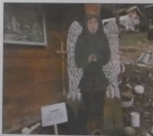
Ein Waldschutzengel mit Impuls.