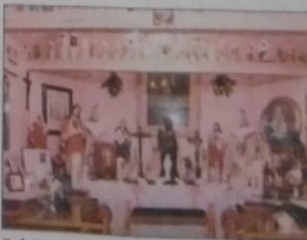
Schön geschmückt: Die Krauskapelle.