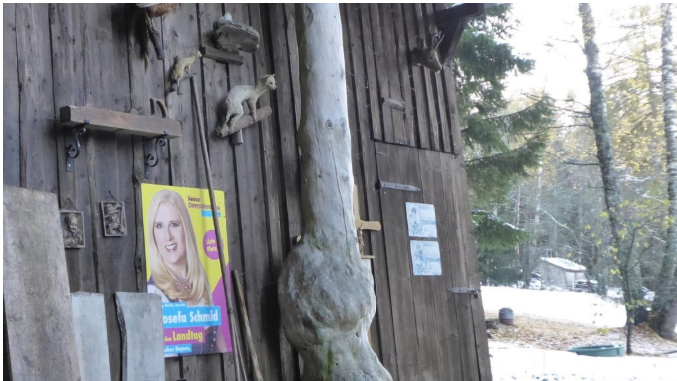
Origineller Platz für vergangene Wahlwerbung von Bürgermeisterin Josefa Schmid

Baumschutzengel laden zur Waldweihnacht ein