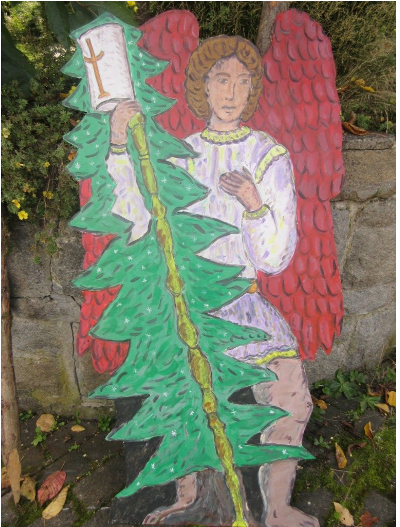
Baumschutzengel "In der Kraft"