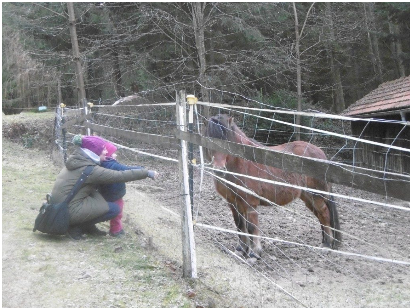
Mutter, Kind und Pferd