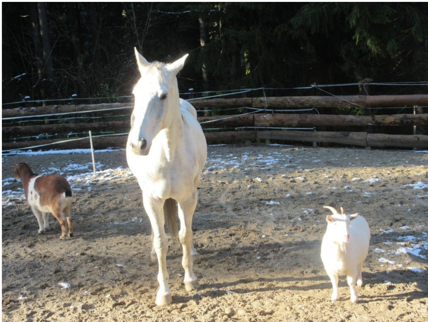
Friedliche Haustiere am Kraus-Anwesen