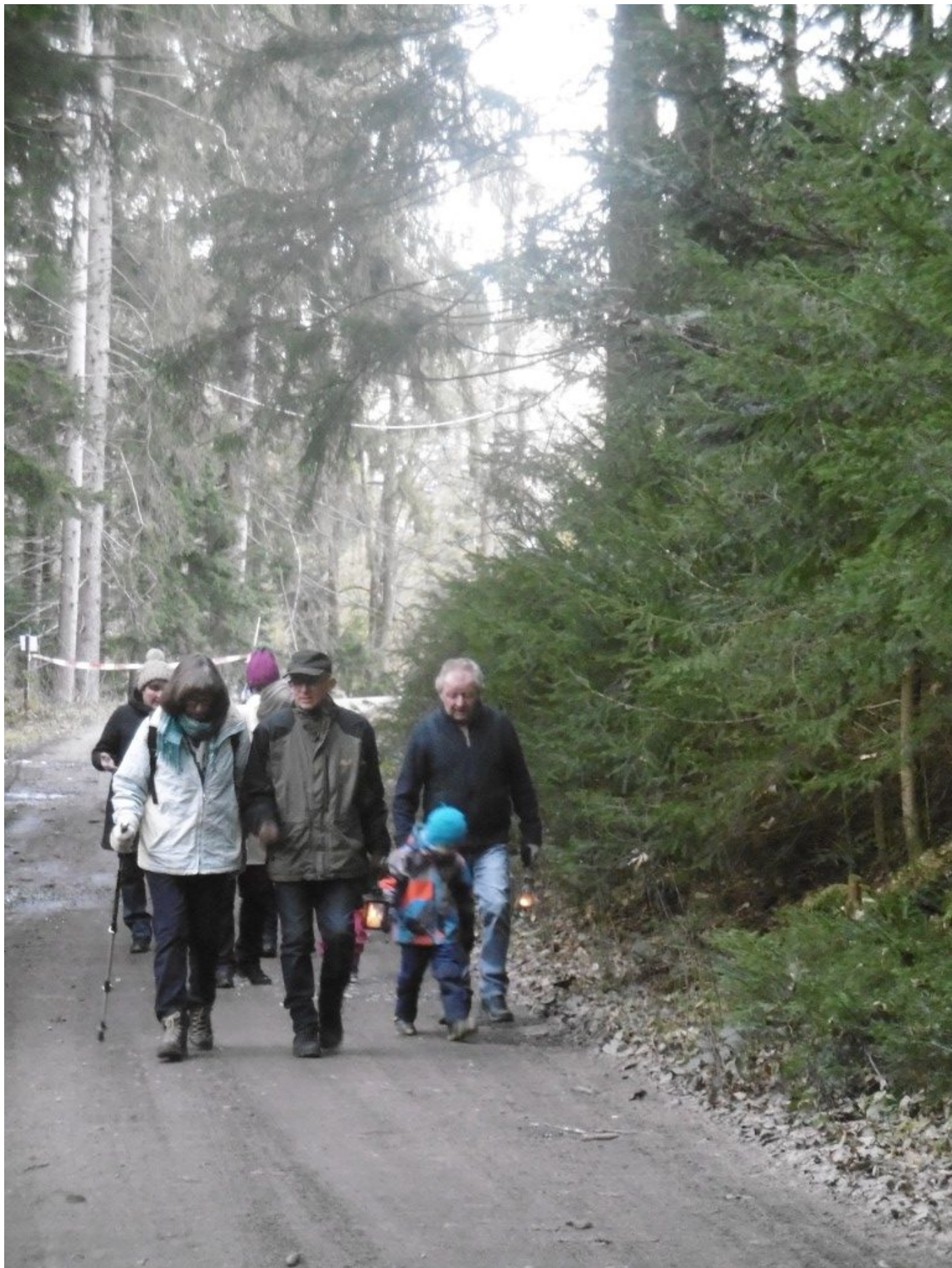
Die ersten Besucher nähern sich der Krauskapelle