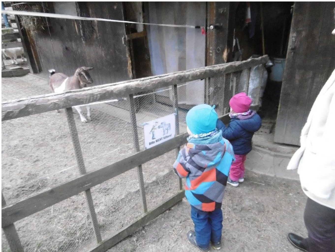
Kinder und Ziege