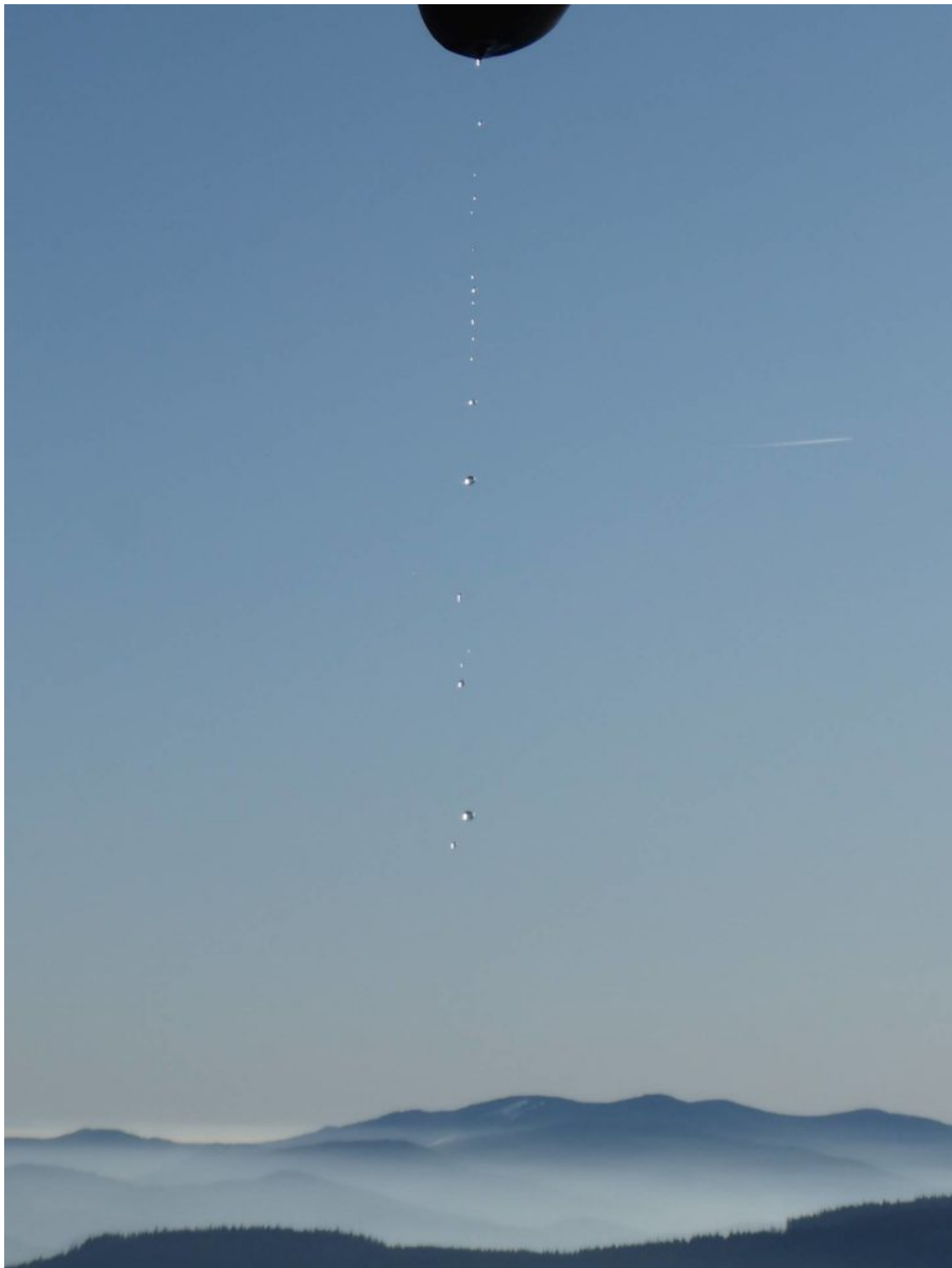
Ein Foto von Pilger Rudi Simeth zum neuen Jahr – aktuell zum Neujahrstag “erwandert” mit Blick auf den Pröllner