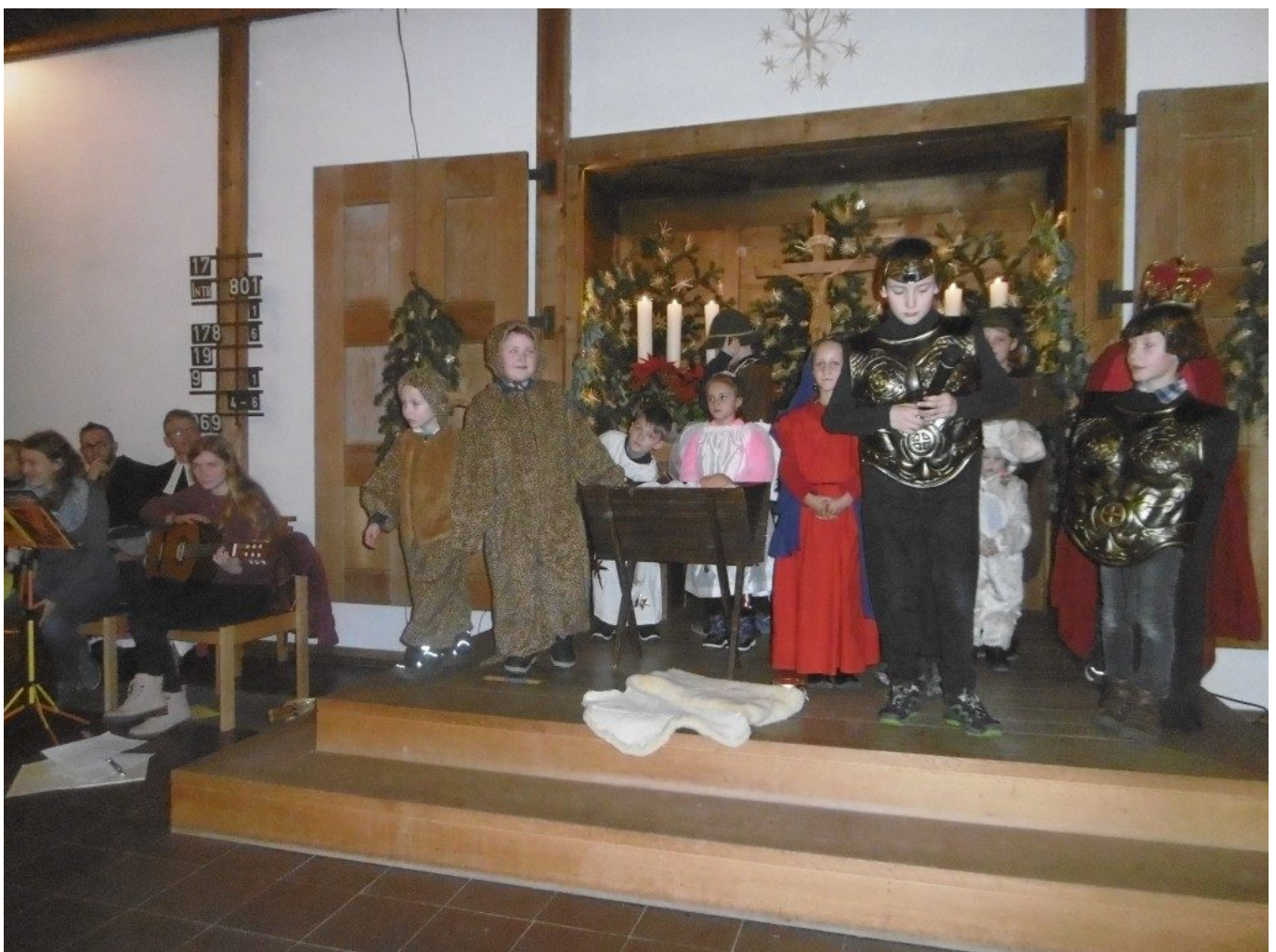
Ein lebendiges Krippenspiel in der Christuskirche Viechtach