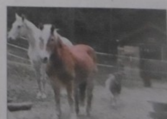
Viele Tiere schauten zu.

Und auf Seite 10 einen Vollbericht mit dem schönen Titel: “Von Engeln gesegnete Waldweihnacht”.