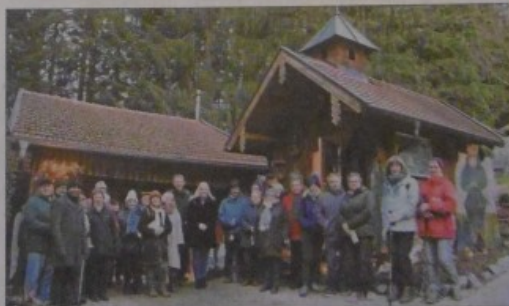
An die 40 Besucher waren zur Krauskapelle gekommen, um eine besinnliche Adventsandacht im Wald zu feiern.

Pater Joseph aus Kollnburg und Pfarrer Roland Kelber aus Viechtach gestalteten einen ökumeni-