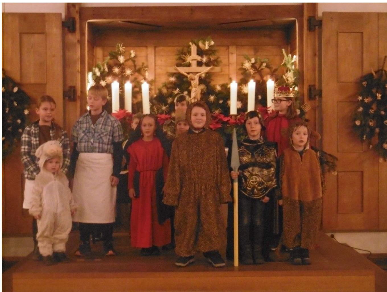
Aufbruch nach Bethlehem

durften nicht fehlen. Die Gefahr war jedoch groß: Wilde Tiere – ein Löwe und ein Leopard – witterten Nahrung im Stall von Bethlehem!