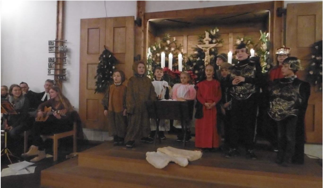
Glückliche Schluss-Szene mit viel Beifall von den Gottesdienstbesuchern

zu einem großen immerwährenden Frieden hin.“ Eine tiefe Sehnsucht, nicht nur aller Menschen, sondern der ganzen Kreatur werde durch Christi Kommen in eine lebendige Hoffnung verwandelt, die jetzt im Glauben und einst im Schauen zur erlösenden Freiheit werde. “Lassen Sie sich durch die Weihnachtsgeschichte zum Frieden hin verwandeln!”