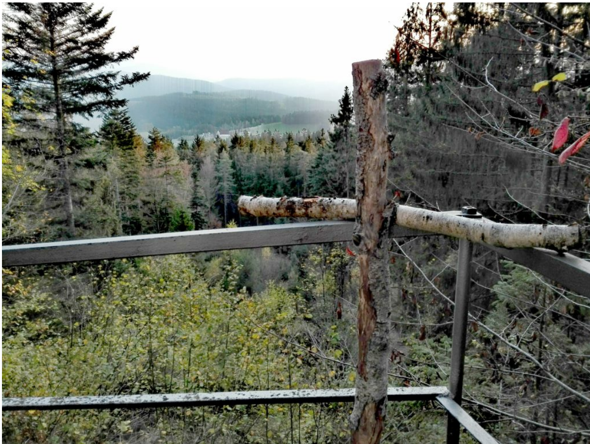
Rauhreif auf den Bäumen – Blick von der Wolfgangskapelle über den Bayerwald

Wolfgangshof Lebende, 1.Vorsitzende unseres Vereins Pilgerweg St. Wolfgang, auf den Kreuzweg hinauf zur Wolfgangskapelle. Sie schmückten die Kirche der Jahreszeit entsprechend und lasen die vielen neuen Einträge im Kapellenbuch. Dann beteten sie und sangen ein altes Wolfgangslied. Beim Hinuntersteigen nahmen sie drei der Kreuze wieder mit zur "Talstation", auf dass andere Pilger sie wieder betend hochtragen können. Wir bedanken uns für die schönen Fotos und freuen uns über diesen inspirierenden Wolfgangs-Beitrag!