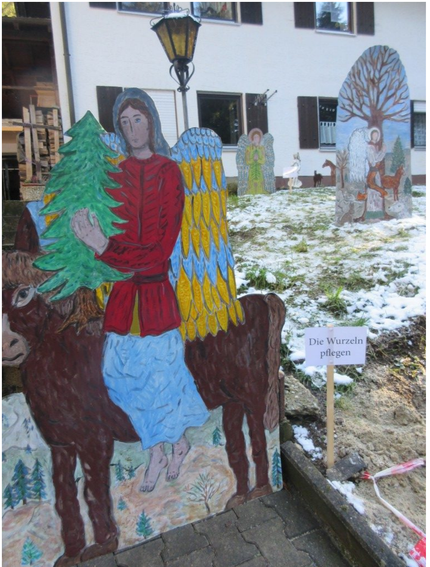
Baumschutzengel "Die Wurzeln pflegen"

In dieser ganz besonderen Zeit befinden sich bei der