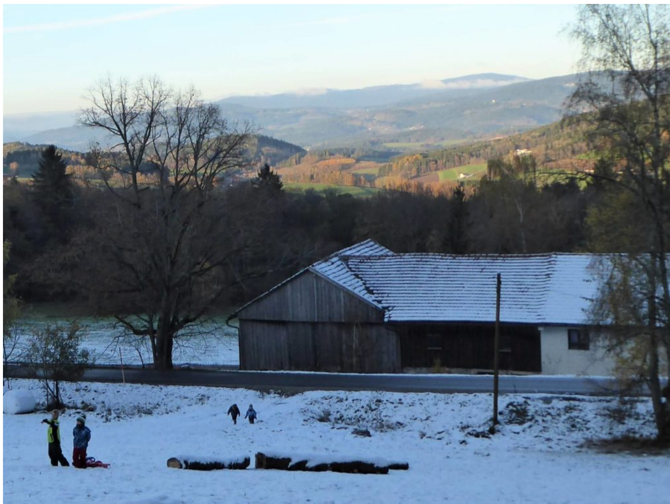
Freundliche und fröhliche Schlittenfahrer am Wetterstein