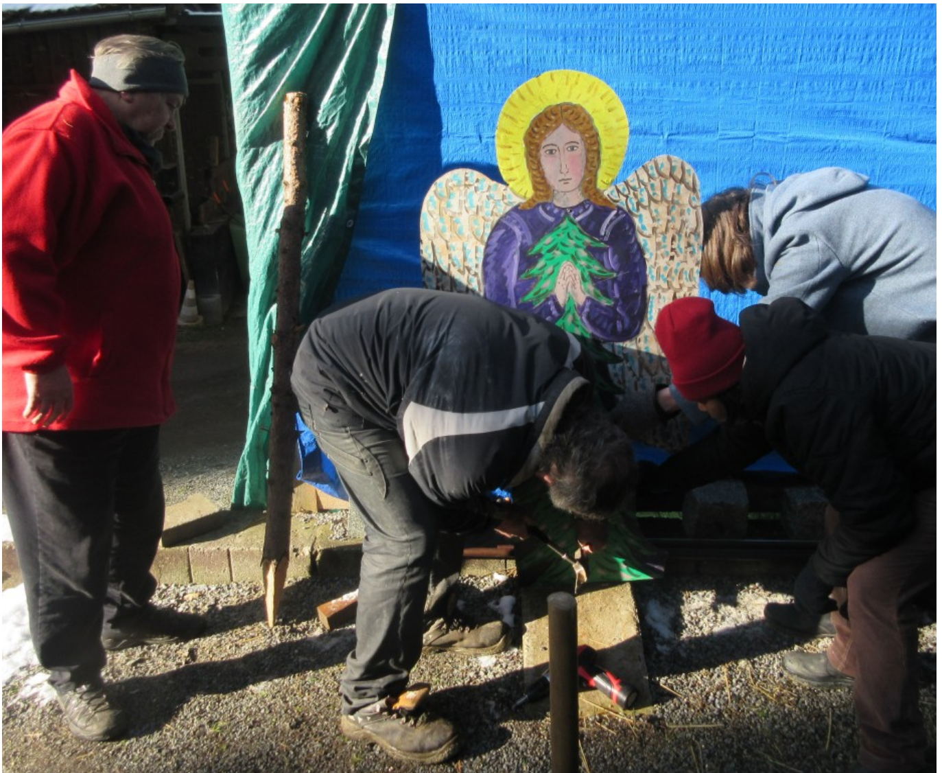
Aufbau “Woid-Engel” am Wetterstein mit Mitgliedern des Vereins Pilgerweg St.Wolfgang, Nov. 2019