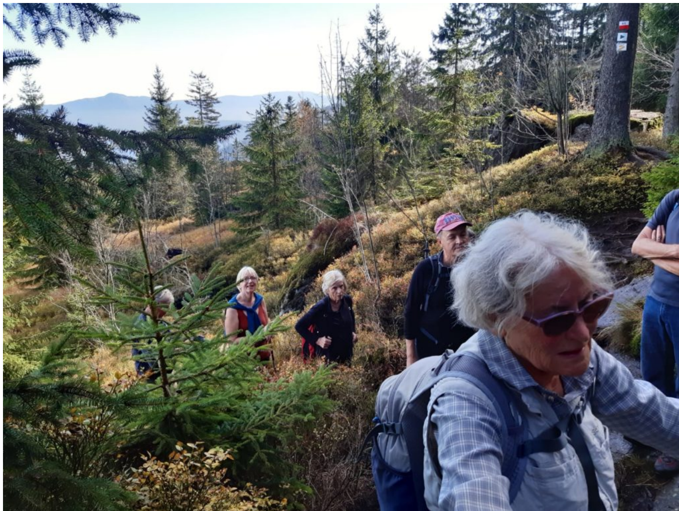
Hinauf zum Goldsteig über den Kamm des Kaitersberges

Die Diaschau ist mit Musik von "vuimera", Landkarten der Touren und Baumimpulsen.