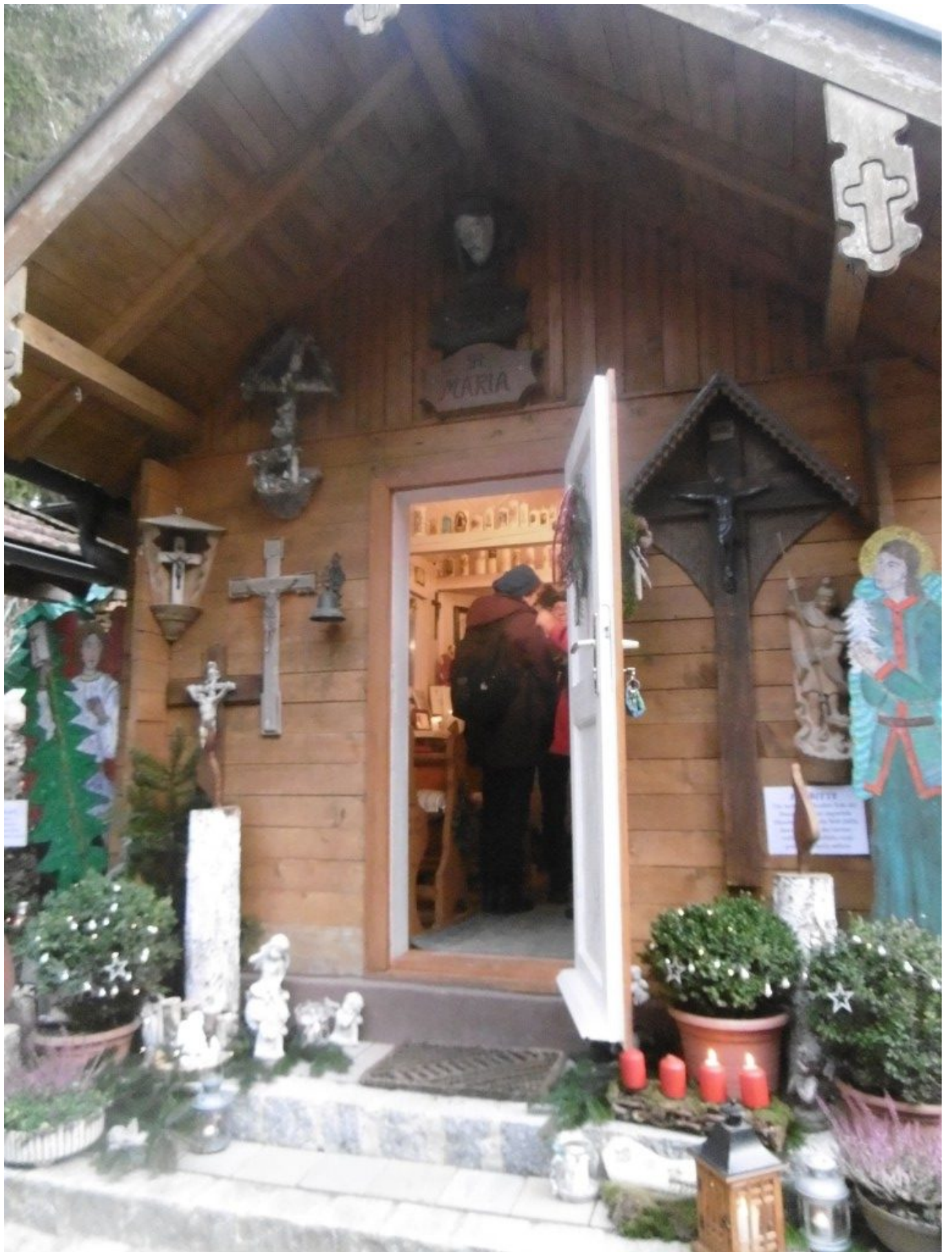
Romantische Krauskapelle mit vielen Details