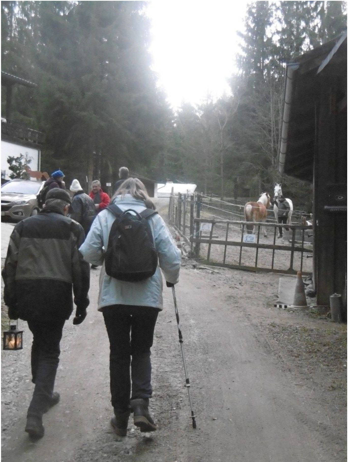
Da warten auch schon die Pferde und Ziegen.