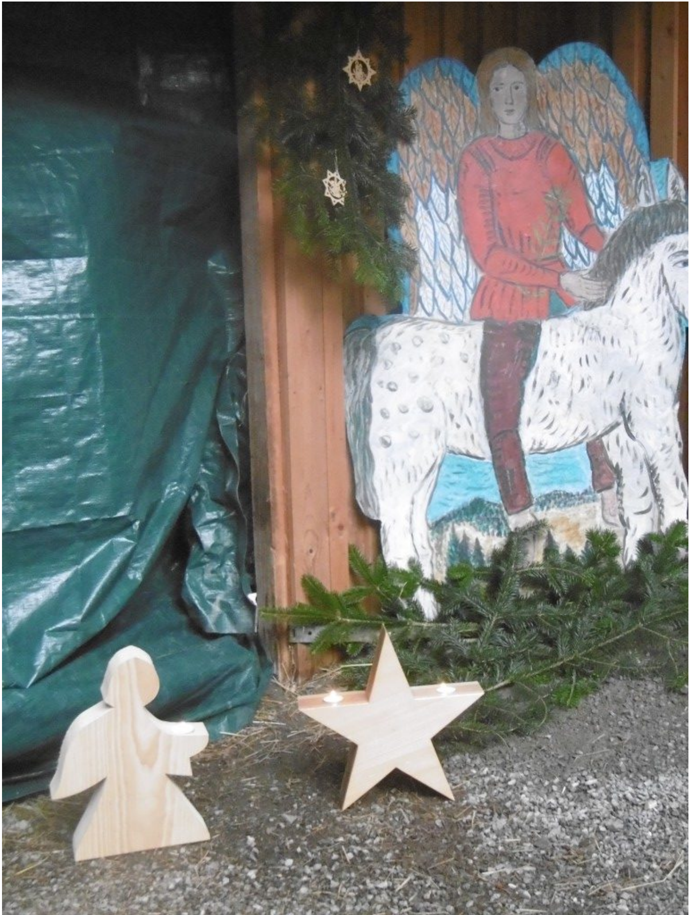
Baumschutzengel "Weites Land" im Wald-Weihnachtsschmuck