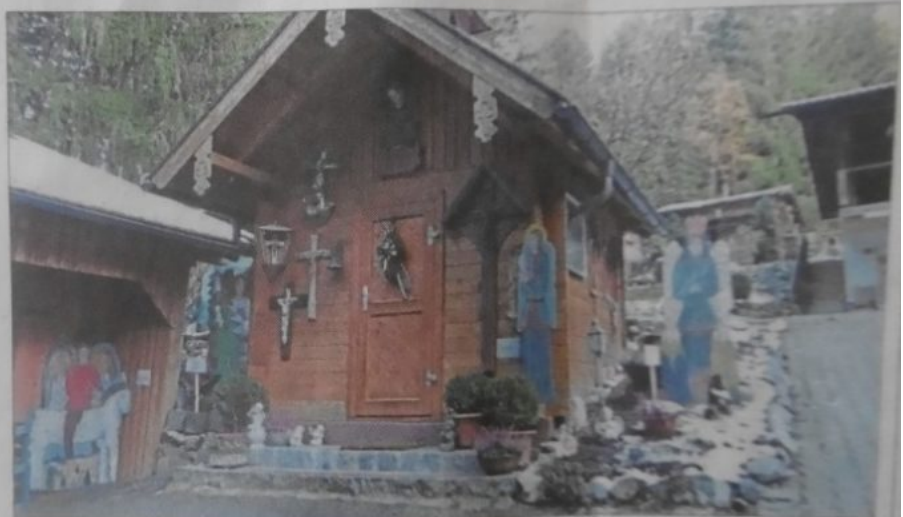
Die Krauskapelle mit Baumschutzengeln.

Acht neue Impulse von Altpfarrer Ernst-Martin Kittelmann – für jeden Engel einer – begleiten die Besucher des Kraus-Anwesens, dessen stille Lage mit den gutmütigen Haustieren in eine Welt versetzt, in der das Leben noch in gegenseitigem Respekt und in Rücksicht auf die Natur ganz im weihnachtlichen Sinn gelebt wird.