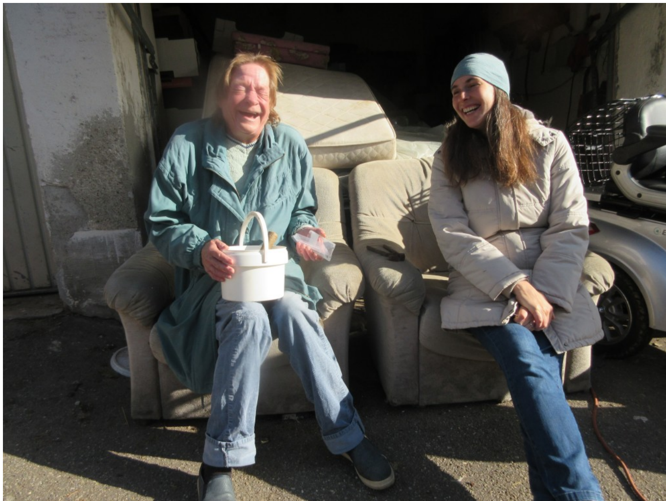
Echt und herzlich gelacht!