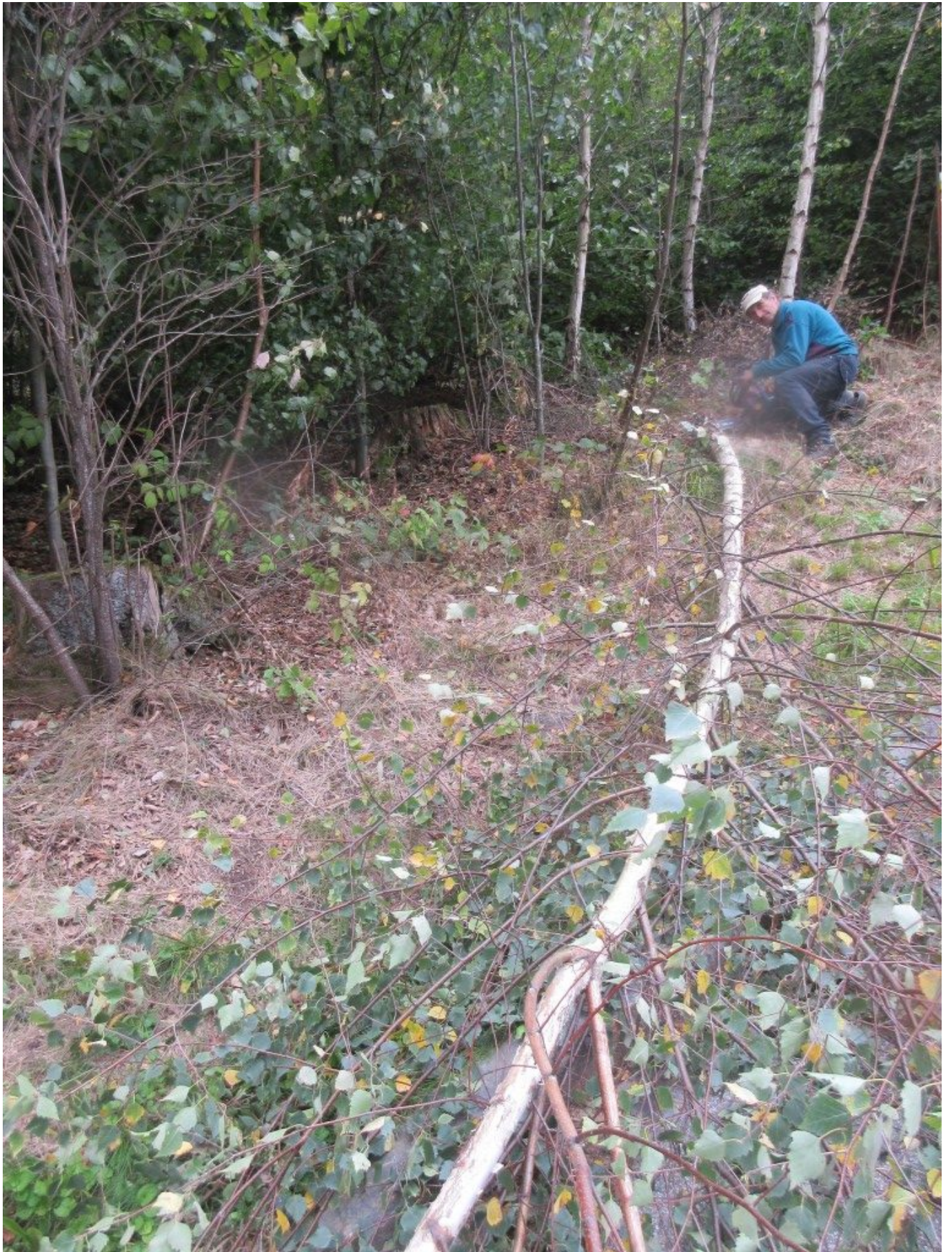
Frisch umgesägt: Mit Wucht fiel die Birke auf den Boden. Das könnten 2 schöne helle Kreuze werden. Entschuldige, liebe