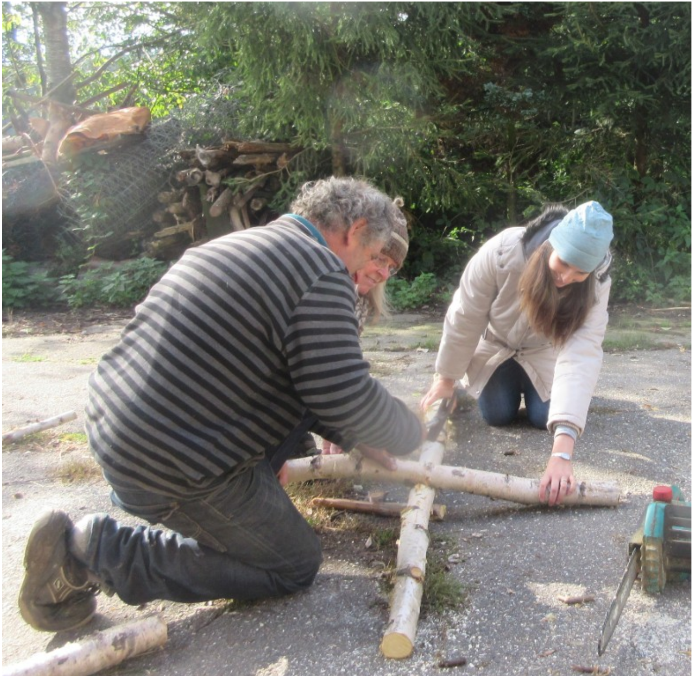
Die „Oricht“ = Anrichte ist sehr improvisiert. Die Pilgerhelfer/innen arbeiten z.T. am Boden...