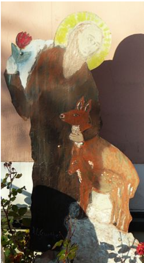
Blecharbeit an der Zwieseler Bergkirche von Dorothea Stuffer