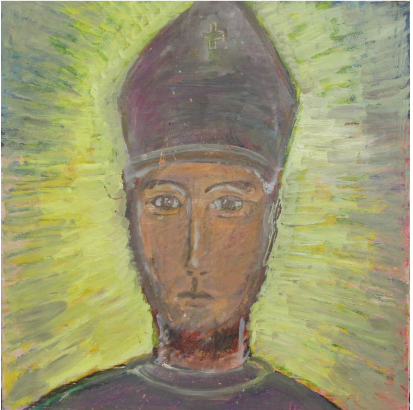
Portrait des heiligen Wolfgang von Dorothea Stuffer

Der heilige Wolfgang, eine „Leuchte Gottes in dunkler Zeit“.