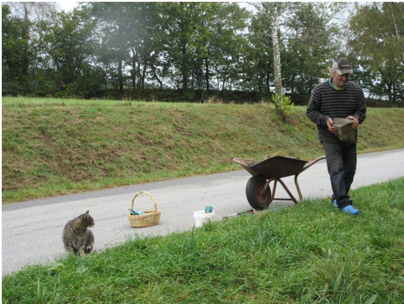
Kater Puma schaut wie immer zu.