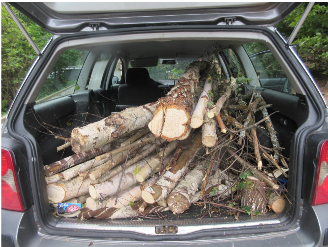
Abtransport mit Dorothea Stuffers Allzweck-Pilger-Auto