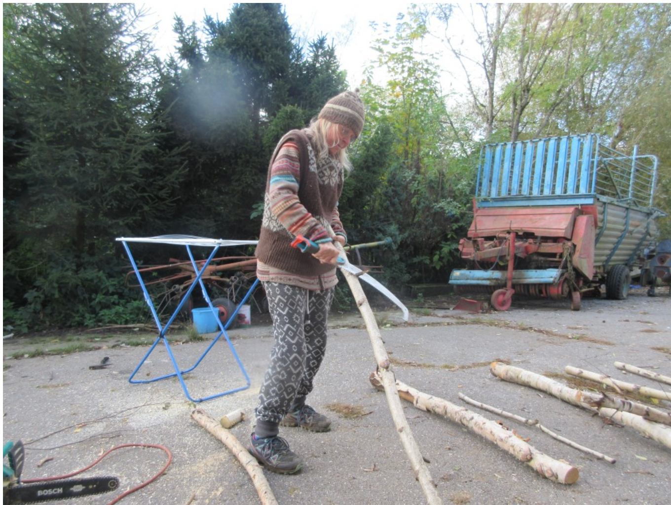
Mit der Handsäge Seitenäste wegsägen.