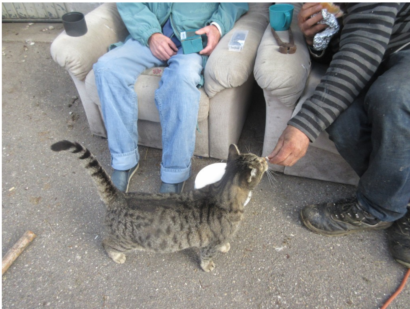
Brotzeit: Kater Puma ist dabei.