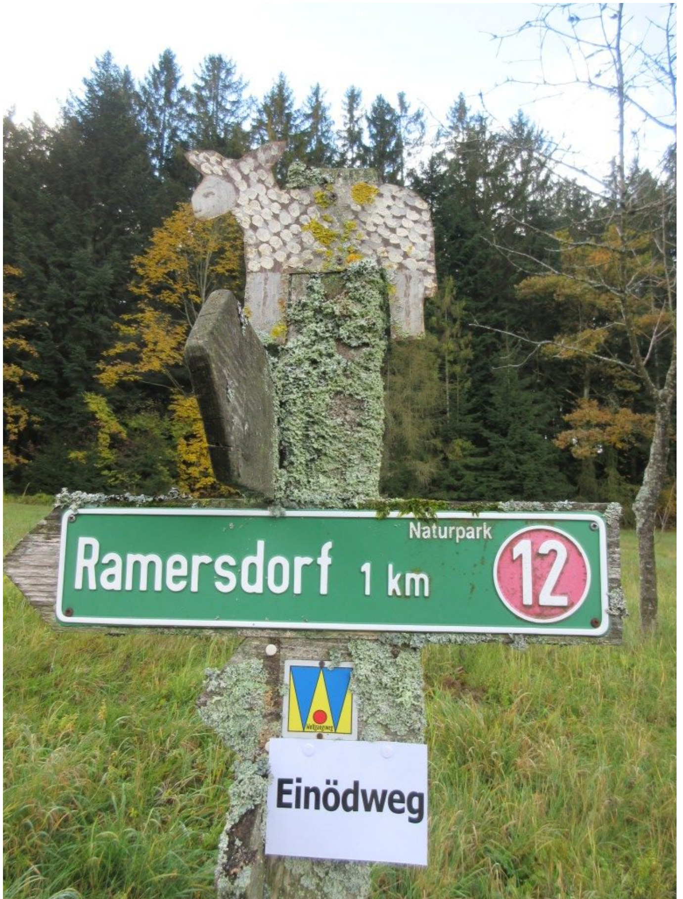
Der Einödweg verläuft auf bestehenden Wanderwegen, hier bei Schwaben am Wolfgangsweg mit dem „W“ und den typischen