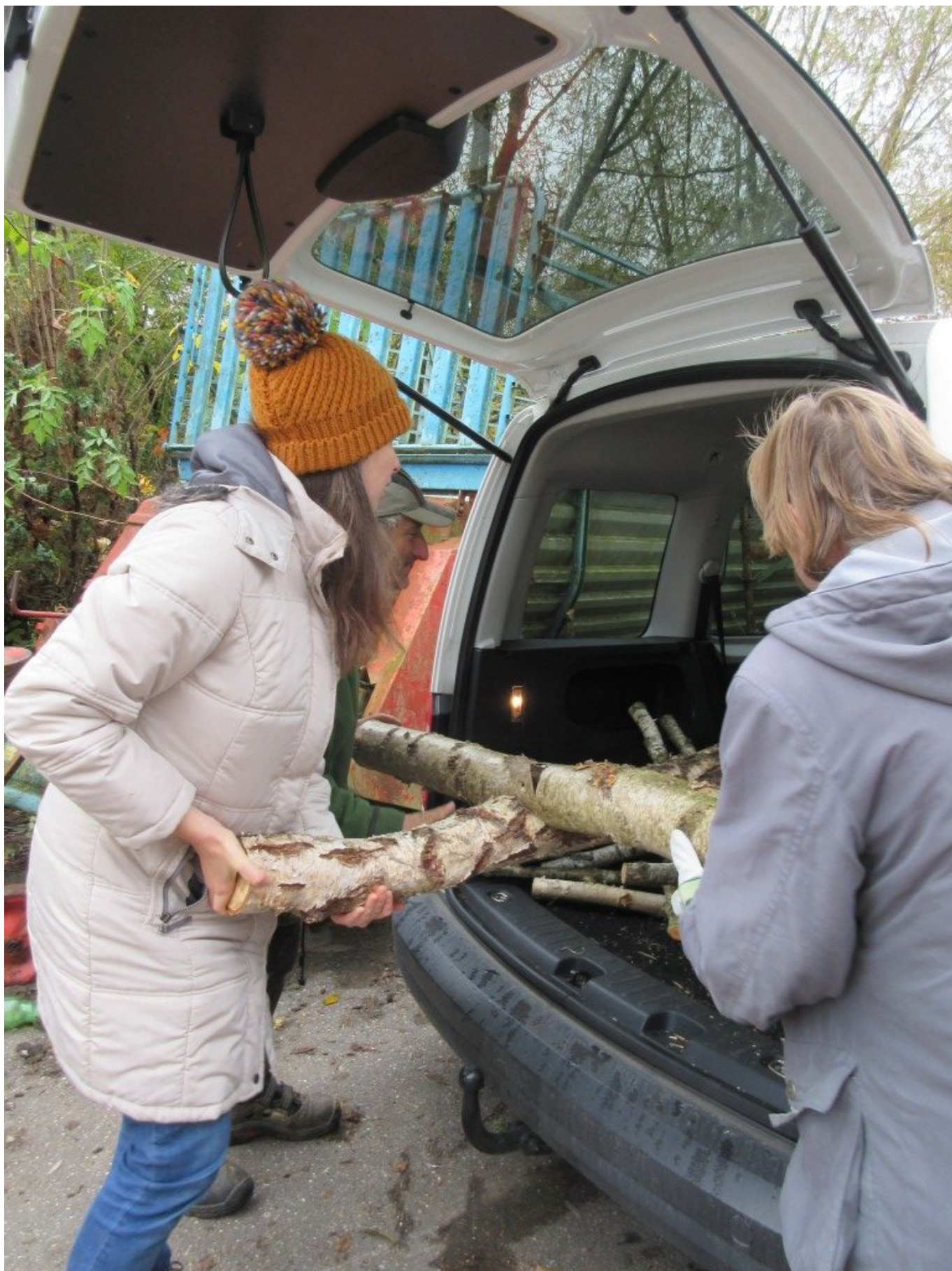
Einladen der Birkenkreuze, Xaverhof