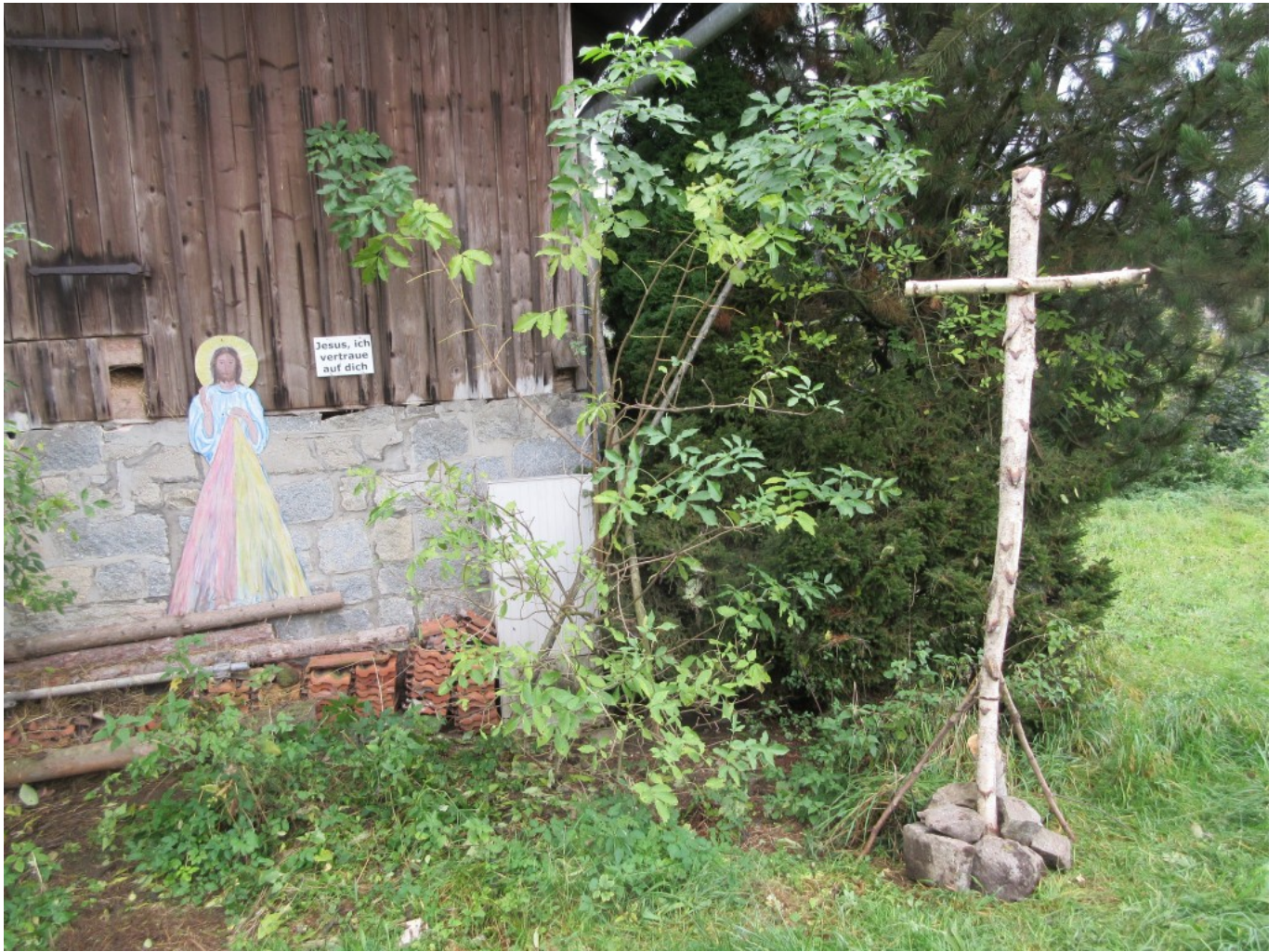
Das neue Xaverhof-Pilger-Birkenkreuz