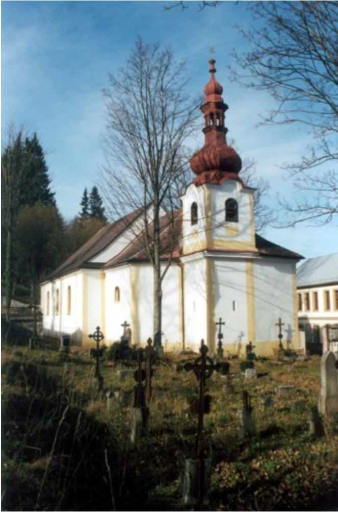
Die Gunther geweihte Kirche in Gutwasser

Sehr geehrte Damen und Herren, liebe Gunther-Verehrer mit dieser Information möchte ich Sie über die diesjährige Feier des St.-Gunther-Festes in Gutwasser (Dobrá Voda) bei Hartmanitz am 10./11. Oktober informieren.