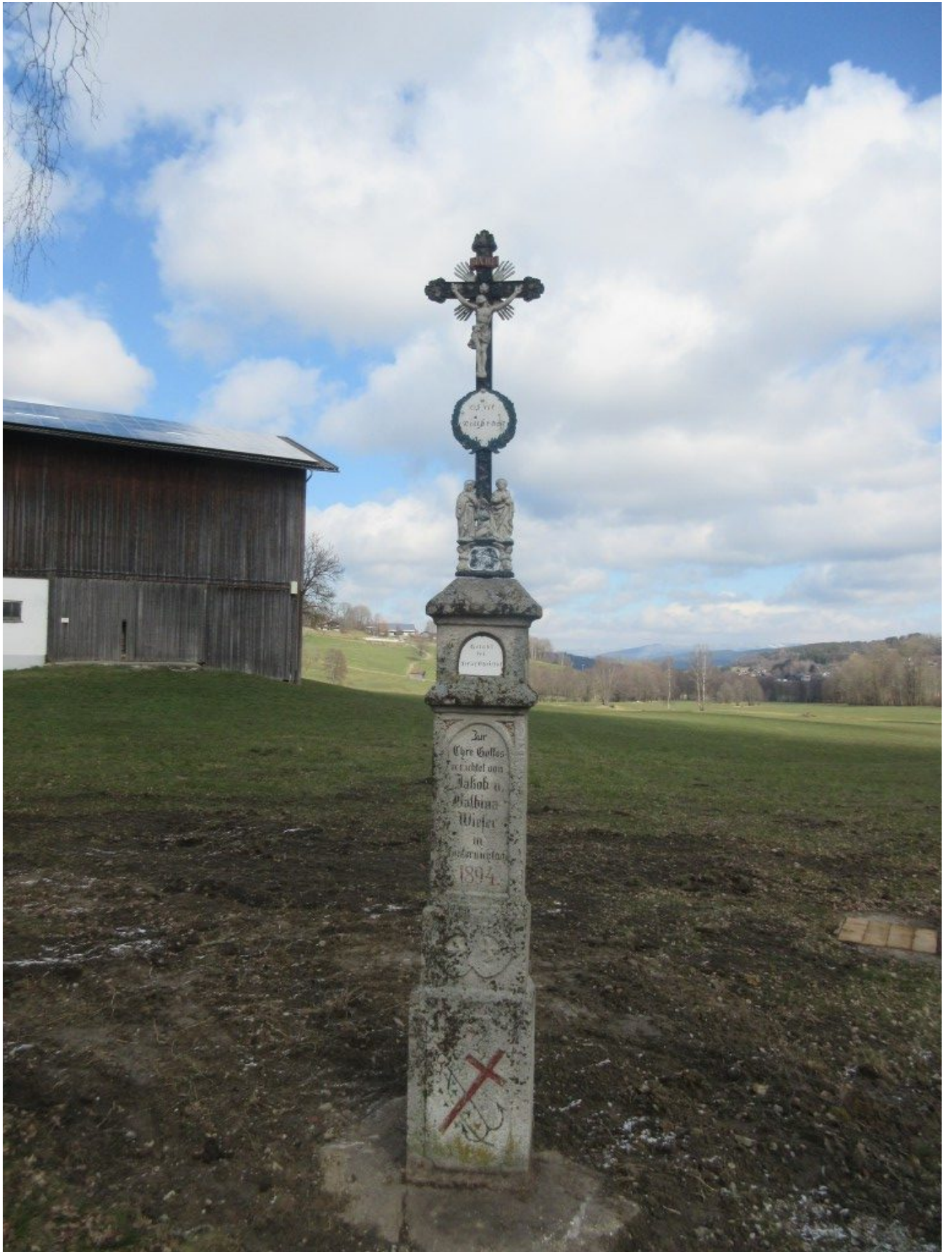
Still und klar steht die Kreuzsäule.