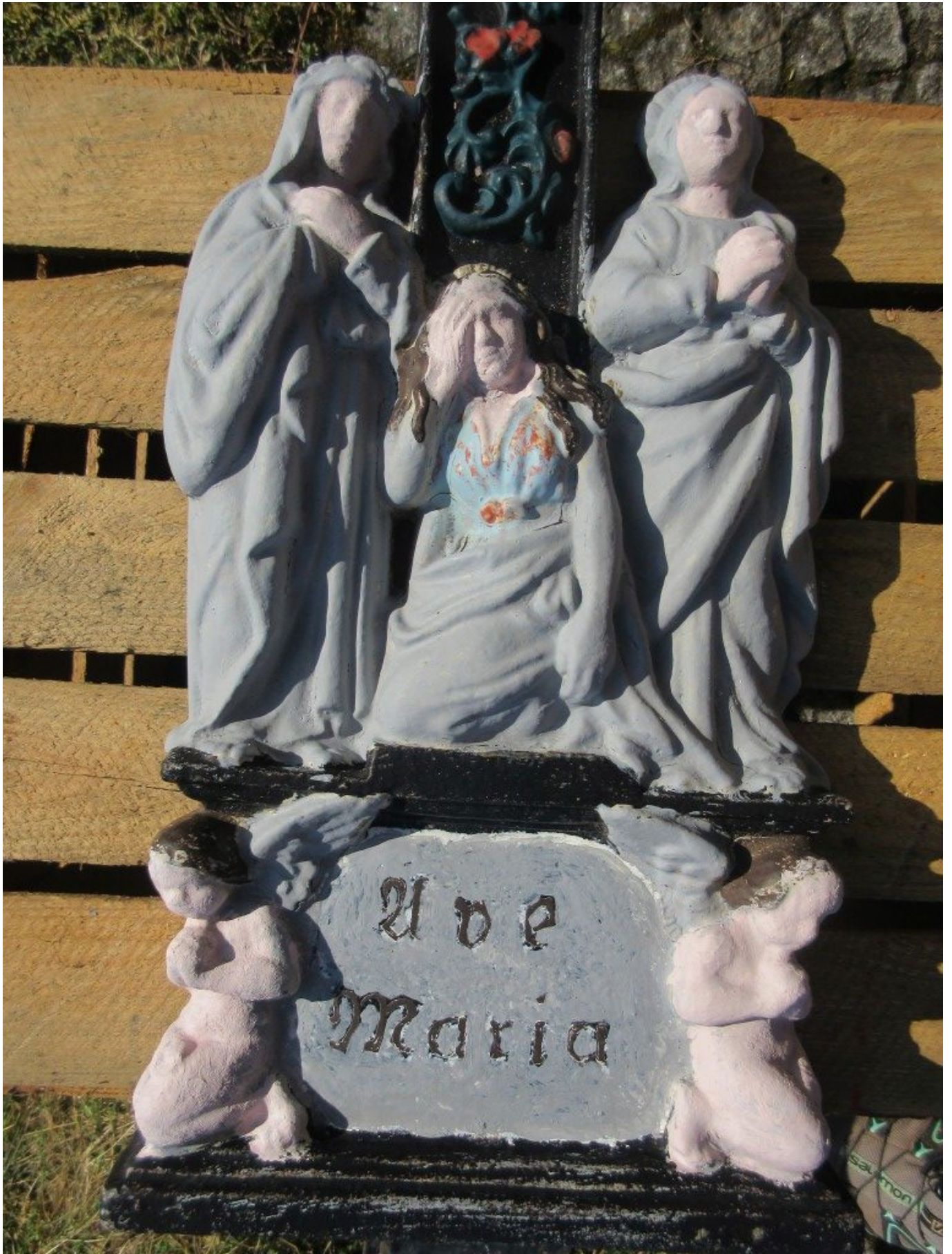
Die Figuren der Kreuzsäule wurden zunächst gereinigt, angeschliffen und grundiert