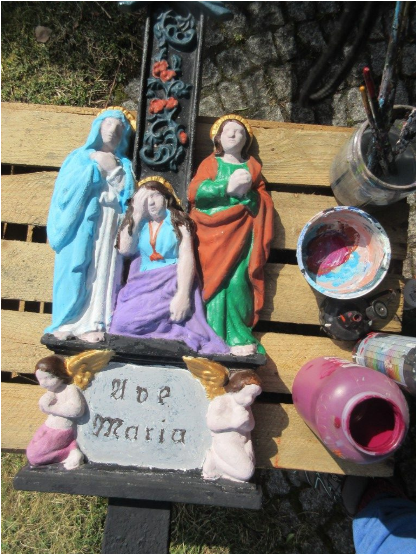
Farbig, aber nicht bunt – – alte Stellen zum Teil stehen lassen