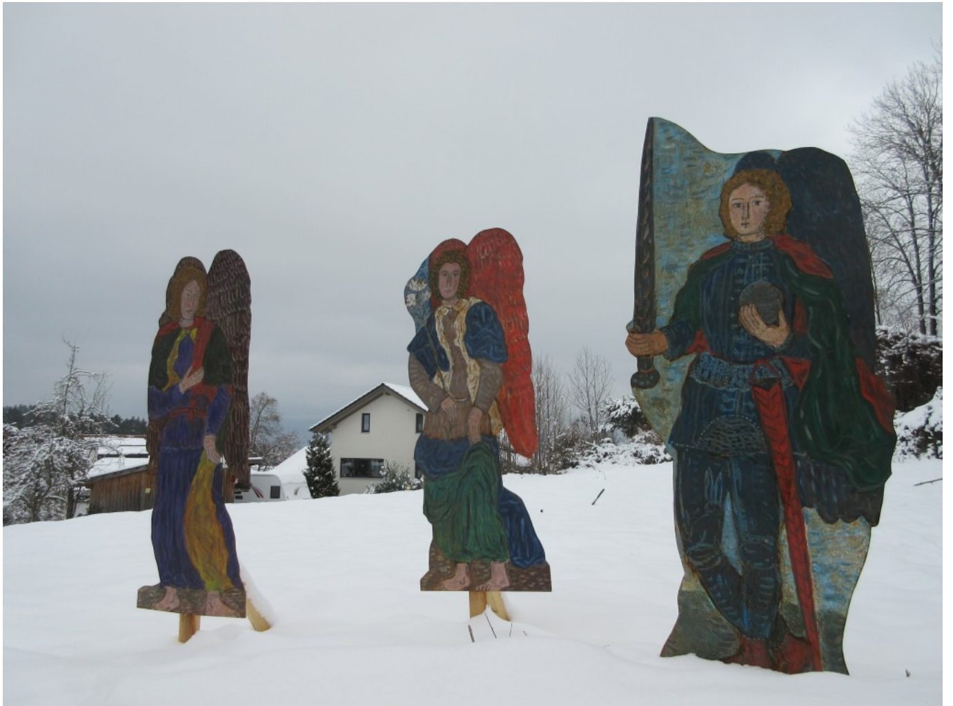
Die drei Erzengel Raffael, Gabriel, und Michael