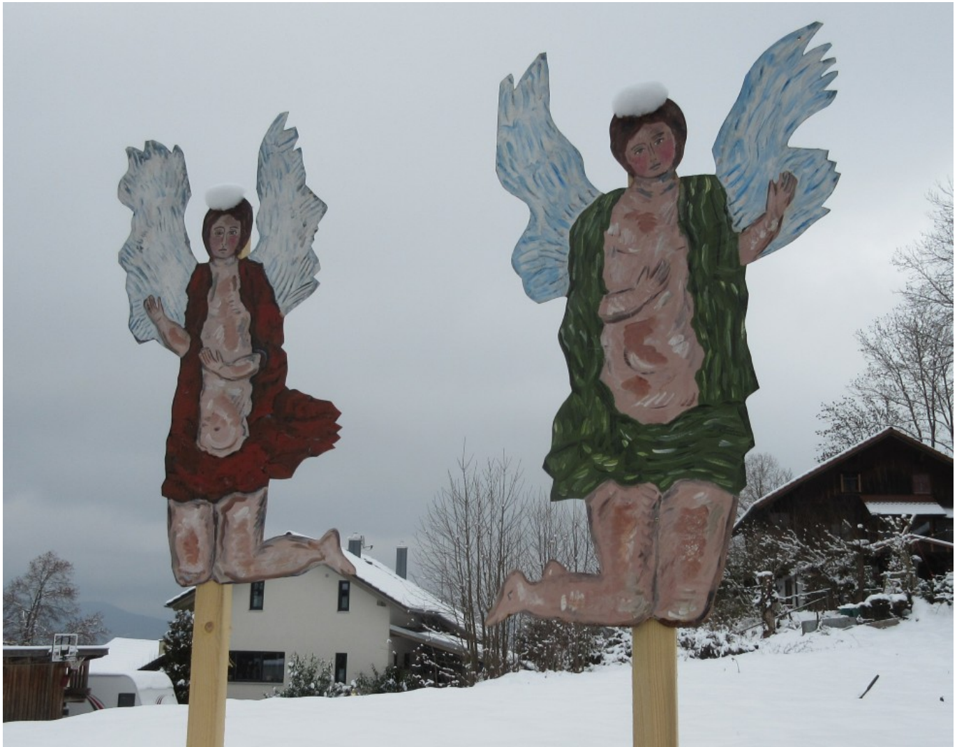
Zwei Putten in Kollnburg mit Schneekrone