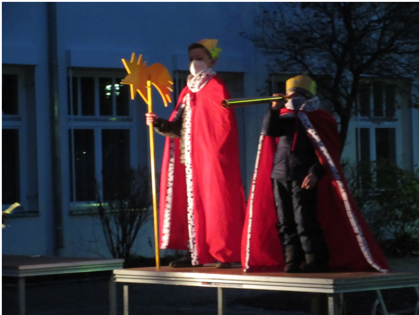
Die heiligen Könige folgen dem Stern.