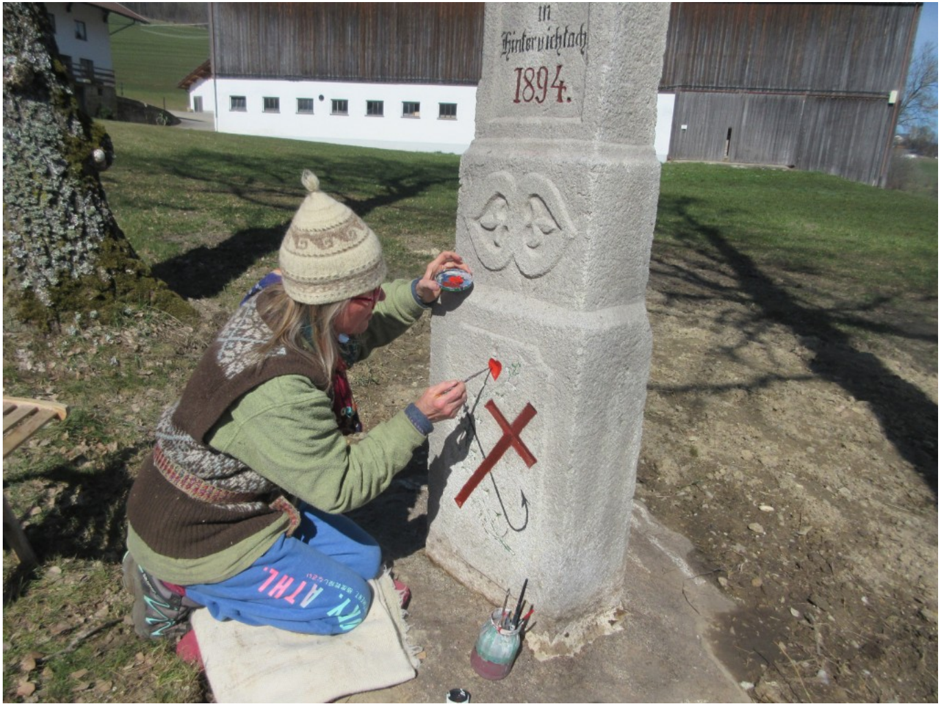
Die Arbeit der "Vorgänger" verdient Bewunderung.