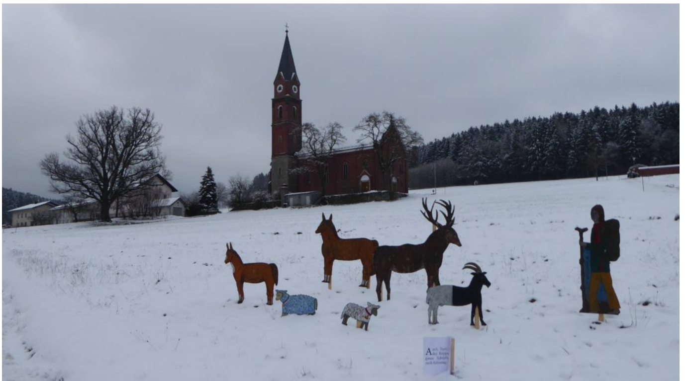
..und es hat wieder geschneit.