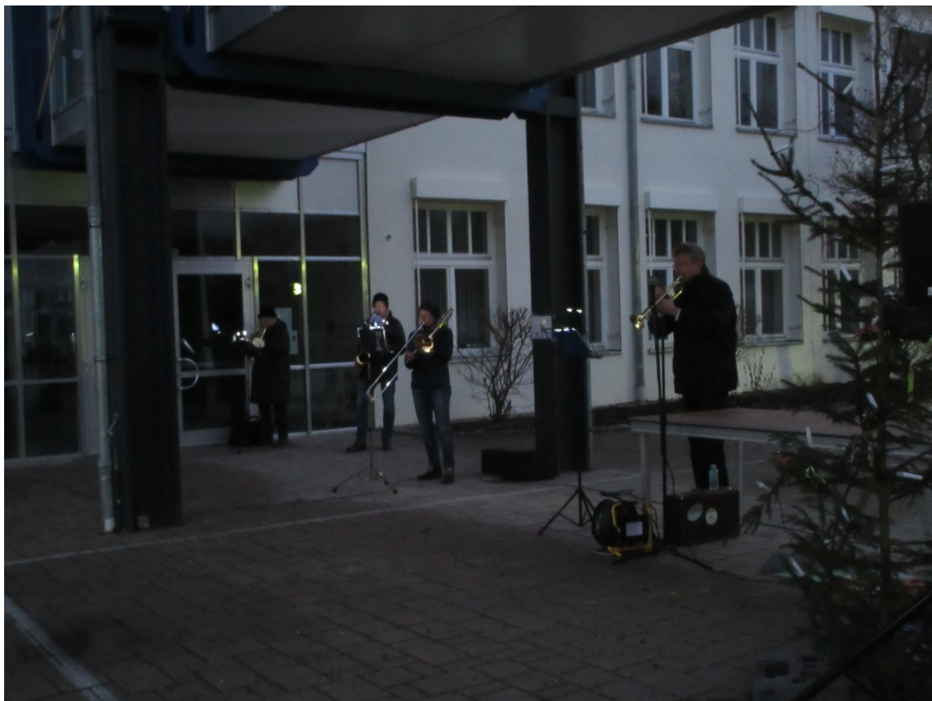
Einige Bläser lassen dezent Weihnachtslieder anklingen.