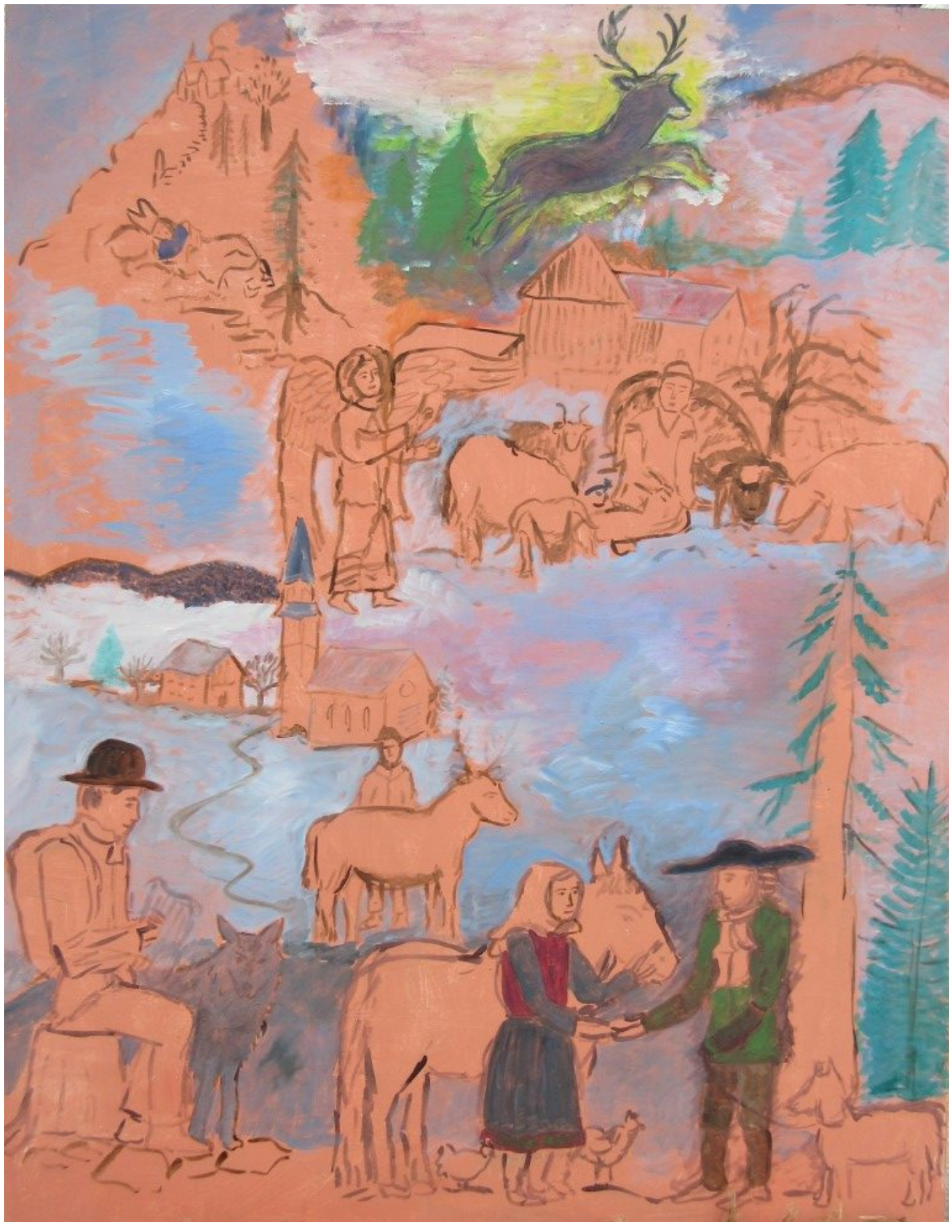
“Winterszenen” – ein Gemälde in Arbeit von Dorothea Stuffer