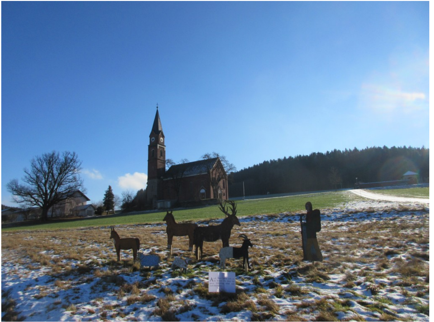
Hirtenszene in Kirchaitnach