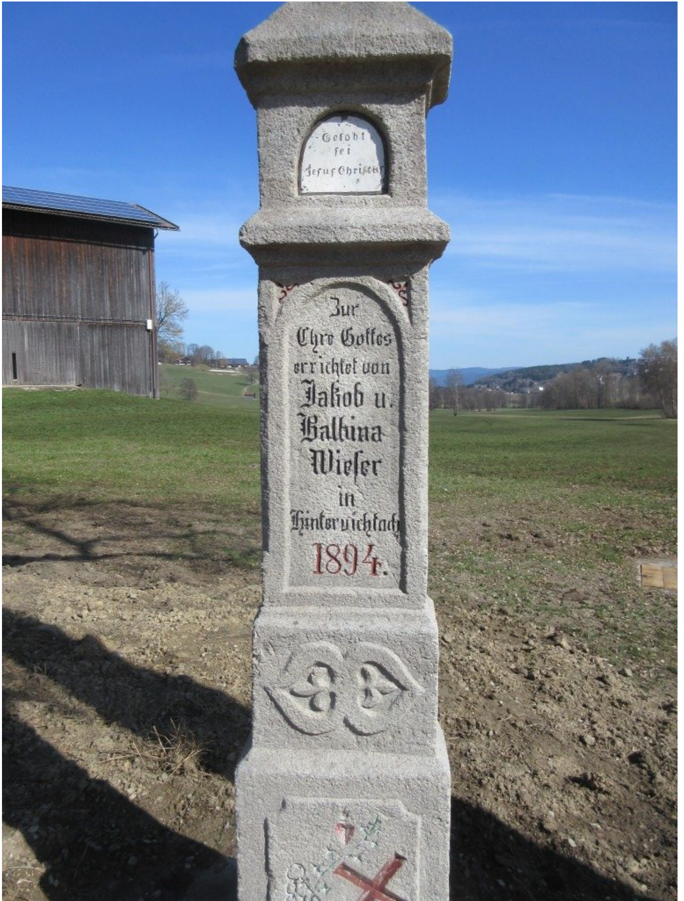
Die Granitstele ist vorher von Moos und Verunreinigungen mit einem Sandstrahler gesäubert worden.