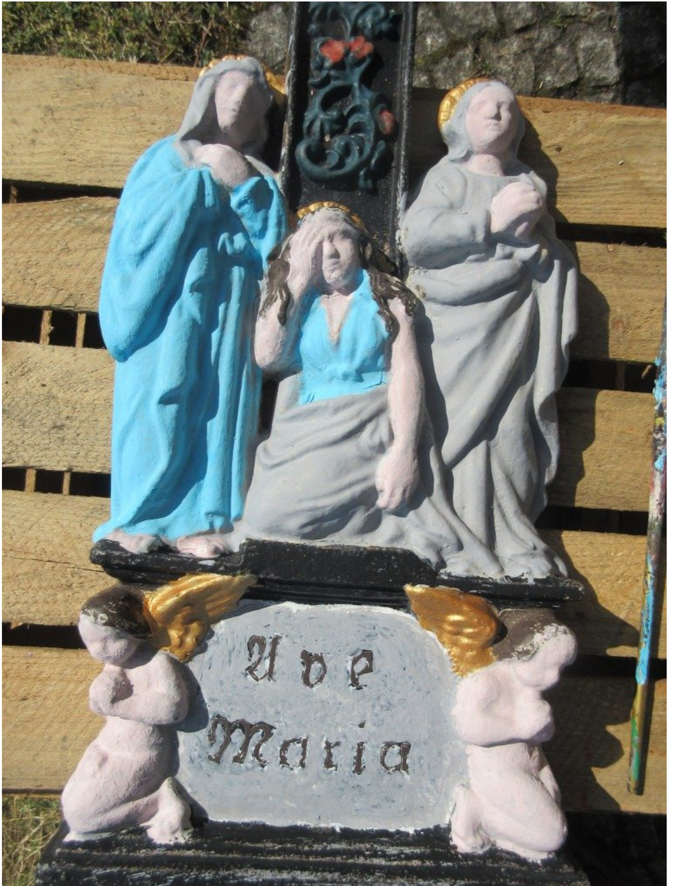
Hellblau – Gold