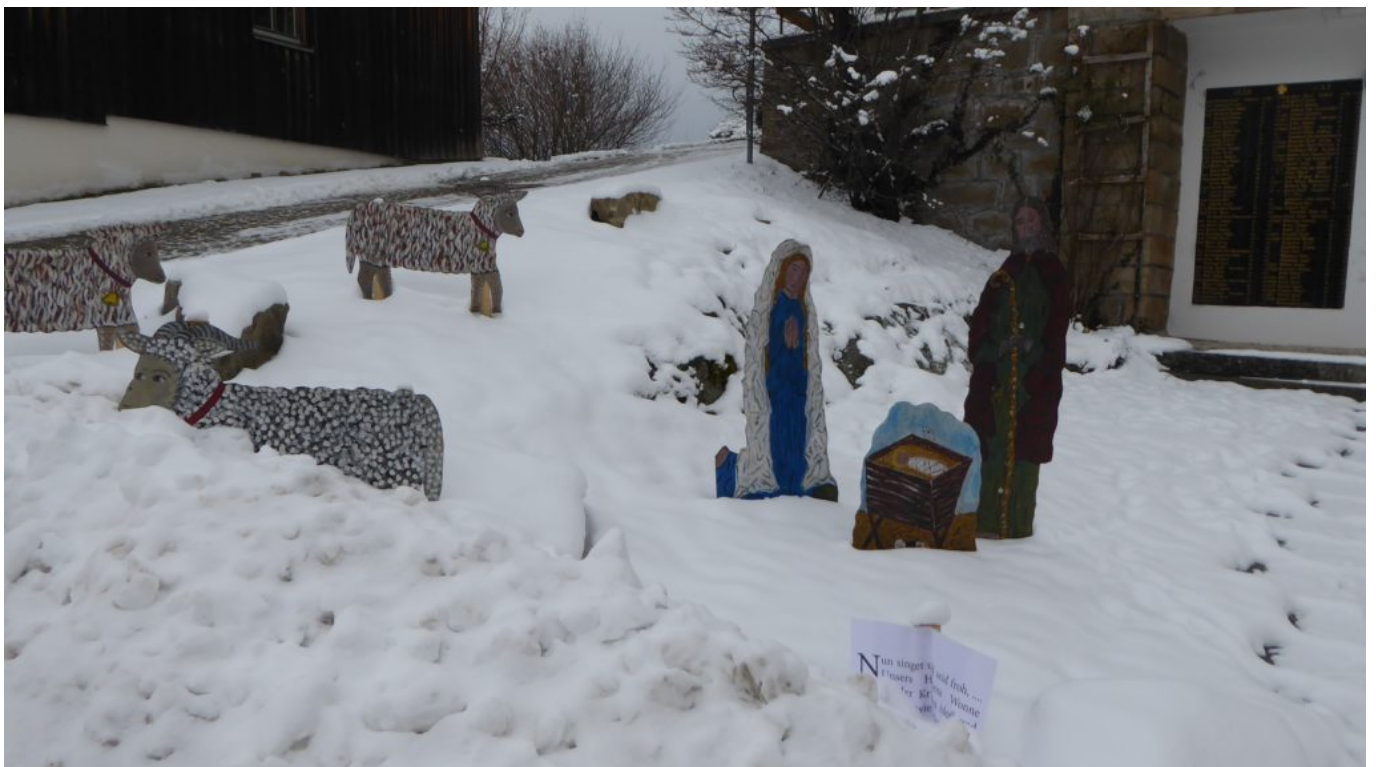
..und es hat wieder geschneit!