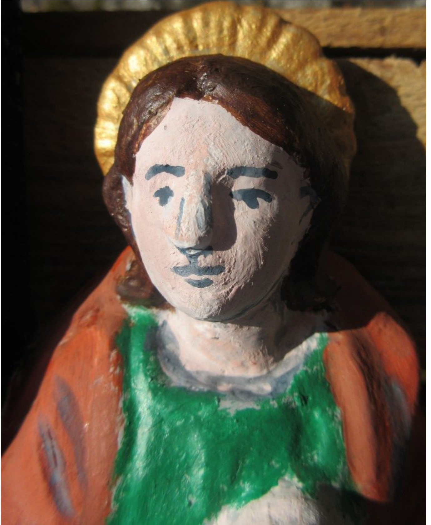
Johannes unterm Kreuz

große Erlösungsmysterium im Bild dargestellt