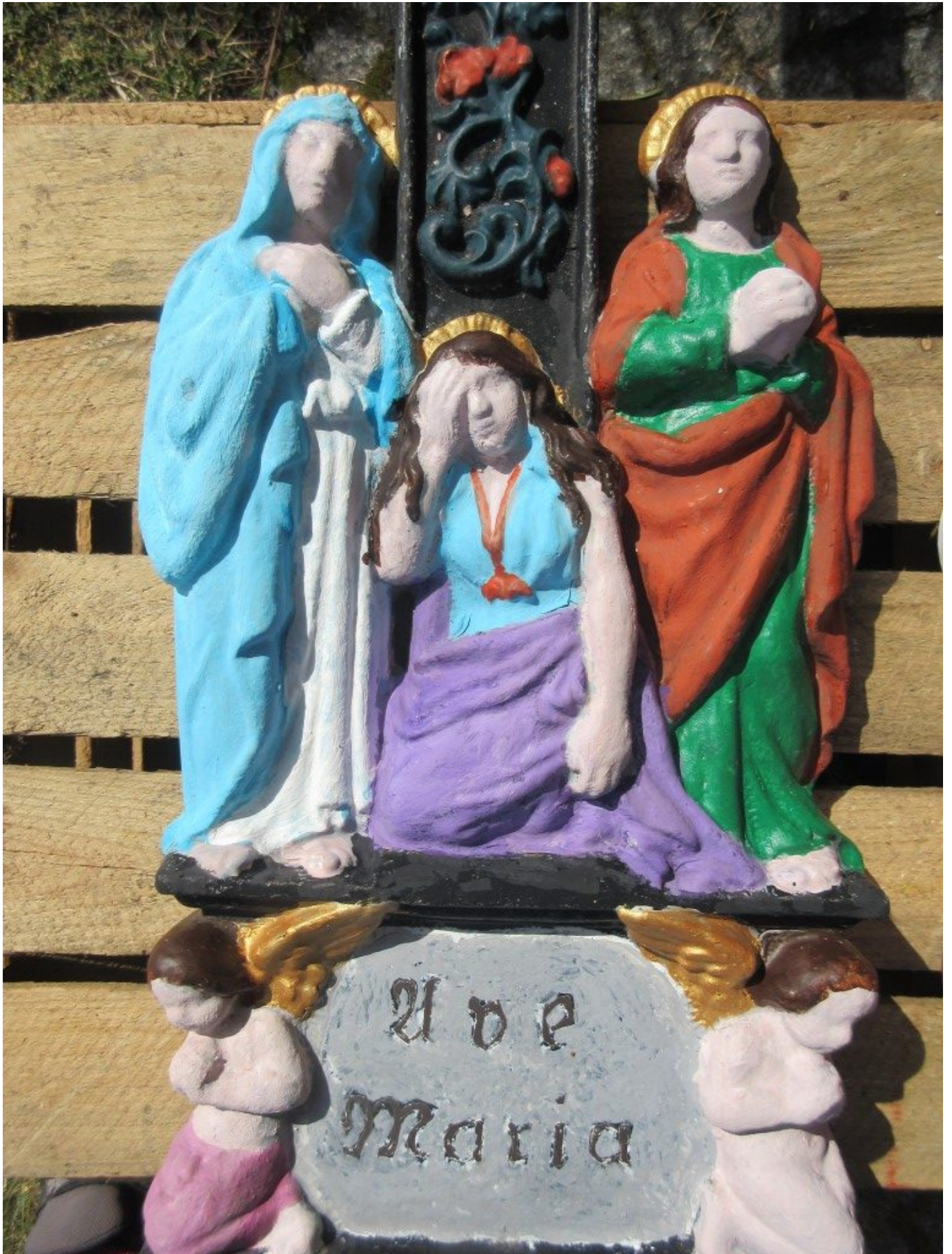
Als nächstes geht es um die Feingestaltung der Gesichter.