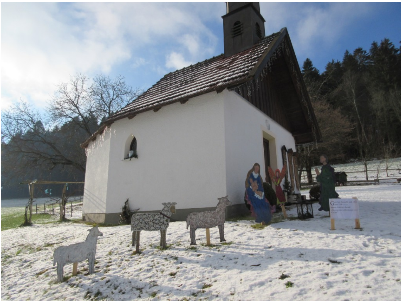
Krippenszene mit Schafen bei der Kapelle in Schweinberg

Denn – nach einer heil überstandenen Gefahr werden gewaltige Glückshormone freigesetzt – Info und Foto von Pilger Rudi Simeth