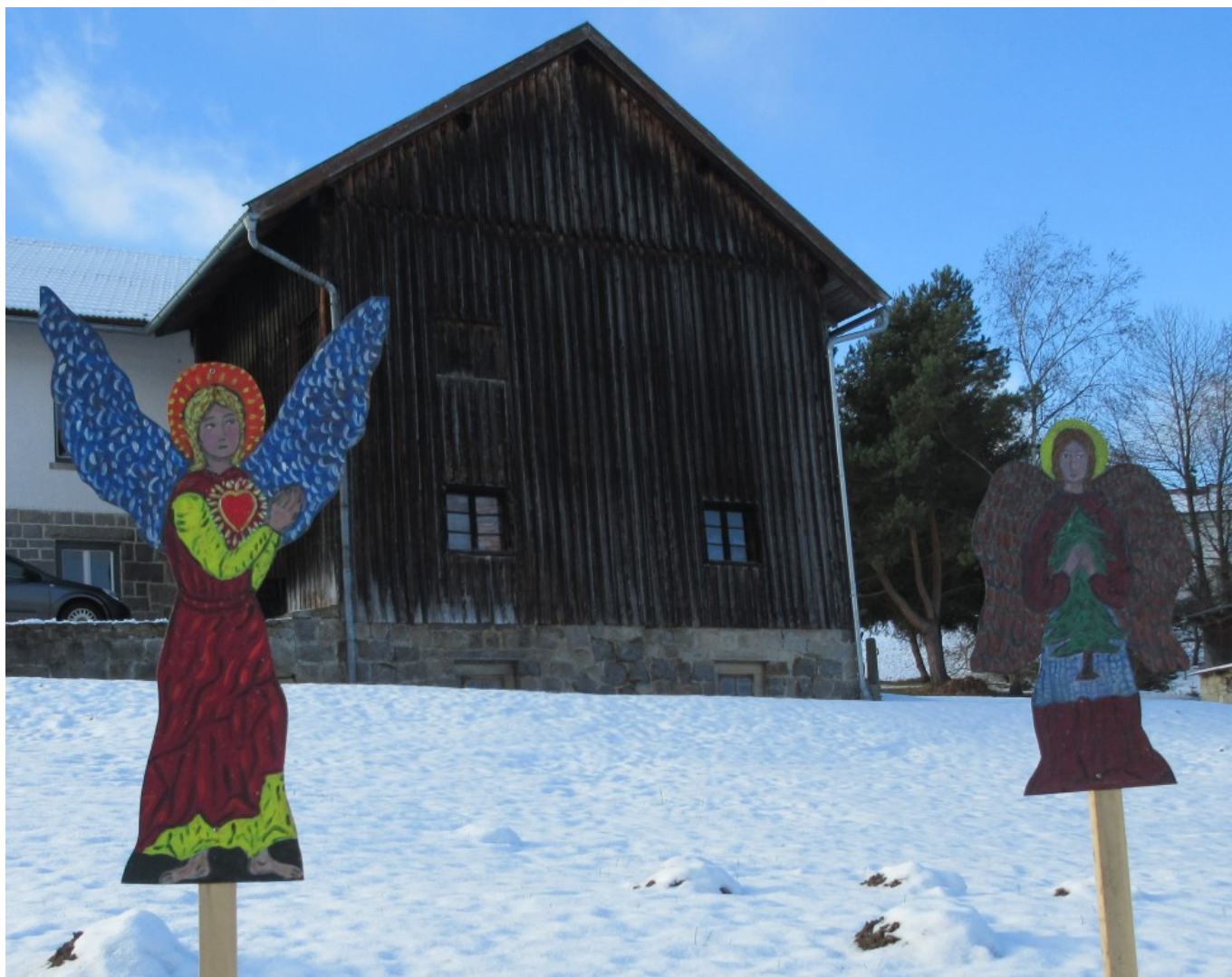
Zwei Engel in Schweinberg