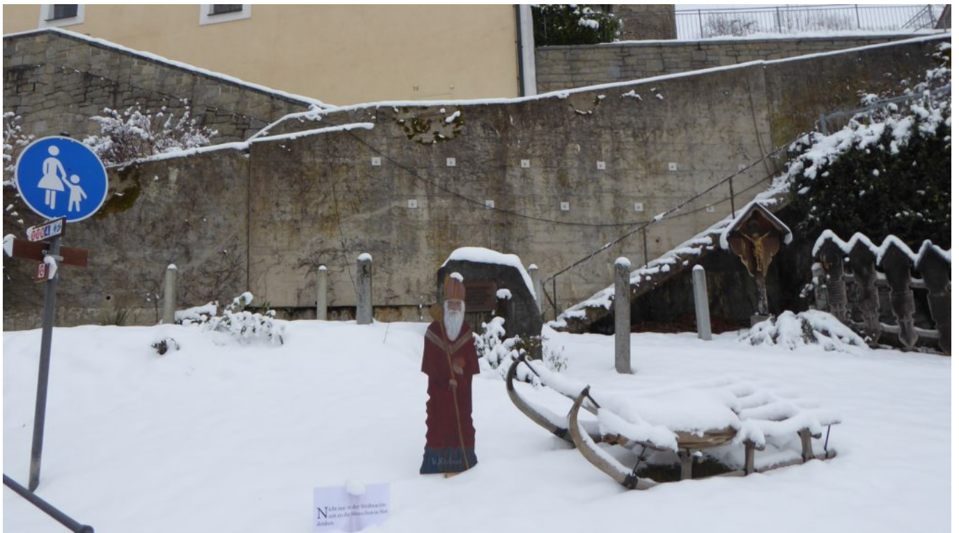
Der heilige Nikolaus mit einem alten Hörnerschlitten.

Auch Zugschlitten genannt. Die Holzknechte mussten diesen Schlitten zuerst zu den gefällten Baumstämmen am Berg oft