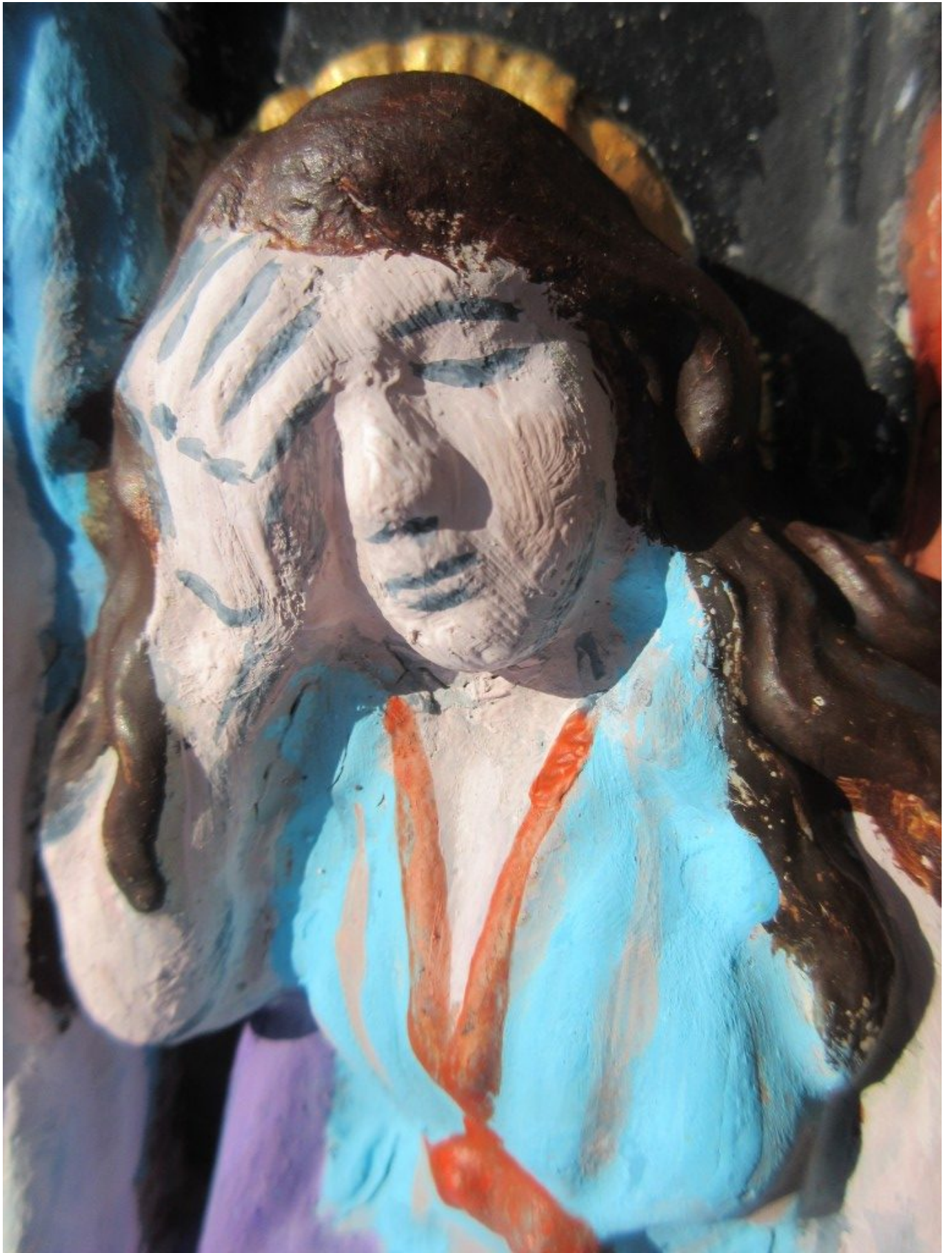
Maria Magdalena unterm Kreuz