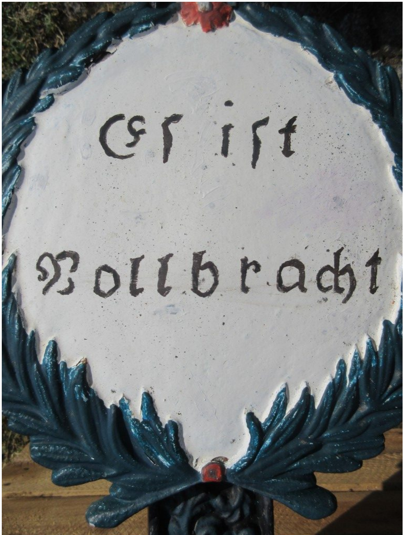
"ES IST VOLLBRACHT" (Joh. 19, 30)