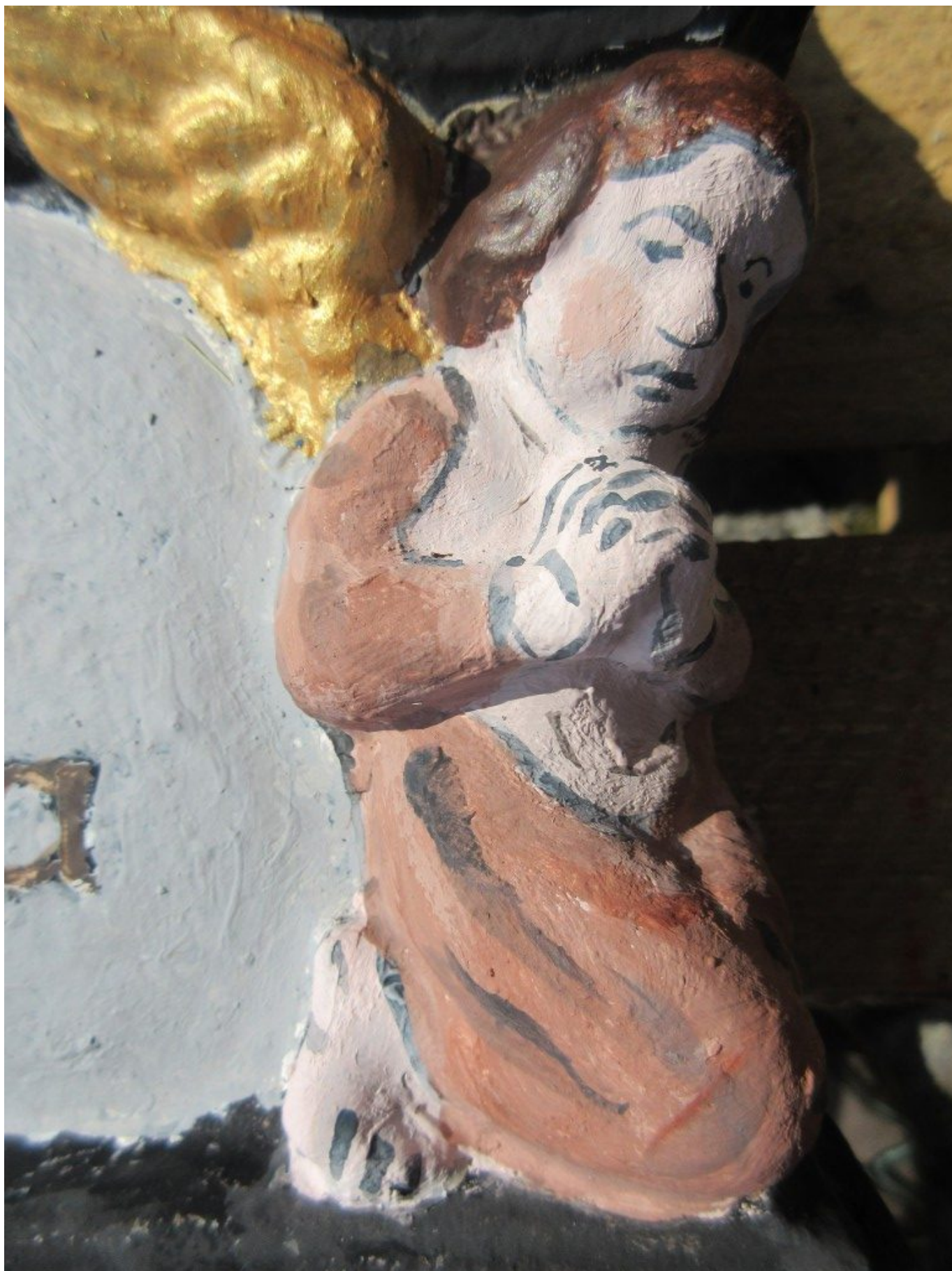
Kleiner Engel am Mirtlhof-Kreuz

Nun sind die letzten Feinarbeiten bei der farbigen Fassung des