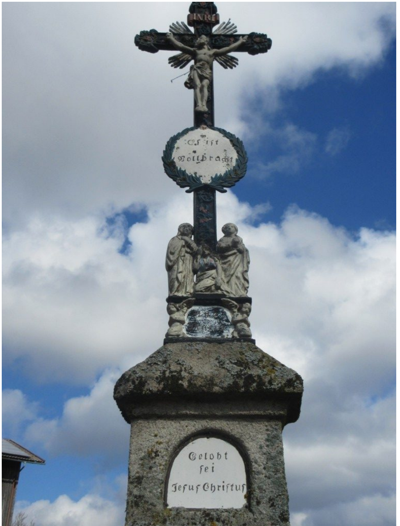
gen Himmel blickend