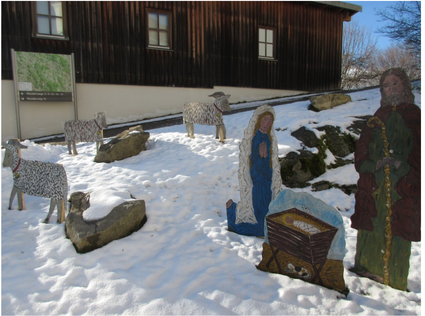
Krippenszene unterhalb der Kollnburger Kirche