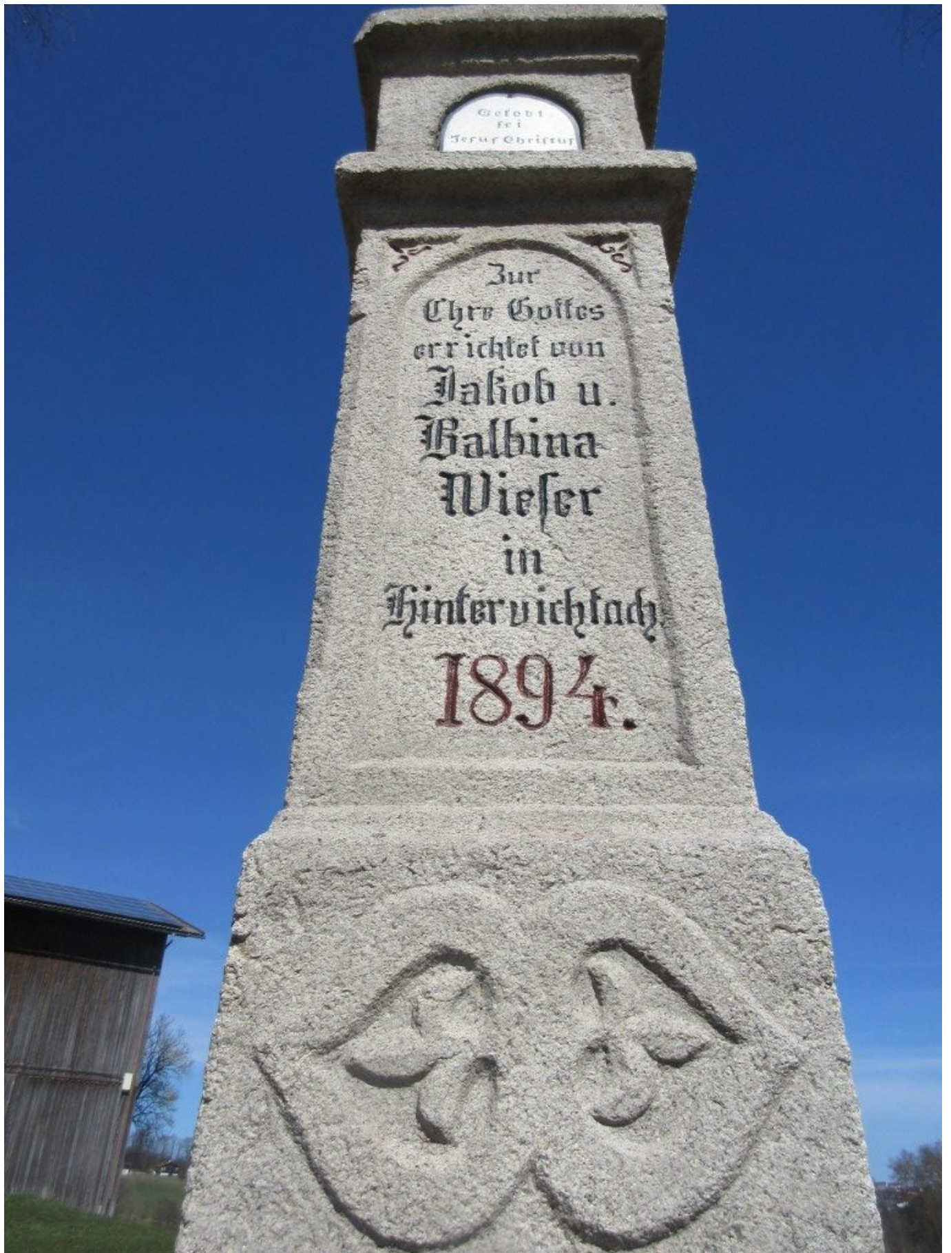
Alles ist nun wieder gut erkennbar.