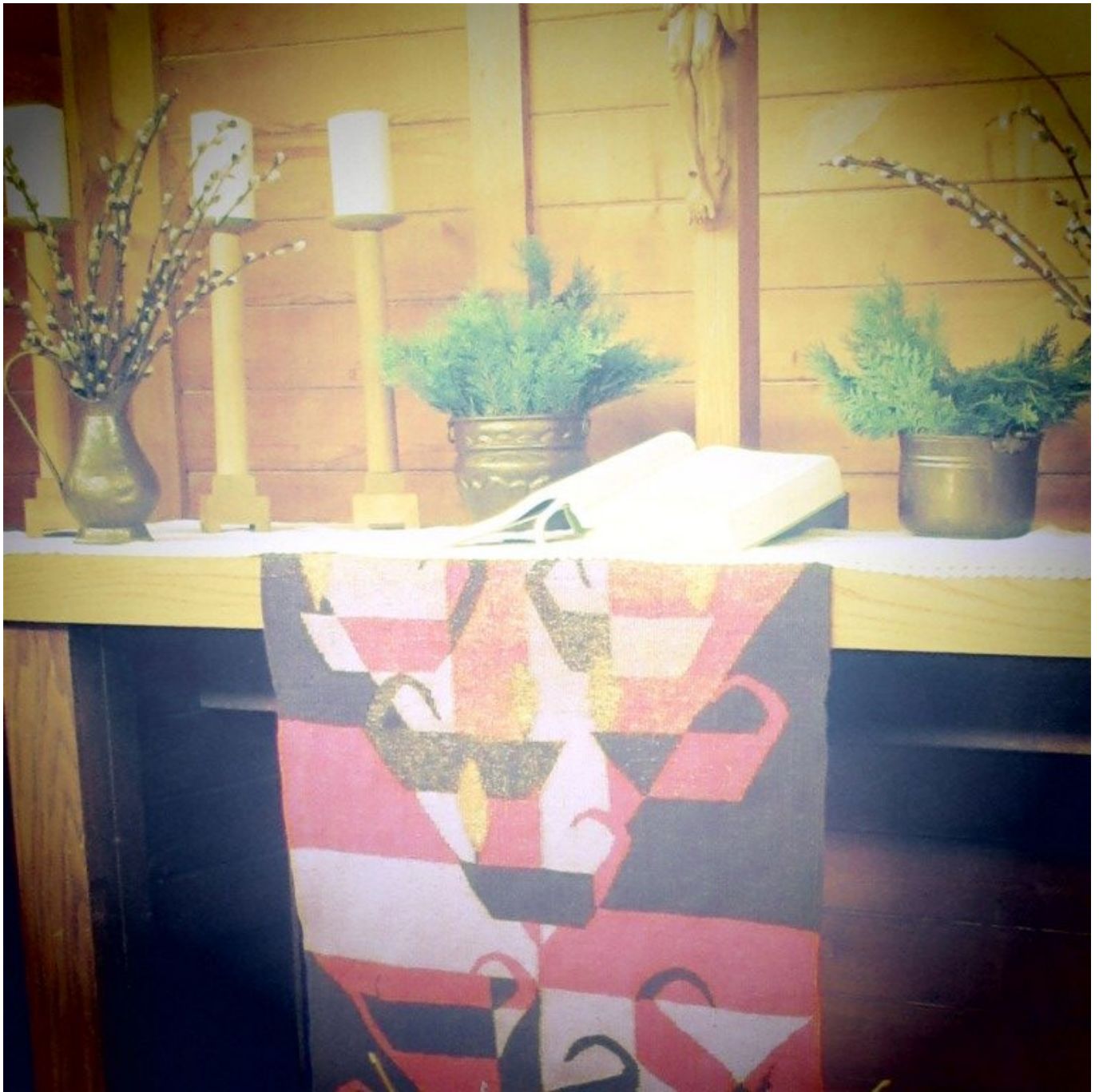
Altar "Fasten" in der Christuskirche Viechtach – – liturgische Farbe violett, geschmückt mit Thuja, Weidenkätzchen.