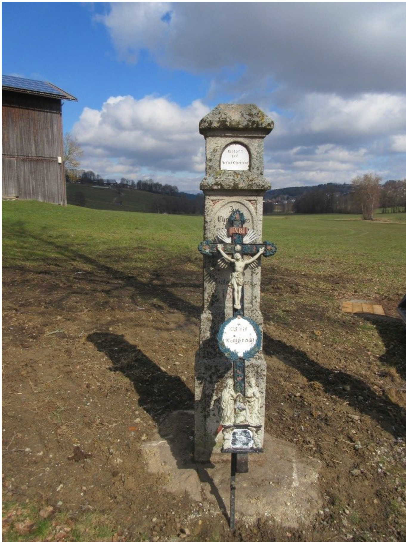
Das Kreuz wurde zur Renovierung jetzt abgenommen.