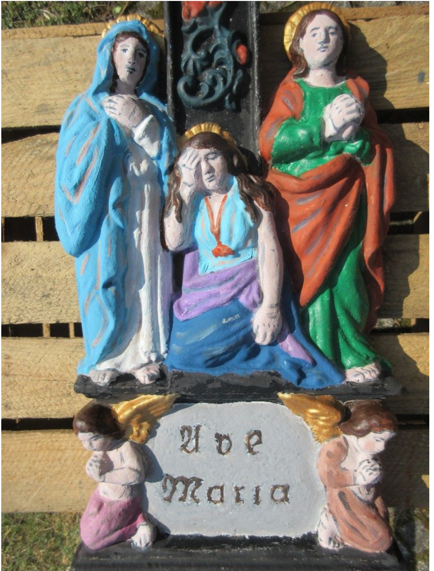
Figurengruppe unterm Kreuz