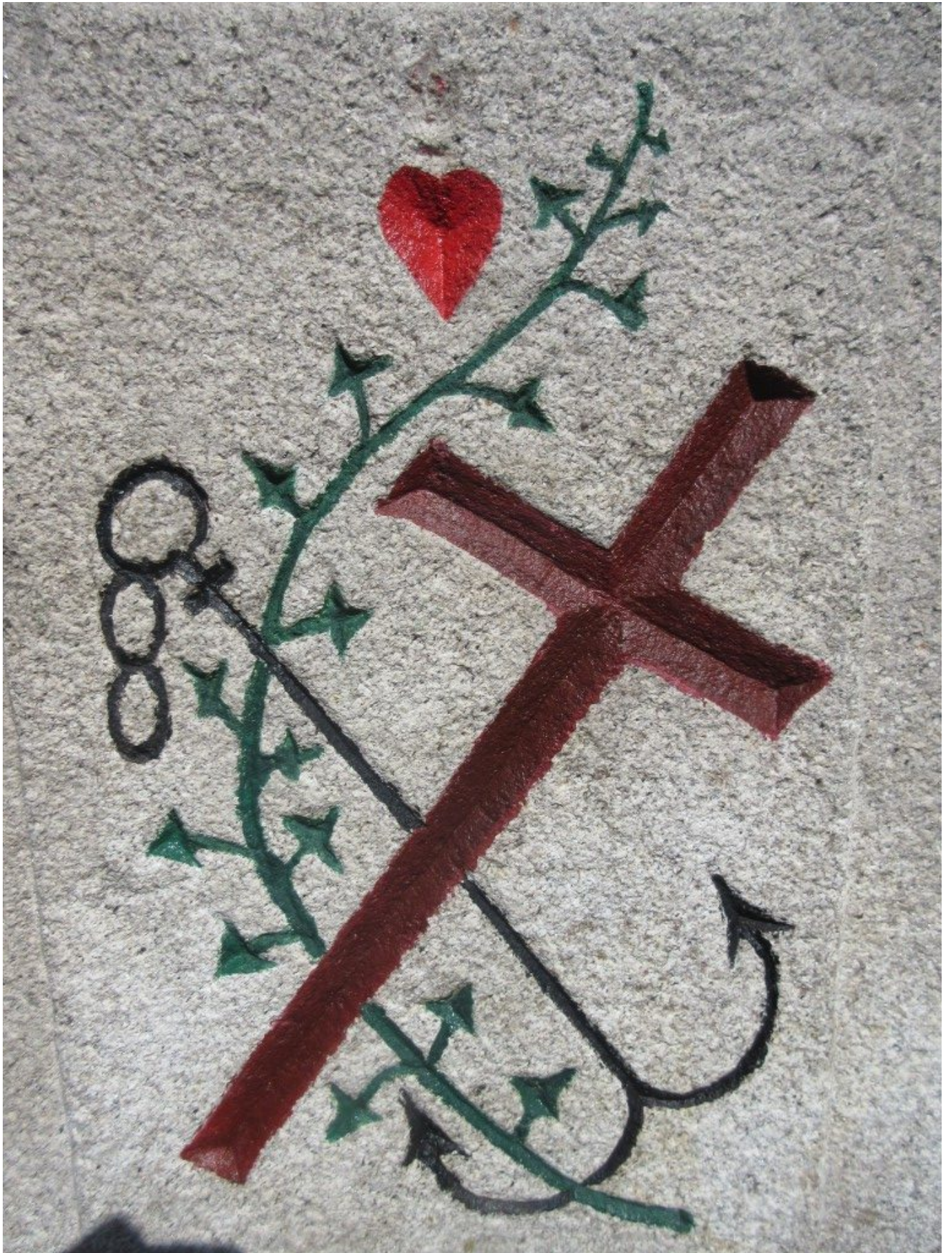
AH: Ein Anker!