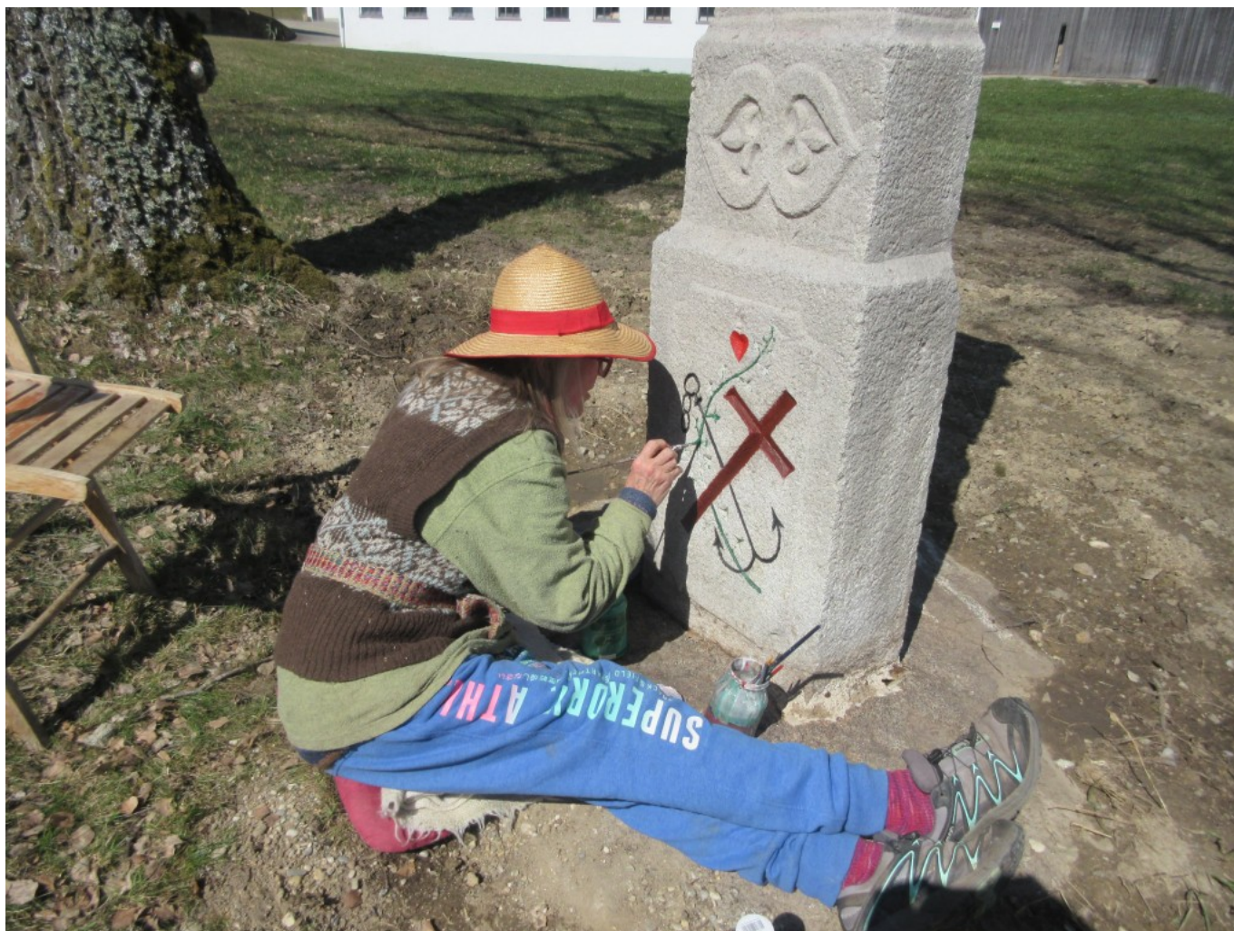
Das Herz muss hellrot sein!