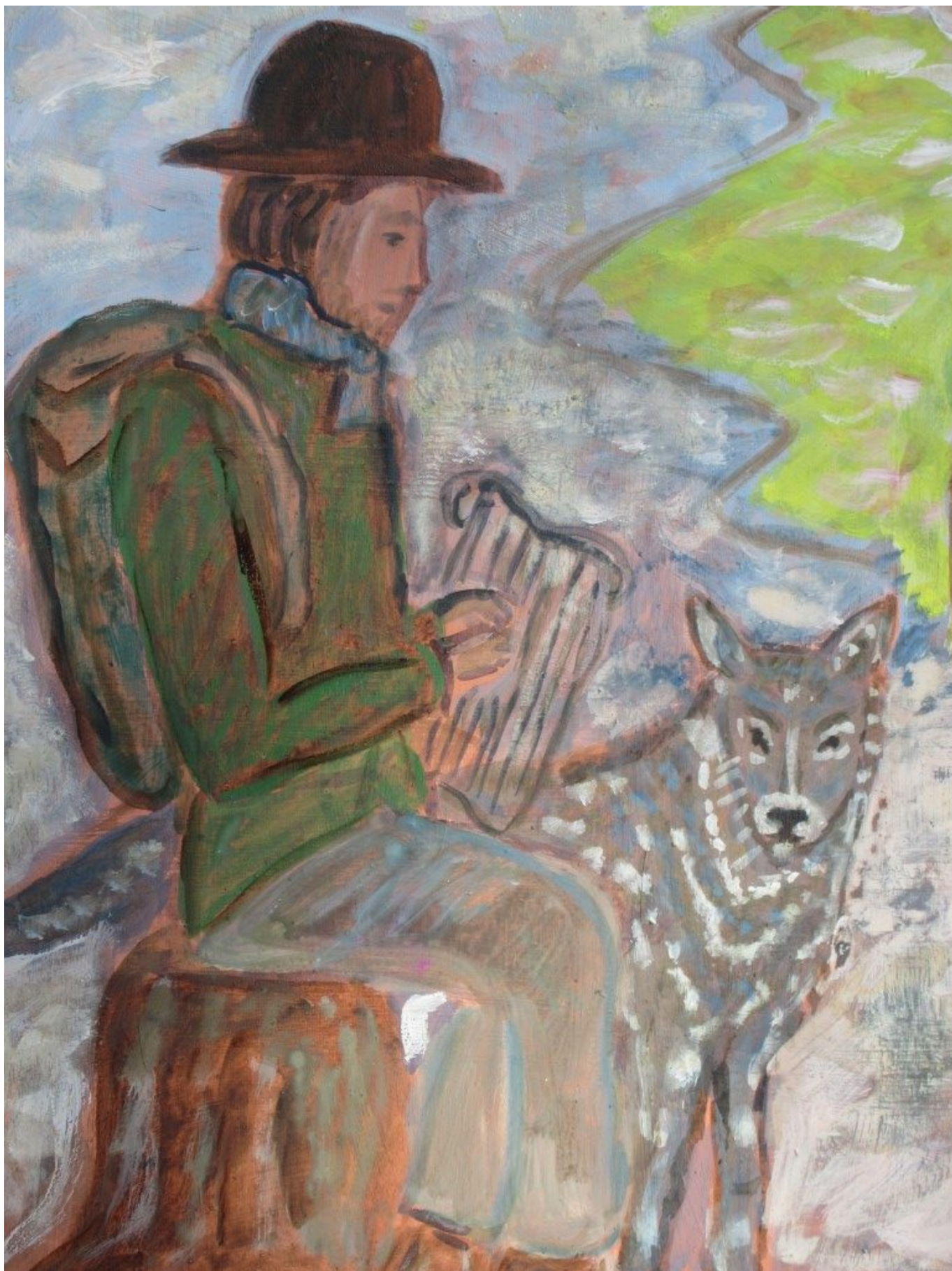
Pilger Rudi Simeth unterwegs mit Harfe und Wolf

Unser hochgeschätzter Pilgerbruder Rudi Simeth hat uns