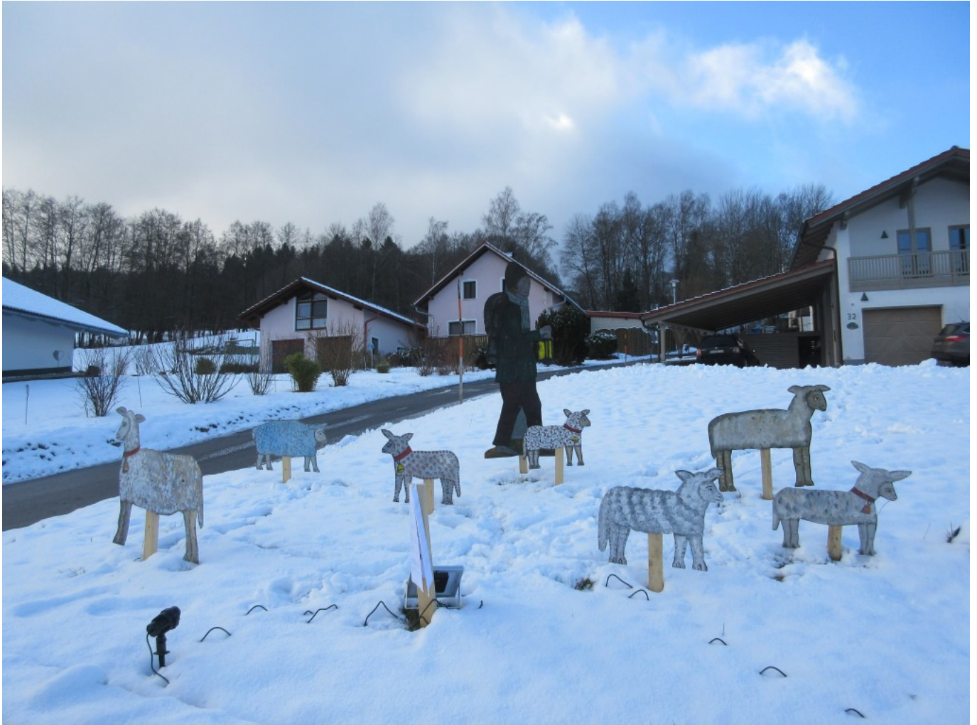
Hirt mit Schäfchen, nachts beleuchtet.