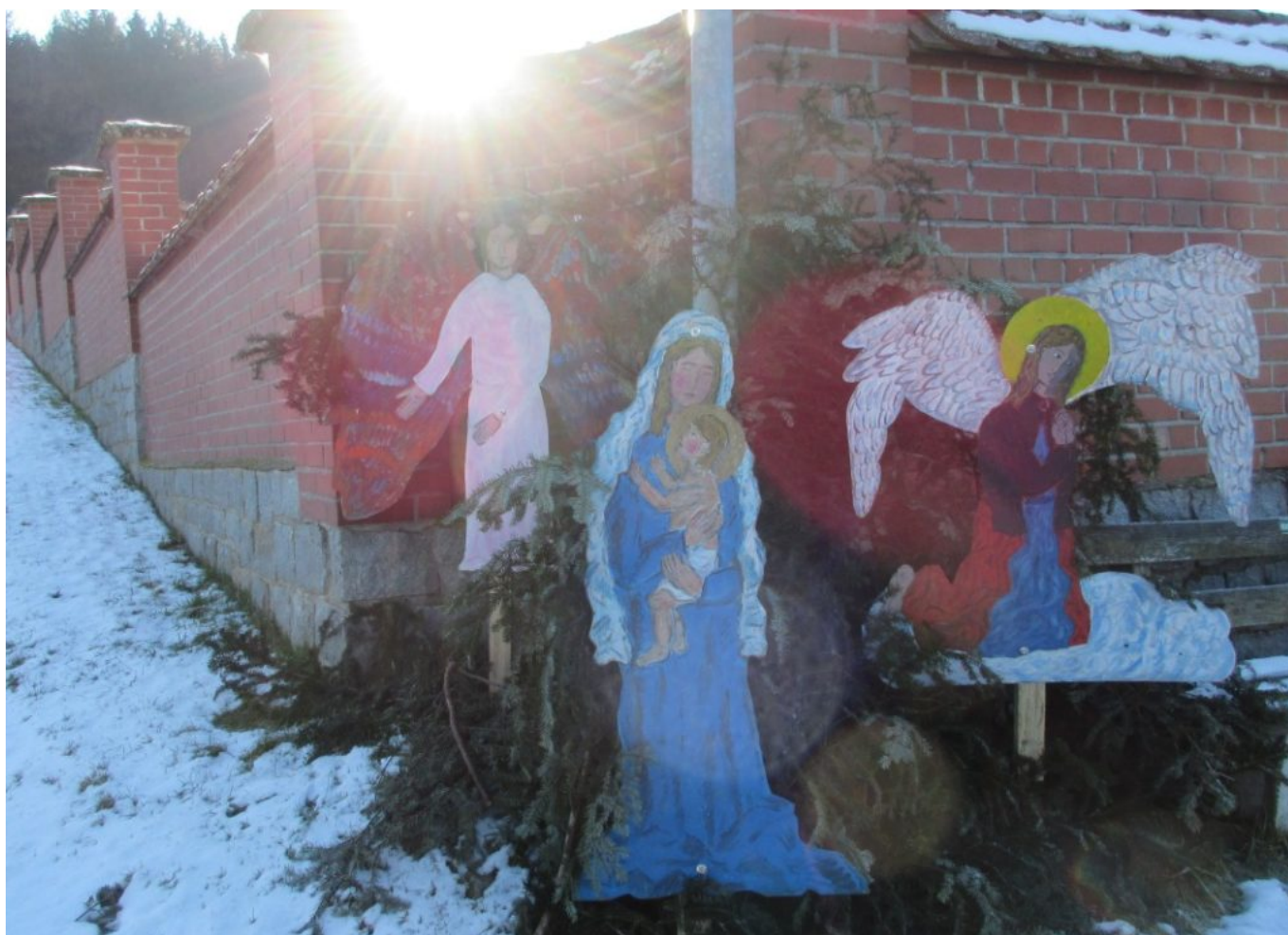
Liebevoll aufgestellte Figurengruppe mit Maria, dem Jesuskind und Engeln an der Friedhofsmauer von Kirchaitnach