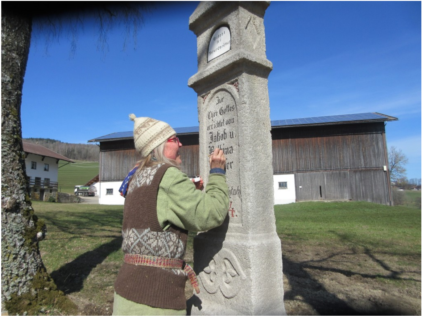
Einfach weiter malen