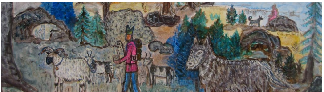
Der heilige Wolfgang mit Schafen in Begleitung eines Wolfs auf