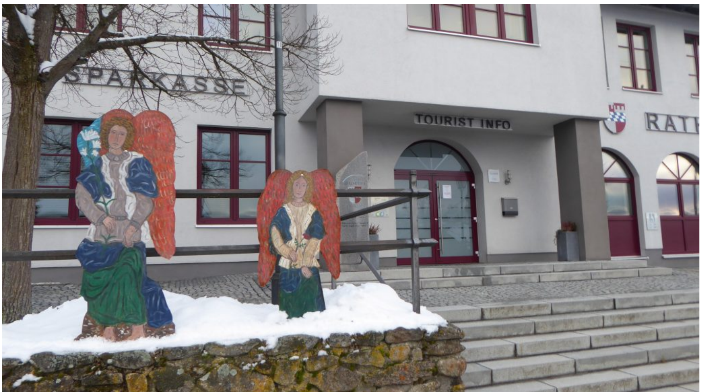
Erzengel Gabriel und kleiner Engel „Emilia“ beim Kollnburger Rathaus