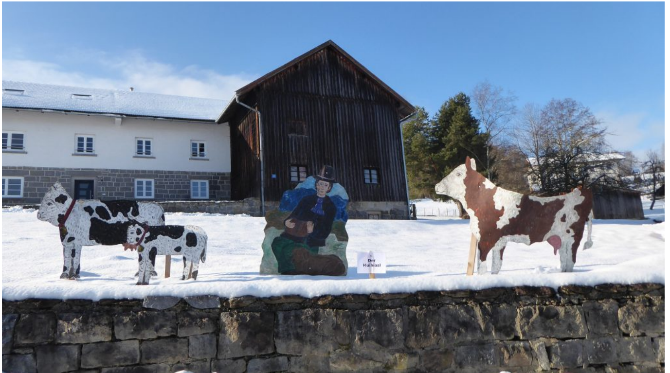
Der Waldprophet als Waldhirte in Allersdorf