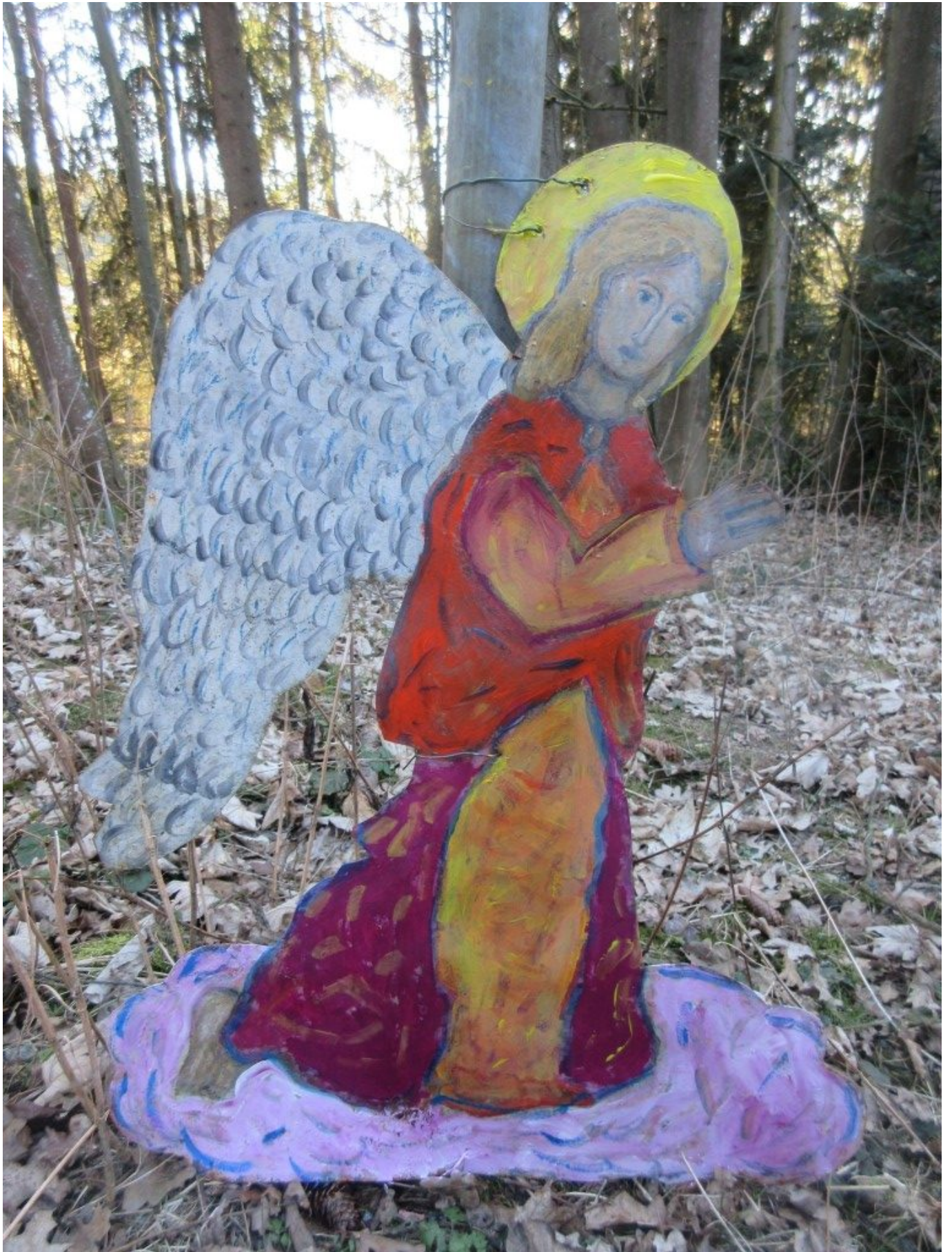
Engel Morgen- und Abendgebet