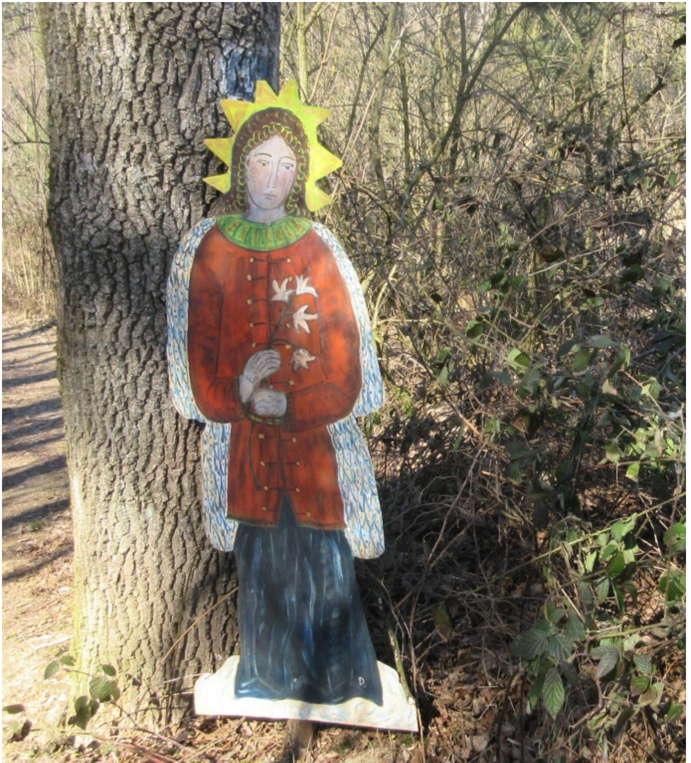
Schutzengel mit Sternenschein