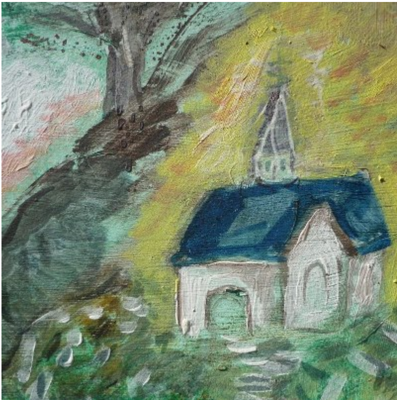
Die Wolfgangskapelle (Gemälde von Dorothea Stuffer)

Legenden werden von Generationen zu Generationen weitergetragen und somit verlieren sie nie ihre Bedeutsamkeit. Der Glaube beflügelt und dringt bleibend in die Herzen ein. (Sieghild)