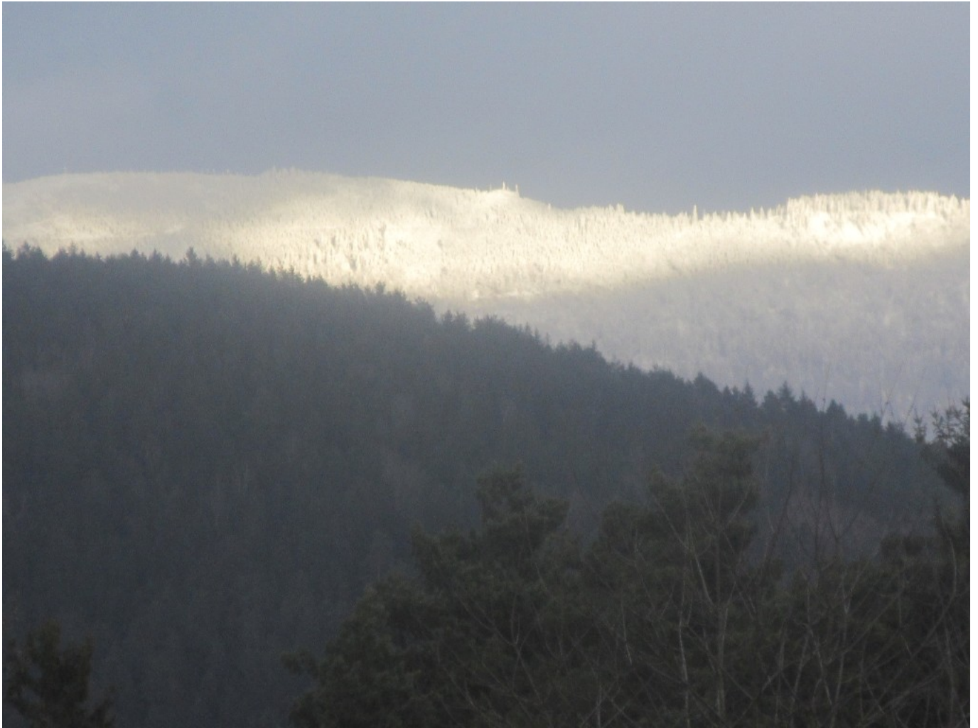
Blick hinauf zu den Tausendern, Böhmisches Grenz