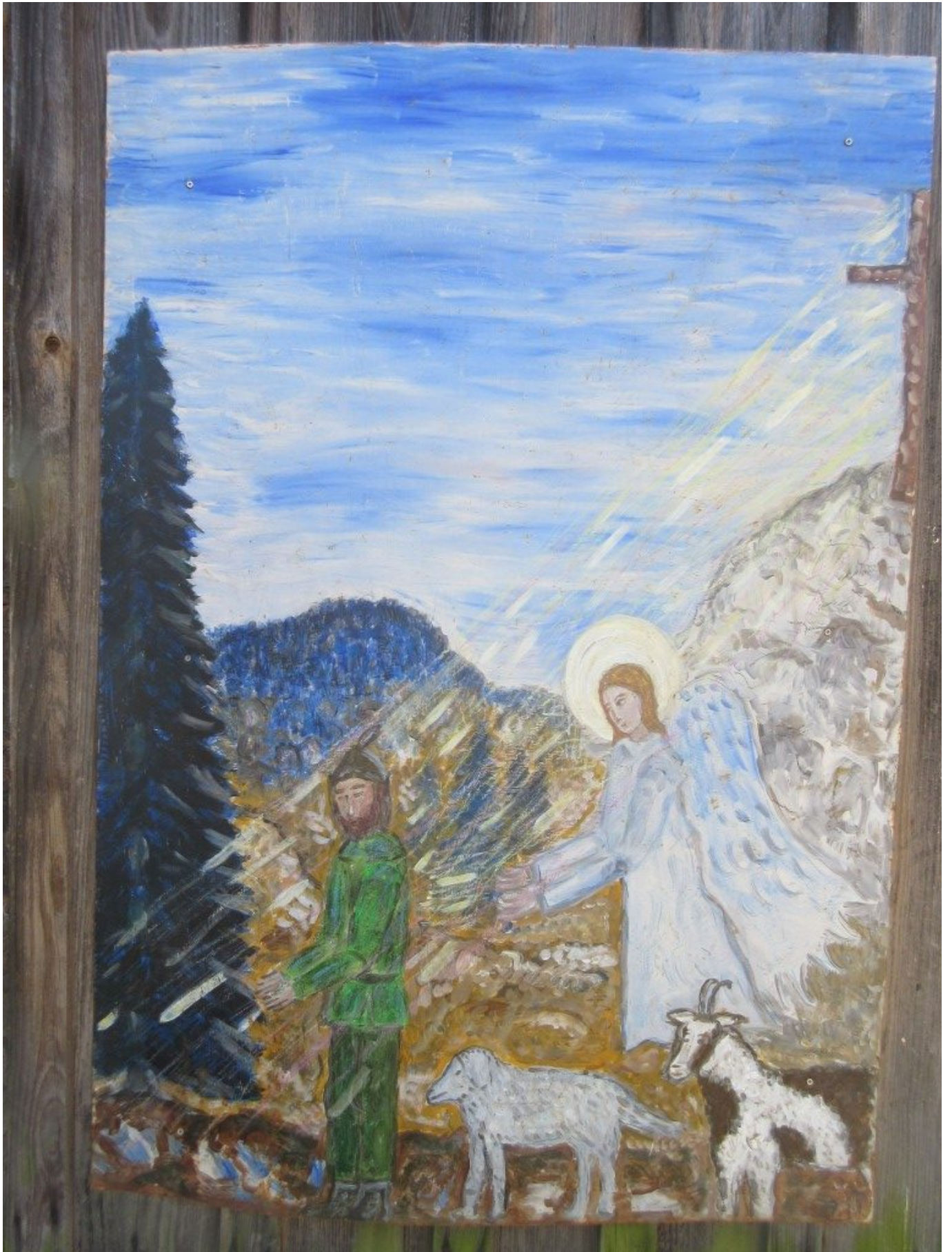
Engel beschützt Waldhirten

„Auch wer Gott in seinem Leben nicht wahrnehmen kann, ist vom