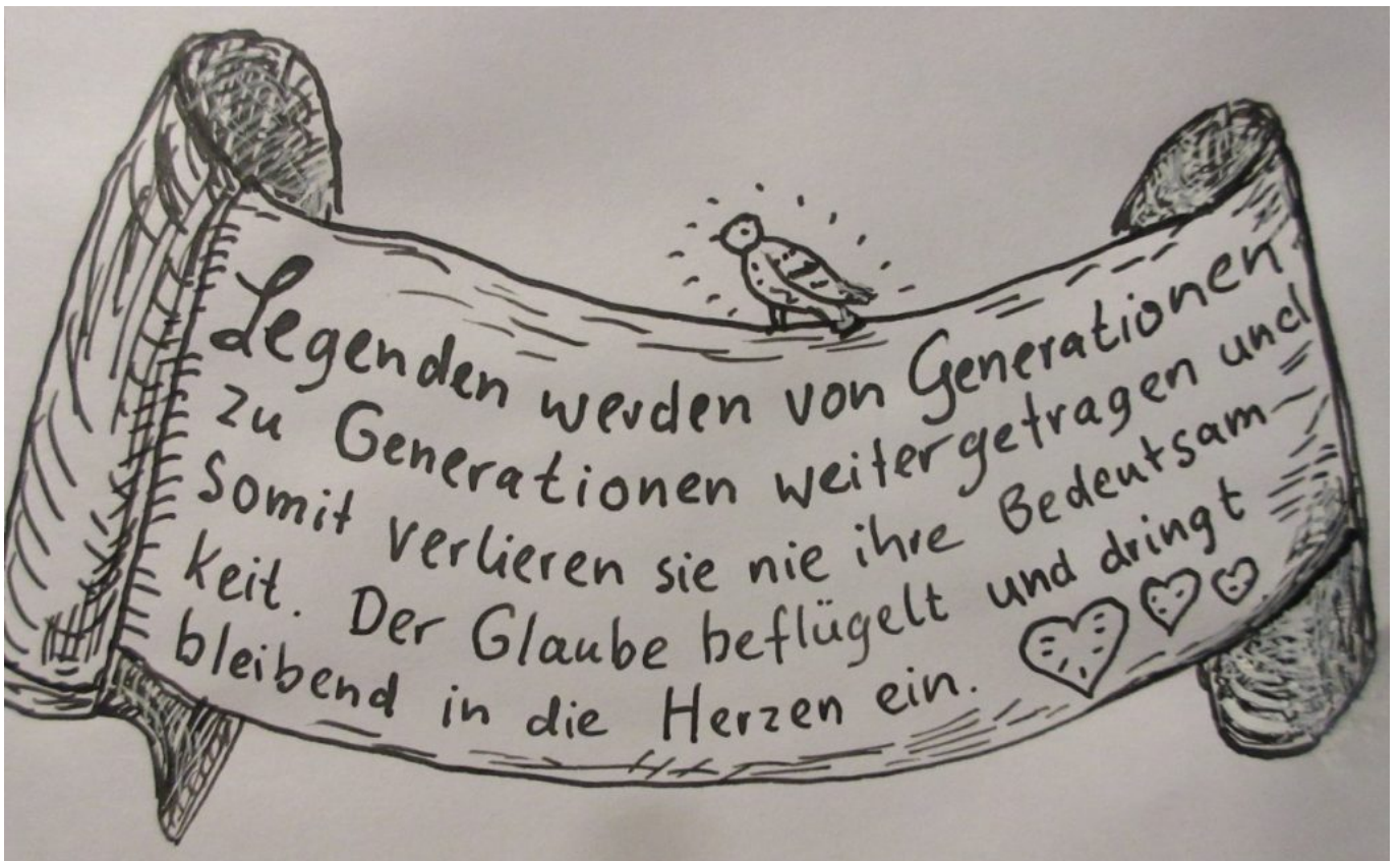
Spruchband, gezeichnet von Dorothea Stuffer, mit einem Text von Sieghild