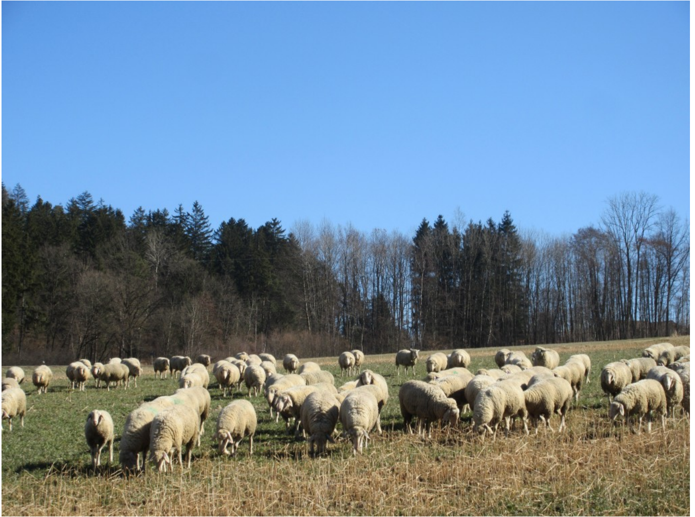
Eine Schafherde zieht am Engelweg vorbei