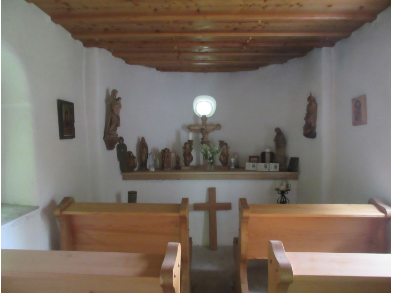
Das Innere der Kapelle