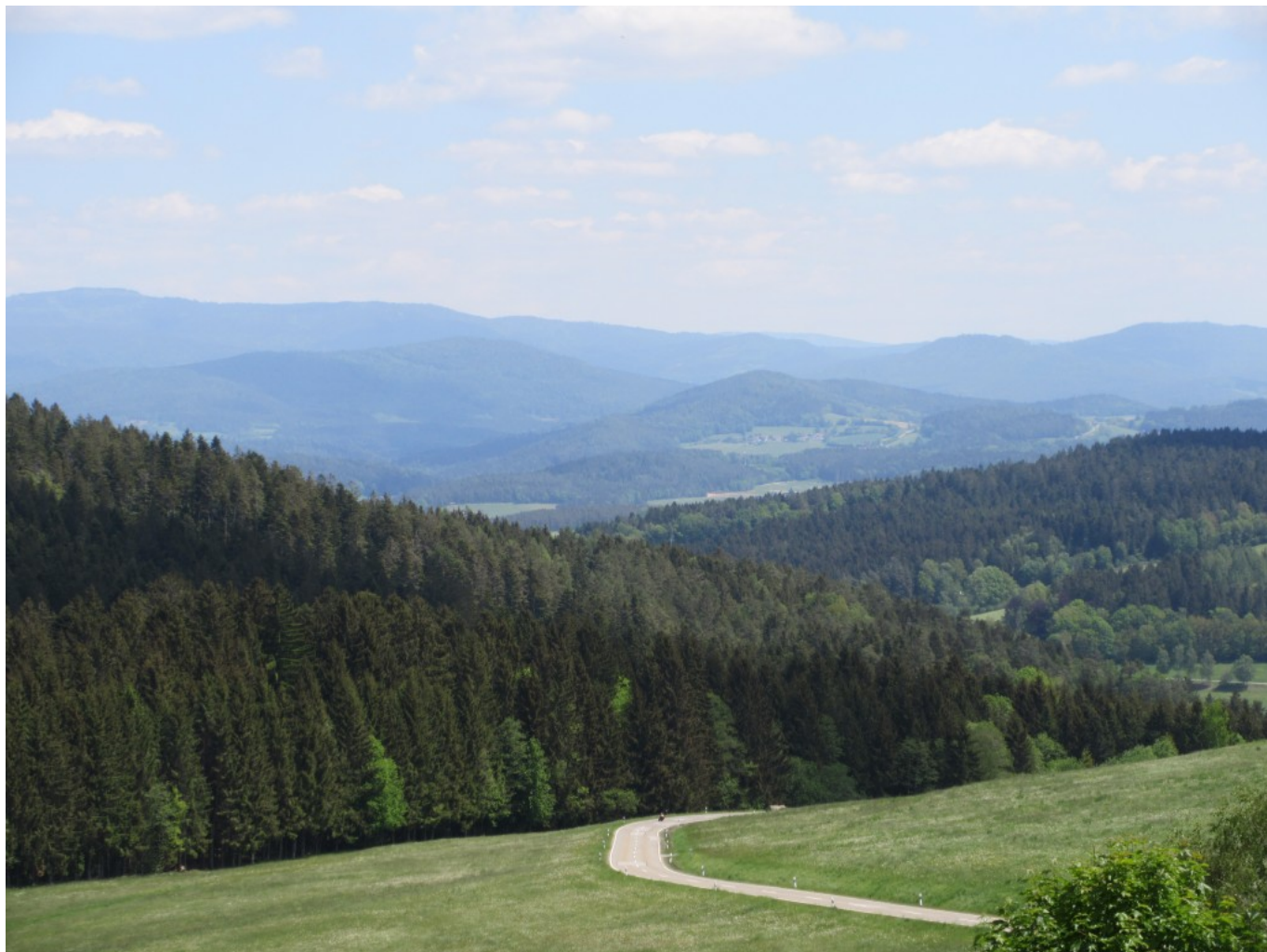
..über die Höhenzüge des Bayerischen Waldes