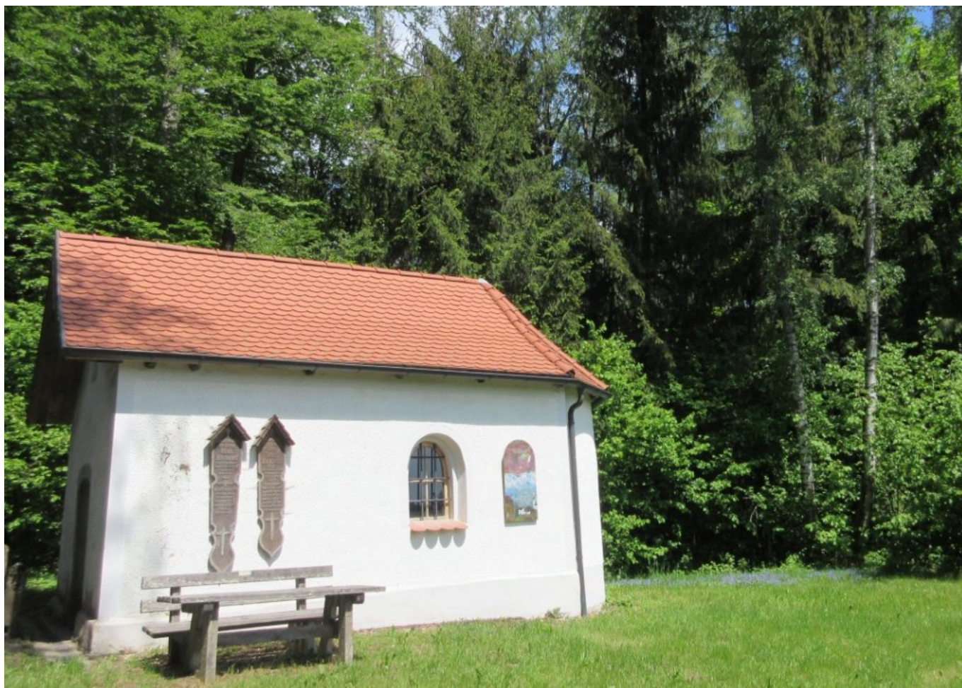
Nun aktuell angebracht: Bildtafel rechts : "Engel überm Bergdorf"