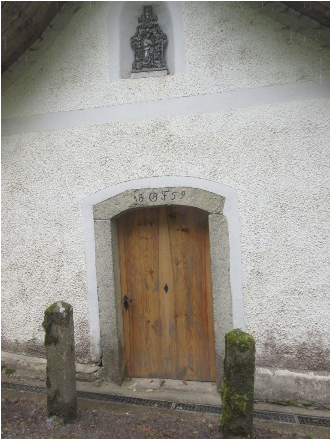
Der Eingang zur Kapelle mit der Steingravur 1859