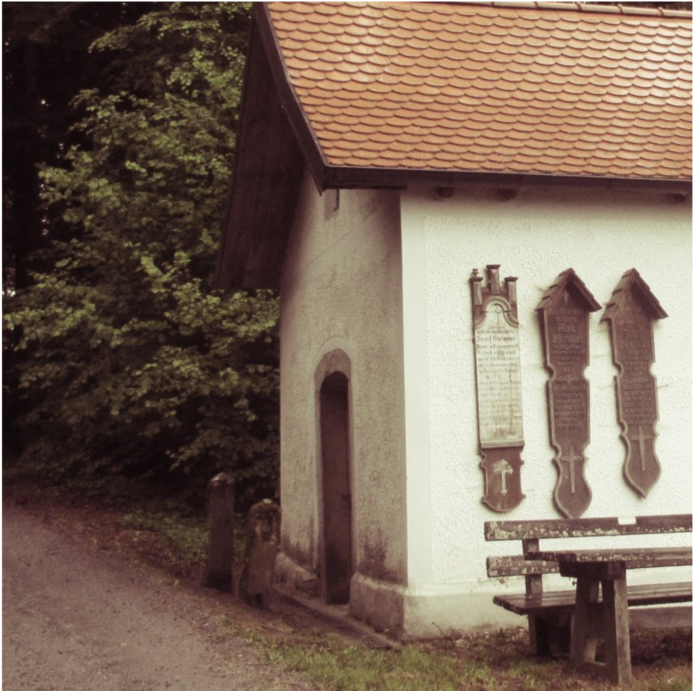
Diese stille Kapelle steht bei Ramersdorf in der Nähe des "Einödweg" am Waldesrand.