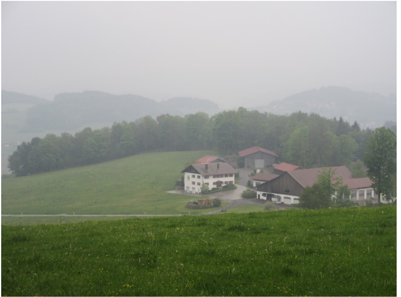
Blick von der Kapelle zum Bielmeier-Bernhard-Anwesen...