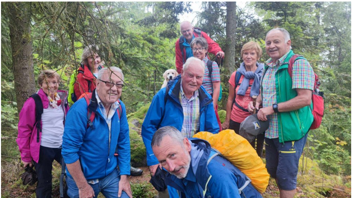
Weiteres Gruppenbild beim Keltenstein/Opferschale auf der Gsteinachhöhe