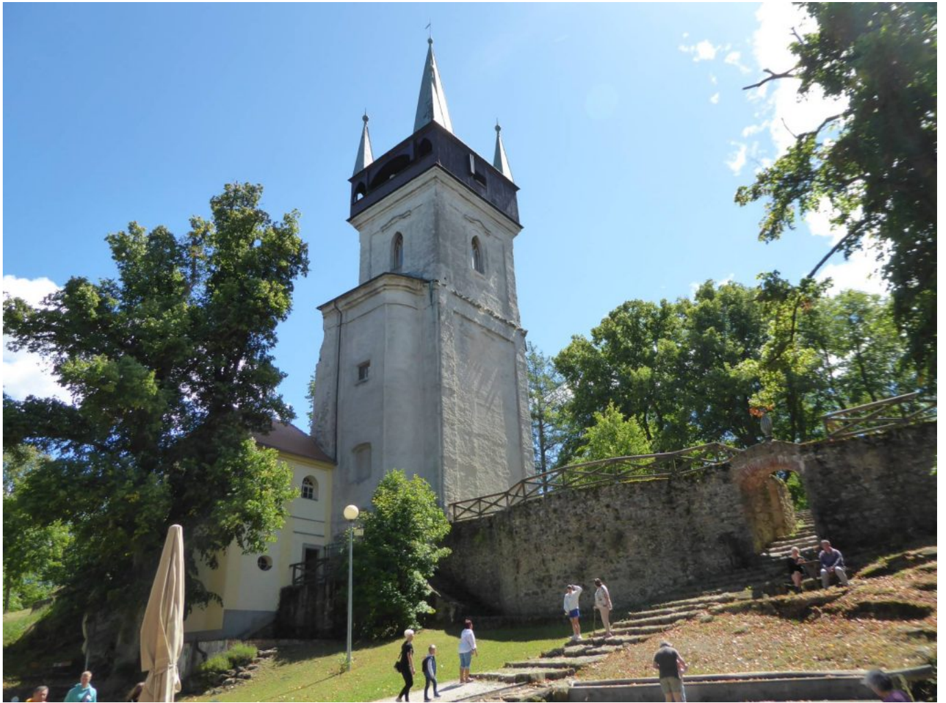
Aussichtsturm Bolfánek mit Kapelle Sv. Wolfgang – einst eine stattliche Wolfgangskirche