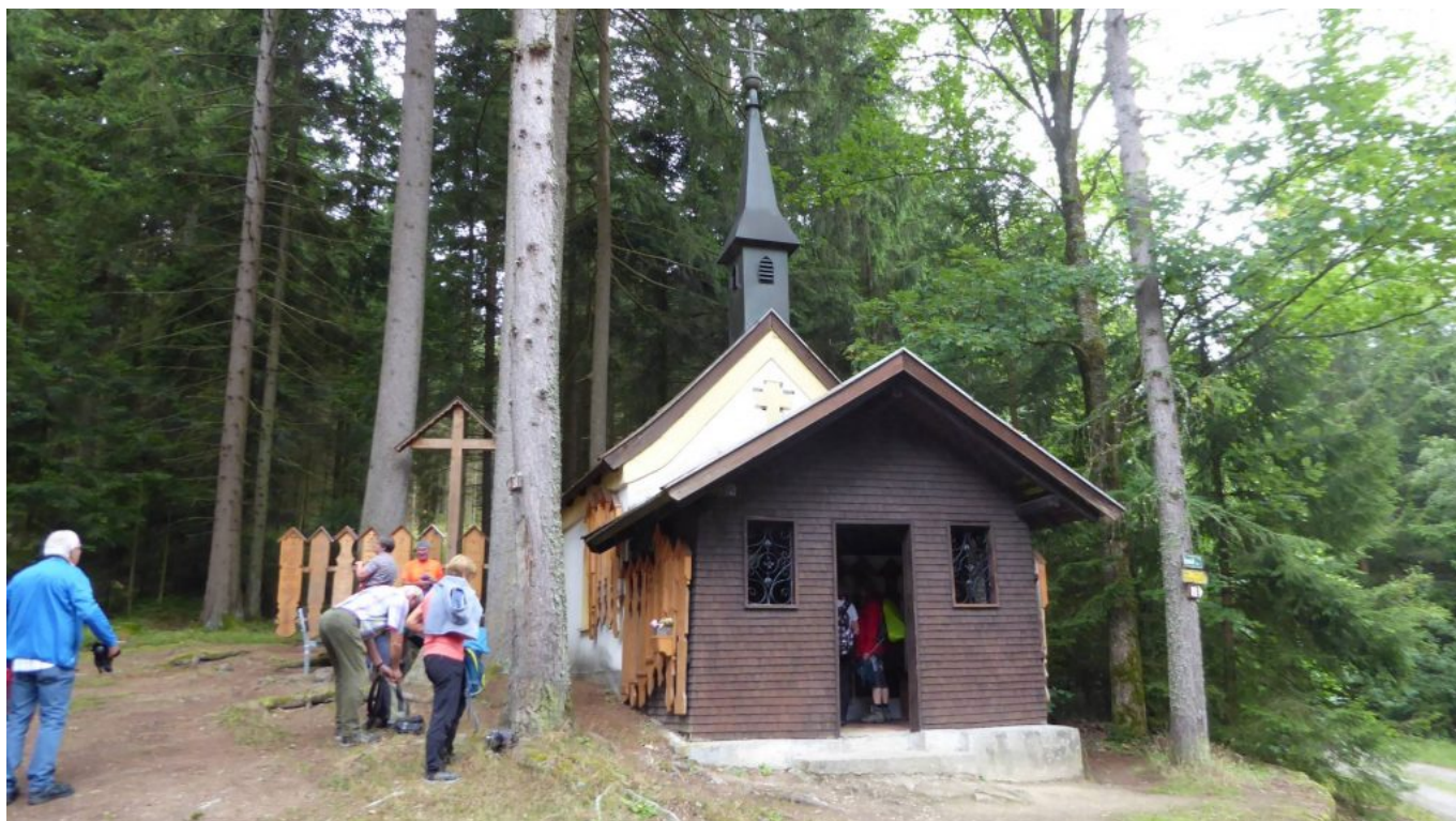
Bei der Distelbergkapelle angekommen