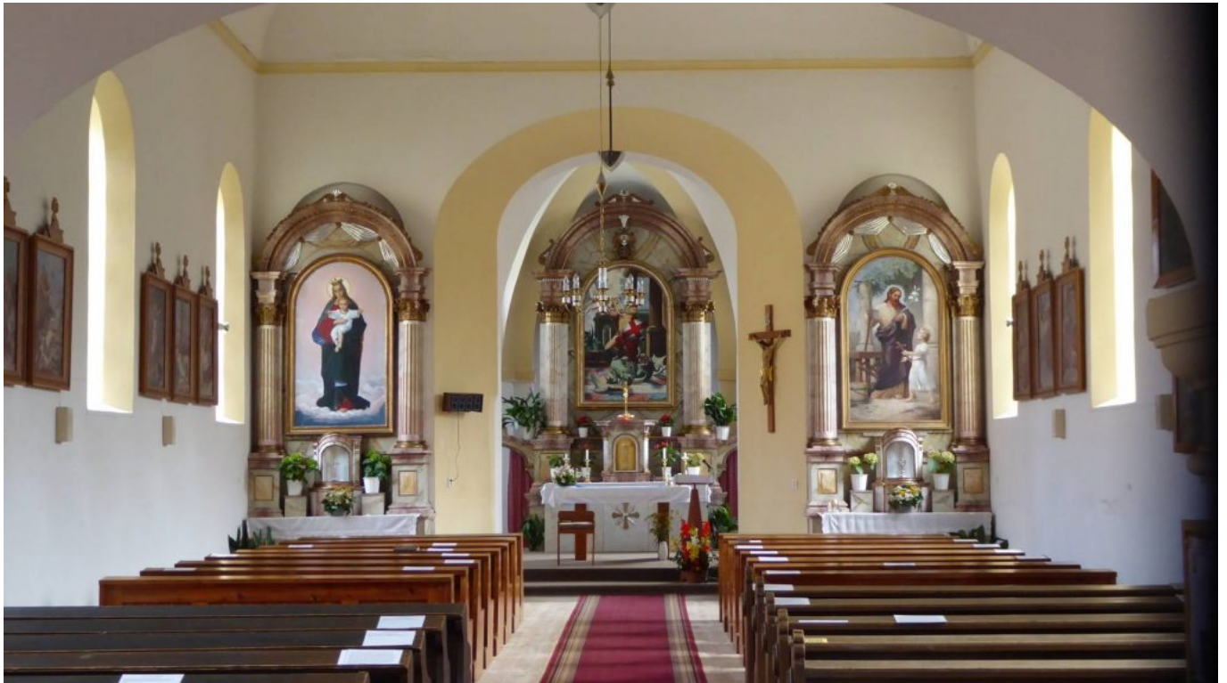
Prachtvoll renovierte Kirche Sv. Jiří mit Drachentöter St. Georg im Hauptaltar, sowie jeweils Maria und Josef mit dem Jesuskind