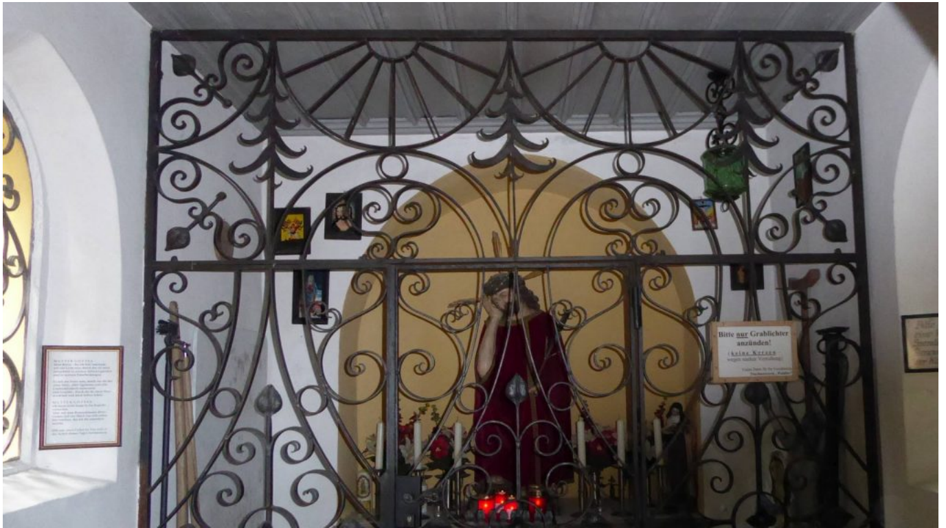
Altarraum der Distelbergkapelle