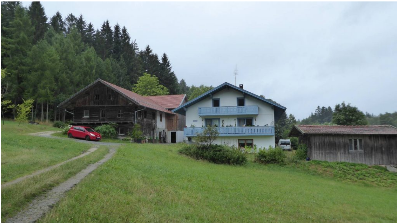
Schwaben am Wolfgangsweg Richtung Pröller – St. Englmar