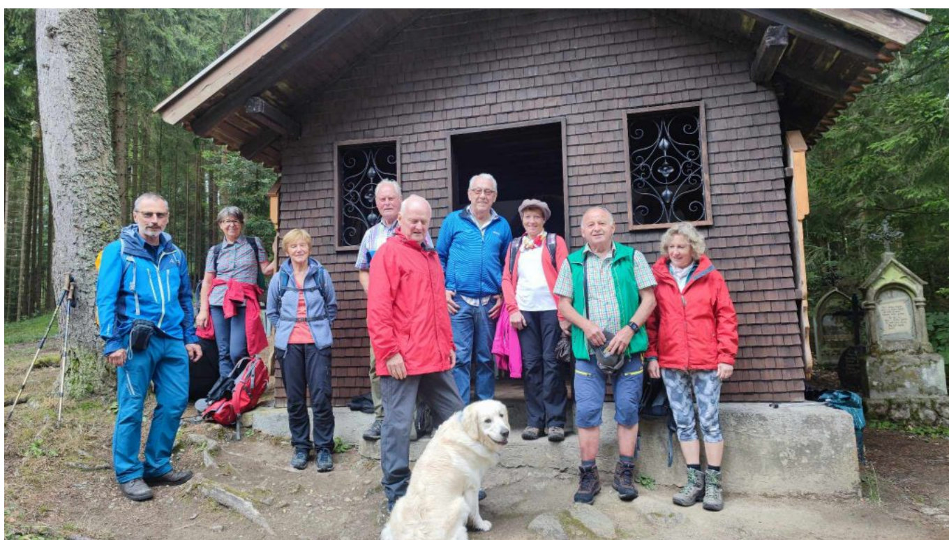
Die Distelbergkapelle mit Wandergruppe und Hund Emilio