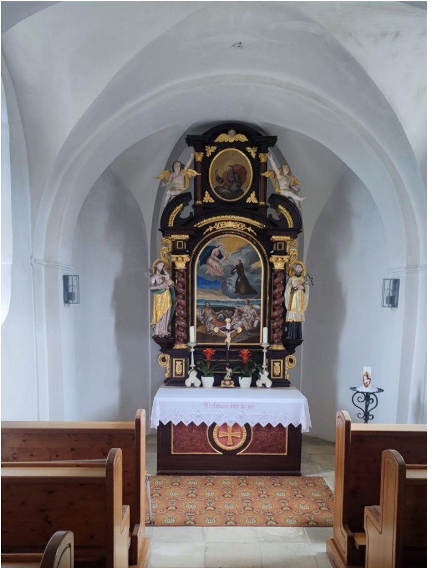
Altarraum der Antoniuskapelle