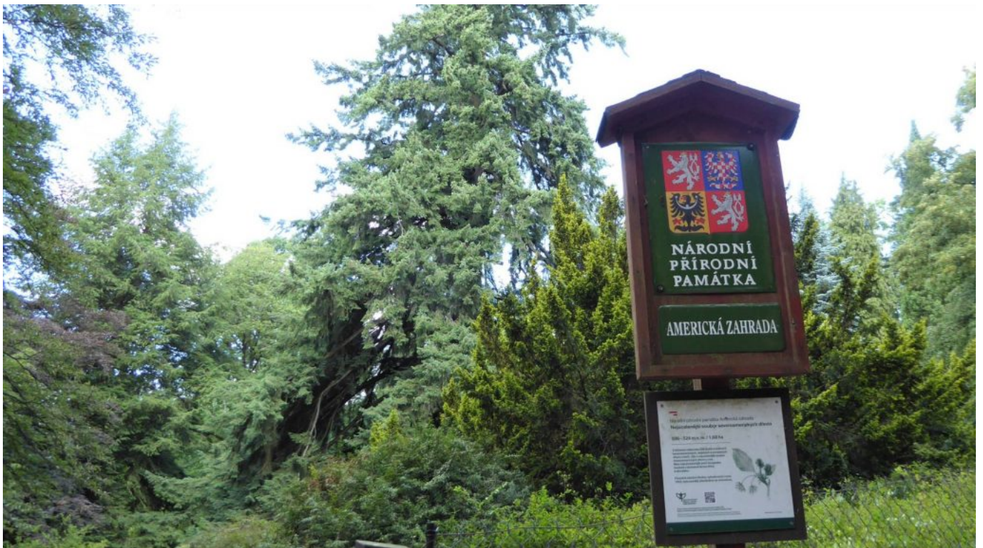
Nationales Naturdenkmal „Amerikanischer Garten“ Nähe Bolfánek bei Chudenice