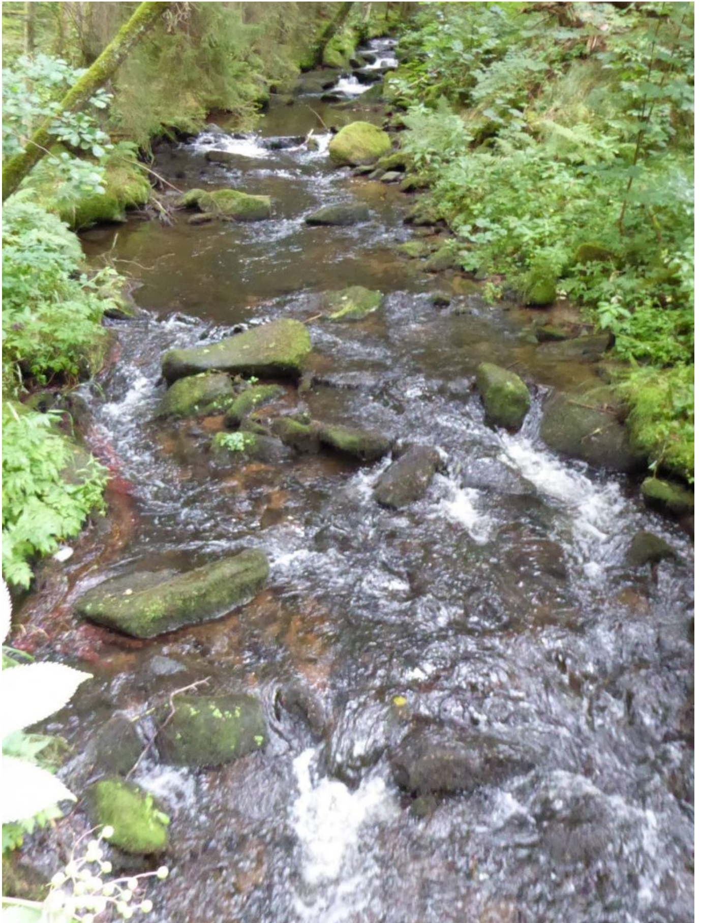
Der romantische Riedbach bei Hammer