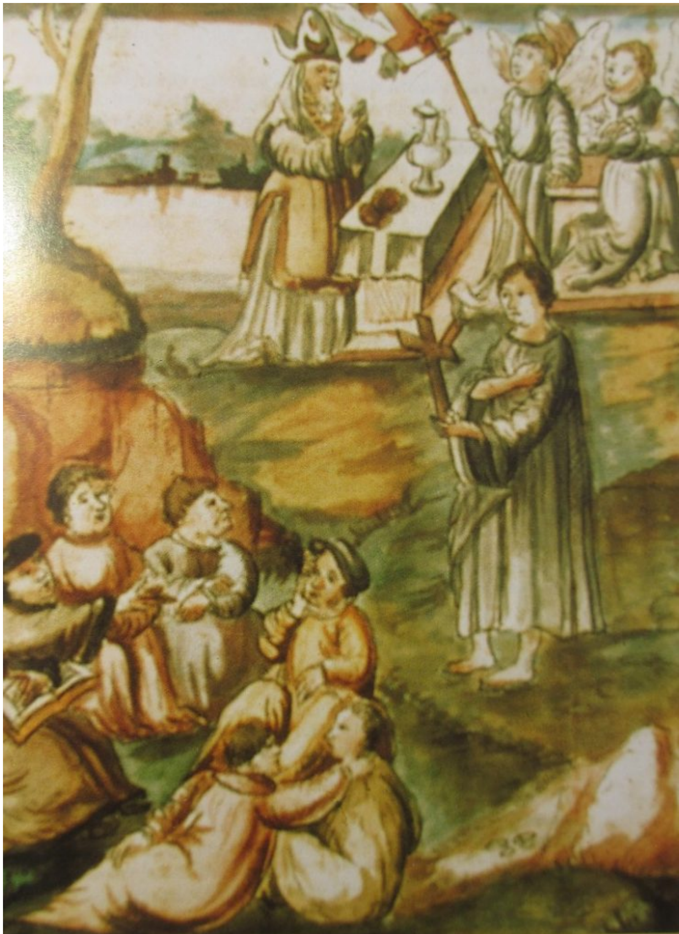
Oben rechts sehen Sie die beiden Original-Miniatur-