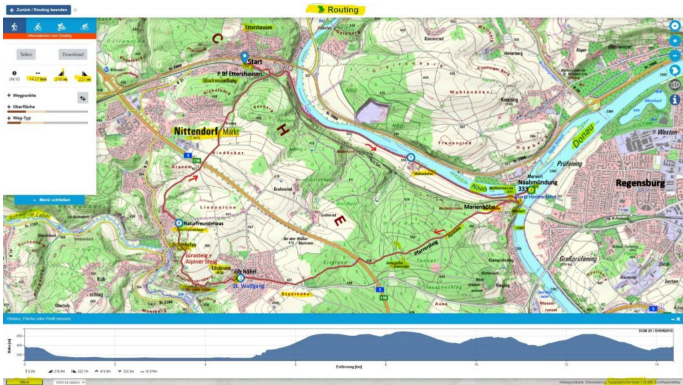
Bayern-Atlas – – Etterzhausen-Mariaort-Eilsbrunn