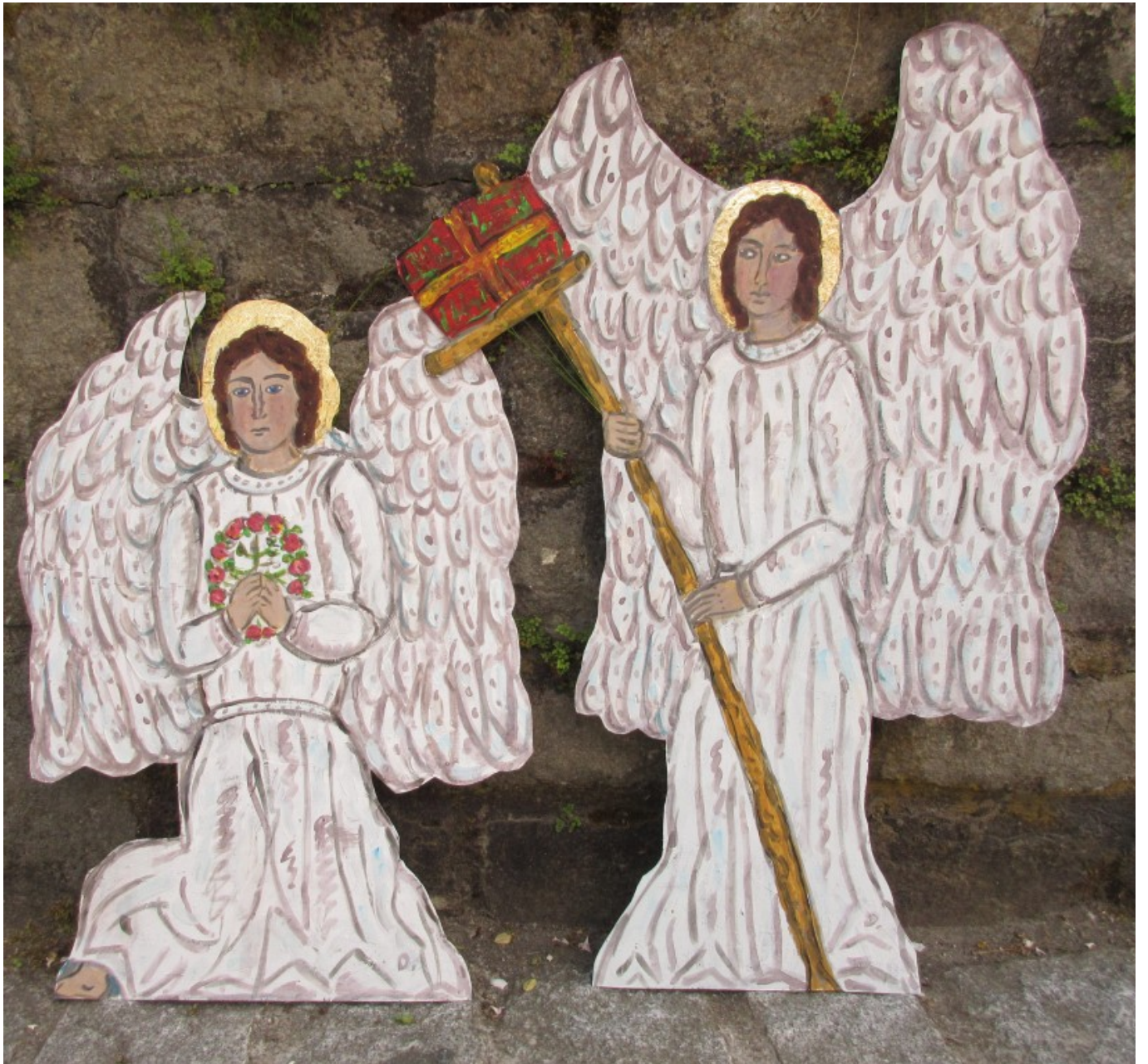
Eine Miniatur aus dem 16. Jahrhundert hat Dorothea Stuffer zu diesen beiden Blech-Engeln inspiriert..