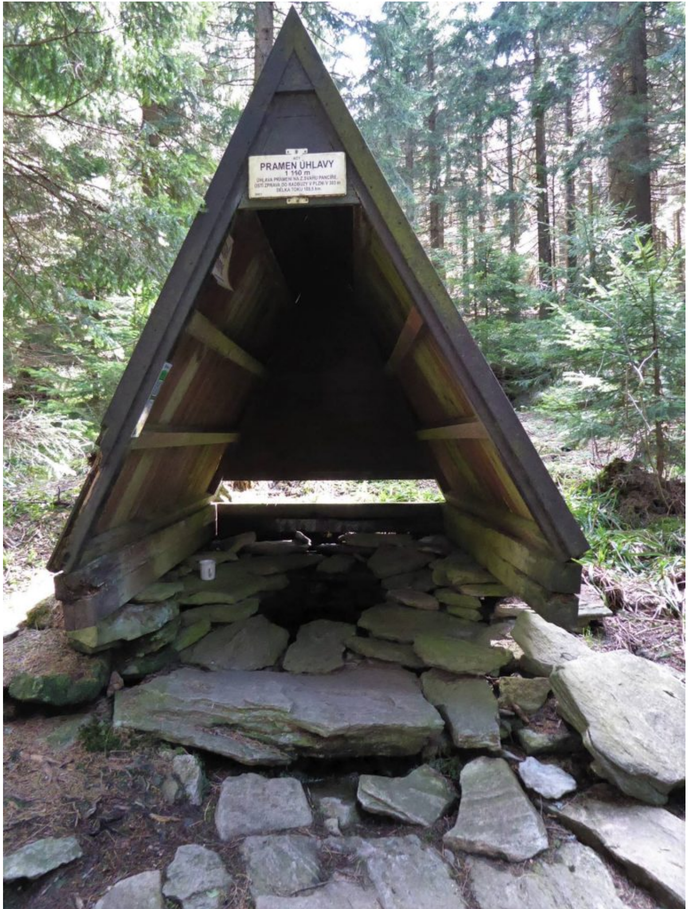
Die Angelquelle: Das Quellhäusl der Úhlava – der Angel auf der Westseite des Panzergipfels