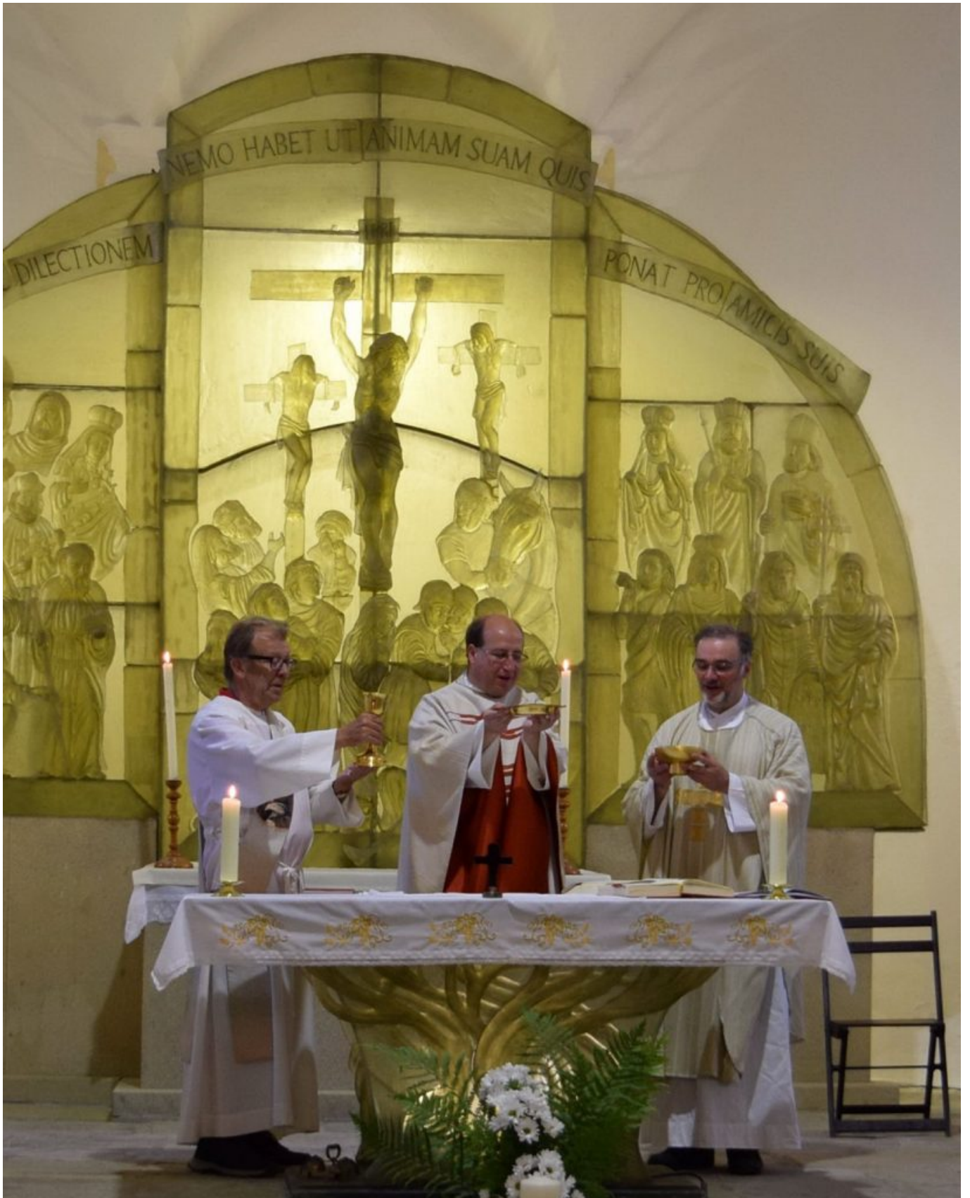
Wallfahrtsgottesdienst in der St. Gunther-Kirche in Dobra Voda (Gutwasser)