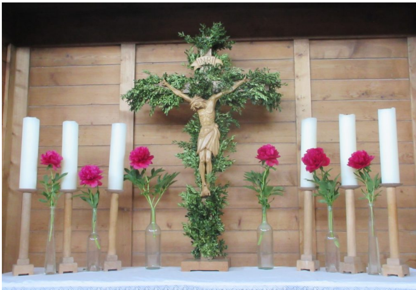
Liturgische Farbe an Pfingsten: Rot

Den Weg mit Jesus gehen – Konfirmation in der Christuskirche Viechtach