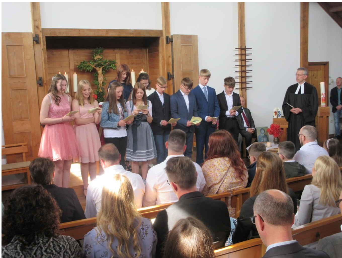
Die Konfirmanden tragen ihr Konfirmationsversprechen vor