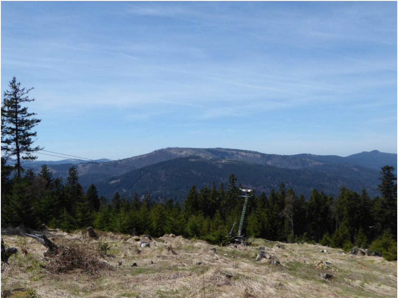
Aussicht vom Panzer: Herrliche Aussicht auf die Seewände und das Künische Grenzgebirge