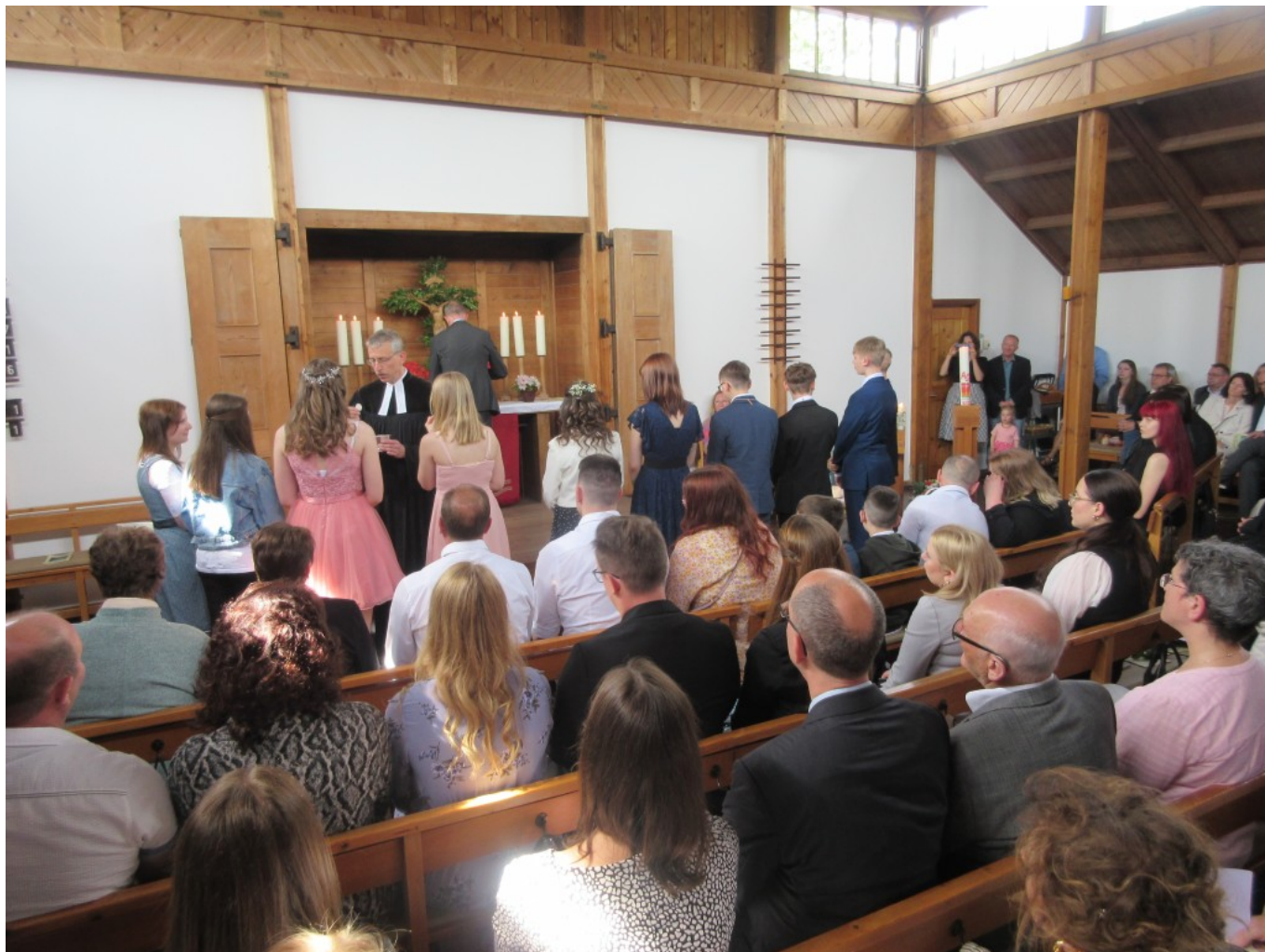
Die Konfirmanden empfangen das heilige Abendmahl