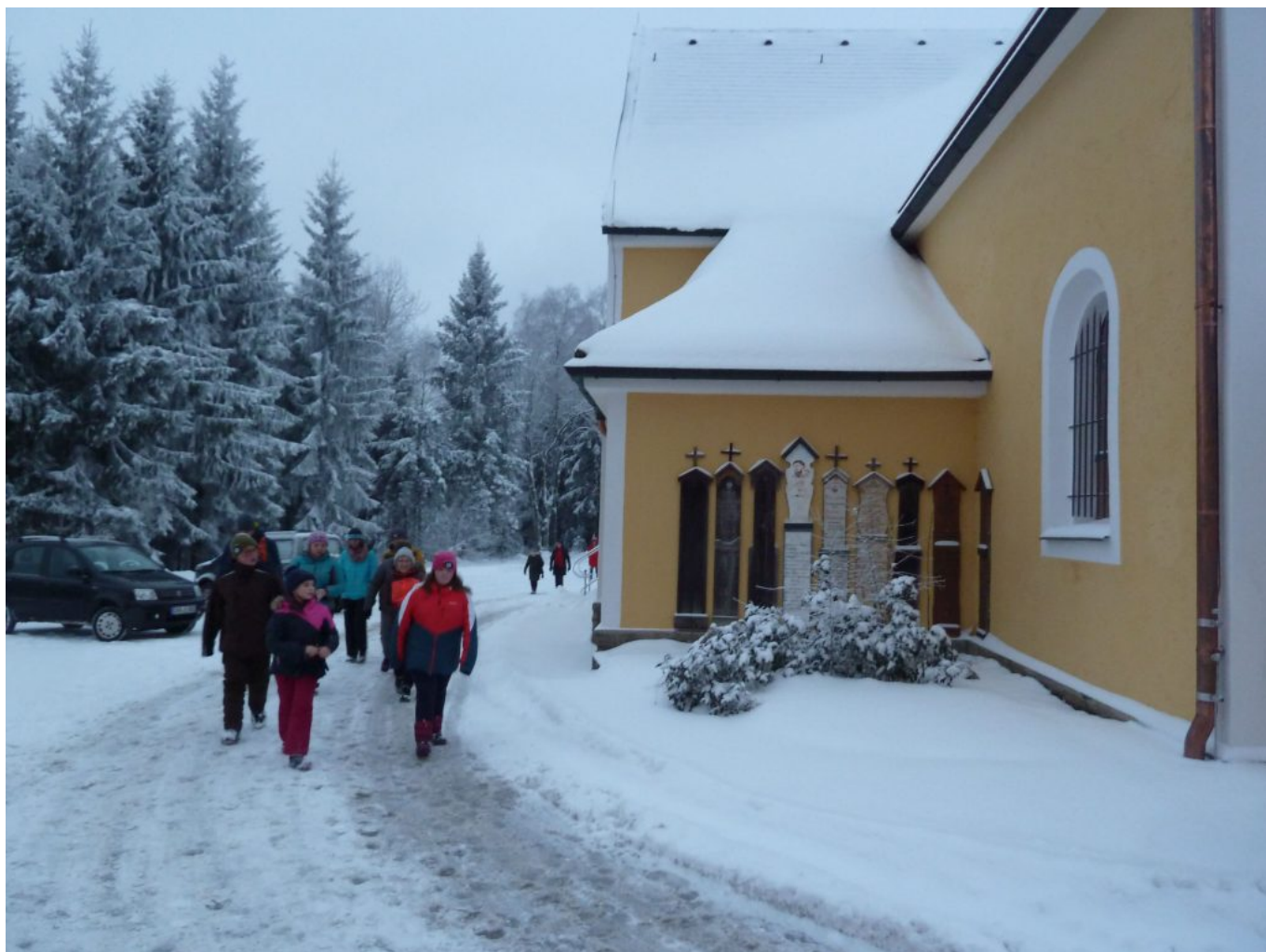
Die Hohenwarther Pfarrangehörigen kamen von Höllhöhe her betend an.