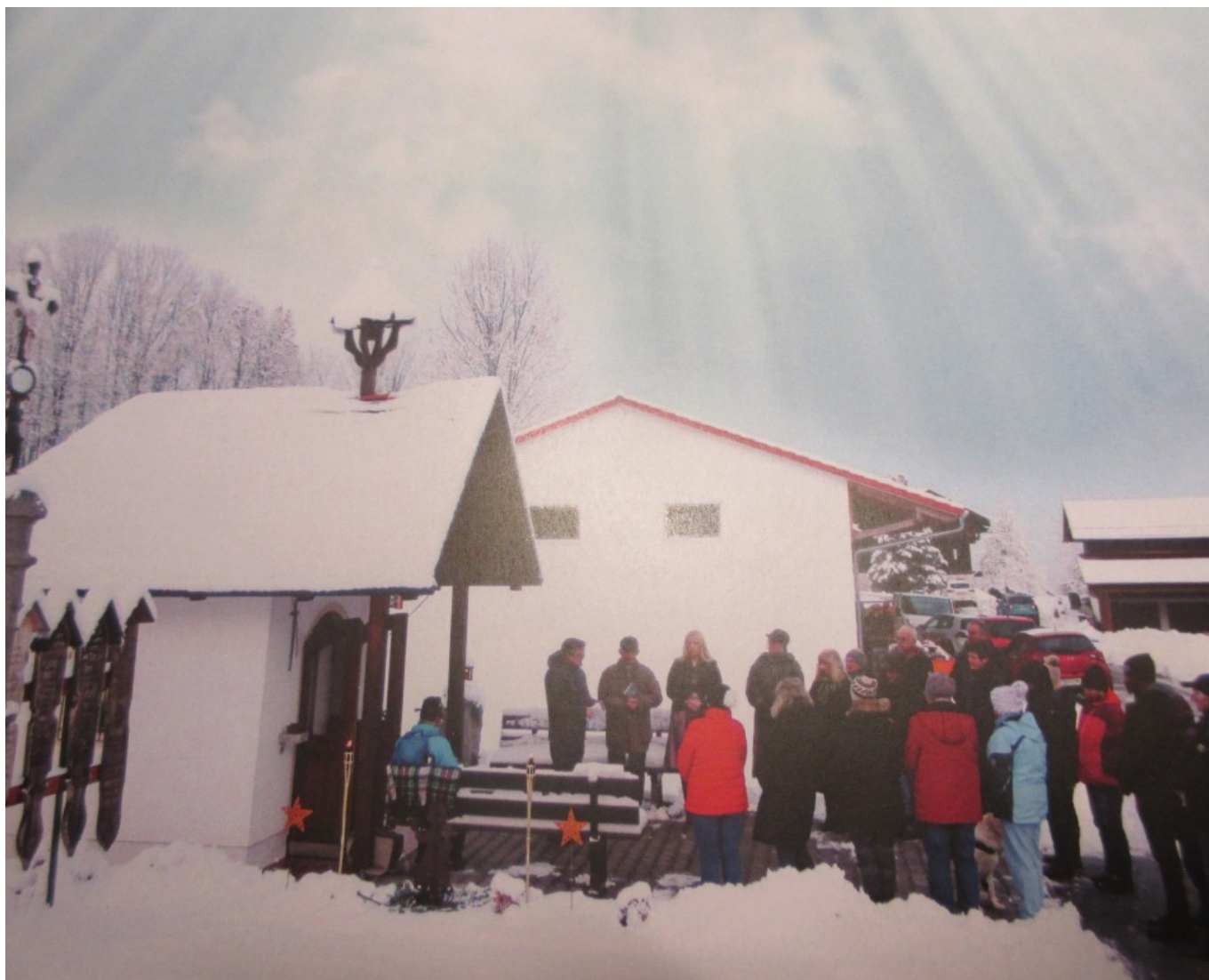
Winterliche Wolfgangs-Andacht am Einödweg auf der Berging-Kapelle