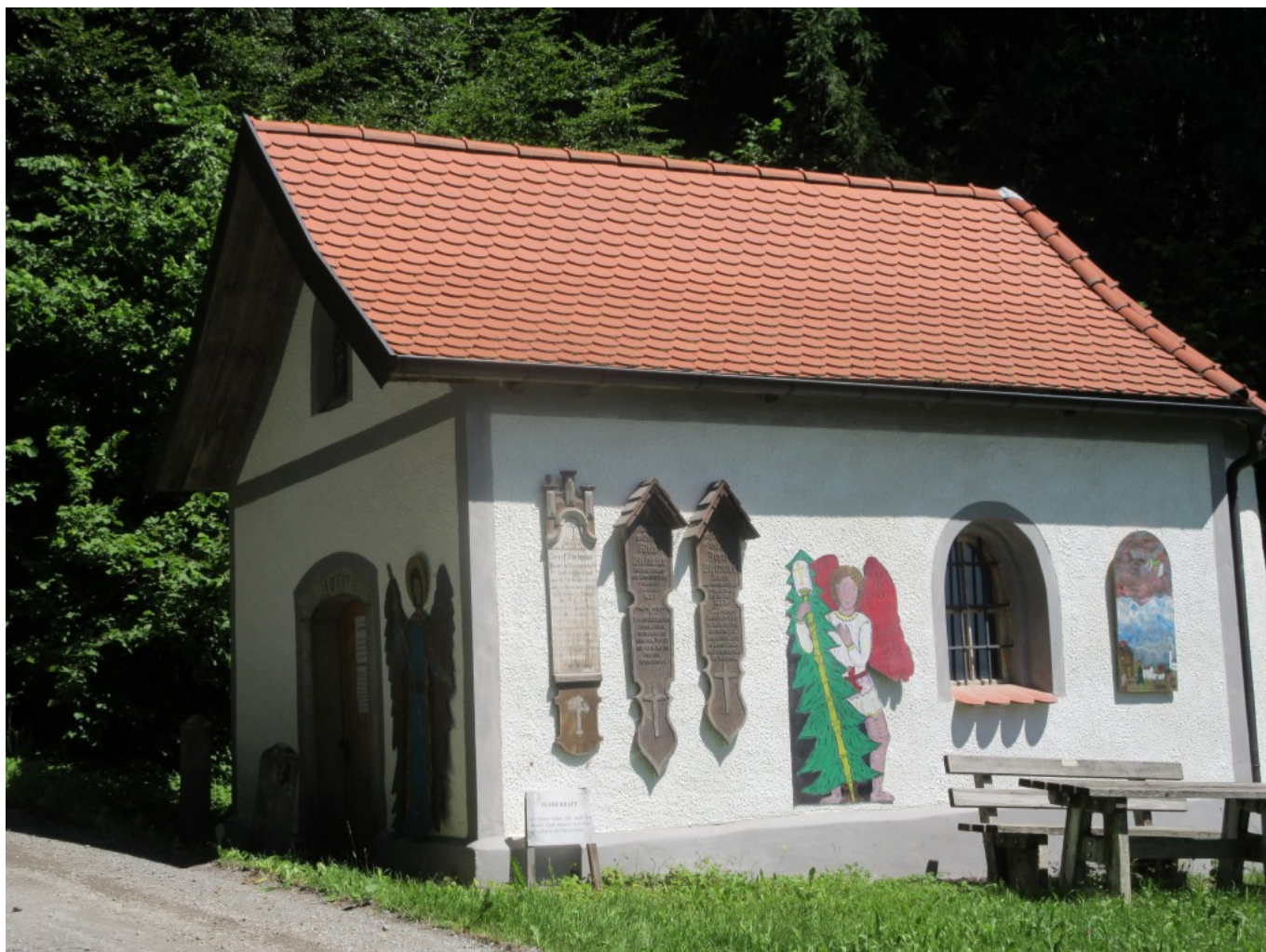
In frischem Glanz erstrahlt die Ramersdorfer Wald-Marienkapelle