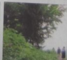
Ein guter Ausblick in die Zukunft.