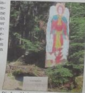
Die Engel bringen Segen für den Weg.