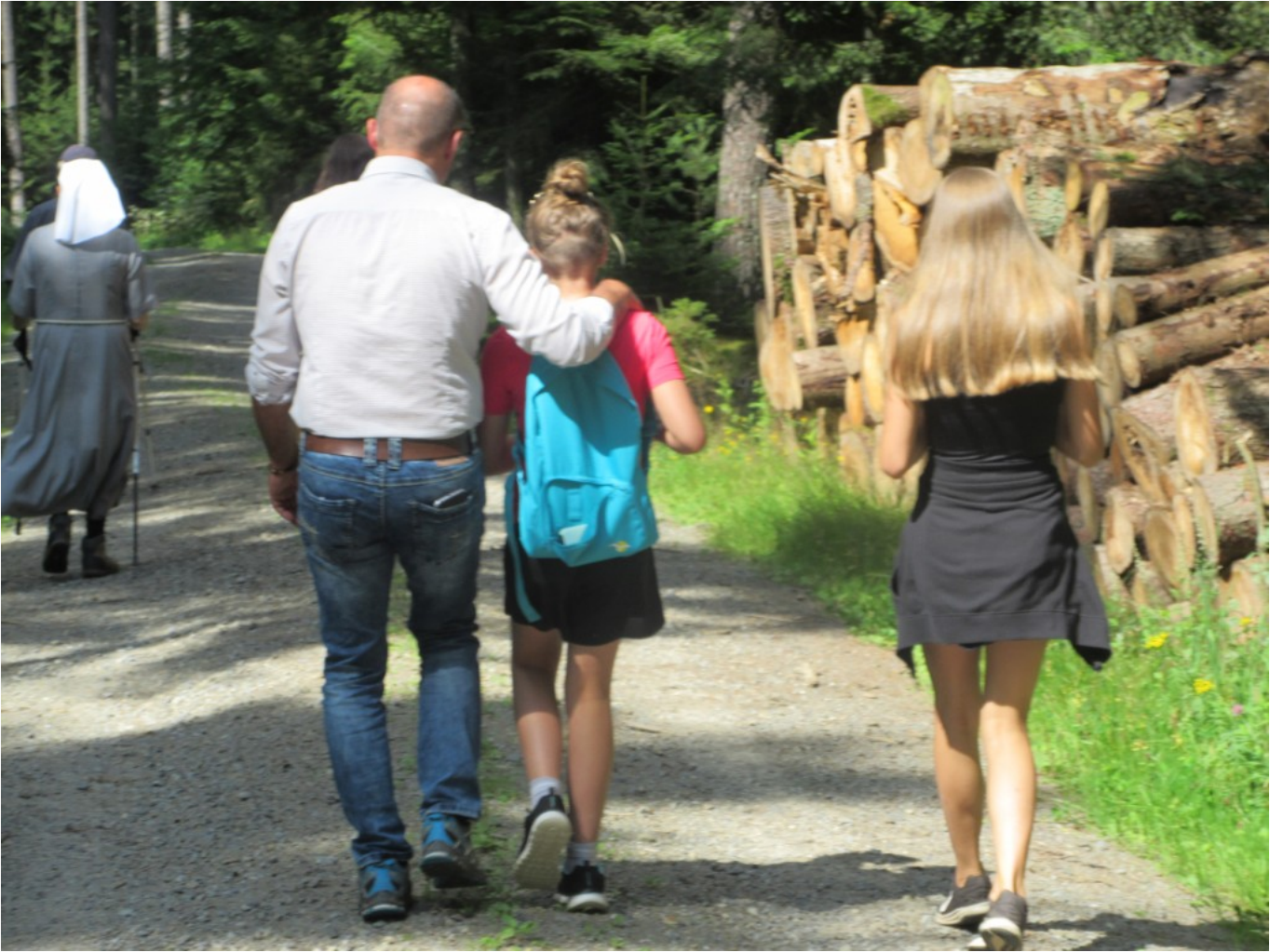
Und weiter geht die meditative Wanderung. Vater und Töchter am Weg –