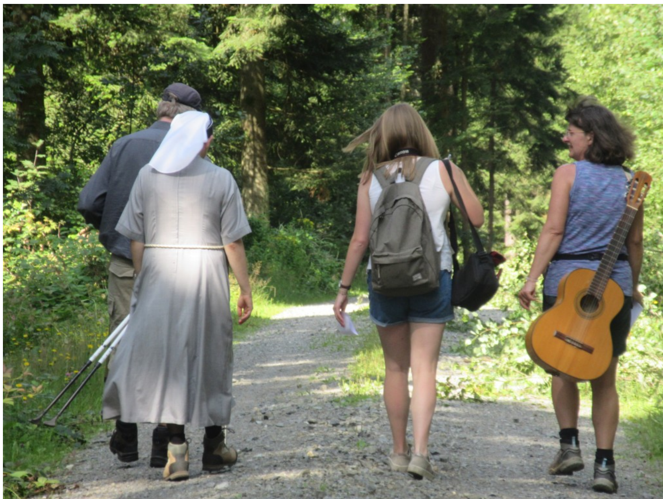
Unterwegs am Baumschutz-ENGEL-Pfad

Heute war eine spirituelle Andacht am Baumschutz-ENGEL-Pfad. Es gibt einige Aufnahmen hierzu. Auch die Presse war dabei. Es kommen noch mehr "Kostproben" – – –