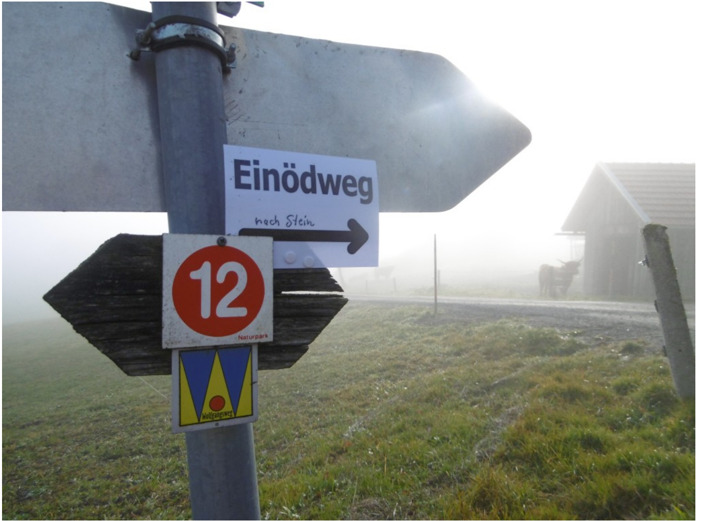
Bei Ramersdorf – durch den Nebel brechen