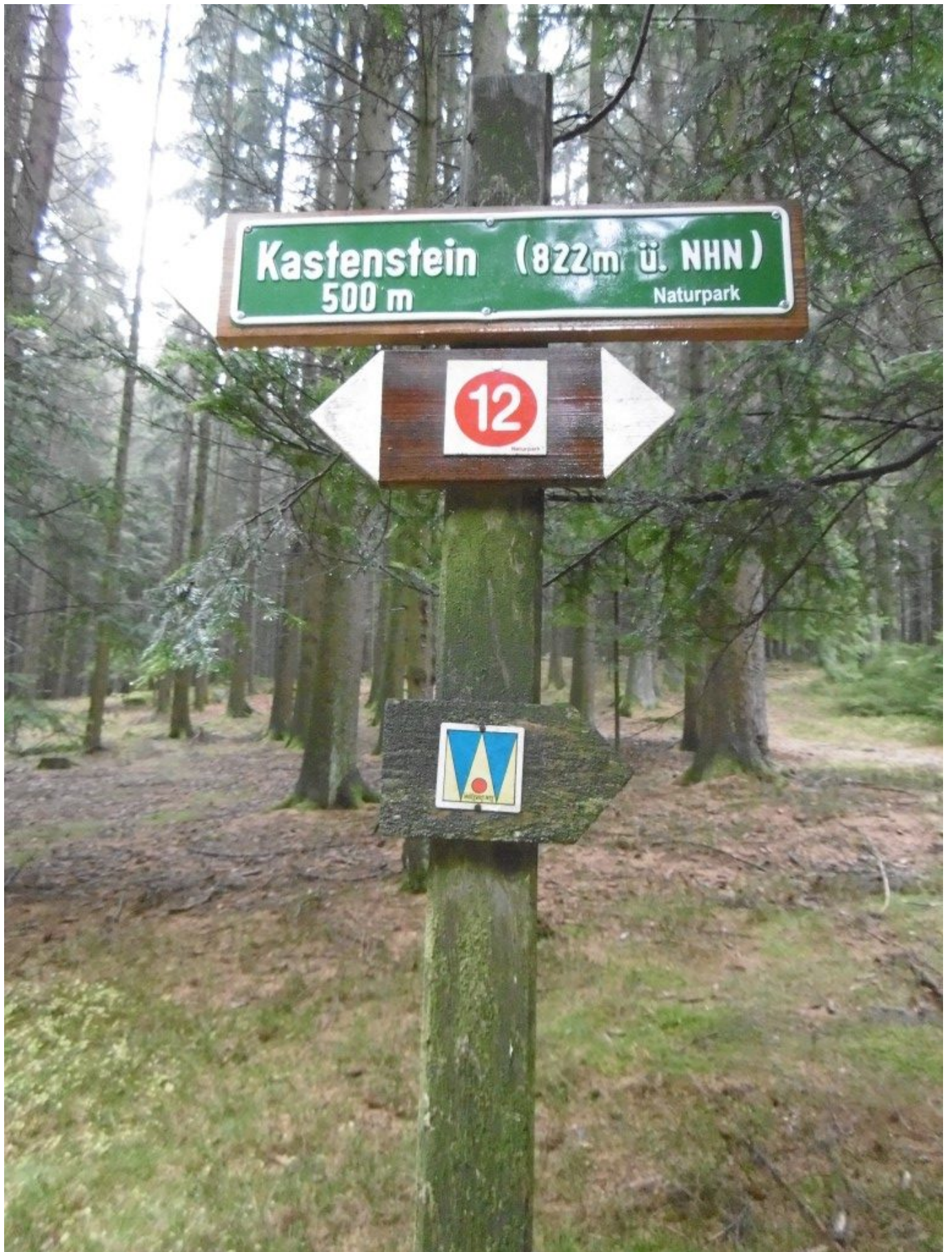
Zwischen Ramersdorf und Münchshöfen durch den Wald – in Richtung Pröller