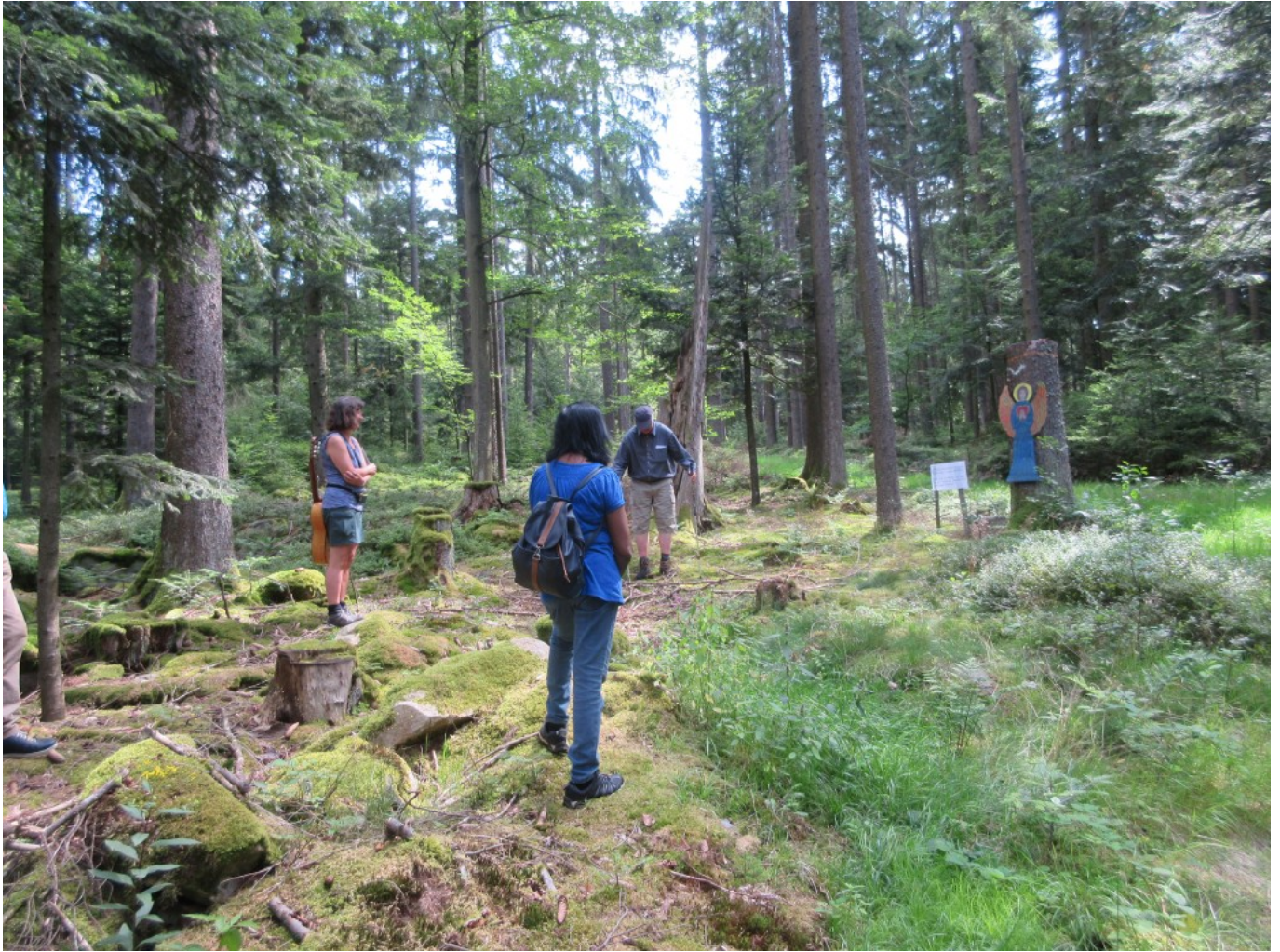
Bei der Waldstation "Gibt es Schutzengel?"

Ein nachhaltig gesunder Wald in der heutigen Zeit des Klimawandels