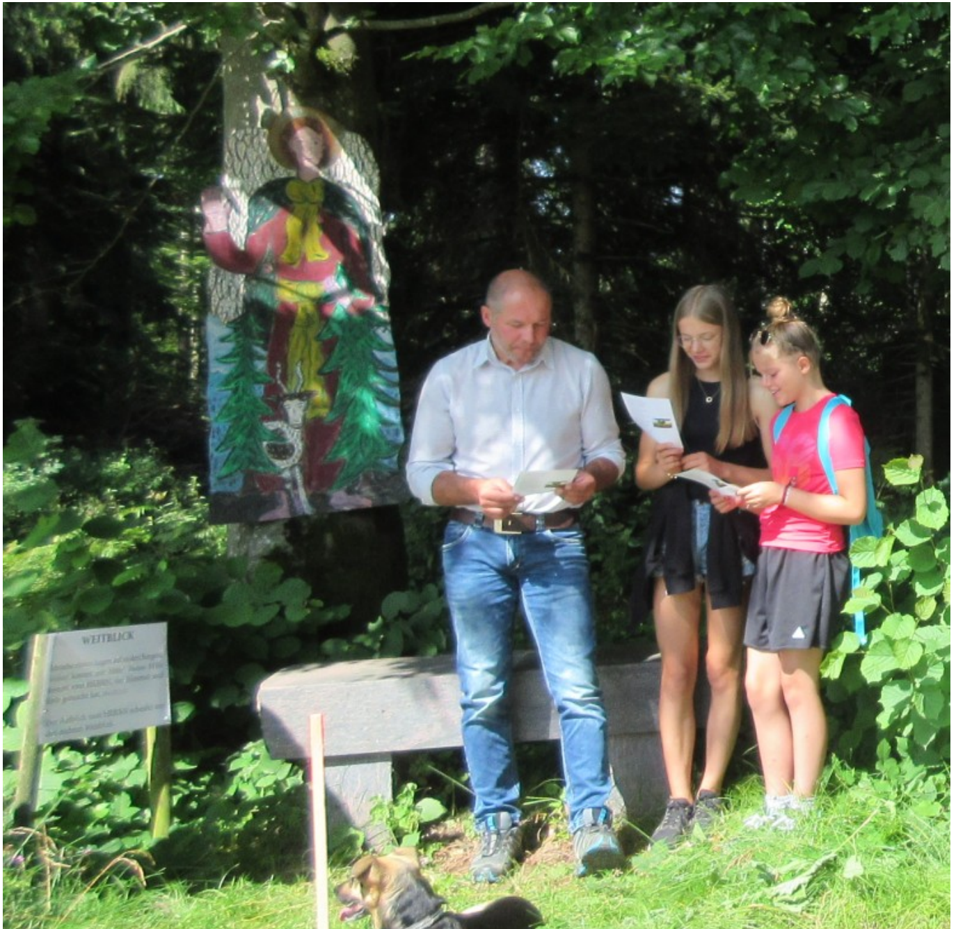
“Geh aus mein Herz und suche Freud” Liedstrophen von Paul Gerhard