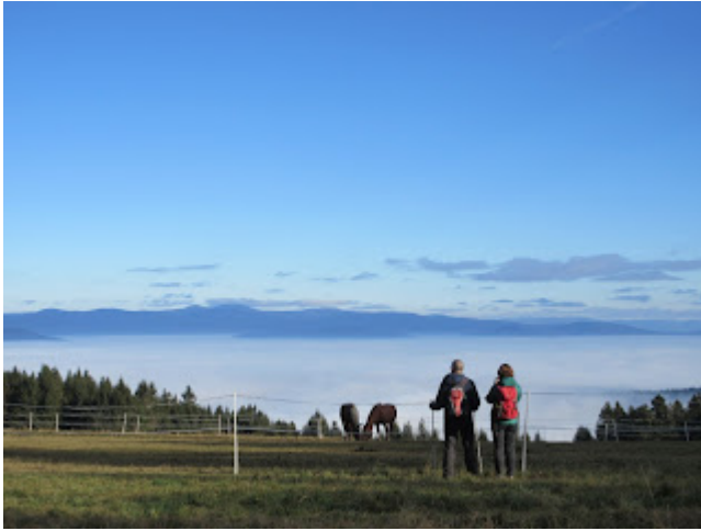
Aussicht übers Nebelmeer