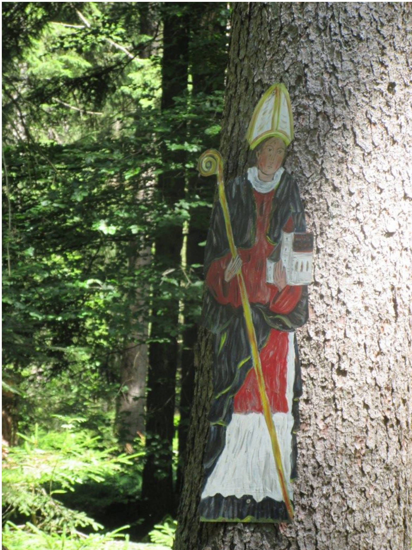
Der heilige Wolfgang durchzog vor über tausend Jahren den wilden Bayer- und Böhmerwald