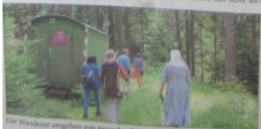
Die Wanderer umgeben von gesunden Bäumen: Hier fühlt man sich wohl.

Der Baumschutzengelweg ist nicht nur ein Appell an alle Waldbesitzer, sondern auch an die vielen Spaziergänger: Der Wald geht alle etwas an und mit sorgsamem Pflege und schützendem Umgang können wir noch lange die wundervollen Seiten der Natur genießen.