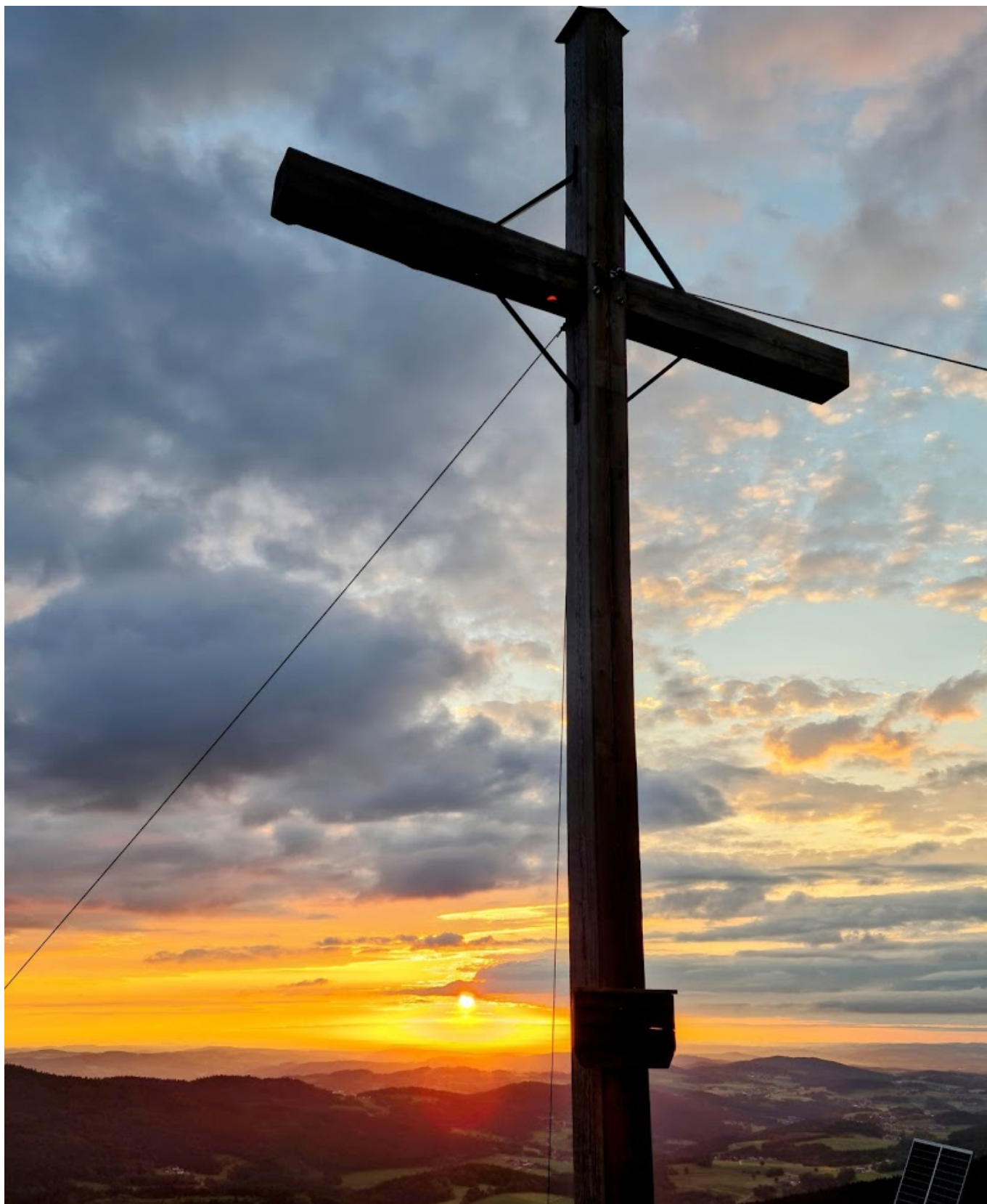
Gipfelkreuz auf der Käsplatte

Am vergangenen Mittwoch, den 7. Juli, lud die evangelische Kirchengemeinde im Rahmen ihrer "Sommerveranstaltungen" zu einer Abendandacht auf die Käsplatte bei Hinterviechtach ein. Der Mittelpunkt des Themas war "Sonnenuntergang – der Tag,