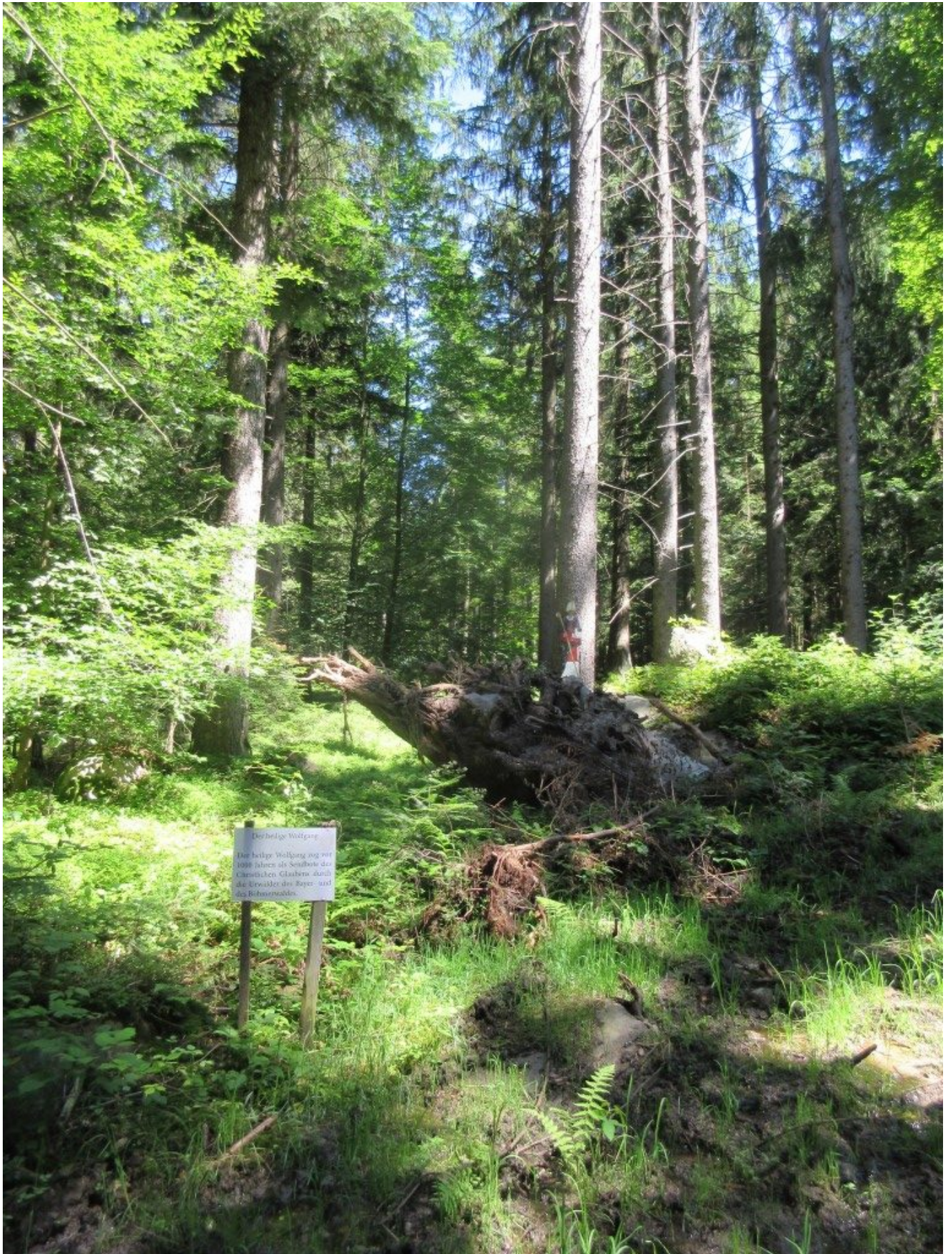
Da ist der heilige Wolfgang! Mit Impuls!