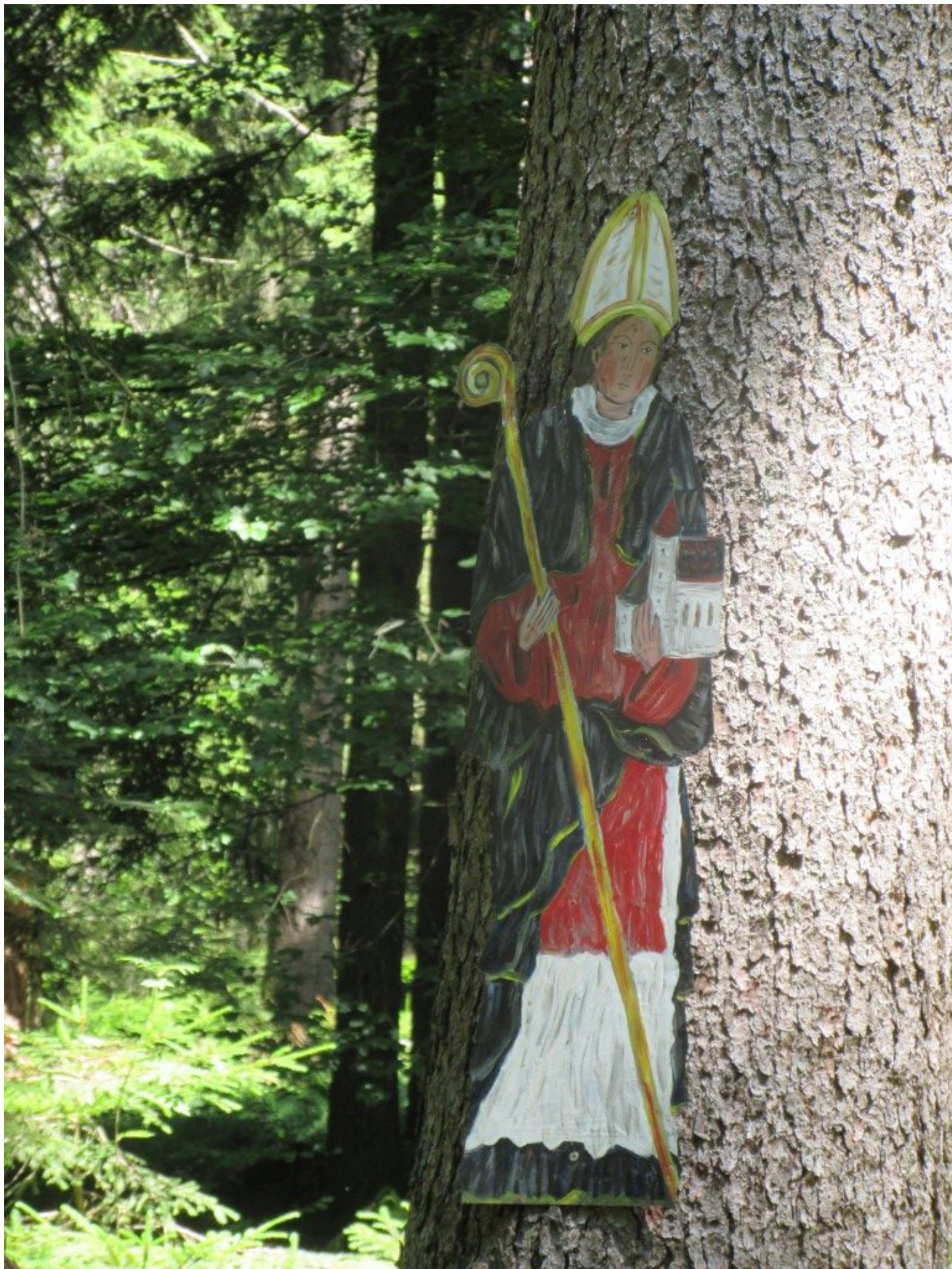
Vor 1000 Jahren zog Wolfgang durch den Bayerwald.