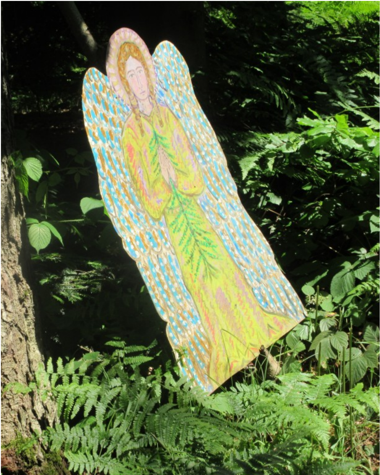
Der Baumschutzengel "Zukunft" ist in Schräglage geraten, steht aber sehr stabil.