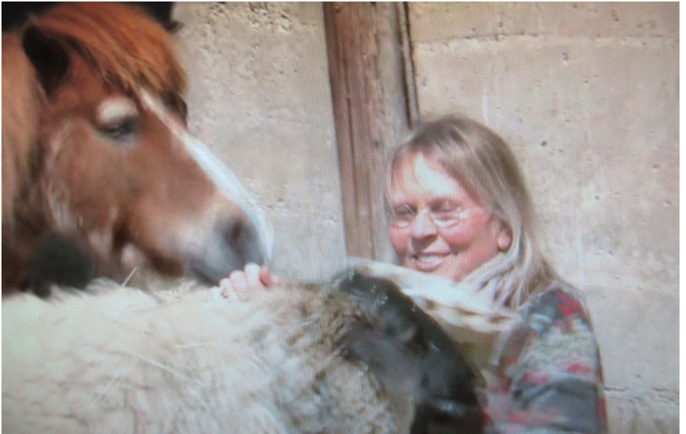
Inniges Verhältnis zu ihren Tieren – Foto: NiederbayernTV