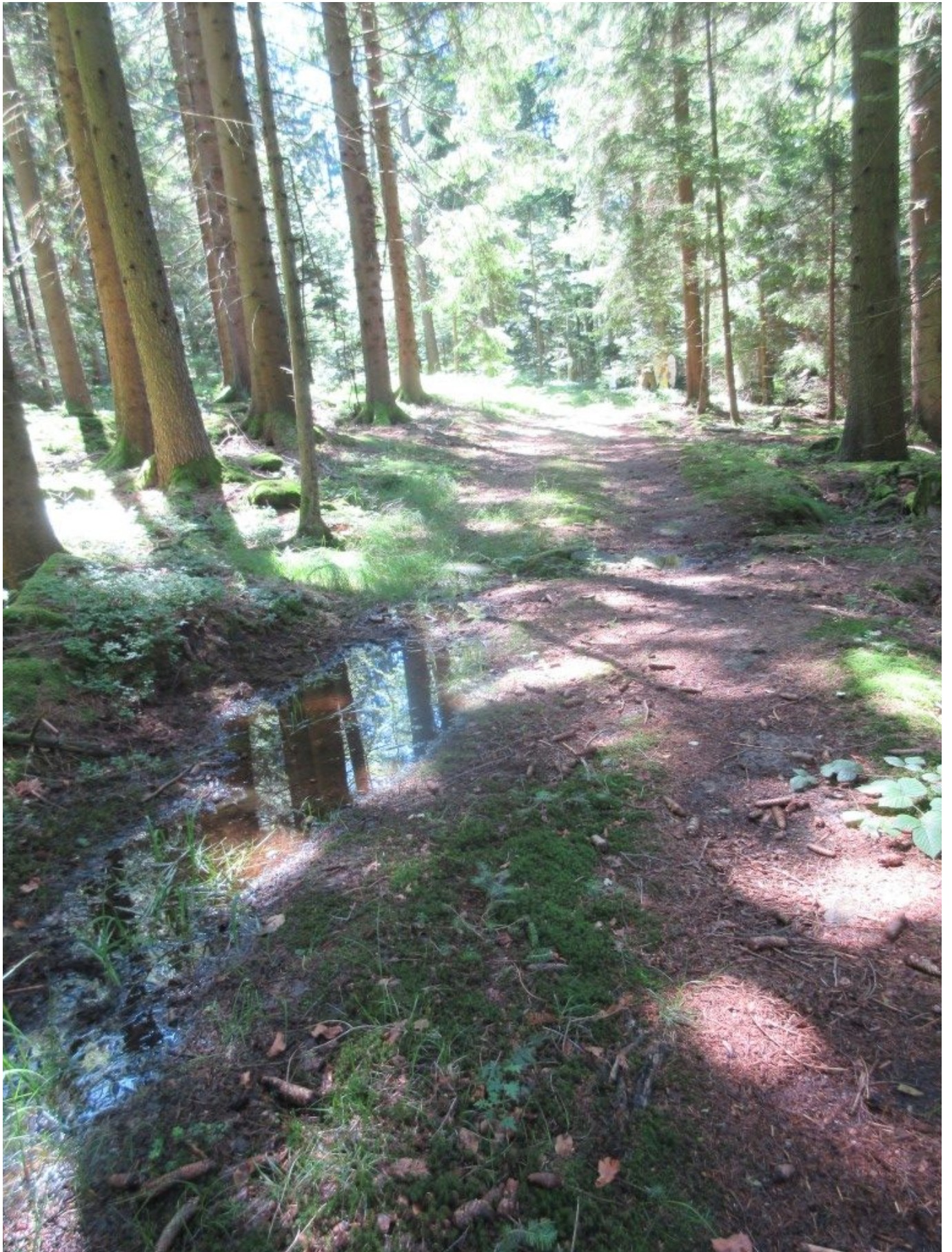
Dieser Wald ist ein Quellenursprung.