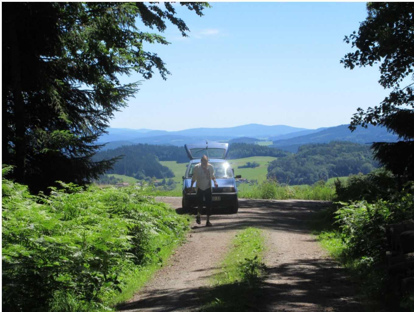
Elke Weber kommt nach Dorothea Stuffers "Bin wider da!"-Rufen ihr entgegen.