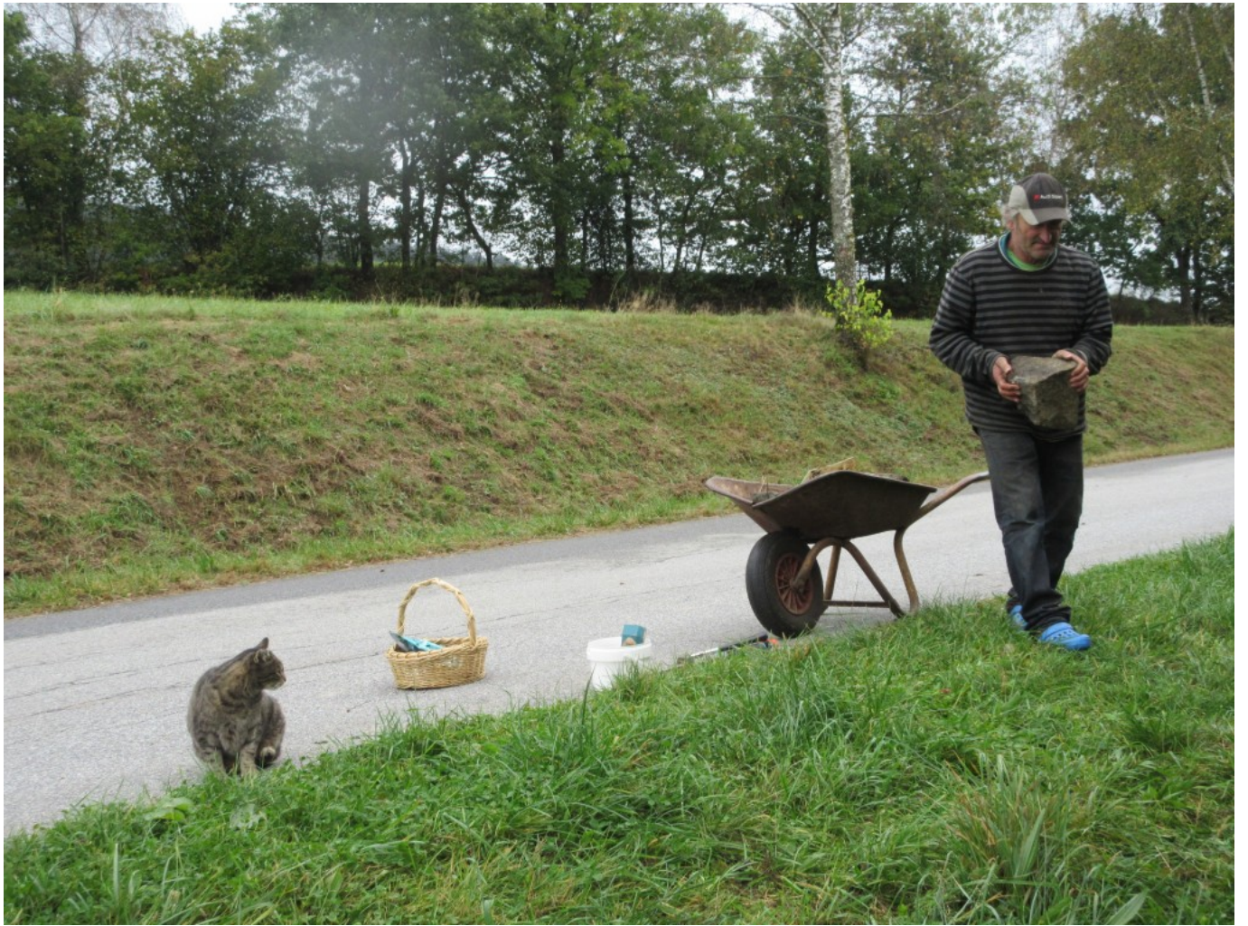
Kater Puma schaut wie immer zu.