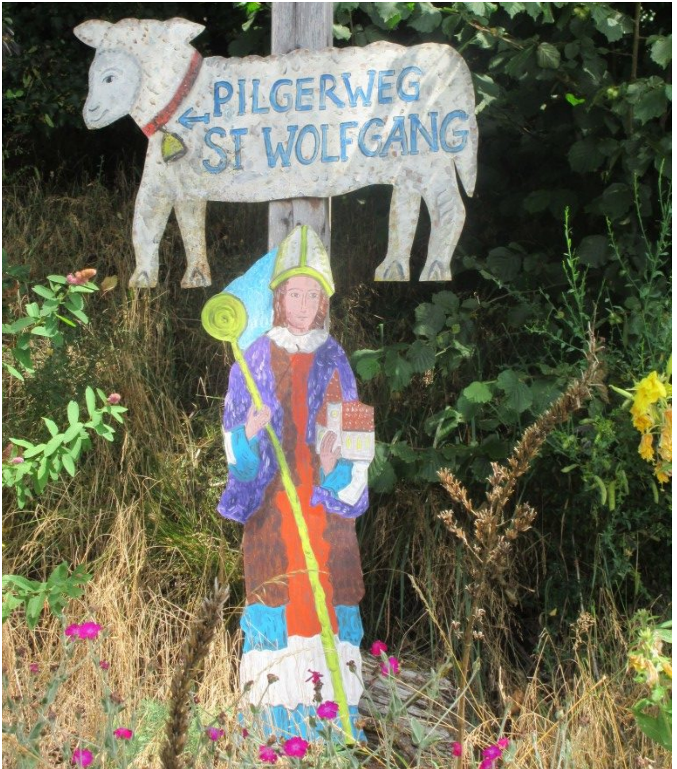
Wegmarkierung mit Blechschatz und Wolfgangsfigur bei Gstadt.