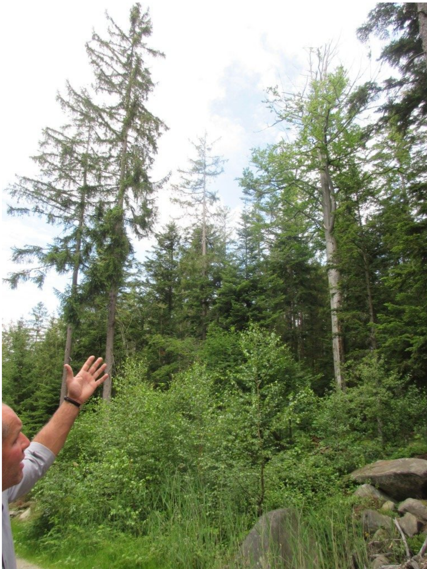
Hier sehen wir ein Buche, die bereits abstirbt. Ihre Rinde wird vom Schwarzspecht besucht. Auch befinden sich an ihrem