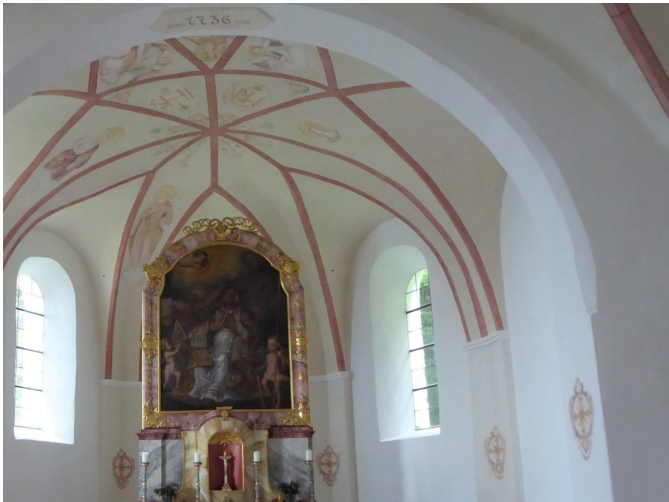
Mystische Wolfgangsdarstellung mit Engeln in der Schnappenkirche im Ciemgau.

Pilger Rudi Simeth berichtet aus seiner Chiemgau-Tour: “Gestern ist mir erst wieder bewusst geworden, dass im Altarbild der Schnappen Kirche eine wunderbare Wolfgangsdarstellung umgeben von Engeln ist.”