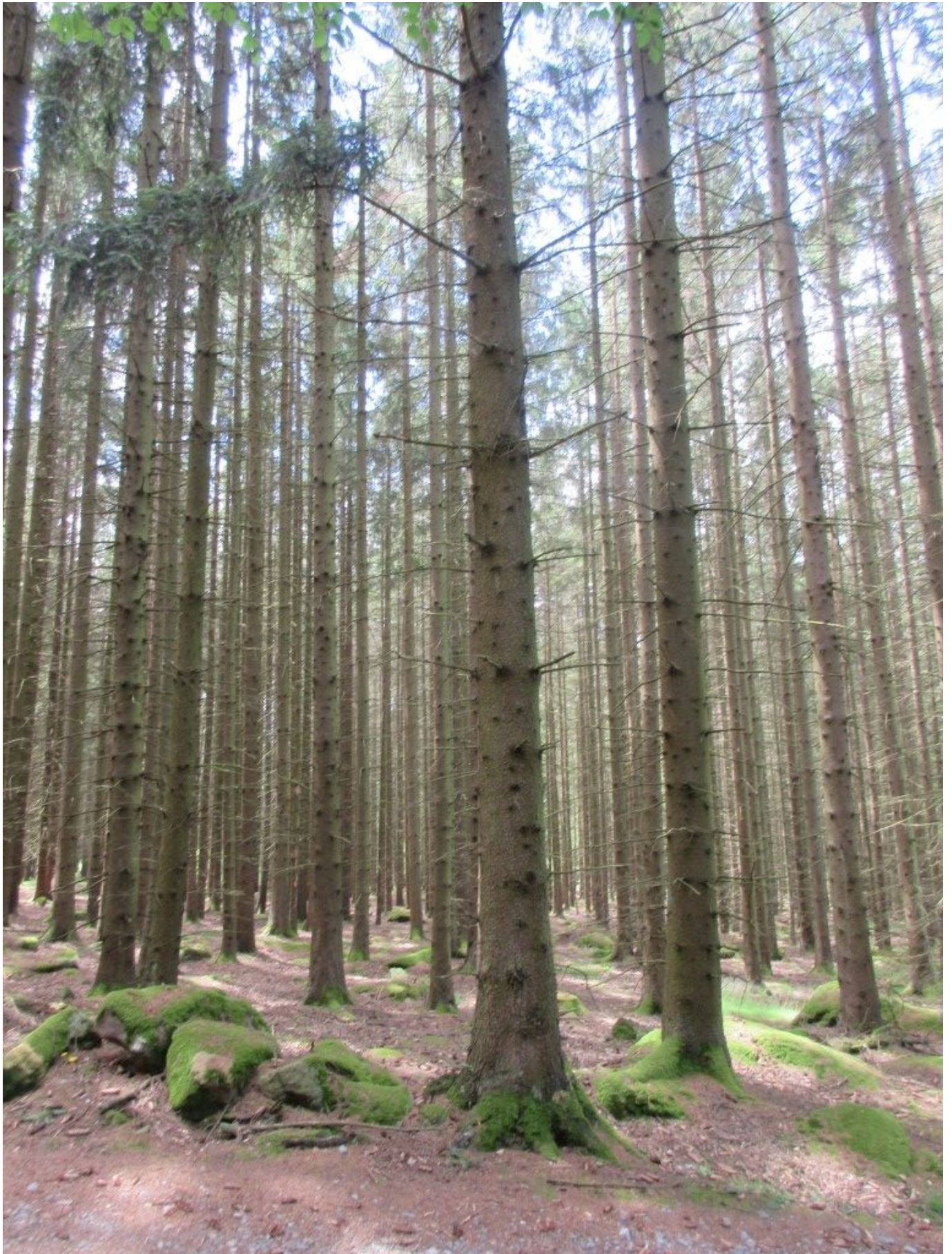
Fichten-Monokultur ohne natürlichen Jungwald im Unterholz: anfällig für Stürme und Borkenkäfer.