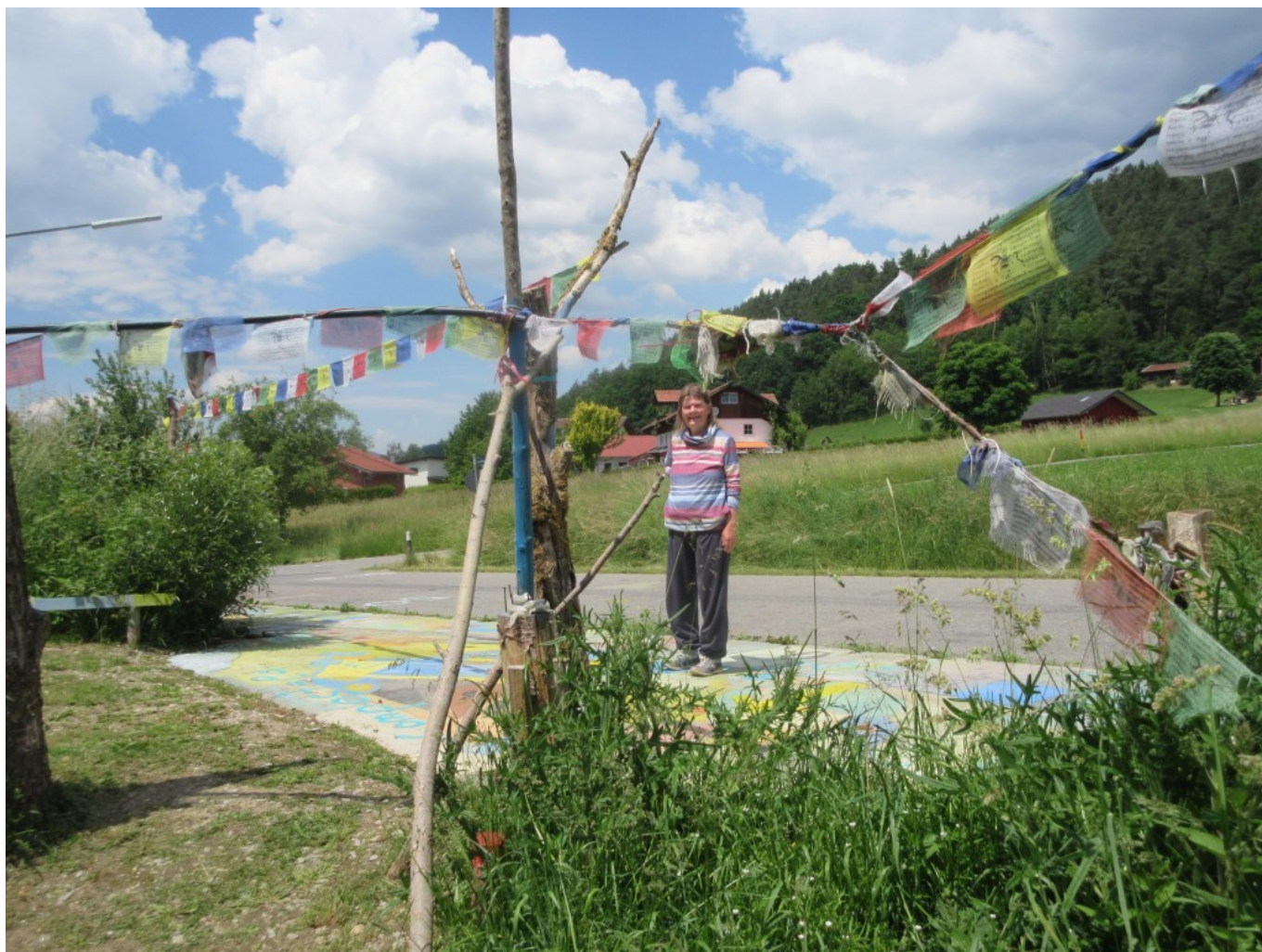
Zuschauerin Sylvia lächelt