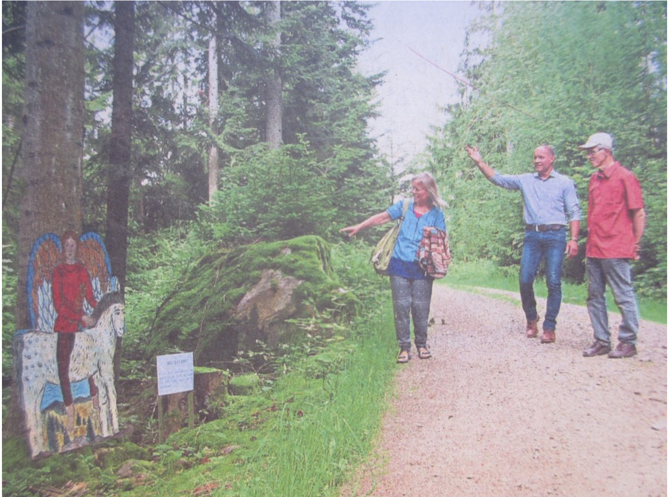
Das Team betrachtet den Baumschutzengel "Weites Land"