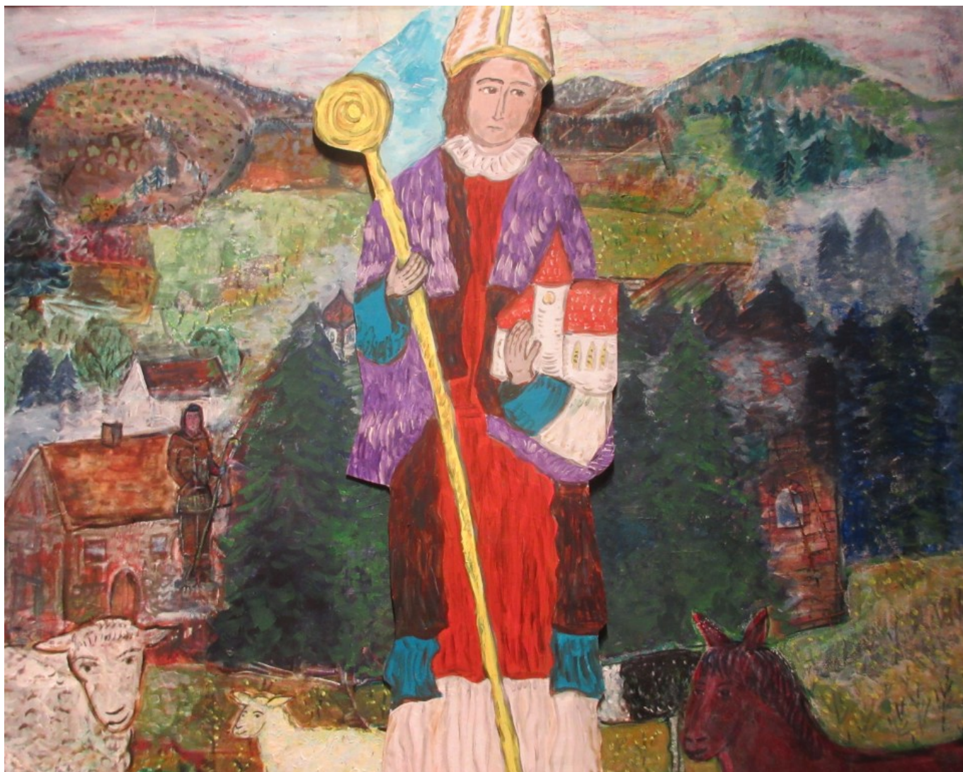
Die Wolfgangfigur steht segnend vor dem Gemälde "Johanniskraut". Alte Geschichten neu erzählen – – –

Auch Bäume brauchen Schutzengel – ein Bericht von Thomas Hobelsberger