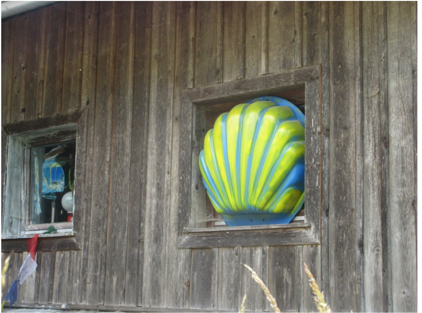
Eine seriell fabrizierte Badeplastikmuschel sitzt nun als bemalte Jakobsmuschel in einem der Fensterstöcke des alten Anwesens