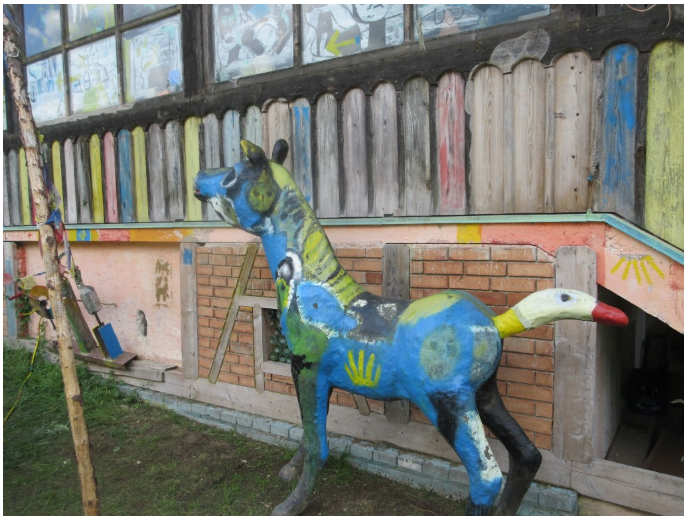
Bemaltes Pferd "Blauer Reiter". Man beachte den Schwanz als Gänsekopf!