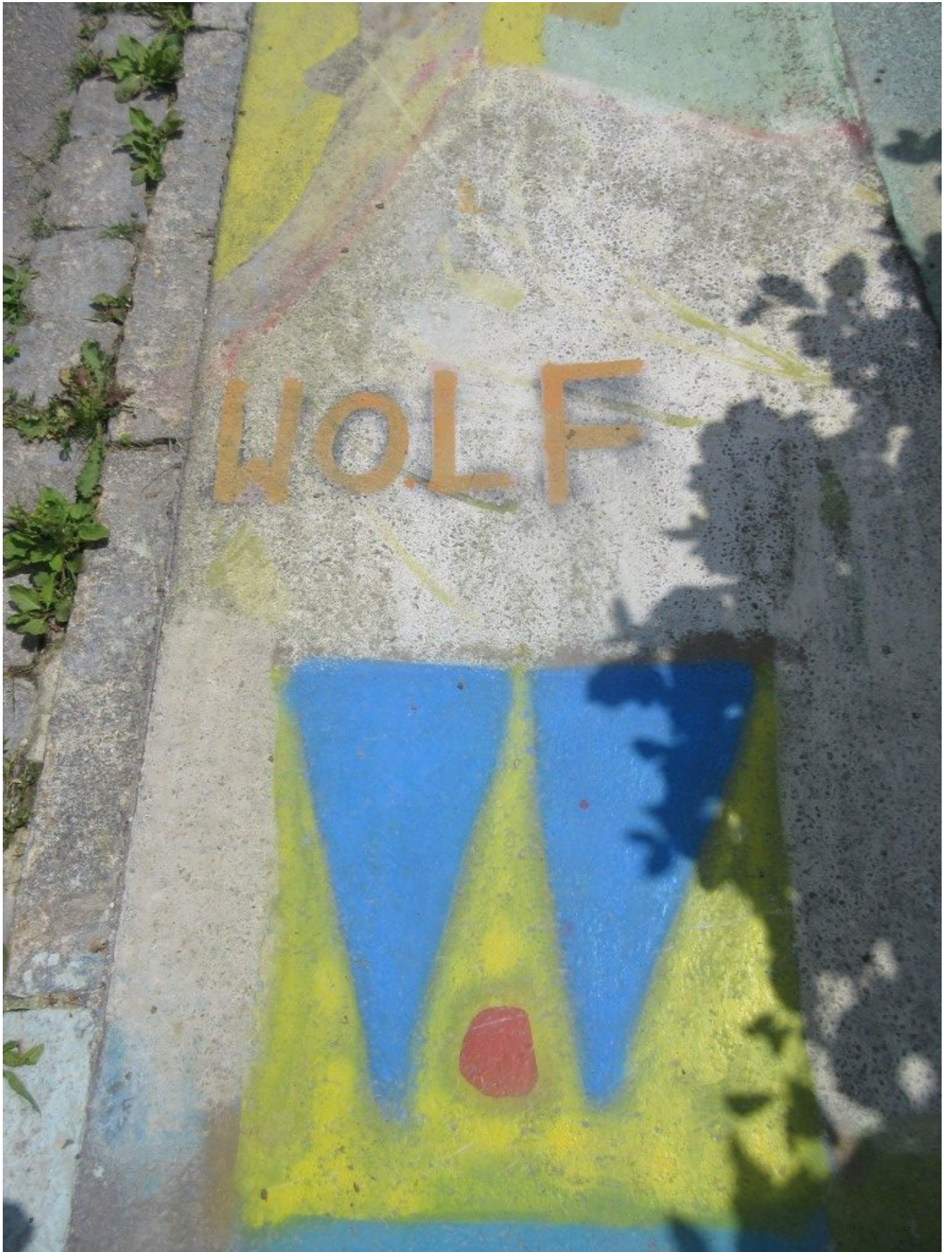
Das "W", Markierung von Wolfgangsweg