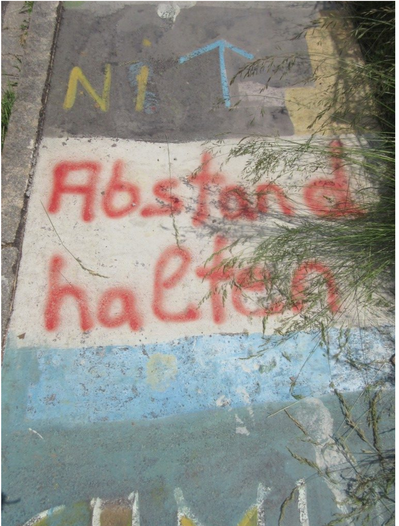
Straßenmalerei am Gehsteig: "Abstand halten" (s. Coronakrise)