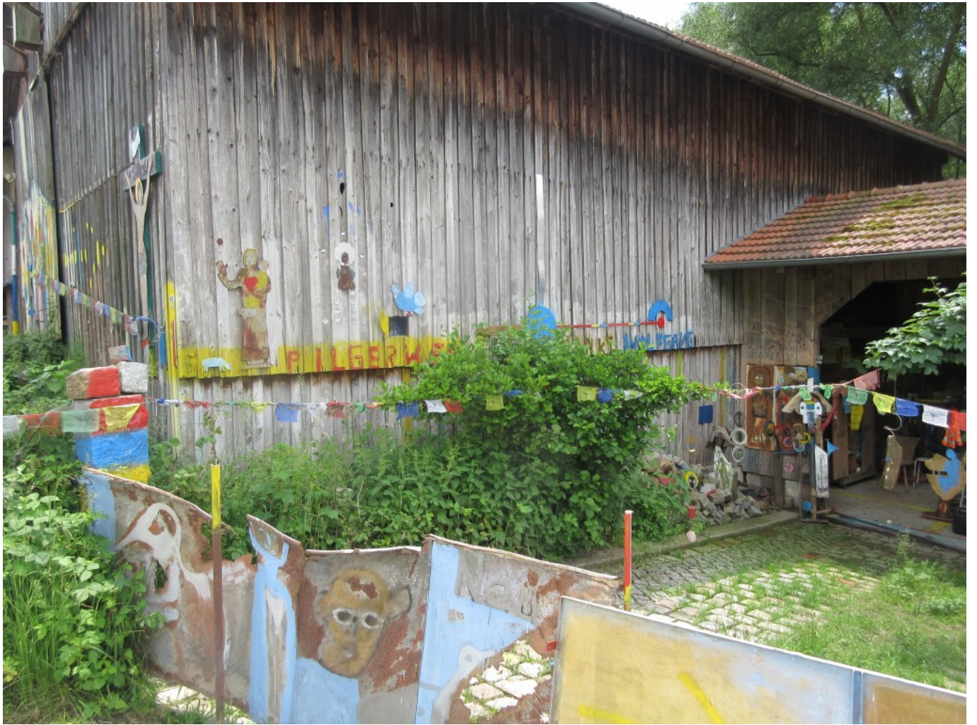
In bunten Metallbuchstaben lesen wir: "Pilgerweg St.Wolfgang"