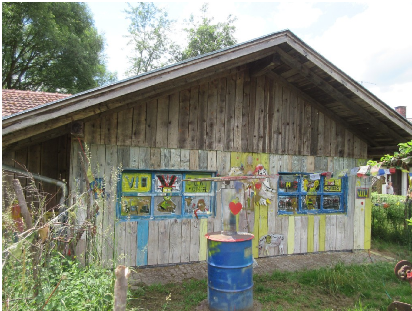
Ölfass als Dekoration und geheimnisvolle Fenster