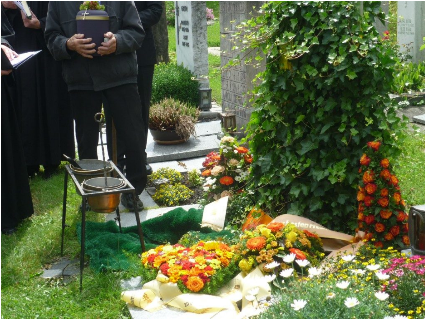
Am Grab – Urne und goldenes, feuriges Herz